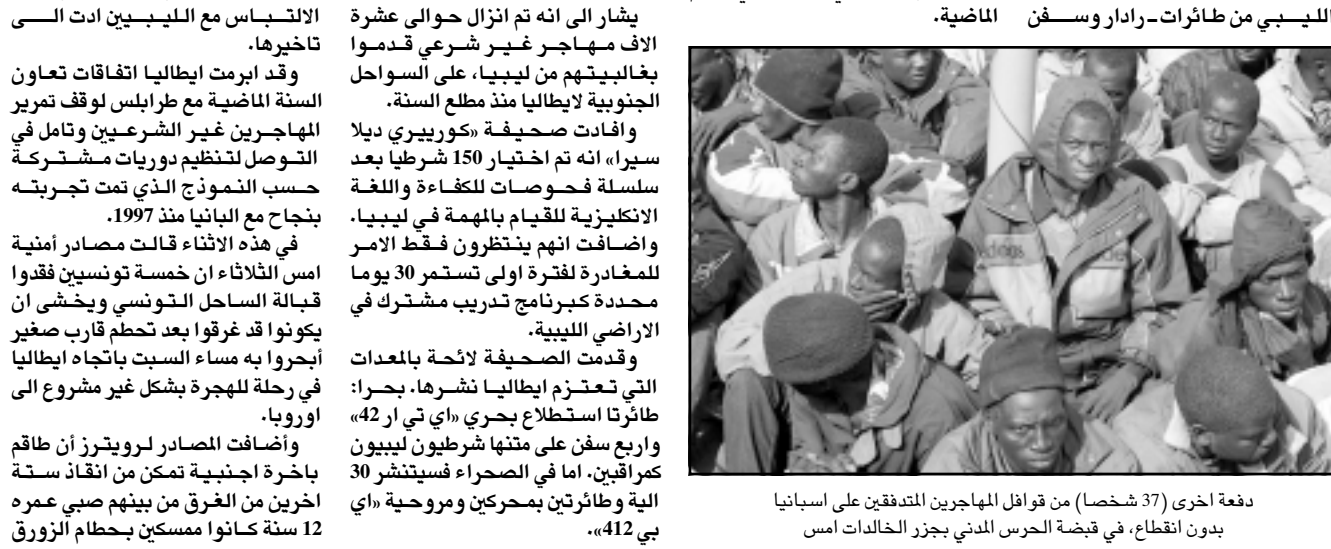
دفعه (37 شخصا) من قوافل المهاجرين المتدفقين على اسبانيا بدون اقطاع، في قبضة الحرس المدني بجزر الخالدات امس