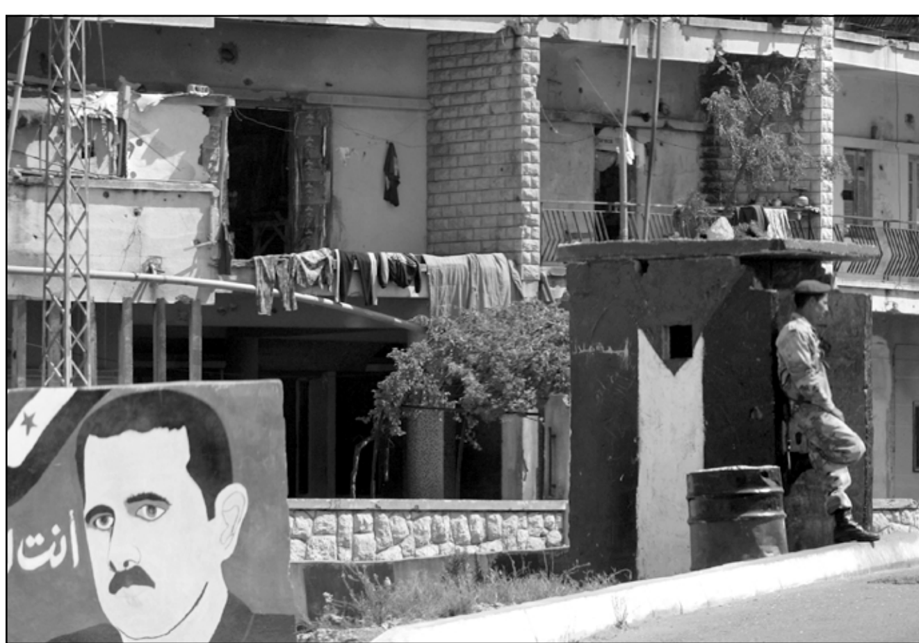
جندي سوري يحرس موقعا عسكريا وقد علق عليه صورة الرئيس بشار الاسد في بلدة عاليه اللبنانية امس

وهو مفهوم يرتكز عليه التنسيق والتعاون بين البلدين وسوف تجسده اتفاقات بينهما، في شتى المجالات، بما يحقق مصلحة البلدين الشقيقين في اطار سيادة واستقلال كل منهما». وفي هذا الاطار يرتبط لبنان بسورية منذ عام 1991 بمعاهدة للاحوة والتعاون والتنسيق. «استنادا الى ذلك، ولان تثبيت قواعد الامن يوفر المناخ المطلوب لتنمية هذه الروابط المميزة، فانه يقتضي عدم جعل لبنان مصدراً تهديداً لامن سورية وسورية لامن لبنان في اي حال من الاحوال، وعليه فان لبنان لا يسمح بان يكون ممراً او مستقراً لاي قوة او دولة او تنظيم يستهدف المصالح الساس بأمنه او امن سورية، وان سورية الحريصة على امن لبنان واستقلاله وحدته ووفاء ابائنا لا تسمح باي عمل يهدد أمنه وسيادته واستقلاله». وتنظيم يستهدف المصالح الساس بأمنه او امن سورية، وان سورية الحريصة على امن لبنان واستقلاله وحدته ووفاء ابائنا لا تسمح باي عمل يهدد أمنه وسيادته واستقلاله». وتنظيم يستهدف المصالح الساس بأمنه او امن سورية، وان سورية الحريصة على امن لبنان واستقلاله وحدته ووفاء ابائنا لا تسمح باي عمل يهدد أمنه وسيادته واستقلاله».