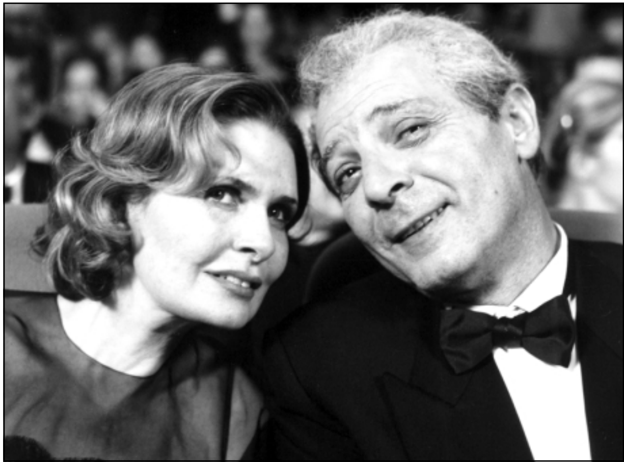
محمود حميدة ويسرا في لقطة من فيلم «اسكندرية نيويورك»