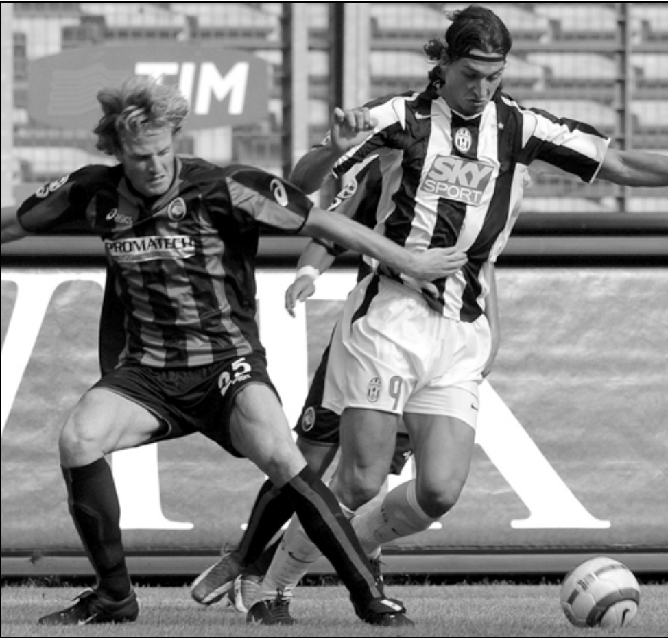
لقطة من إحدى مباريات نادي يوفنتوس