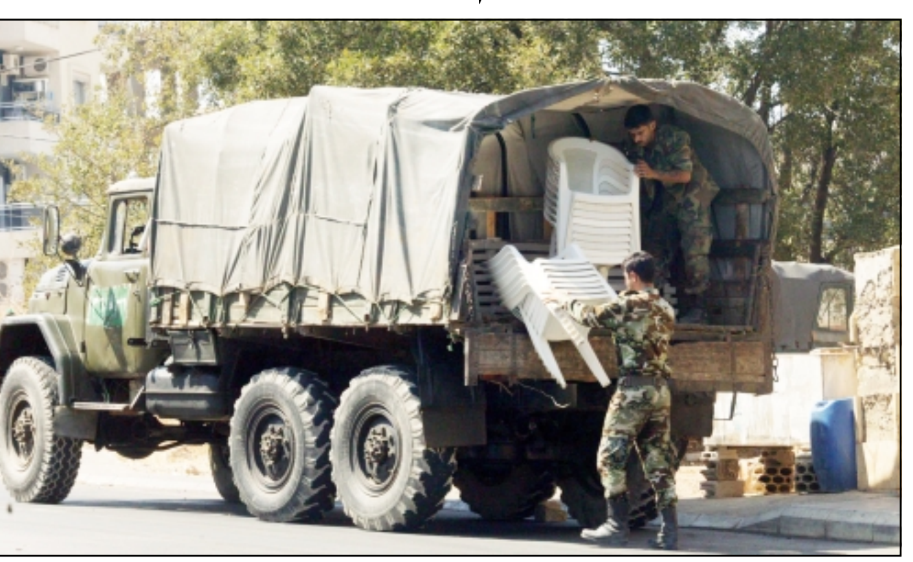
جندي سوري يخلي موقعا جنوب بيروت امس في اطار عملية إعادة الانتشار

البنتاغون في دمشق رومان والناطق باسم قوات الائتلاف سابقا في بغداد الجنرال مارك كيميت. وأشارت التقارير الى ان هذه الزيارة تعكس «رغبة الولايات المتحدة في توسيع التعاون على الحدود العراقية السورية»، بحسب ما نقلت النهار عن ناطق باسم البنتاغون. من جهة ثانية، ذكرت صحيفة «النهار» اللبنانية ان واشنطن سلمت دمشق «قبل أيام» مجموعة من الصور يظهر فيها عدد من قادة حزب البعث العراقي السابق صدام حسين، وكذا وزير الدفاع اللبناني اميل لحود في الصفوف الامامية في بيروت، او في منطقة الروشة، او في مطامع بلدة بولدان السورية». وضم هذا «الايوم» صوراً «للبيوت في المناطق التي تنتشر فيها القوات السورية في لبنان تقيم فيها شخصيات عراقية تنظر اليها واشتغل على انها قوات لإرسال الدعم المالي الى المتمردين في العراق وتأمين وصول السلاح والمتفجرات والمعلومات «الهيمة». وتعليقا على عملية إعادة الانتشار السوري الجري هذه أكد وزير الدفاع اللبناني محمود حمود لحظة تقريرون لبنان الرسمية ان «الآخيرة (إعادة الانتشار) تكون عندما نتأكد من حل عملية السلام في الشرق الاوسط والنزاع العربي-الاسرائيلي وتوصل