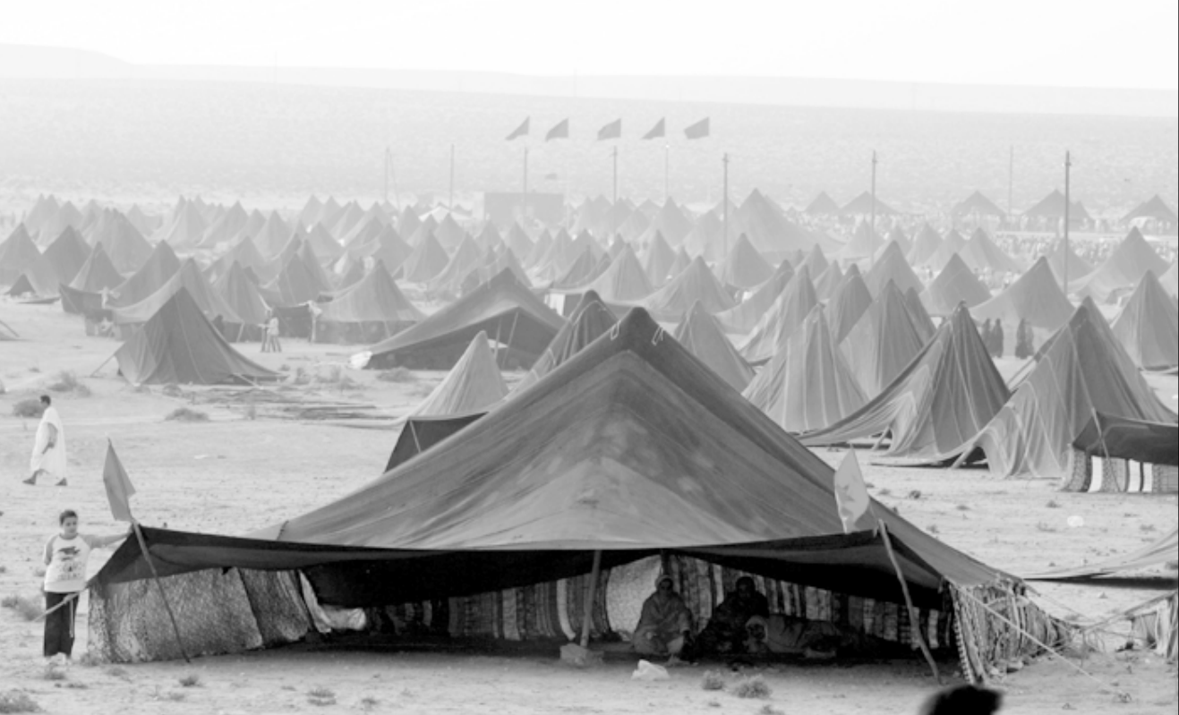
خيم نصهار رجال قبائل بمنطقة طان طان بوسط المغرب ضمن المهرجان التقليدي المسمى «الموسم» الذي يقام سنويا منذ زمن طويل لكنه توقف خلال العقود الثلاثة الاخيرة. وبمبادرة من منظمة الثقافة والعلوم (يونسكو) أعيد احياء «الموسم» هذا العام وبدأت فعالياته الاسبوع الماضي

وهذه هي المرة الاولى التي تامر فيها بريطانيا باطلاق سراح معتقل محتجز في ظل قانون الشكشبه الارهاب والجرمة والامن ولم يقدم بلاتكيت تفسيروا للاعلان المفاجئ».