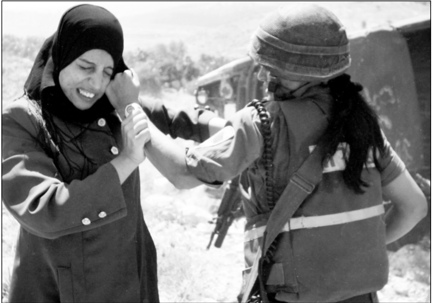
مجندة اسرائيلية تعدي بالهزب على فتاة فلسطينية كانت تشارك في الاحتجاج على بناء الجدار العازل على اراضي بلدة بدرس امس

في موعد غير محدد في العام 2004، زعمت النيابة الاسرائيلية، انه جرى تعارف بواسطة الانترنت في متهم رقم 4 ومتهم رقم 6، وبعد ان تعرف متهم رقم 4 على اعضاء المجموعة انضم الى التنظيم المذكور. المتهمون وخلال الاشهر حزينان وحتى اب من العام الجاري، وخلال تواجدهم في مصر، خططوا لتنفيذ عمليات في اسرائيل، اي ان يتسللوا وهم مسلحون من مصر الى