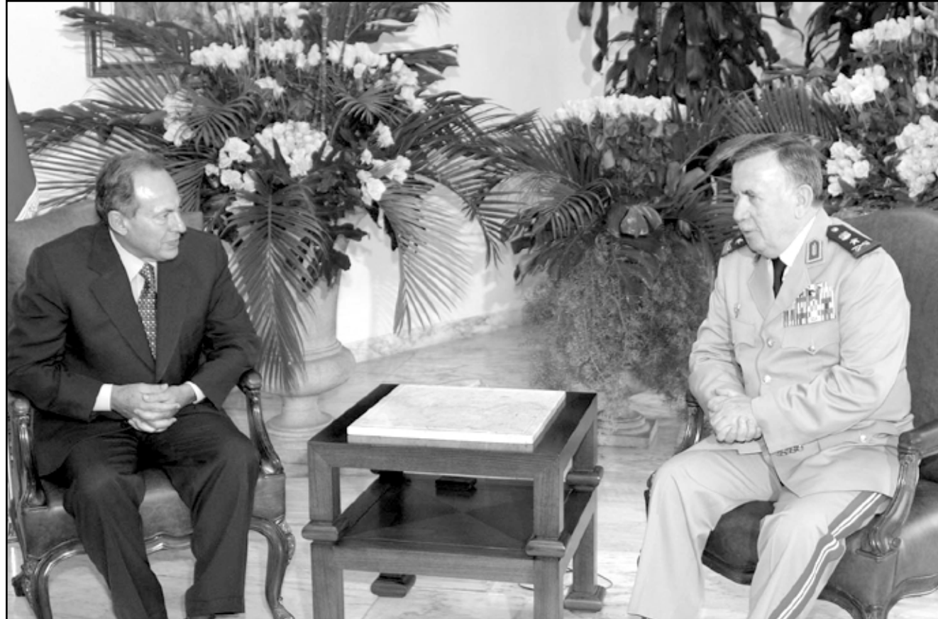
الرئيس اللبناني اميل لحود لدى اجتماعه بوزير الدفاع السوري العماد حسن توركمان في قصر بعبدا امس (ف ب)