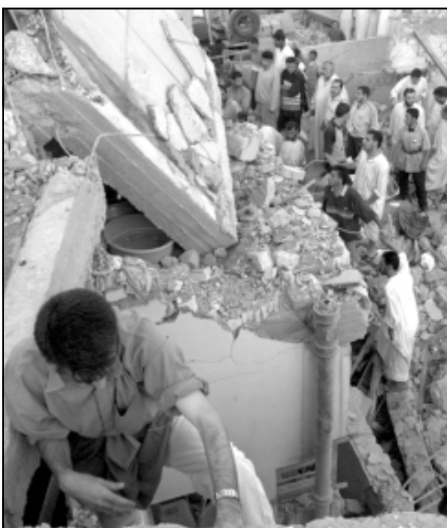
اثر الدمار الذي خلفه صفت الطائرات الامريكية للفلوجة امس

ساراء (العراق) - من صباح البازي: قصصت أرتال منها وسط المدينة فوزعوا قنصتهم على اسطح مراكز الشرطة والكهرباء والماء والاتصالات قطعت عن وحش السنشوي ومازن الاسجد لتعلن المسلمين الذين لم يقاتلوا اصلا. ويخرج علينا تقبيل الرتدين الذي يدعي انه سامرائي وقد تهرب منه سامراء منذ زمن انه لاتقتل بين المدنيين كما زعموا. وما في بانتصار زائف». وقال رسالته ابو قتيبة «دخلت ارتال اخرى تقصد المواقع التي يلتقونهم فيها وجواسيسهم بتواجد المجاهدين فيها