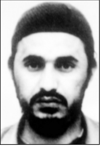
ابو مصعب الزرقاوي

مخابئ تابعة لابو مصعب الزرقاوي، مع ان صور الصحاحيا اظهرت شهداء عراقيين من الاطفال والنساء، ويرى رجال استخبارات ان عمليات القصف الجوي، مثال واضح عن اعتماد الادارة على الصور الجوية، بدلا من المعلومات التي يجمعها جواسيس، ومع ان ادارة بوش والحكومة البريطانية اخطأتا في تقدير الخطر العراقي عندما لم يتم العثور على اسلحة دمار شامل، الا ان كلا من واشنطن ولندن، لا تزالان تستمسكان بان العراق اصبح الجبهة الاولى في الحرب الدولية على الارهاب، مع ان العراق لا يمكن في المعادلة اصلا. وكانت الادارة الامريكية وبعد تصاعد المقاومة قد حاولت التلصص على فترة الحرب الاهلية، حيث قالت انها اكتشفت ملقا على الفرد كيميوتير، يظهر مرسلته بين لندن والزرقاوي، والذي وعد فيها باسعال حرب بين السنة والشعب في العراق، واتخذ بوش من الرسالة دليلا على الرابطة بين الزرقاوي (العراق وبين لندن) والجماعات التي تديرها، ويشكو عملاء الاستخبارات عن عدم استجابة القيادة السياسية او العسكرية لتقاريرهم او تقديراتهم، حيث يقولون ان البنتاغون، وزارة الدفاع الامريكية، تعتمد أكثر على الصور الفضائية، وصور الاقمار الصناعية، ولا تأخذ بعين الاعتبار التقارير التي يجمعها مخبرون وعملاء «سي اي ايه».