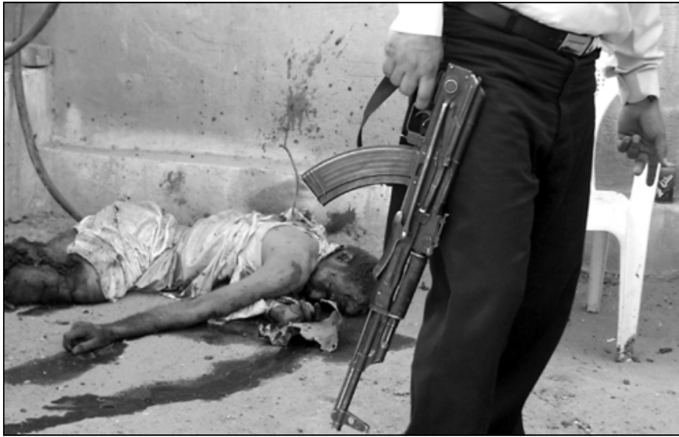
شريطي عراقى يسير امام جثة أحد ضحايا الانفجارات في بغداد أمس

تركبة التي تلغرف في شمال العراق التي تستكثها غالبية تركمانية ناطقة باللغة التركية حيث أسفرت غارات امريكية عن سقوط أكثر من خمسين قتيلًا. ويعرض الاتراك لهجمات متزايدة في العراق. وقُتل عدة مواطنين اترك وحفظت مجموعات مسلحة عدا اترك. وافرج عن غالبية الاتراك المخطوفين بعد تعهد الشركات التي يعملون لحسابها بوقف نشاطاتها في العراق. (رويتز - أ ب)