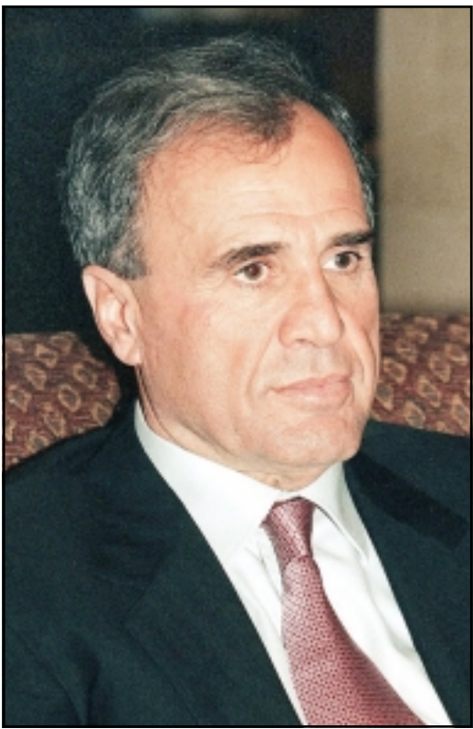
اللواء غازي كنعان

الفساد والفاستين. وتوقع احد القادة البعثيين الكبار السابقين في سورية في اتصال اجرته معه «القدس العربي» ان لا تعمر هذه الوزارة أكثر من ثمانية اشهر. وقال انها ستكون وزارة تصريف اعمال حتى انعقاد المؤتمر القطري للحزب في حزيران (يونيو) المقبل، وبعدها سيتم تشكيل وزارة جديدة من الشباب المقربين من رؤية الدكتور بشار الاسد للاصلاح. وقال المصدر نفسه ان ثلاث قضايا اساسية ستكون مدرجة على جدول اعمال المؤتمر القطري القادم، هي الغاء القيادتين القطرية والقومية للحزب، وانتخاب مكتب سياسي بدلها. واعادة النظر في كل الصيغ الايديولوجية السابقة، وازداد ان الرئيس بشار يريد تفكيك حزب البعث واستبداله بحزب عصري حديث يمين بالاصلاح الذي تحدث عنه في بداية توليه السلطة. وجاء تولي السيد دخل الله وزارة الاعلام مفاجأة للكثيرين، اذ لم يرض على توليه رئاسة تحرير صحيفة «البعث» أكثر من عام، وهو معروف كأمين المؤسسة الحزبية البعثية. وقالت مصادر سورية انه كان مرشحا لتولي المنصب وزير الاعلام أثناء تشكيل حكومة عطري قبل عام، ولكنه ارتضى ان يعين في صحيفة «البعث» لكتساب خبرة اعلامية مهنية.