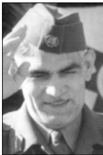
عبد الكريم قاسم

هذه الحقيقة؛ بل وحتى في حقب تالية، سوف تبرز على أن فكرتها عن الجماهير لم تكن سوى تجسيد لحقيقة، أنها تريد تحويل قطاع من المجتمع إلى مجتمع سياسي صغير يمكن الرج به في المعارك، وأن كل هدفها وكل استراتيجياتها وتكتيكاتها السياسية المتبصرة في الميدان، إنما هي أحداث هذه النقلة في حياة قطاع بعينه من البشر، والإنقلاب بهم من طور ما قبل الفعالية الإجتماعية إلى طور الفعالية السياسية. وهذا يعني ببساطة أن الجماهير تم تعريفها في الفكر السياسي العراقي، بأنها القطاع المسيس أو الذي أمكن تسييسه من المجتمع، ولم تكن هي المجتمع أو الشعب أبدا.