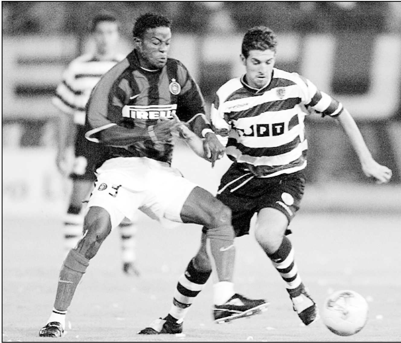
لقطة من إحدى مباريات انترناسيونالي

■ ميلانو (إيطاليا) - روبرتو: يلتقي يوم الأحد قطبا كرة القدم في مدينة ميلانو الإيطالية وهما انترناسيونالي وميلانو الدفاع عن لقب الدوري في استاد سان سيرو الذي يتقاسمان ملكيته، ويخوض انترناسيونالي الذي يديره روبرتو مانشيني المباراة بروح معنوية عالية بعد أن سحق بطنسية الاوروبي في وقت سابق من الاسبوع الحالي، ويخلف انترناسيونالي بفارق ست نقاط عن يوفنتوس صاحب الصدارة الحالي رغم أنه لم يلق طعم الهزيمة في المباريات الست الأولى هذا الموسم.