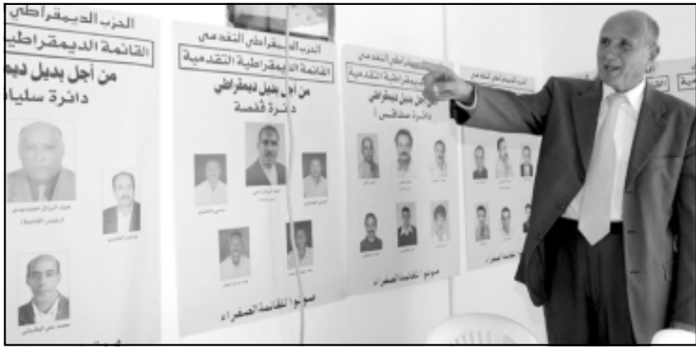
نجيب الشابي يطلع الصحافيين على قوائم مرشحي حزبه المنسحبين من الانتخابات التنبائية

الخميني لاحتجاج على مصادرة الحكومة لبيانته الانتخابي. وردت عشرات من مؤيدي المرشح محمد علي حلواني منظمات تنادي بالأفراج عن البيان في مظاهرة نادرا ما تشهده تونس مؤخرا. وقال أحد شهود العيان أن أفراد الشرطة الذين يرتدون الثياب المدنية كانوا يوقفون المتظاهرين عددا وسدوا عليهم الطريق، وتتهم بعض الأحزاب المعارضة وجماعات حقوق الإنسان في الداخل والخارج الحكومة بانتهاك حقوق الإنسان. وقال شهود العيان أن الشرطة لم تضرب المتظاهرين أو تسيء معاملتهم مثلما فعلت في السيرات السابقة على حد قول بعض المعارضين.