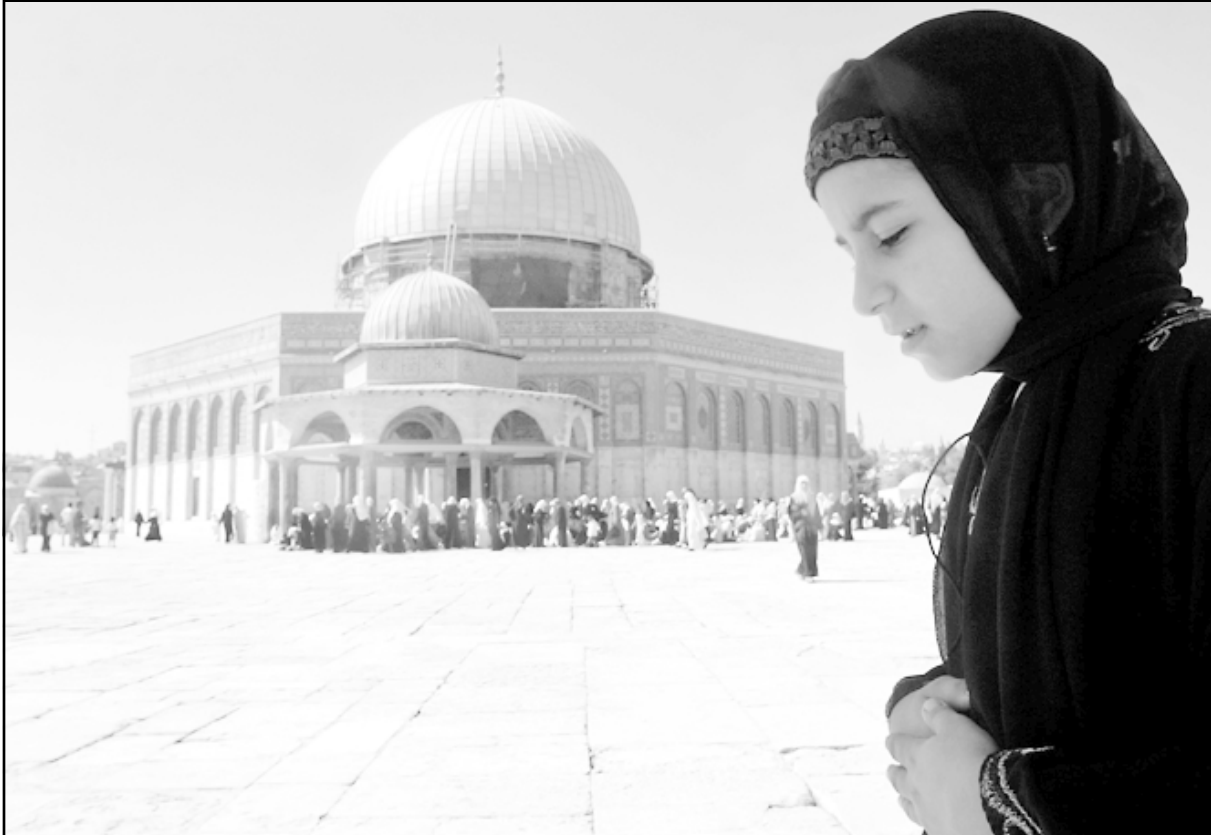
مطلعة تصلي في باحة المسجد الأقصى الذي تحاصره القوات الاسرائيلية لنحو آلاف المصلين من دخوله

وناشد الشيخ صبري، العرب والمسلمين حماية المقدسات الإسلامية في القدس، والتدخل لحماية المسجد الأقصى. كما وجه نداء إلى قادة الدول العربية والإسلامية لعقد قمة تخصص لبحث موضوع القدس، مؤكداً أن الشعب الفلسطيني لن يستسلم، وأن القدس ستبقى ذات هوية عربية وإسلامية.