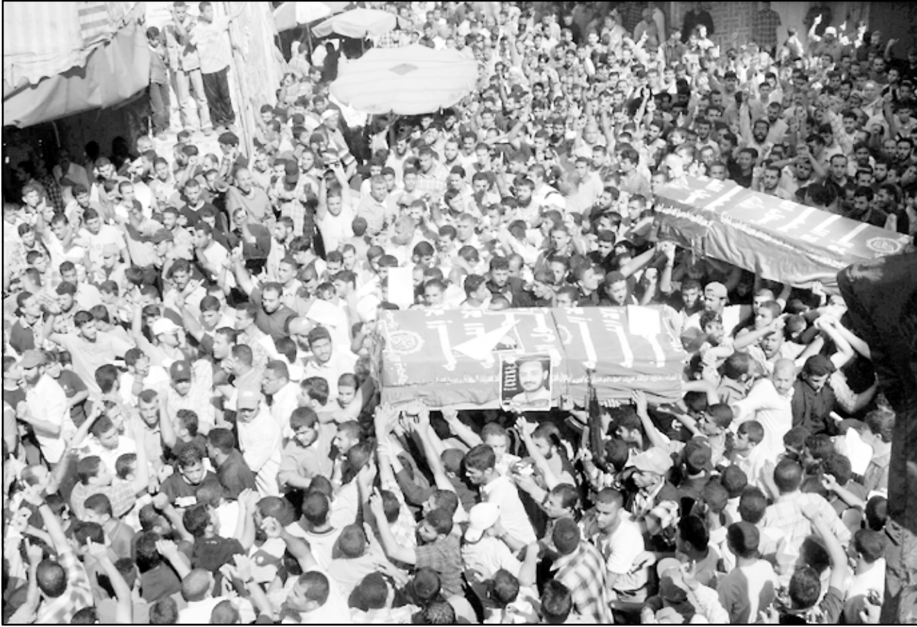
آلاف الفلسطينيين يشيعون الغول ورفيقة عماد عباس في مدينة غزة الجمعة