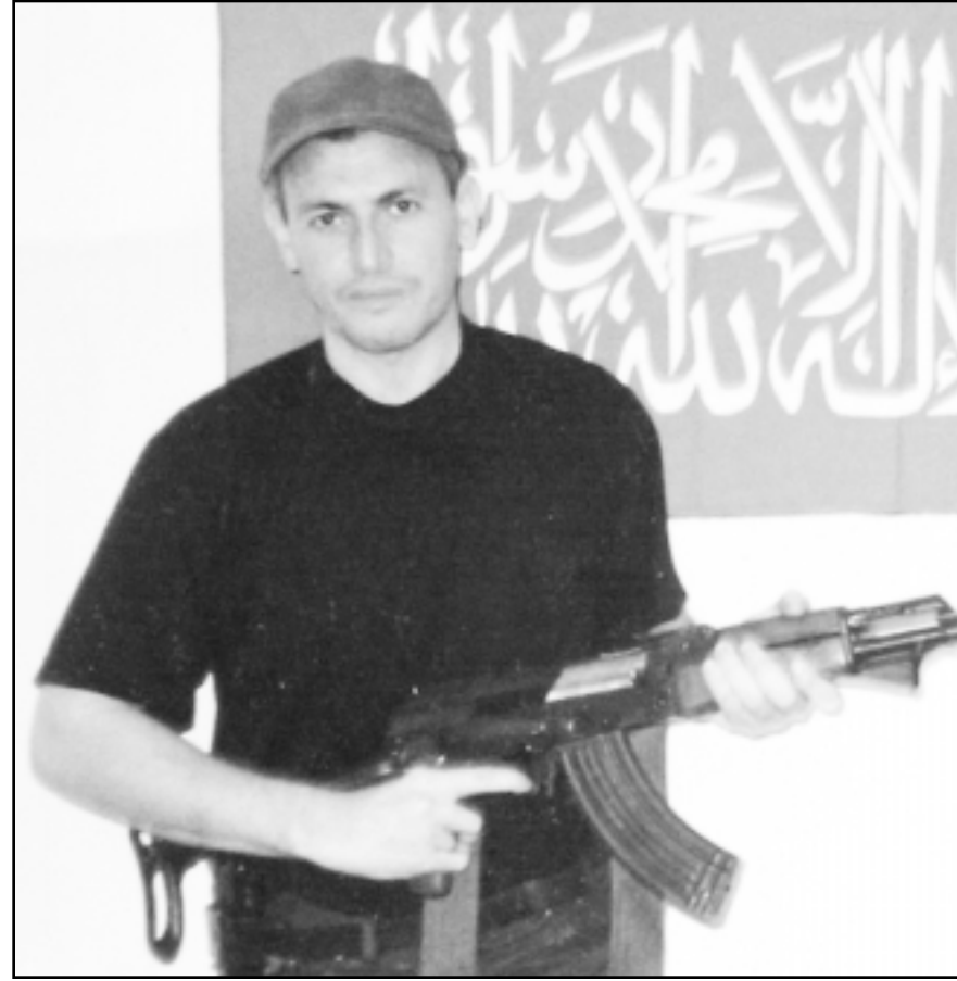
صورة من الارشيف للشهيد عدنان الغول