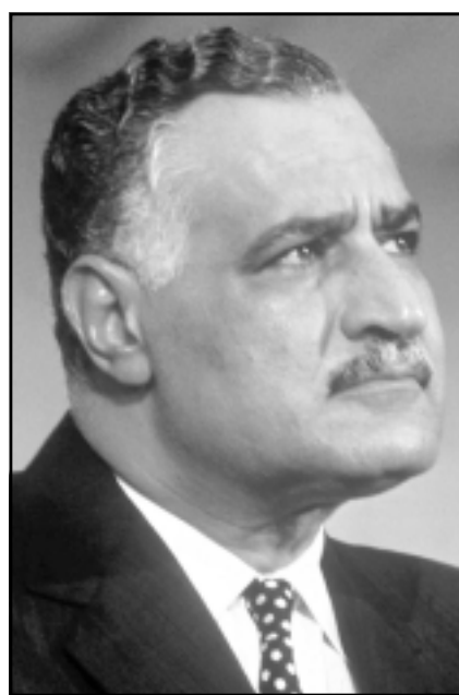
جمال عبد الناصر

وبالفعل، فإن العودة إلى أدبيات الحزبين البعث والشيوعي والحركة الإسلامية والقوميين العرب في