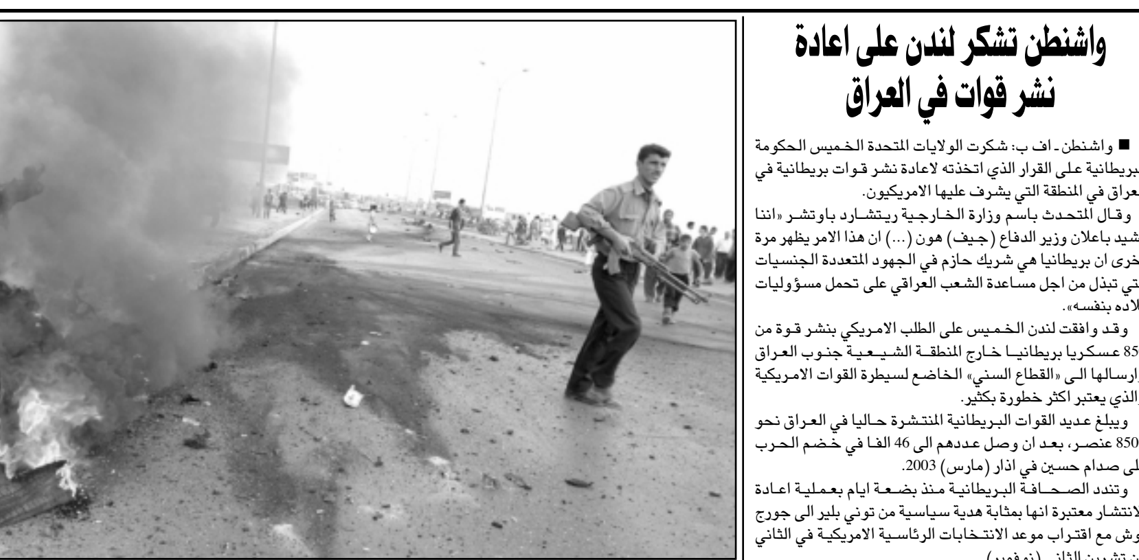
صباط عراقي في موقع انفجار سيارة مفخخة في الموصل المحقة

غير انه في كانون الثاني (يناير) من العام الحالي، قال تشيني هناك إشارات قاطعة تشير إلى وجود علاقة بين تنظيم القاعدة والحكومة العراقية». وفي ايلول (سبتمبر) 2003 قال تشيني في لقاء مع الصحافة، الذي تبثه شبكة «ان بي سي»، ان النجاح في العراق سوف يشكل «صربة قاسية للقاعدة الجغرافية لارهابيين الذين كانوا يهاجموننا لسنوات عديدة لكن تشيني في 11 ايلول (سبتمبر) 2001، وفي ايار (مايو) 2003 قال الرئيس بوش على من حسامة طائرات ان الإطاحة بصدام حسين يعني «أننا أضحنا حلفاء مهما للقاعدة». وقال نائب الرئيس ديك تشيني قد صرح في 17 حزيران (يونيو) 2004 ان الاتهامات حول صدام حسين وتنظيم العراق ومفندي اعتداءات 11 ايلول (سبتمبر) 2001 هو الاجتماع المزعوم جاء ان وازن التقارير الاستخباراتية في ربيع العام 2002 ان الاجتماع المزعوم لم يتفق أبداً. وكان نائب الرئيس ديك تشيني قد صرح في 17 حزيران (يونيو) 2004 ان العراق ومفندي اعتداءات 11 ايلول (سبتمبر) 2001 هو الاجتماع المزعوم تشيني في 11 ايلول (سبتمبر) 2001، وفي ايار (مايو) 2003 قال الرئيس بوش على من حسامة طائرات ان الإطاحة بصدام حسين يعني «أننا أضحنا حلفاء مهما للقاعدة». وقال ليفين في تقريره ان العلاقة بين تنظيم القاعدة والنظام العراقي السابق - التي تنصل منها الرئيس بوش - كانت كانون الثاني (يناير) 2003 - كوش مساعد وزير الدفاع لشؤون السياسة دوغلاس فيث في الواقع هو من يروج لها، وفي تشرين الاول (أكتوبر) 2001