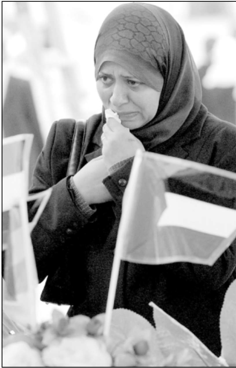
سيدة تبكي امام ضريح الرئيس عرفات

غزة - رويترز - قال مسؤولون ان محمود عباس (ابو مازن) الزعيم المؤقت لمنظمة التحرير الفلسطينية يأمل في اقناع النشطاء خلال محادثات أمس الثلاثاء بوقف الهجمات على اسرائيل للسماح باجراء الانتخابات بسلاسة لاختيار خليفة للرئيس الراحل ياسر عرفات في بداية العام المقبل. ويبدأ عباس محادثات مع 14 جماعة في غزة مساء الاثنين وأمس اجتمع مع قادة حماس، وأحيث وفاة عرفات الأمل في استئناف عملية السلام في الشرق الأوسط لكنها أثارت أيضاً مخاوف بخصوص احتمال اندلاع العنف بين الفصائل الفلسطينية. ونجا عباس من الإصابة يوم الأحد في معركة بالأسلحة النارية بغزة بدأها مسلحون غاضبون. وعباس رئيس سابق للوزراء ومن المتوقع ترشيحه في انتخابات الرئاسة التي تجرى في التاسع من كانون الثاني. وذكرت مصادر قريبة من عباس انه يريد اقلع الجماعات بما في ذلك الجماعات الإسلامية. وقد تمتع هذه الجماعات في المقابل مزيداً من النفوذ السياسي. وقال النائب زياد أبو عمرو القريب من عباس ان المحادثات الثنائية ستتضمن مناقشة قضايا محددة، مضيفاً ان مسألة ابرام هدنة او ربما وقف مؤقت لاطلاق النار ستناقش بسبب الحاجة إليها. وعباس هو أهم شخصية في القيادة الفلسطينية التي تولت ادارة الامور مؤقتاً بعد رحيل عرفات