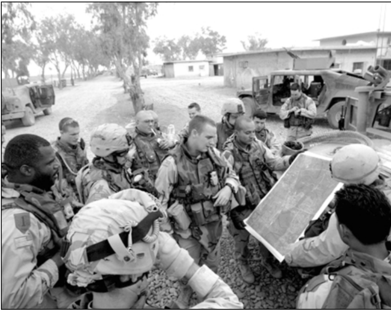
جنود امريكيون يخطنون لهجوم جديد في الفلوجة امس (ا ف ب)

وقال ساينتس «شاهدت مشاة البحرية يتصرفون بقوة منضبطة من الحرفين طوال الهجوم. وفي هذه الحالة الموقف مشوش في اقل تقدير». وتعرض الجيش الامريكي لاجراج تركوا في المسجد ليقتلهم جنود اخرون مهمة لتأمين مراكز الشرطة التي قدم فيها للمحاكمة ثمانية جنود امريكيين او اجبوها وحماهم عسكريه بشأن اساءة معاملة المعتقلين. وظهرت صور فيديو التقطها طاقم تلفزيوني مرافق الاشخاص الخمسة بينما كانوا في المسجد وبدا عدد منهم على شفا الموت بالفعل. وقال الراس ان أحد جنود