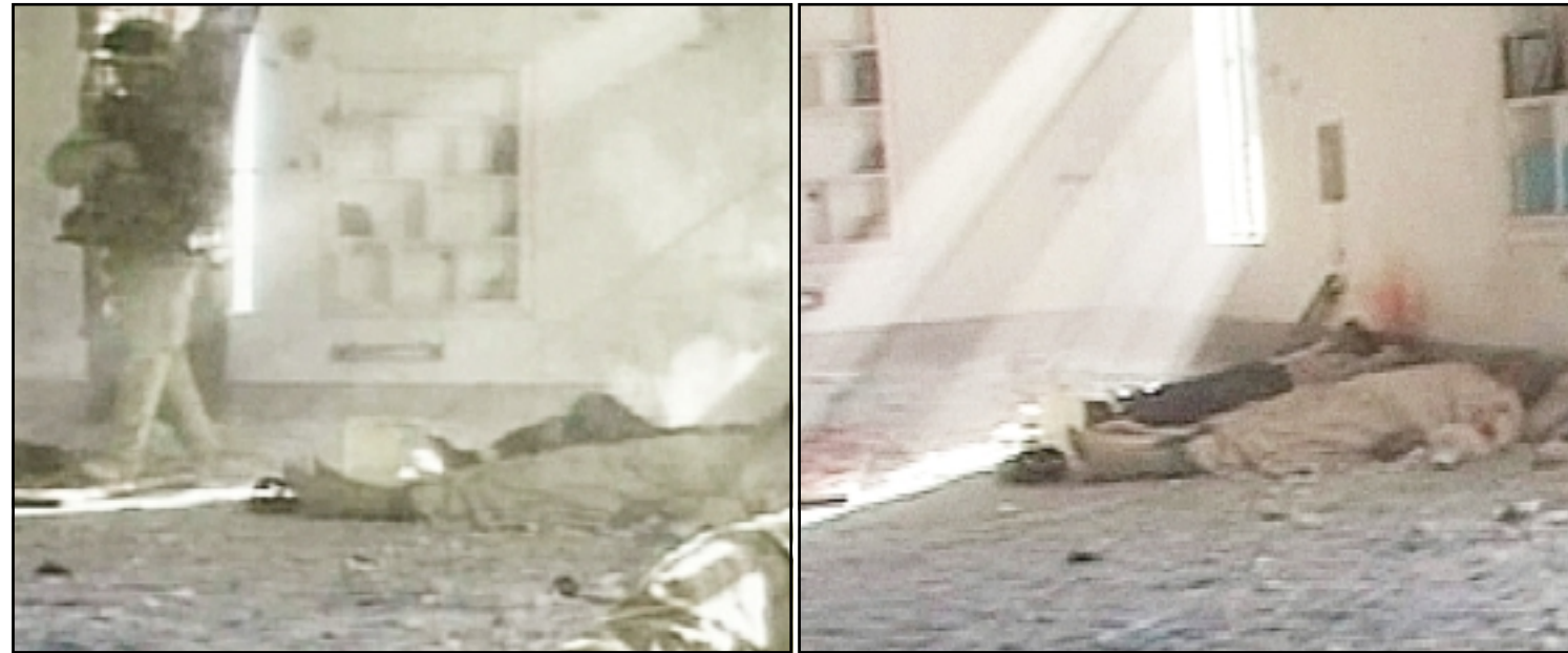
مشاهد الفيديو التي تصور جنديا امريكيا يقتل جريحا عراقيا في مسجد بمدينة الفلوجة