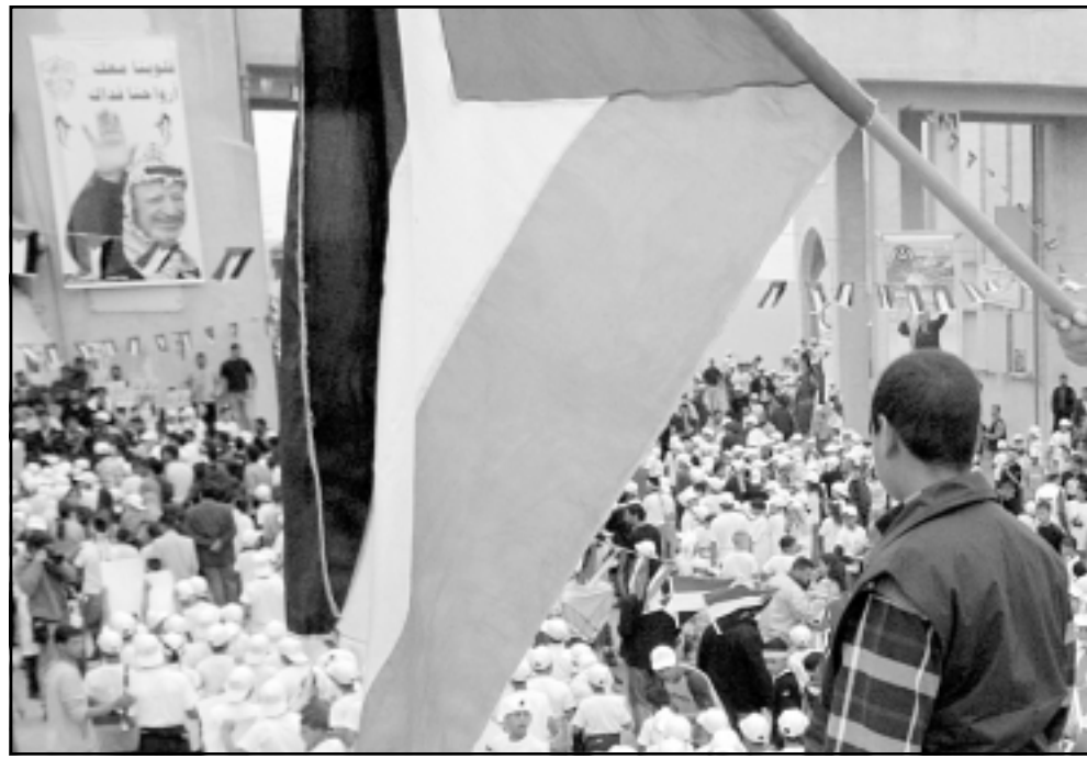
عشرات الالاف يصلون على روح الرئيس الفلسطيني ياسر عرفات في المقاطعة في رام الله اسس

■ قلبه مع سيلفان شالوم، الذي استعجب للصرح بانه لن يسمح لعرب شرقي القدس بالتصويت في الانتخابات للسلطة الفلسطينية. عزائي لتساخي هنجبي ولليوم لفئات اللذين اصطفوا وراءه. وكذا لا يهود اولرت الذي حاول ان يفتح باب اغلبية الفلسطينيين في المدينة الموحدة لن يتنحوا، ولكن سكان الاحياء العديدة، والتي في المستقبل ستضم الى السلطة، نعم.