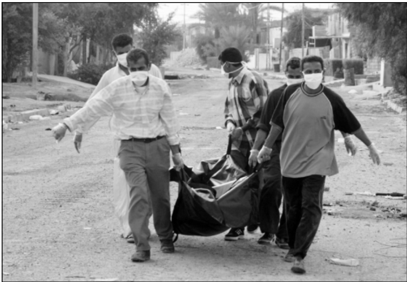
عراقيون ينقلون جثة أحد الشهداء في الفلوجة

ويعد يوم من بدء العمليات أعلن جورج كاسي، قائد القوات الأمريكية في العراق عن امكانية خروج الزرقاوي من المدينة، وقال مايرز ان المقاومة داخل المدينة لم تكن مركزية، ولهذا السبب لم تنتج في قطع خطوط الامداد للقوات الأمريكية والعراقية المتحالفة معها، كما فشلت في تعزيز قدراتهم الدفاعية. ووصف التعاون بين المقاتلين الاجانب، والعناصر السابقة من الحزب، والجهاديين بأنه زواج مصلحة، وترغم واشنطن انها قتلت 1600 مقاتل من ما يقدر عددهم بثلاثة الاف حوضروا في المدينة، الا انه لا يوجد اي دليل على صحة هذا الرقم، خاصة ان الكثير من الجثث لا تزال تحت الانقاض. ومن اجل التعرف على هوية المقاتلين يقول كيسي ان المحققين الأمريكيين يحاولون البحث عن نسخ القرآن الكريم في جيوب المقاتلين الشهداء من اجل تحديد مكان وشراء، وبالتالي التعرف على هوية المقاتل. ومع اعتراف علاوي بان المقاومة في عراقية، الا انه واصل التمسك بالقول ان المقاتلين العرب هم مسؤولون عن العمليات، والانتحارية والسيارات المفخخة. وقال ان هدف المقاتلين الاجانب هو تعويق الانتخابات، واحداث الضرر على «القوات المتعددة الجنسيات». واتهم كيسي المقاومة بمحاولة الضغط على ما اسماه «القلية السنية»، لكي لا تشارك في الانتخابات القادمة، ويخطط الامريكويون باستبدال الشرطة العراقية بالحرس الوطني الذي يدعم من القوات الأمريكية. ووجه مايرز اتهامات للحكومة السورية، حيث قال ان العدد القليل من الجاهدين العرب نجحوا بالدخول للعراق عبر