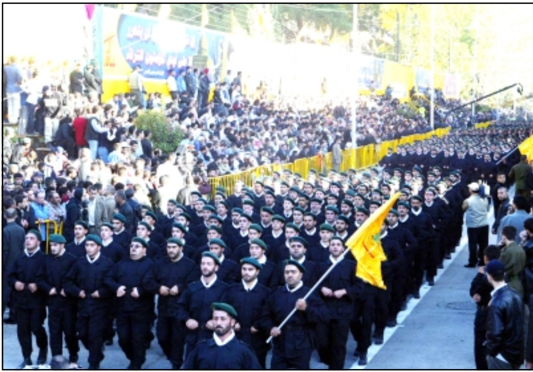
عناصر مقاتلة تابعة لحزب الله أثناء احتفالات «يوم القدس» يوم الجمعة الماضي في بعلبك شرقي لبنان

بنسبة ضئيلة، إلا أنها سرعة نوعية على مستوى الصراع العربي الإسرائيلي منذ ان وجدنا حالة تستوجب التوقف عندها وإعطائها المزيد من الدعم والثناء، فهي ليس الحرب كحرب على مواجبتها، وهي نظرة روج لها العدو الإسرائيلي وكذبة كذبها العرب في بداية المطاف فصدقوا! تلك الواقعة الانفلات اليمية الحال قد أعادت حالة من التوازن ولو