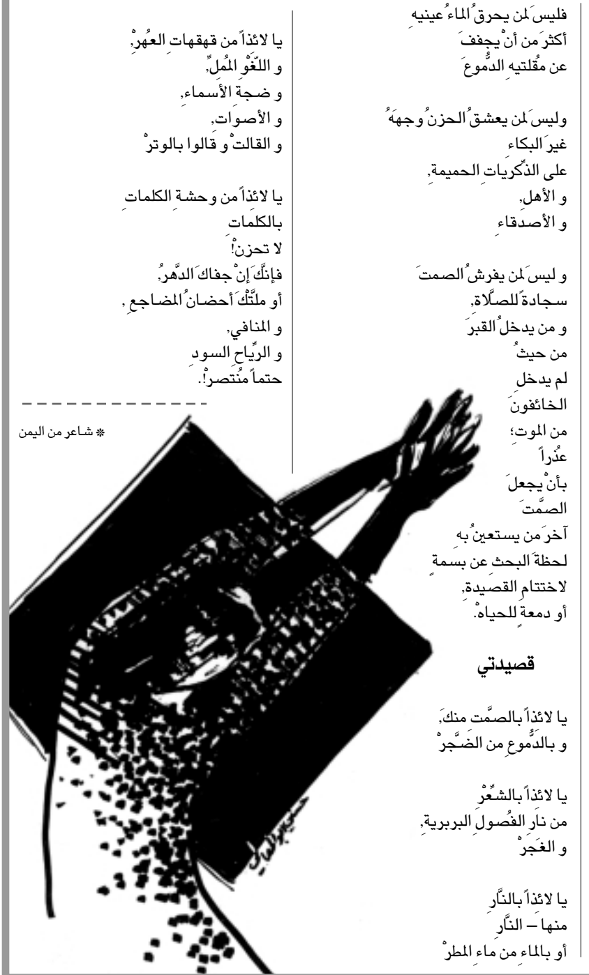
✽ شاعر من اليمن