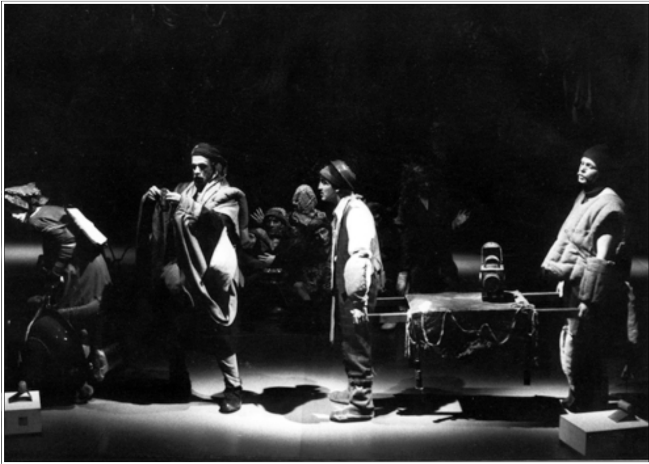
مشهد لحدى مسرحيات «الحكواتي»

وأكد أنه في ظل تعجيب الهوية واللامح التراثية من قبل الاحتلال كان المسرح المنبر الوحيد لقبول التحدي والتصدي لخضات المحتل في تهويد التراث لبناء حضارته المزعومة على أنقاض حضارتنا الفلسطينية وتراثنا الأصيل. فمثلاً يقوم الإسرائيليون من بتقليد أوثاننا لحضيات الطيران الإسرائيلي على أنها من تراثهم نوره ملك للجميع أي في الإسقاط السياسي للتراث أن الدولة ملك للجميع وأن مدام الجميع هي التي أنارت الطريق للشمعة المسيرة، من هنا يأتي استهداف مسرح التراث من قبل كل قوى الشر التي تحارب شعبنا للقاء ثقافته فكانت هجمة المؤسسات الغربية كغزو ثقافي لتعميم مفهوم مسرح مغاير للمعايير بعيداً عن الهوية والتراث وحاولت مؤسسات غربية عديدة اغراق العاطلين في هذا المجال بالمال وإيجاد الصقوليون بحب الوطن عن ساحة المسرح الوطني على أن يبقوا