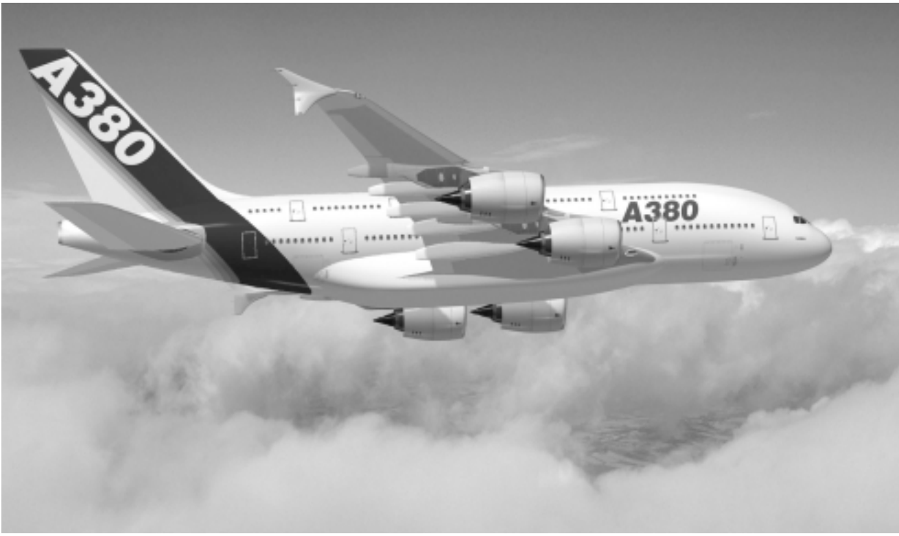
صورة تخيلية لطائرة 380

مع الحكومة الصينية ومع شركة الطيران الرئيسية ببونغ كونغ (كاتاي باسفيد)، وسيتم كشف النقاب عن الطليبتين غدا الثلاثاء.