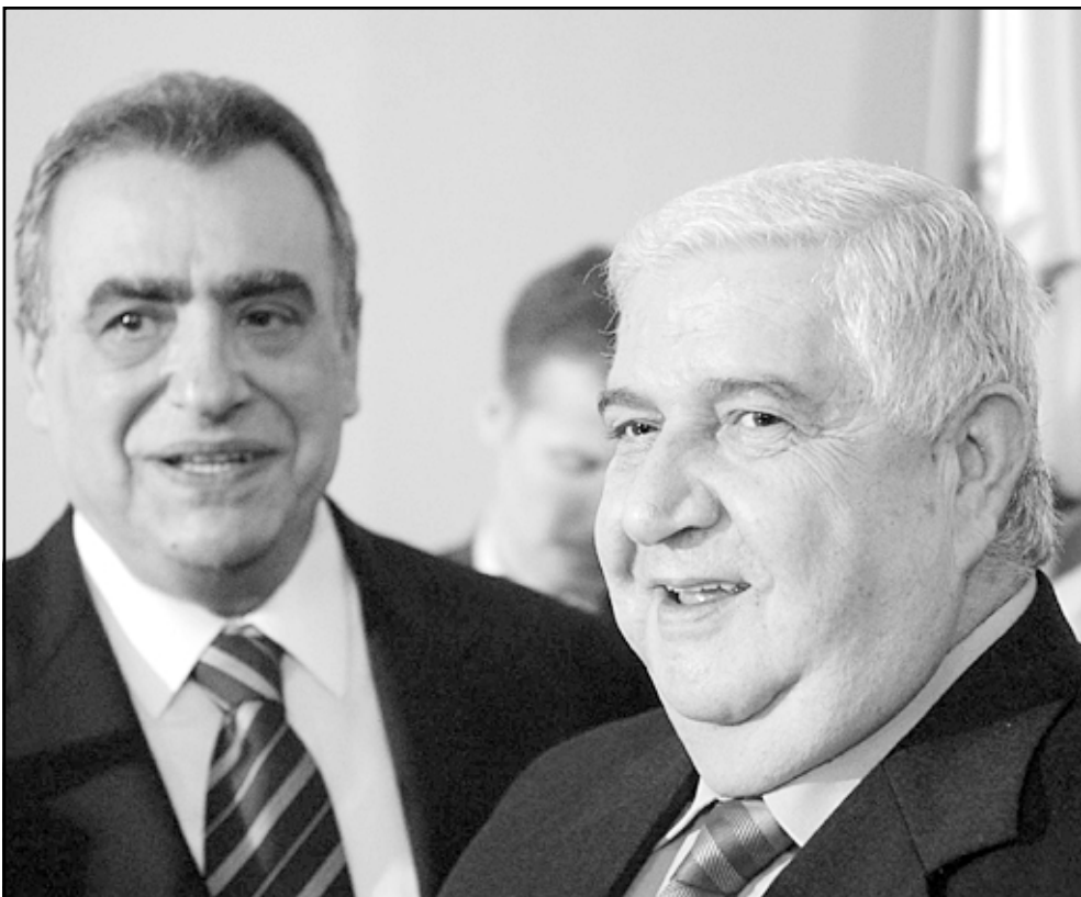
المعلم ومحمد اثناء لقائهما في بيروت امس