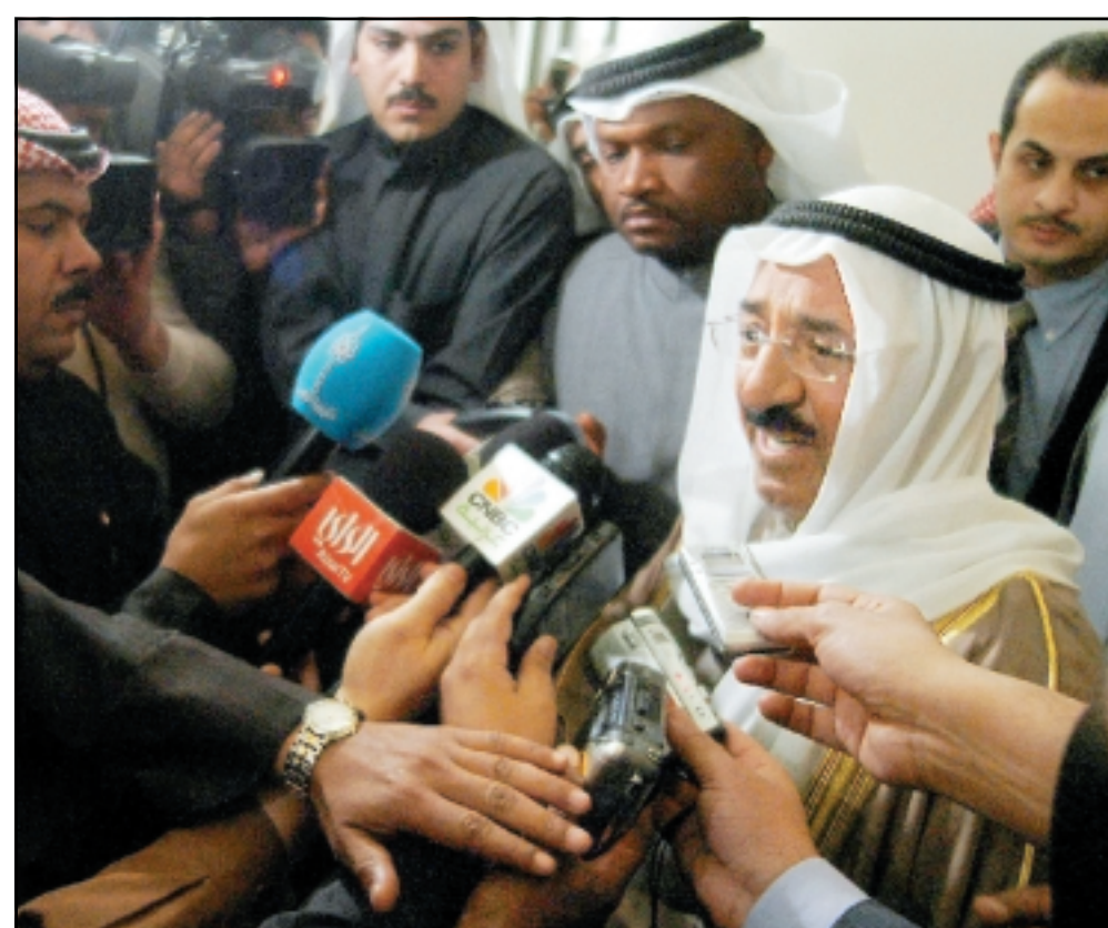
رئيس الوزراء الكويتي صباح الاحمد يتحدث للصحافيين بعد جلسة مجلس الامة امس

وخطب البيان علماء المسلمين وقال «ان الامة تنتظر منكم ان تكونوا في الصفوف الاولى مع الجاهدين، وليس في الصفوف الاولى عند هذه الحكومة الطاغية، ان الامة تنتظر منكم ان تقولوا الحق ولا تخافوا لومة لائم» واقر مجلس الامة الكويتي امس الثلثة قانونا يتيح مصادرة الاسلحة والذخائر فيما تستعد الحكومة لإصدار قانون جديد للصحافة يكافح الإرهاب ويحظر بعض ما ينشره الإعلام