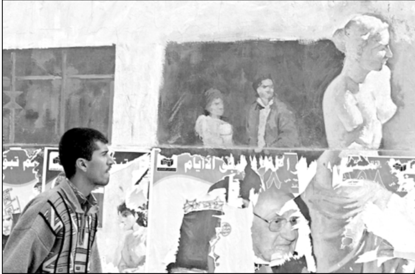
لافتات انتخابية ممزقة في بغداد امس

أولاً: الناخبون المؤهلون للتصويت: 1) تزوج عدة كبيرين من المواطنين الاكراد في محافظة كركوك من عدة محافظتي اربيل والسليمانية، واستأنهم في مدارس منطقة (رحيم أوة) واستضافة الافاضل منهم في البيوت بايعاز وشراف مباشر من قبل (فرع الاتحاد الوطني الكردستاني) في منطقة (رحيم أوة). 2) قامت اعداد كبيرة من الناخبين في منطقة (رحيم أوة) بالتصويت واكثر من مرة (خمس مرات أو أكثر) من دون ان يولدوا اصابعهم بالحبر الخاص وامام اخطار مسؤولي وموظفي المراكز الانتخابية في المنطقة. 3) ايضا قامت اعداد كبيرة من الناخبين في منطقة (رحيم أوة) بالتصويت على الرغم من عدم بلوغه السن القانونية (18 سنة) بعد ان تمت اضافة اسمائهم الى القوائم الانتخابية من قبل الموظفين في تلك المراكز دون ادنى وجه قانوني، على