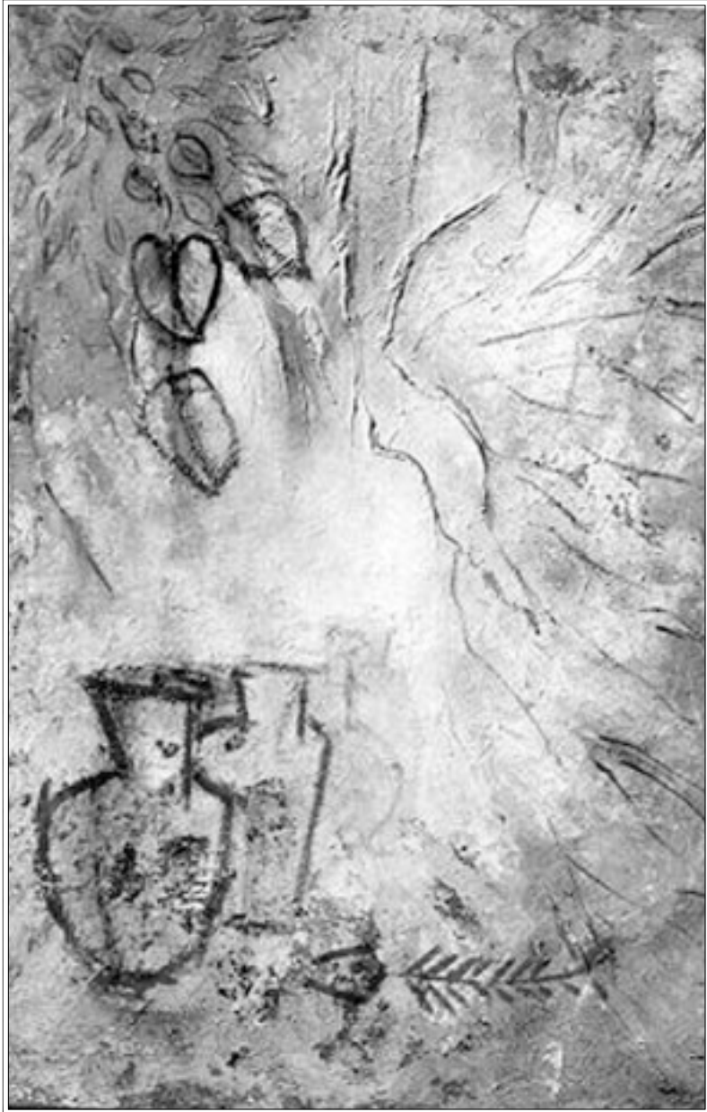
لوحات الفنانة

أكثر تجربة الفنان الراحل محمد القاسمي والشاعر حسن نجمي في ديوانهما «الرياح البنية»، وهي نبي لواحتي إشارات ورموز وغير مفقودة بالمعنى المباشر، لتكون اللوحة الأمازيغية جزءاً من العمل الإبداعي المغربي، ويكلم الآخر من خلال الألوان وحركة الريشة وطبيعة المواضيع وبعض الأفكار.