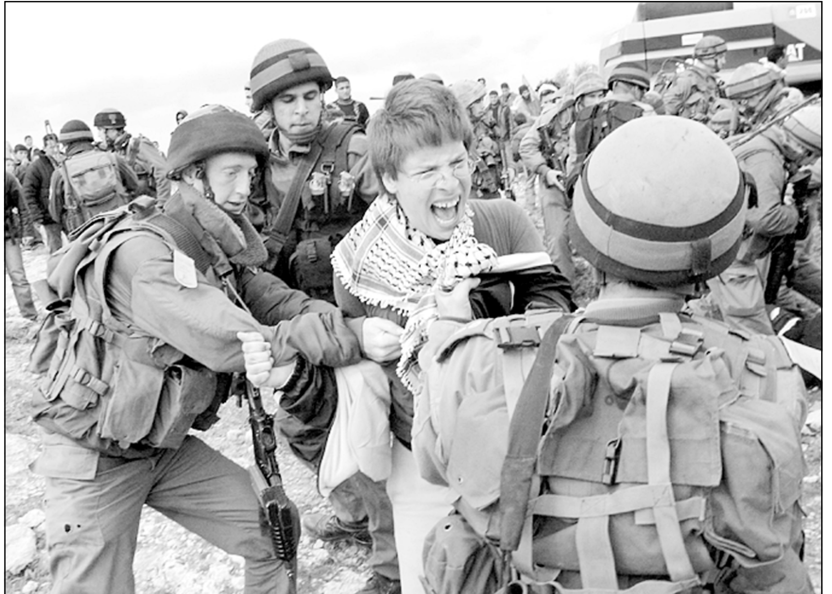
ناشط سلام غربي يشتبك مع جنود اسرائيليين اثناء مصادرتهم اراض فلسطينية في مدينة الخليل المحتلة امس

وتابعت هذه المصادر قائلته ان القسامة تلعب في هذه الايام دورا اقليميا مهما من اجل ضمان مكانة مصر، مشيرة الى ان العلاقات المصرية- الاسرائيلية في هذه الايام محمية للغاية، وقال المحلل السياسي في صحيفة «معارف» الاسرائيلية افيشاى بن حاييم، استنادا الى مصادر وصفها بأنها مغربة جدا من ديوان شارون، ان