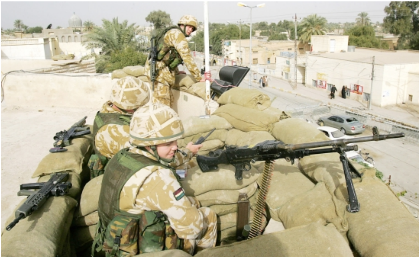
جنود بريطانيون يحرسون مركز اقتراع في مدينة البصرة في جنوب العراق

عندها اصيب المقدم بالصعقة وقال: «هذه كارثة، وهذه هو السيناريو الذي كان يخشاه الجميع!» قولي لنا كيف ترين ان الامور ستسير؟» عندها تم قطع البث ولم يسمح للجن ولا مقدم البرنامج «النسي ان ان» بالاستمرار في الحوار.