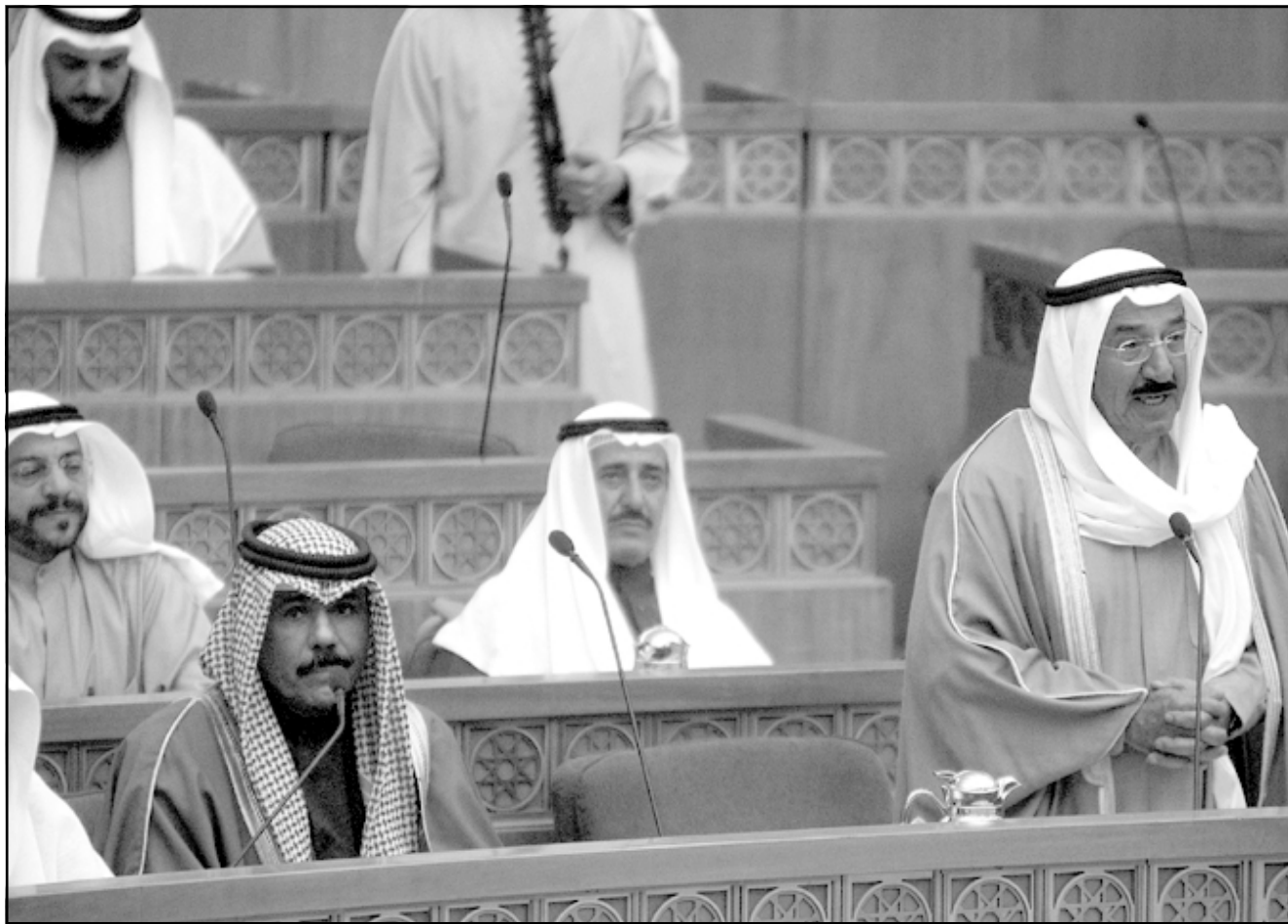
رئيس الوزراء الكويتي الشيخ صباح الاحمد الصباح (يمين) يتحدث أمام البرلمان أمس

الشبهويين المعتقلين في الكويت سعويين. وكانت الملكة السعودية الجاورة للكويت شهدت منذ أيار (مايو) 2003 موجة هجمات تبناها تنظيم القاعدة اوقعت أكثر من مئة قتيل ومئات الجرحى.