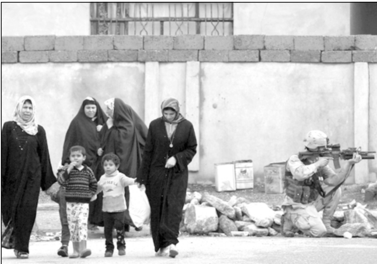
عائلة عراقية في الجانب جندي امريكي في الموصل امس