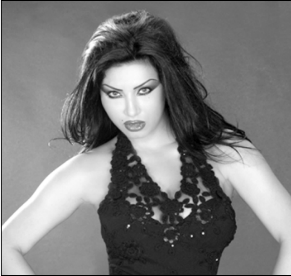
مروى (القدس العربي)

■ وهل وظفت هذا السلاح بصورة صحيحة؟ أي أسلوبك؟ ■ طبعاً.. لأن التوظيف الذي تتحدث عنه يجب أن يكون درستاً.. لا سيما في ارتدائي اللبس البليدي الذي لم يكن مستخدماً في أي فيديو كليبي.. فقد كان هم المطربات أن يرتدين أشهر ماركات الأزياء ليطهرن في أتم أنقاة.. لكن بالنسبة لي فقد اخترت أن ارتدي الشعبي كي يقربني من الناس ويعلمهم يشعرون بانني جالسة بينهم. ■ حاولت غنائية؟ ■ ماذا عن محاولات الغنائية قبل «أما نعيمة»؟ ■ كانت لدي محاولات لكنني لم أنجح فيها.. والسبب أنني لم أكن أعرف أن أختار الأغاني المناسبة لصوتي.. ولم أتعاون مع أحد في إنتاج ذلك العمل وتكلمت بدفع تكاليف الإنتاج من حسابي. ■ عندما أعدت غناء «أما نعيمة» هاجمك اول من قدمتها