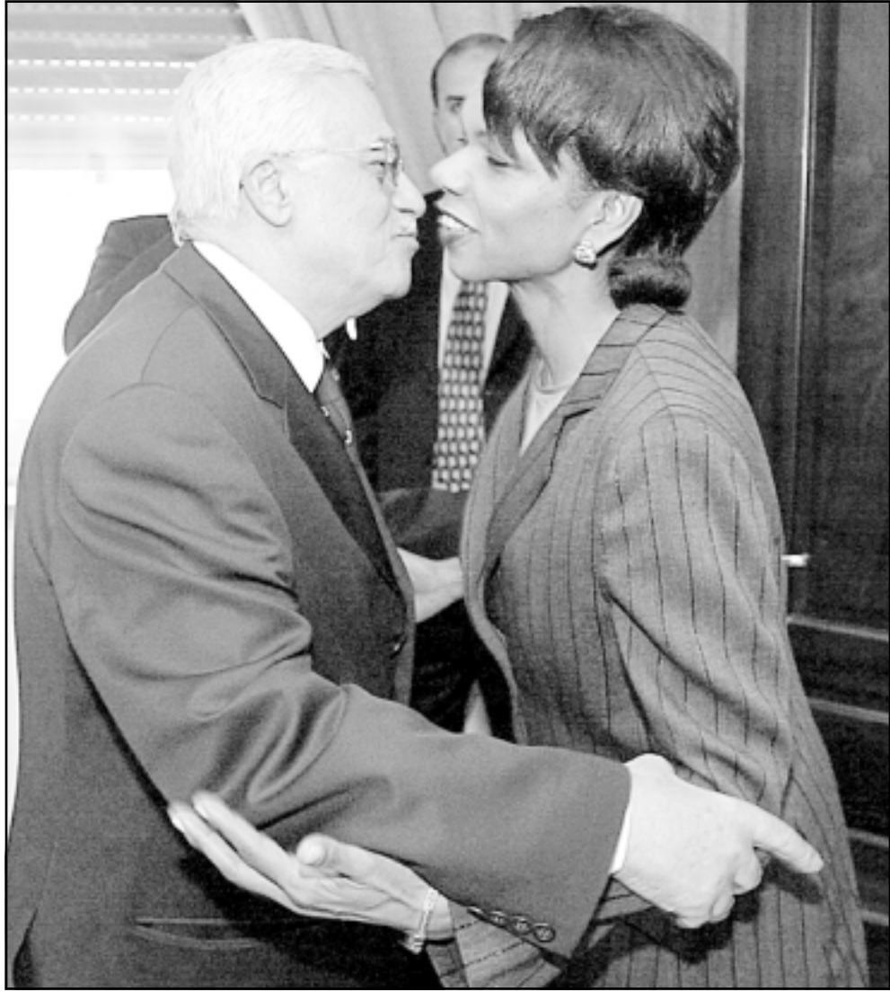
عباس مستقبلا راييس في رام الله امس

واعلن انه توصل إلى اتفاق مع الفصائل الفلسطينية لوقف إطلاق النار مع إسرائيل. وقال عباس «لقد عقدنا اتفاقا لوقف إطلاق النار مع جميع الفصائل الفلسطينية وهذا يدل ليس على رغبة منا فقط بالتهنئة ووقف عسكرة الانتفاضة والأمن والأمان والحياة الكريمة للناس وإنما أيضا رغبة من جميع الفصائل ورغبة الشعب الفلسطيني نفسه في الوصول إلى هذا الوضع الذي وصلنا إليه واعتقد أن الجميع ملتزم به وقد ألتزموا أنفسهم به». وأضاف أن الجانب الفلسطيني ملتزم تماما بهذا الاتفاق، مضيفًا «المطلوب الآن أن يعلن الجانب الإسرائيلي أيضا موقفه من هذه الأمور». ومن جهته قال الدكتور نبيل شعث وزير الشؤون الخارجية أن القيادة الفلسطينية تبحث مع وزيرة الخارجية الأمريكية كافة القضايا بعد أن قامت القيادة بأداء ما عليها من التزامات. ورحب شعث بالاستعدادات الأمريكية لإنشاء مجموعة لإدارة الأزمات لتأمين استمرار مفاوضات السلام ومساعدة الطرفين على تطوير وسائل تمكنهم من التحدث فيما بينهم وحل الأزمات التي ستعقب لا محالة خلال المفاوضات. ووصف ذلك بالاجابي والمشجع لأنه يضع إسرائيل عند التزاماتها. ودحض شعث التصريحات الإسرائيلية التي ترى في قمة شرم الشيخ مجرد قمة بيانات، وقال أن هذا تهيئة إسرائيلية للقمة حيث أن هناك مفاوضات فلسطينية - إسرائيلية تجري حاليا والمفروض أن تتوج بمجموعة من النتائج تعلن في ختام قمة شرم الشيخ. وقال صحیح أن القمة ستستغرق نحو أربع ساعات ولكنها لن تركز للمكثات والخطابات بل هناك قضايا سوف يجري استكمالها في القمة وقضايا ستناقش وتوضع على بساط البحث. وأضاف أن القيادة الفلسطينية تتعاون مع الأشقاء العرب تعمل كل جهدها من أجل أن تكون هذه القمة انطلاقا قوية نحو مفاوضات تفضي إلى وضد حل للاحتلال.