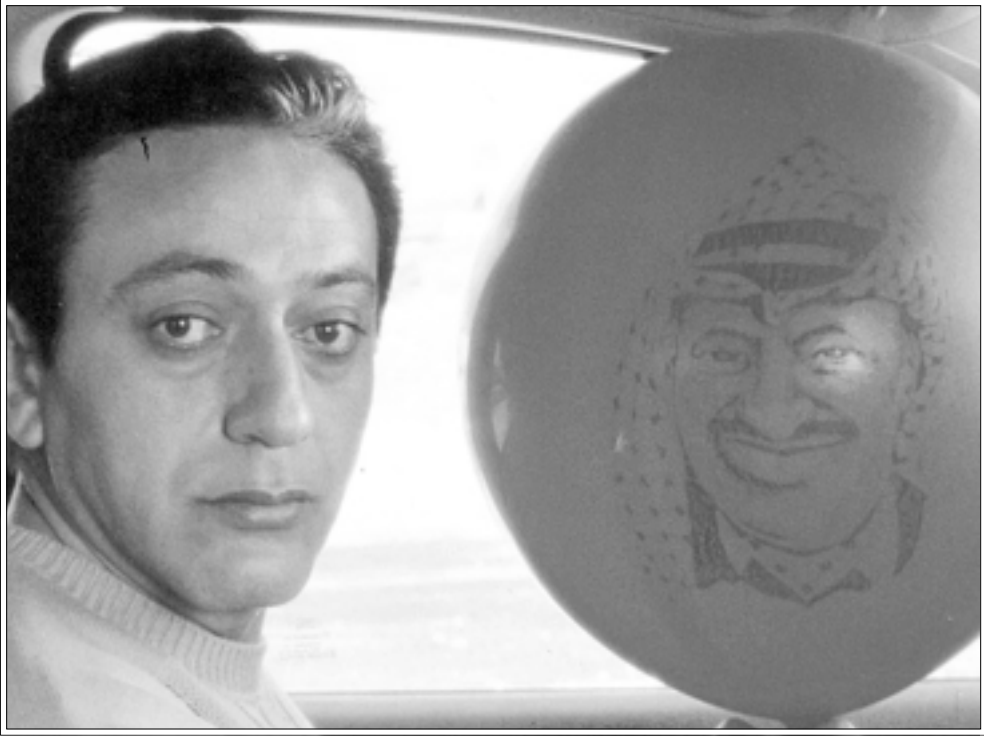
لقطة من فيلم «يد إلهية»

في 11/2/2003 يوم تسلمه لجوائزه، عبر المخرج السينمائي الفلسطيني حنا