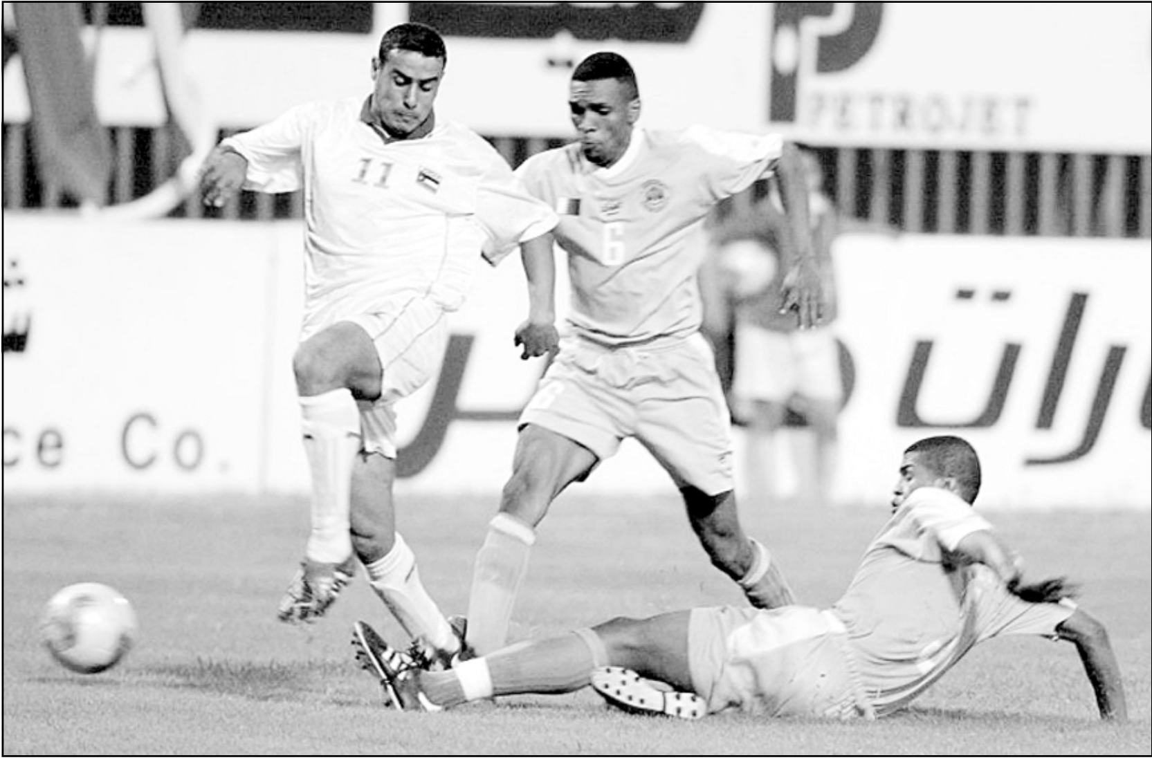
لقطة من إحدى مباريات الفيصلي الأردني

■ مدريد - رويترز: احتدمت المنافسة على لقب الدوري الإسباني لكرة القدم الموسم الحالي بعد أن حقق اتليتيكو مدريد ببرشلونة أول هزيمة على أرضه الأحد، وأحرز فرناندو توريس البالغ من العمر 20 عاما هدفي فريقه، وسجل توريس الهدف الأول في الدقيقة الأولى بعد أن تسلم الكرة من صانع ألعاب الفريق ارييل ايباجازا، وفي الدقيقة 70 احتسبت ركلة جزاء لمرشونة سددها البرازيلي رونالدنيو الغازي بلقب أفضل لاعب في العالم إلا أنه أهدرها قبل أن يعزز توريس فوز اتليتيكو بالهدف الثاني له ولفريقه والذي أحرزه من ركلة جزاء في الدقيقة الثالثة من الوقت المحتسب بدل الضائع. وبهذا الفوز ضاق الفارق بين برشلونه المتصدر وريال مدريد صاحب المركز الثاني في أربع نقاط ولم يتقابل الفريقان بعد على ملعب ريال مدريد في بيرنابيو. وأصبح الصراع على لقب الدوري الموسم الحالي مقصورا على هذين الفريقين، وبدأ اتليتيكو مدريد الذي حقق الفوز من قبل في مباراة واحدة فقط خارج أرضه بداية قوية بفعل مهارت نجمه ايباجازا. وقد تقدم اتليتيكو بهدف تقدم لاعبو برشلونه سعيا للتعادل ولكن دفاع اتليتيكو قضى على كل محاولاتهم وتوتر لاعبو برشلونه أن لم تُحضر هجماتهم عن هدف التتعادل، وحاصر برشلونه اتليتيكو في منطقة جزائه معظم الشوط الثاني ولكنه لم يسبب مشاكل لحارس مرمرى الفريق ليو فرانكو ولأحت فرصة واحدة فقط لبرشلونه للتعادل عندما احتسبت للفريق ركلة جزاء خاطئة أهدرها رونالدنيو. وقل الهولندي فرانك ريكارد مدرب فريق برشلونه متصدرا