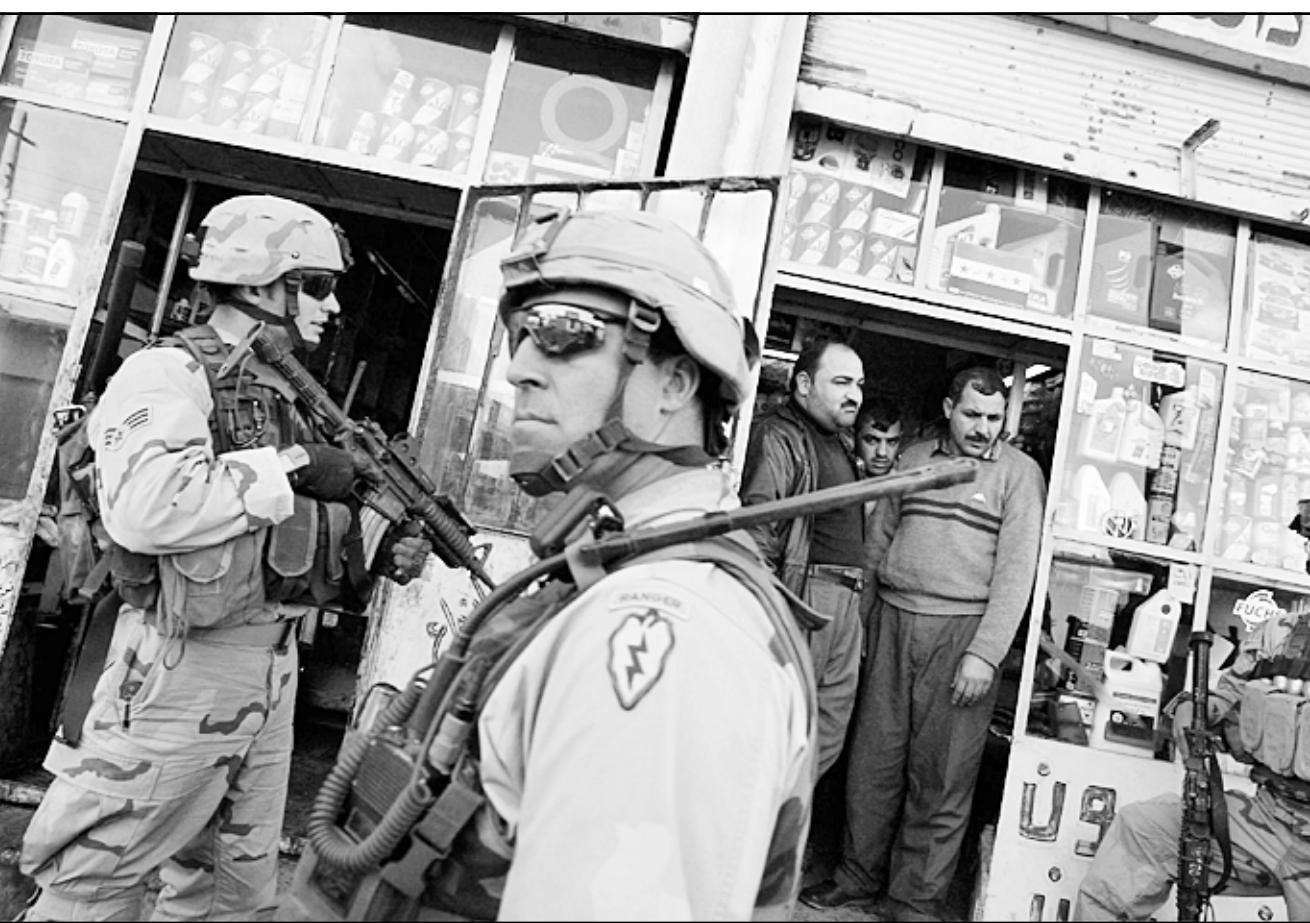
جنود امريكيون يستجوبون عراقيين في الموصل امس