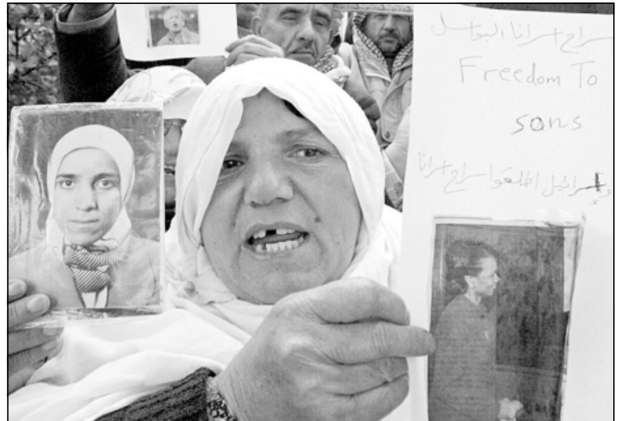
فلسطينيات يطالبن عباس اطلاق ابنتاهن من السجون الاسرائيلية

غزة - رويترز: تظاهر آلاف الفلسطينيين في شوارع غزة امس الاثنين لمطالبة الرئيس الفلسطيني محمود عباس بربط اي احياا لعملية السلام مع اسرائيل باطلاق سراح قرابة ثمانية آلاف فلسطيني معتقلين في السجون الاسرائيلية. وقال قادة جماعات الناشطين المشاركين في المسيرة التي نظمت رغم هطول الامطار انه لن تكون هناك أي تهديد بعد اربعة اعوام من اراقة الدماء بدون التوصل لاتفاق على جدول زمني لاطلاق سراح السجناء على ان تكون الاولوية للمعتقلين منذ فترات بعيدة. وقالت فريلاب احدى المشاركات في المسيرة وهي تحمل صورة لقريب محكوم عليه بالسجن مدى الحياة «سنرى املا في قمة شرم الشيخ اذا كان هناك قرار اسرائيلي واضح باطلاق سراح السجناء». واعرب القادة الفلسطينيون عن خيبة املمهم من رفض اسرائيل اطلاق سراح السجناء واتفق الجانبان يوم السبت على تشكيل لجنة مشتركة لتحديد معايير الافراج. وقال شاؤول موفاز وزير الدفاع الاسرائيلي ان اسرائيل ستطلق سراح ابن مروان البرغوثي القائد الفلسطيني البارز في الضفة الغربية فيما اناش بيهود عباس لاقناع الناشطين بالاتفاق على هدنة. وقضت محكمة اسرائيلية ضد مروان البرغوثي بخمس عقوبات بالسجن مدى الحياة بعد ان حملته مسؤولية تنظيم هجمات أسفرت عن مقتل اسرائيليين. واعتقلت اسرائيل ابنه القسام في 2003 واتهمته بأنه عضو في «منظمة اراهابية». ورفعت امهات صور ابائهن خلال المسيرة التي ترددت فيها هتافات تقول لتحرير الفلسطيني انه يستطيع التفاوض ولكن دون «بيع» قضيبه السجناء.