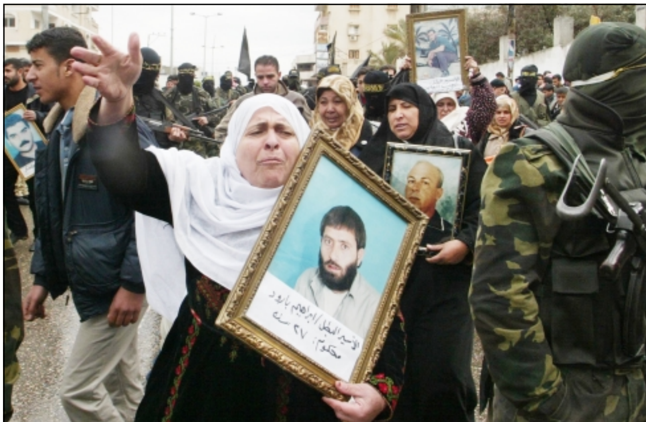
فلسطينيون يرفعون صور اقاربهم الاسرى اثناء مظاهرة احتجاج على استمرار اعتقالهم

اشرف عليها رجال امن امريكويون، واشادت الوزيرة بجهد ابو مازن لاتنزاع هدنة من الفصائل. عاجب بولش عن «عجابه»، بالتزام عباس بتمسكها بالقرار، وقال بلق اعجب بولش بالتزام رئيس الوزراء (بوش) اعطاه هذا اللقب «عباس بحارته اراهاب وبما يقوم به وبتمسكاته العنيفة، كما اعجبت ايضا بقيام اسرائيل بمساعدة الفلسطينيين على اجراء الانتخابات» (تفاصيل ص 5 و6)