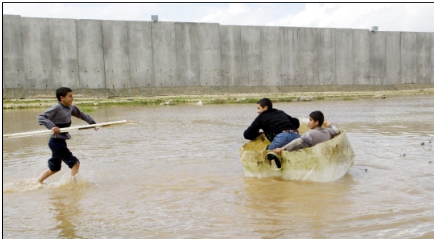
أطفال فلسطينيون يلعبون في مياه أمطار متراكمة بالقرب من الجدار الفاصل الإسرائيلي، خارج مدينة قلقيلية في الضفة الغربية

اننا نحمل الزعماء الذين يجتمعون في مصر الكثافة