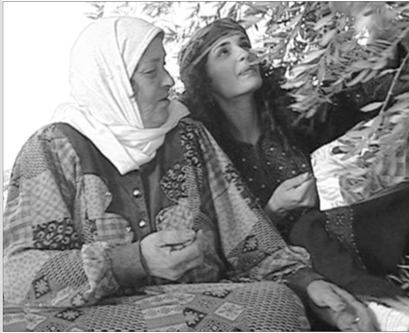
لقطة من فيلم «موسم الزيتون»

وفي مهرجان القاهرة السينمائي الدولي (الدورة السابعة والعشرون) في تشرين الثاني (نوفمبر) 2003 منحت لجنة التحكيم الجائزة الثانية لفيلم «موسم الزيتون» للفلسطيني حنا الياس الذي فاز أيضاً بجائزة أفضل فيلم عربي وجائزة الهرم الفضي وشركت 45 دولة في المهرجان الذي استمر 11 يوماً من خلاله 200 فيلم، وشارك في المسابقة الرسمية 18 فيلماً من 16 دولة، وقال رئيس لجنة تحكيم