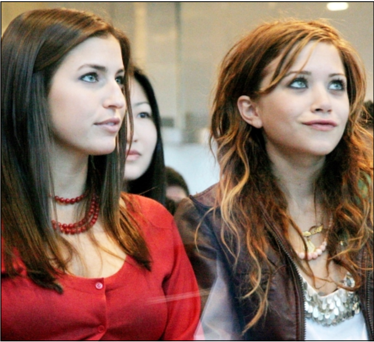
الممثلة الامريكية ماري. كيت اوسن (يمين) اثناء حضور عرض للزياء في نيويورك

حسب احصاءات المنظمة العالمية للرصد الجوية التابعة للامم المتحدة، وارتفعت حرارة سطح الارض بحوالي 0,6 درجة مئوية منذ اواخر القرن التاسع عشر حين كانت الثورة الصناعية في بدايتها في اوروبا، وتتوقع اللجنة الحكومية للتغير المناخي والتي تضم الفتي عالم وتقدم المشورة للامم المتحدة ارتفاعا اخر يتراوح بين 1.4 و5,8 درجة مئوية بحلول 2100. وحتى اثنى