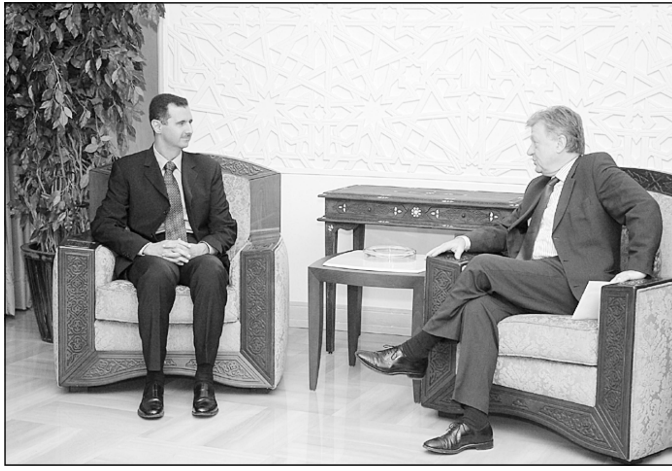
الرئيس الاسد التنا اجتماعه ببارك اوتي امس

وكان مصدر في وزارة الخارجية السورية أكد مصدر في 23 كانون الاول (ديسمبر) رغبة سورية في شراء تفاع الجولان التي تحتلها اسرائيل منذ 1967 عن طريق الامم المتحدة.