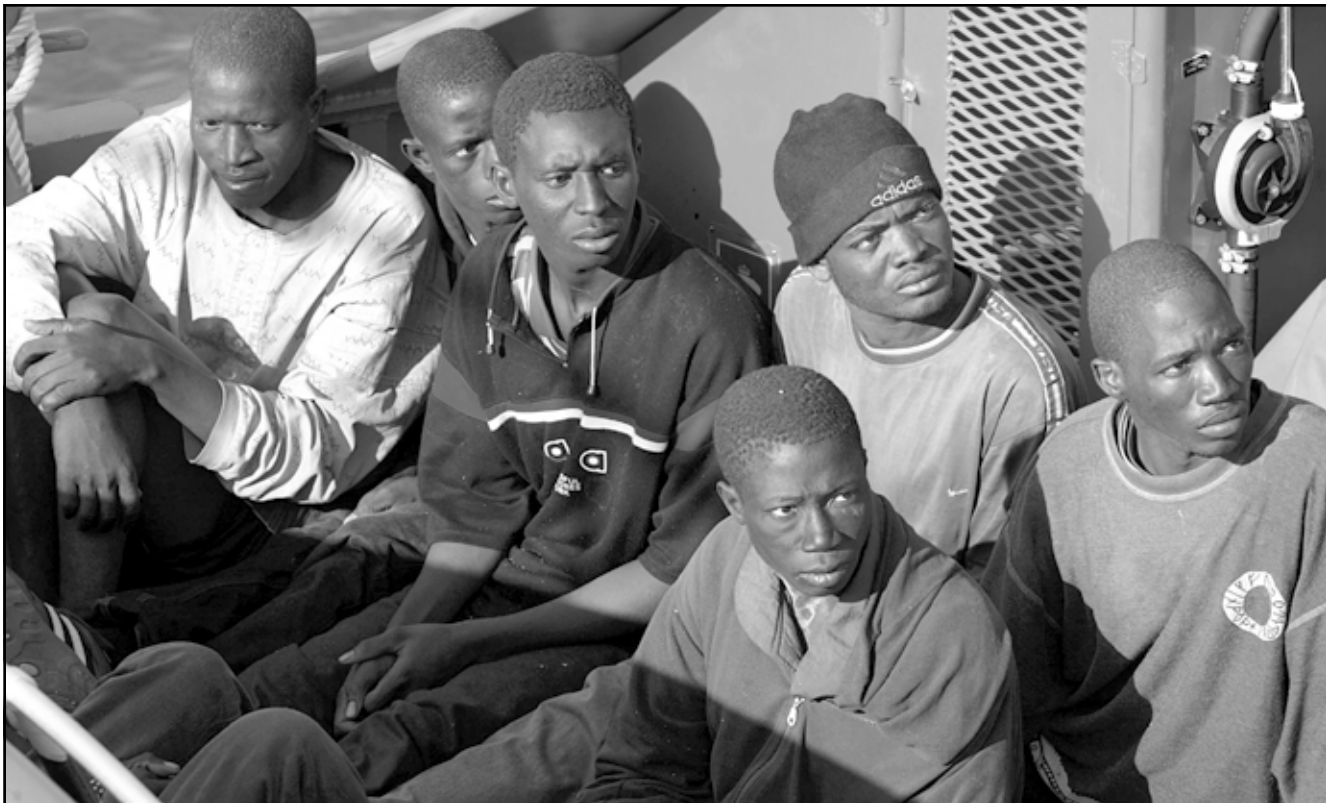
أفارقة ينتظرون مبرمهم على متن مركب للحرس المدني الإسباني اعترض سيبلهم أثناء محاولة التسلل إلى جزر الخالدات يوم الاحد وكان عددهم نحو 80 فردا