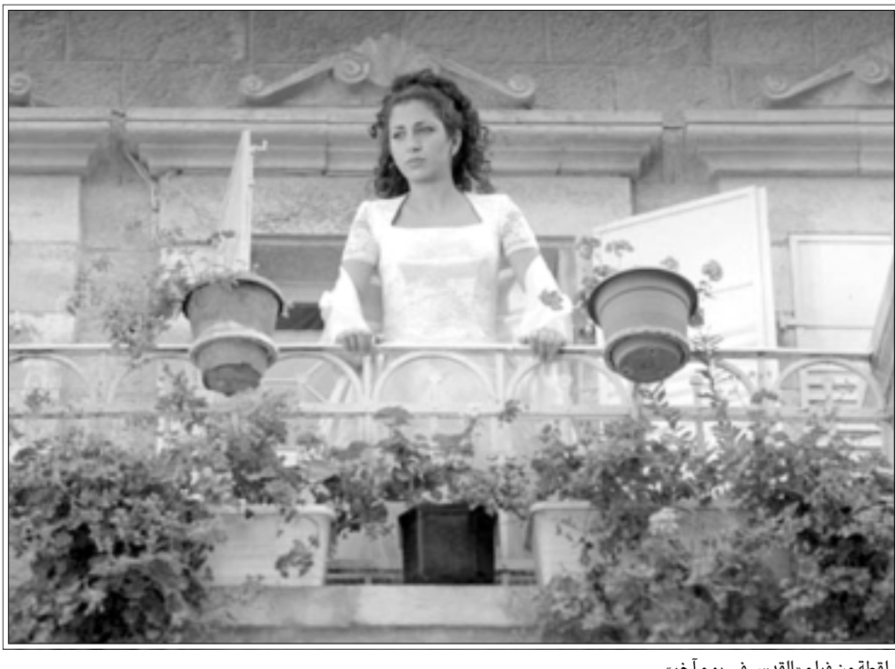
لقطة من فيلم «القدس في يوم آخر»