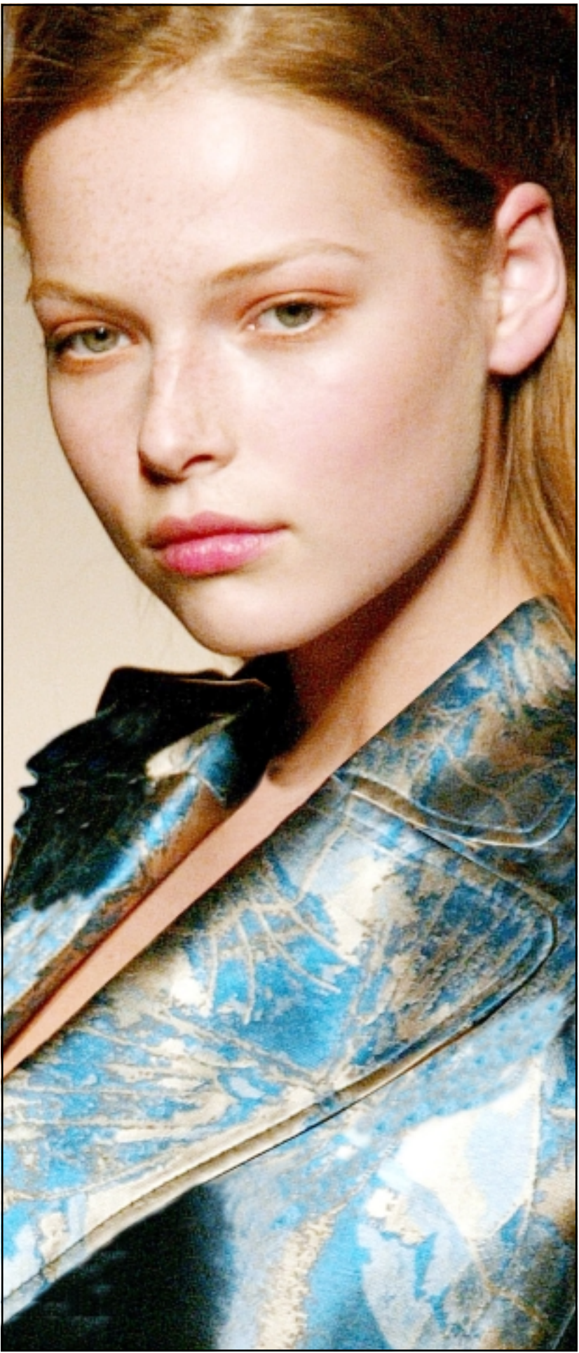
من مبتكرات المصمم الاسباني العالمي ميغيل بالاسيو شاركت هذه العارضة الجميلة في تقديم مجموعة من ازياء موسمي حريف وشتاء هذا العام في اسبوع الأزياء المقام حاليا في مدريد

وستنارا ان هذه التكنولوجيا اتاحت لها انفاذ ارواح 97 مريضا في العام 2003 حين كانت تراقب 65 سريرا. عادة تعتمد المستشفيات على المرزمات لملاحظة المشاكل عند اي مريض. وعند ذاك تنادي الممرضة احد الاطباء. يسارع الاطباء الى قسم العناية الفائقة للحص المريض. ويقول الدكتور ستيفن فرهام المدير الطبي لشركة ستنارا: «هذه التكنولوجيا تحضرن لي تلك المعلومات». ويستطيع فرهام بواسطة هذه التكنولوجيا ان يفحص تهويئة المريض وجهاز حقن المصل وأي شيء اخر في الغرفة، بل ان الكاميرا تنتج لي ان افحص رموش عينيه فيما تحدث الى العاملين في المستشفى.