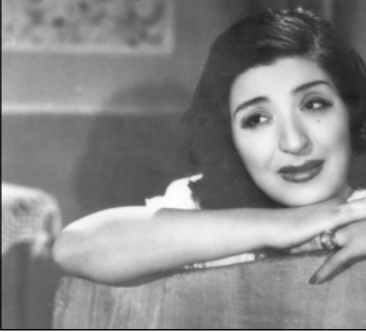
الفتاة عزيزة امير رائدة السينما المصرية والعربية.

■ تناول كتاب علم النفس التعلم كل ما يتعلق بالعملية التعليمية ومنها النظرية التعلم، والنظريات السلوكية، ويحسب الكتاب السابق التعلم هو كل تغير يصيب الانسان ليس فقط على الصعيد المدرسة، الفعلاج على سبيل المثال هو تعلم ان لجهة المرض النفسي او الاضطراب السلوكي، فالانسان عندما يتعلم اي مهنة جديدة حتى يتكيف ويخرج من اضطرابه، الكتاب السابق تختص بالنظريات وسيل تطبيقها، بينما مجالات التطبيق في كتاب علم النفس التربوي ليست محصورة