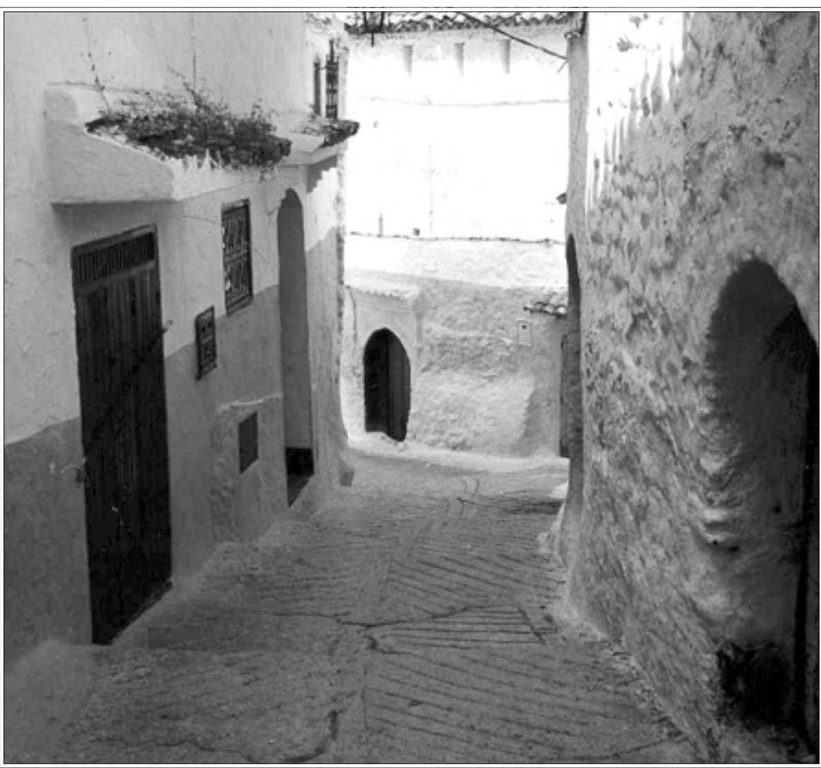
تعمير كل الأزقة، ومباشرة بعد قاعة السينما عند مدخل الأراج، وعندما ترسو البواخر الحربية في البنية، كان يقف جنديان أسودان بالأحزمة والسلاح الأمريكي عند باب الليقوم بالحارسا. وبعد الأراج، وعندما نغير الجلب الأندلسي، نلغى ذواتنا حين ديكور يشبه ما شاهدناه في الساتيريكون (iv) كنا نلتصق بحجاب النهار وسط حشود البحارة القادمين من إيطاليا، ويوغوسلافيا وأمريكا وأنداء متفرقة من العالم. كان الرجال والنساء يتحاققون في الأزقة ويشربون ويدخنون الكيف في غلابين طويلة ويتخللون ويرقصون في كل الأنحاء. وكنا نبدأ أحيانا بمشاهدة الحب التي كانت تلوح لناظرنا من فرجات الأبواب. كانت النساء يقفن على عتبات الدور وهن يرتديات اللباس المغربي ويعتفن بالمارين؛ ضجة مقابل غيلبون من الكيف، ضجة مقابل غيلبون من الكيف.

رائحة الدخول إلى شوارع الدير من جانب حلب. بعد نهاية فحوص الجامعة قدما أنا وزميلي خيخوس من حلب في باص الكرك للثق والسياسة يضع الشفيير بالبحارة أغنية بطيخة فنقول له ما هذا البطح الذي يعني: بطة وحمامة يوم اتكاونا بارض الدار! نستعمل الشوارع التي راحتها كأنها بخار صاعد من أجسادنا لا صوت تشهد زمان المدينة. ول حظ مالي شغل بالسوق! لكنه ابن مدينة تادف السائق الذي لا يستسيغ غناء أهل العراق يرقص رأسه على النبل والحمامة في أرض الدار. حتى جعلنا نامل الأغنية ثم جعلنا نرقص من رقصه. بالفعل أغنية جميلة. هكذا ركن ذوقنا ينحدر. لأن إيه. تفتح النافذة على غرفة نومها في ثوبا الشغاف فيزه زميلي رأسه هزة جزاوية وهو ينظر نحوها: قربان عينك أنا! وحياة الله... ثم يعني يقلد أشسور؛ وإذا نزلوا من هو دالي...قولي بن عمك. ويديك بقدميه وساقبه ديك البغال عند النافذة ديك عرس وحصاد فانه سترجوز مع بنت الدير. والله لن يرح من الدير إلا مع ابنة الدير لأنه كما قال لنا: رأسي هو «تتا» يعني خالص «لا لا» لن اذهب من دونها...!