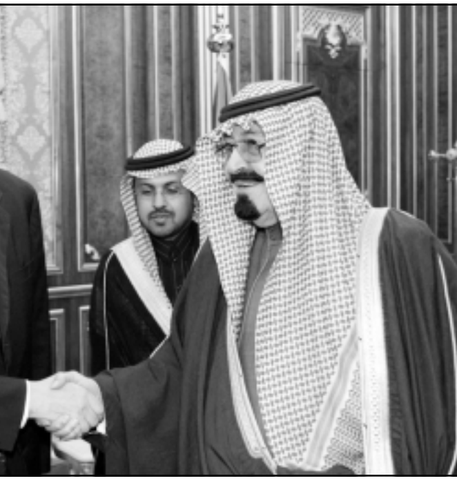
ولي العهد السعودي لدى استقباله وزير الخارجية الفرنسي