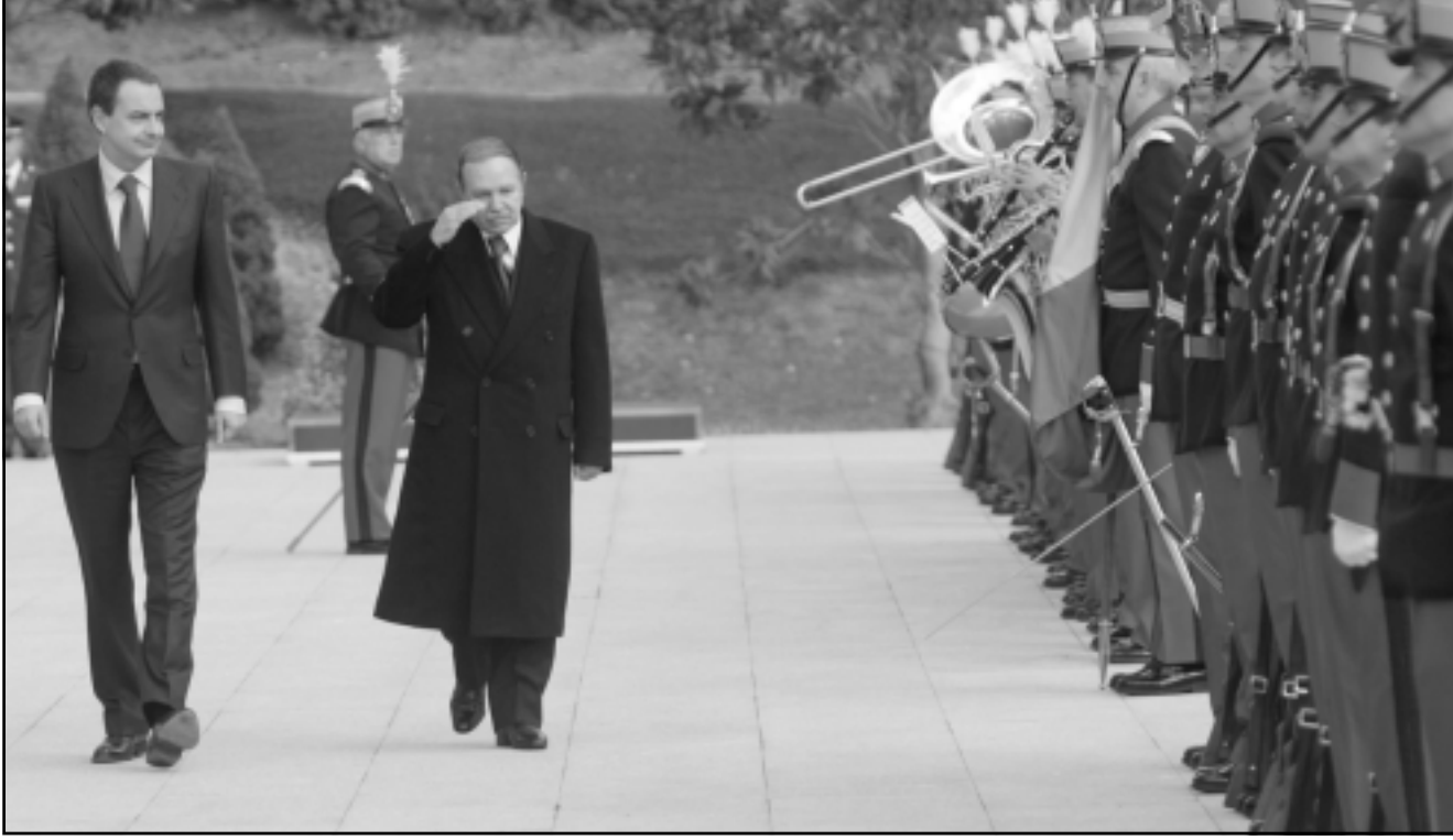
بوتفليقة مستعرضا فرقة عسكرية لدى وصوله إلى مدريد وإلى جانبه رئيس الوزراء خوسيه لويس سبتيرو

ويؤكد هذا الموقف أن اسبانيا قد تراجعت عن موقفها السابق الذي كان يدعو إلى حل في إطار اقليمي بين اسبانيا والجزائر والمغرب وفرنسا، وهو ما رفضته الجزائر دائما.