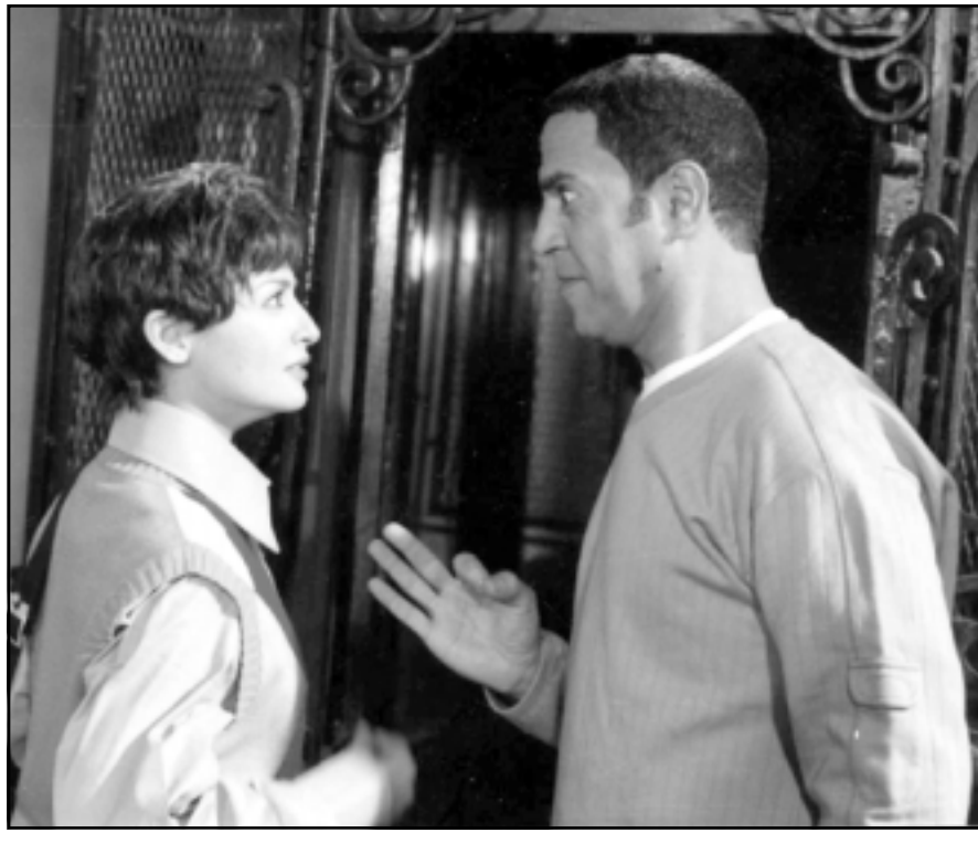
اشرف عبد الباقي وحنان ترك في لقطة من أحد افلامها

على السينما المصرية ويسعى البعض حالياً لتغييرها؟ ■ لا يوجد شيء اسمه النجم الأوحده.. هذه مسلمات لا وجود لها وتسيبت في حدوث حساسيات بين الناس لكن فيه حاجة اسمها مجهود يبذل من ممثل في عمل ما قلو كان دوري في عمل ما دوراً ثانياً أو أقل من البطولة فهل سيقابل الناس في الشارع ويقولون «ياللي عامل دور ثاني» أو «ياللي عامل دور مش بطولة» بالطبع لن يحدث ذلك.. لهذا يجب أن نزن الأمور بالعقل أكثر من ذلك حتى توجه الجمهور بالطريقة الصحيحة إلى الفن واستوعب الرسالة المطلوبة منه بدون السمات التي تتردد بلا فائدة.. أكد الفنان أشرف عبد الباقي أن المسرح الأولوية في حياته لأن بداياته كانت في مسرح الهواة منذ 25 سنة لأن فيه يجدره فعل مباشرة من الجمهور وعلى طبيعته بدون تدخل المونتاج أو الانتظار لعرض العمل كما يحدث في السينما والتلفزيون. عن رأيه في حاجة المجتمع للكوميديا فقط في الفن أم إضحاك الناس اعتبره هدفاً نبيلاً في حد ذاته.