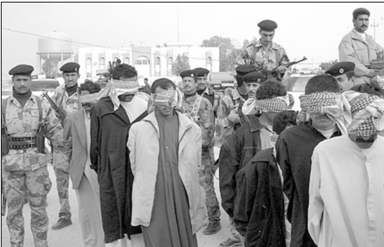
قوات الحدود العراقية تعتقل متهمين بالعمل مع المقاومة في التجف الجمعة

مع انه لم يتم خلال 22 يوماً من المحاكمة العسكرية، والاعلام للصحيفة، لم تستمع المحكمة الى كلمة واحدة من الضحايا. وجاءت الصور للمعتقلين لتشير الى انهم