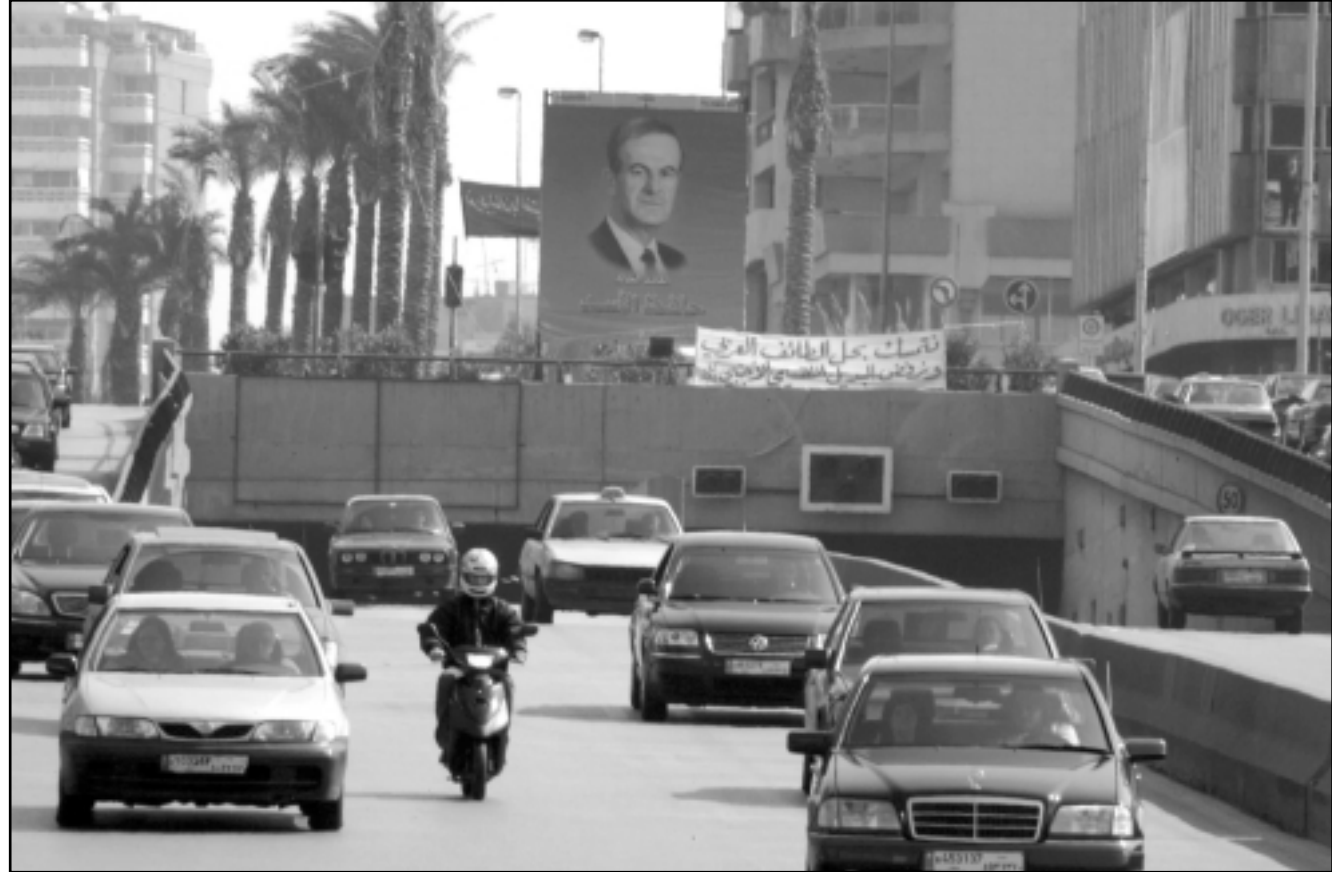
منظر عام من بيروت الغربية

منجزة بقيمة تبلغ حوالي 160 مليون دولار. وبلغ مجموع واردات اجارات العقارات في الوسط التجاري عام 2002 حوالي 14 مليون دولار مقارنة مع 10 ملايين بـ 600 ألف دولار عام 2001. اما في النصف الاول من عام 2003 فقد بلغ اجمالي مداخيل الاجارات 7 ملايين بـ 200 ألف دولار.