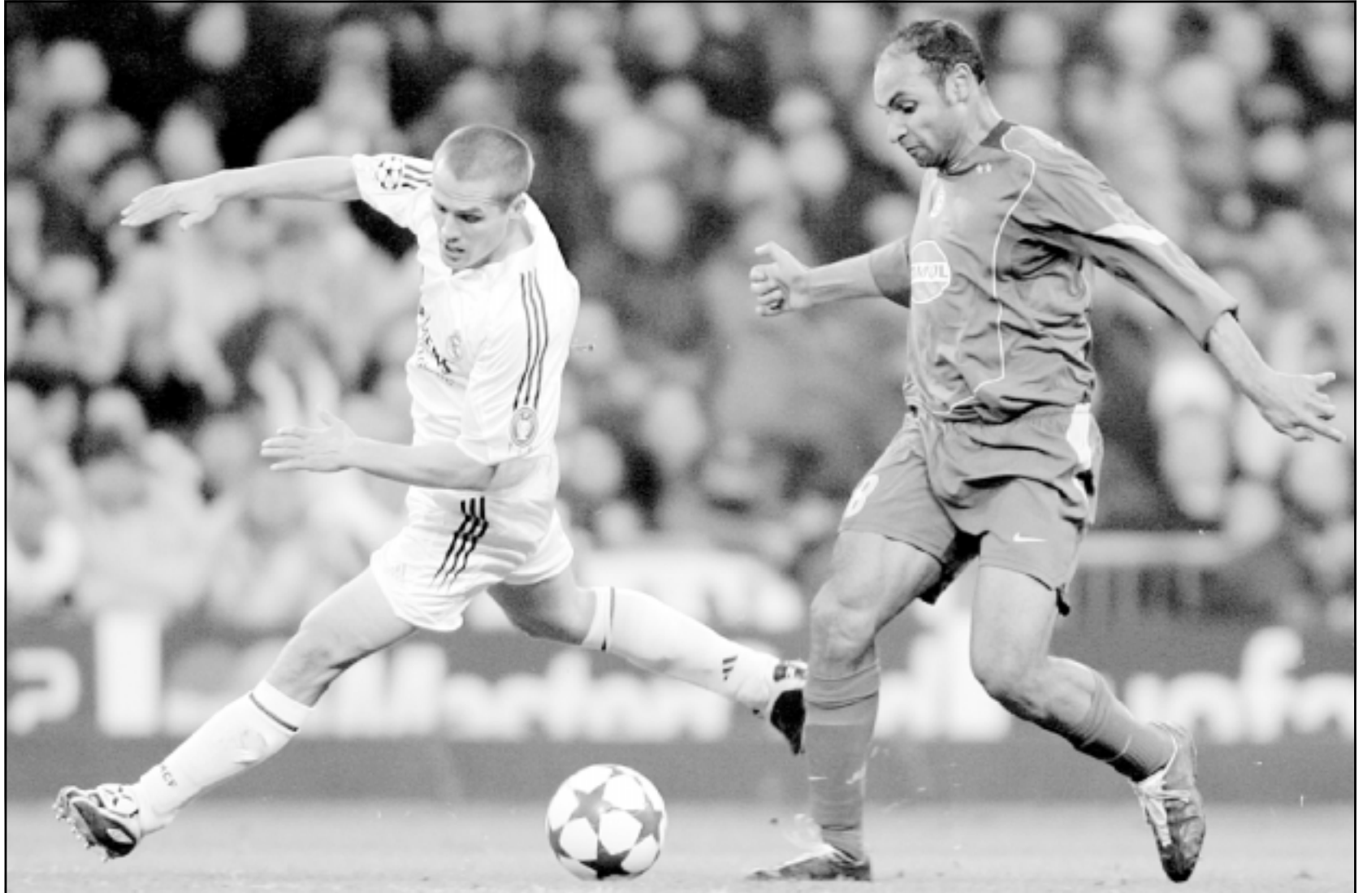
لقطة من إحدى مباريات ريال مدريد في الدوري المحلي الأوروبي مع ليفربول الانكليزي

ويلتقي فيرود برينم الثالث وحامل اللقب مع بوجوم السادس عشر في مباراة سهلة يسعي من خلالها الاول الى محو آثار خسارته المذلة امام ضيفه ليون الفرنسي صفر/3 الاربعة في ذهاب الدور ثمن النهائي للمسابقة الأوروبية.