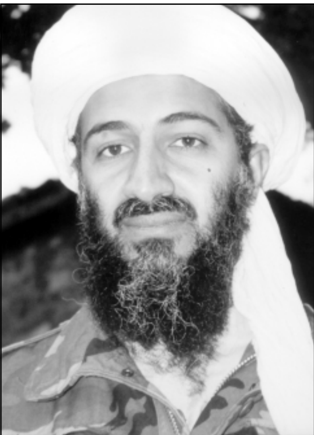
اسامة بن لادن

بفحص الرحلات الجوية السعودية هذه ولم تجدي اي دليل على رحيل السعوديين قبل ان يتم فتح الاجواء الامريكىة مرة اخرى للرحلات الجوية، كما لم تجدي اي تدخل «سياسي» من البيت الابيض في رحيل الشخصيات السعودية هذه، وان «اف بي اي» قد قام بفحص كل المغادرين بطريقة مرضية. والوثائق التي حصلت عليها المنظمة لا يبدو انها تناقض ما توصلت اليه اللجنة، ولكنها بحالتها الحالية تطرح الكثير من الاسئلة عن ما حدث فعلا. فهي مثلا تشير الى ان سجلات «اف بي اي» تتحدث عن مغادرة سعوديين بارزين على اكثر من رحلة جوية ولم يتم الحديث عنها في سجلاتها الرسمية، بما في ذلك رحلة على طائرة تجارية من بروفيدينس في 14 ايلول (سبتمبر) 2001، وهي الرحلة التي ضمت احد افراد العائلة الملكية في السعودية، كما تظهر الوثائق ثلاث رحلات مماثلة من مطار لاس فيجاس في الفترة ما بين 19 و 24 ايلول (سبتمبر). وكانت تحمل افرادا من العائلة السعودية المالكة. وكانت ادارة بوش قد اعادت فتح المطارات في 13 ايلول (سبتمبر) الا ان معظم