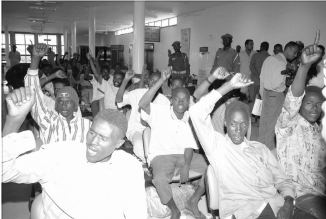
جنود سودانيون كانوا معتقلين لدى جماعة قرنق يختلون في الخرطوم بعد اطلاق سراحهم امس الاول

وتوجه اسماعيل الى ان مدة البعثة ستة اشهر قابلة للتجديد طيلة الفترة الانتقالية. واعترف الوزير بالوجود الدولي الكبير في السودان باعتباره دولة تزخر بالموارد من جهة نحو السلام لكنه قال ان الحكومة تسعى للاستفادة من هذا الوجود دون التأثير على السيادة الوطنية واستقلال القرار. ووجد اسماعيل رفض الحكومة القاطع لارسال قوات أممية الى دارفور غير قوات الاتحاد الإفريقي.