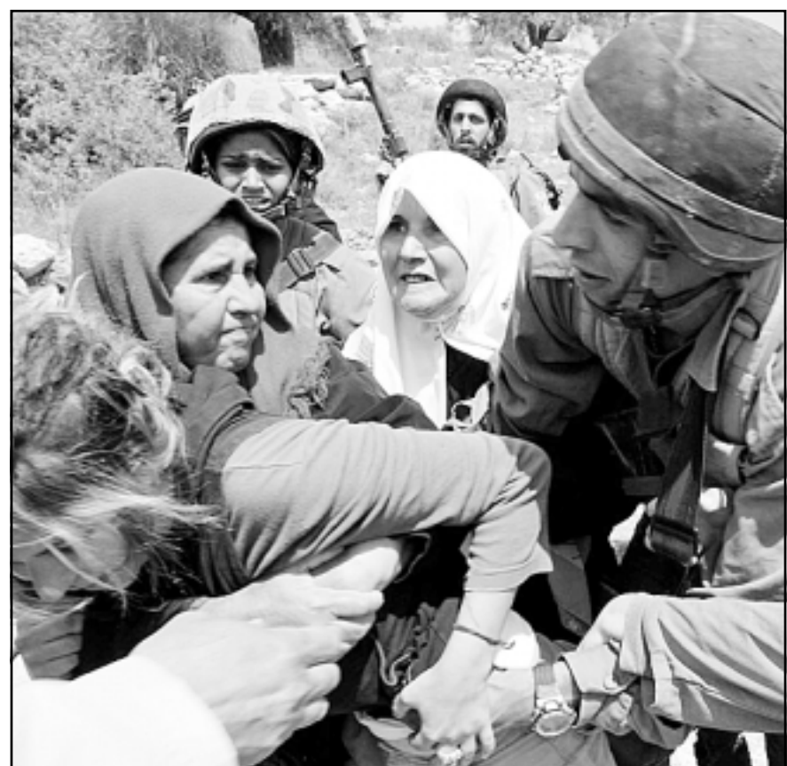
سيدات فلسطينيات يشتكين مع جنود اسرائيليين اثناء احتجاج على مصاربه الاراضي في الضفة

من بيروت منذ 19 آذار (مارس)، واكد ايرلي في بيانه ان اللبنانيين الحق في اختيار مستقبلهم السياسي بانفسهم في مناخ بعيد عن الخوف والتهديد عبر انتخابات مقرر في شهر ايار (مايو)، وأوضح ان «هذا الامر لا يمكن ان يتم طالما لا يزال الجيش السوري ومخابراته في لبنان ويشكلون فيه مصدر عدم استقرار». واكد انه «يجب على سورية ان تتسحب كليا وفورا من لبنان بموجب قرار مجلس الامن الدولي 1559».