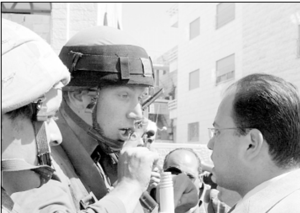
مجادلة كلامية بين جندي اسرائيلي وشاب فلسطيني خلال تظاهرة بمناسبة يوم الأرض في بيت لحم

الآن، والانتفاضة العنيفة التي يتلو الانفصال هو زمن الحديث عن كل شيء، ان نستغل ساعة الاستعانة، وان نضع على المائدة وإخفاق مساعي منع خطة الإخلاء هناك بصورة عامة. أريك شارون على ذرئته جماجم إضافية على حزامه. الأحاديث والعلامات المنشورة و مؤخرًا تثير الحواظر والنفوس، وقد تكون لديها ميول غربية للتحول إلى النوبة التي تحقق ذاتها لا قدر الله؛ غشوف المساجد وإغلاق الطرقات في البلاد وأغراق غوش قطيف بعشرات الآلاف من المناهضين للخطوة للوقوف كسور بشري كتفا على كتف في وجه القوات التي تتولى الإخلاء. المستوطنون والسياسيون يرسمون أمام أعيننا سيناريوهات وسوابق أكثر من السواد واحتمالات لاطلاق النار وتشويش الحرب الأهلية. «أنة ألعنة الجهاد سلتلقي فيما بعد»، منع سلك الدماء هذا الذي لا يوجد له داع يستلزم حشد طاقات السياسيين وعلى رأسهم شارون وكل ضباط الجيش ورئيس هيئة الأركان للتوجه إلى غوش قطيف للتحادث مع الناس هناك من بيت إلى بيت