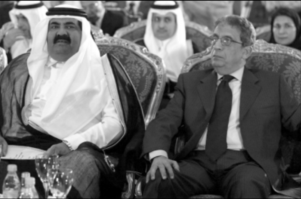
امير قطر ورئيس الجامعة العربية يتابعان اعمال مؤتمر الدوحة

وما لبثت في كلمة الشيخ حمد بن خليفة آل ثاني التي افتتح بها المنتدى مساء الثلاثاء عبارة تؤكد ذلك الترابح بين كل الغاوين، حيث قال أن الفلسطينيين اتفقوا باختصاصهم في الاساليب الديمقراطية والسير في التسوية السلمية في آن واحد، إن البحث عن الإصلاح والبحث عن السلام في المنطقة يأتيان معاً في سيرهما من دون تصادم أو تعارض، وقال في كلمته أن عملية الإصلاح والبناء الديمقراطي لا يمكن أن تنفصل عما يدور على الساحة الاقتصادية العالمية من تغيرات، لا سيما ما يتعلق منها بمسئوليات التنمية الاقتصادية في البلدان النامية، وانه الى ان التقدم الحرة والديمقراطية في الشرق الاوسط لا يمكن متداولاً قبل خمس سنوات كما في الحال السابق، فيما لم يستطع ان يضيف أصوات قليلة ترافقه في اعتقاد ان الديمقراطية في المنطقة، اما الآن فهناك من يرى ان التغيير بعد ان يقضى العقد المتنازع لهذا العصر قد بدأ بالفعل بعد ان انضم ركب الإصلاح بضمير جسد وبدات تلوخ في الافق ملامح ممكنة للتغيير، تحتاج من اصحاب الخبرات والرأي التي التحقيقات فيها واقتراح السبل الكفيلة بالحفاظ عليها وتعزيزها، استحباباً لتفطت اشواق المنطقة إلى حقوقها الطبيعية في الشعوب الطبيعية.