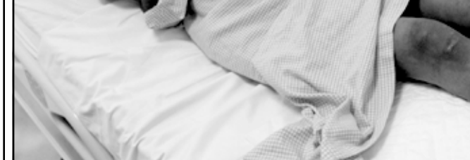
الخادمة اندونيسية كما ظهرت في المستشفى

لندن - الرياض - «القدس العربي»: أكدت وزارة الداخلية السعودية تشدد الحراسة على خادمة اندونيسية تم تعذيبها في مدينة الرياض.