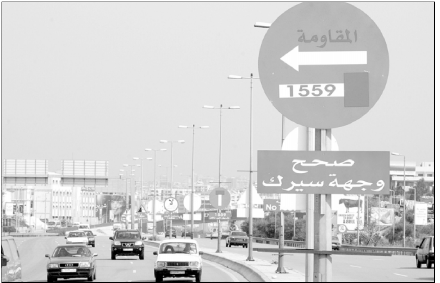
لافتات في شوارع بيروت تحت على رفض القرار 1559 ودعم المقاومة

■ بيروت - اف ب: أعلن الرئيس المكلف تشكيل الحكومة عمر كرامي أمس الأربعاء تأجيل تقديم اعتذاره لرئيس الجمهورية أميل لحود عن تشكيل حتى يبلغ بذلك حلساءه في لقاء مع اللجنة الذي يضم رسيين واحزابا وشخصيات موالية لسورية. وقال كرامي للحصافين اثر اجتماعه بالرئيس لحود «وضعته (لحود) في اجراء الاعتذار عن تشكيل الحكومة وسأبيلغه باعتذاري رسميا بعد اجتماع عن اللجنة» وردا على سؤال عما اذا كان هذا التأجيل يعني الماطلة قال كرامي «كلها