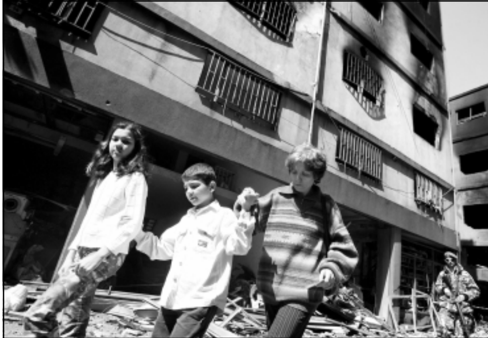
عائلة لبنانية تسير امام السوق التجاري الذي دمر في مخيطة الكسليك

بيروت - اف ب- يوبي أي : نفذت القطاعات التجارية في بيروت وجبل لبنان أمس الأربعاء اضراباً تحذيرياً ليوم واحد استنكاراً لموجة التفجيرات التي شهدتها لبنان بعد اغتيال رئيس الحكومة السابق رفيق الحريري في 14 شباط (فبراير) الماضي. صادر عن امانته العامة «التفجيرات المتتلفة التي طالت الاماكن السكنية والمراكز التجارية والصناعية والحقت اضراراً بالغة في الارواح والممتلكات، واساءت الى الوضع الاقتصادي وسيرة السلم الاهلي». ومن جهة اخرى أعلن رئيس مجلس ادارة جمعية المصارف اللبنانية جوزف طربيه ان المصارف العاملة في لبنان ستدعم يد العون الى المؤسسات التجارية التي تكبدت خسائر تقدر بعشرات الملايين من الدولارات جراء الانفجارات التي استهدفت شمال وشرق بيروت خلال الايام العشرة المنضية. وقال طربيه في مؤتمر صحافي عقده امس الأربعاء ان اضراراً مادية كبيرة لحقت بالمؤسسات التجارية في مناطق بشيرية المؤسسات لوظفها وعمالها وقطع ارزاق عيالهم. واضاف ان ذلك «يستدعي تضافر كل الجهود، وفي مقدمها جهد المصارف، لمد يد الدعم والنهوض مجدداً بهذه المؤسسات، واعادتها مع عمالها الى الدورة الاقتصادية، ضمن آليات التمويل المتعددة التوافق، ومنها دعم مؤسسة كفالات والتمويل المصرفي والسياسي والتوسط او داوئعهم من العملة الوطنية في العملات الاجنبية بعد اغتيال رئيس الحكومة السابق رفيق الحريري في 14 شباط (فبراير) بانفجار في بيروت. لكن قال ان القطاع المصرفي تمكن