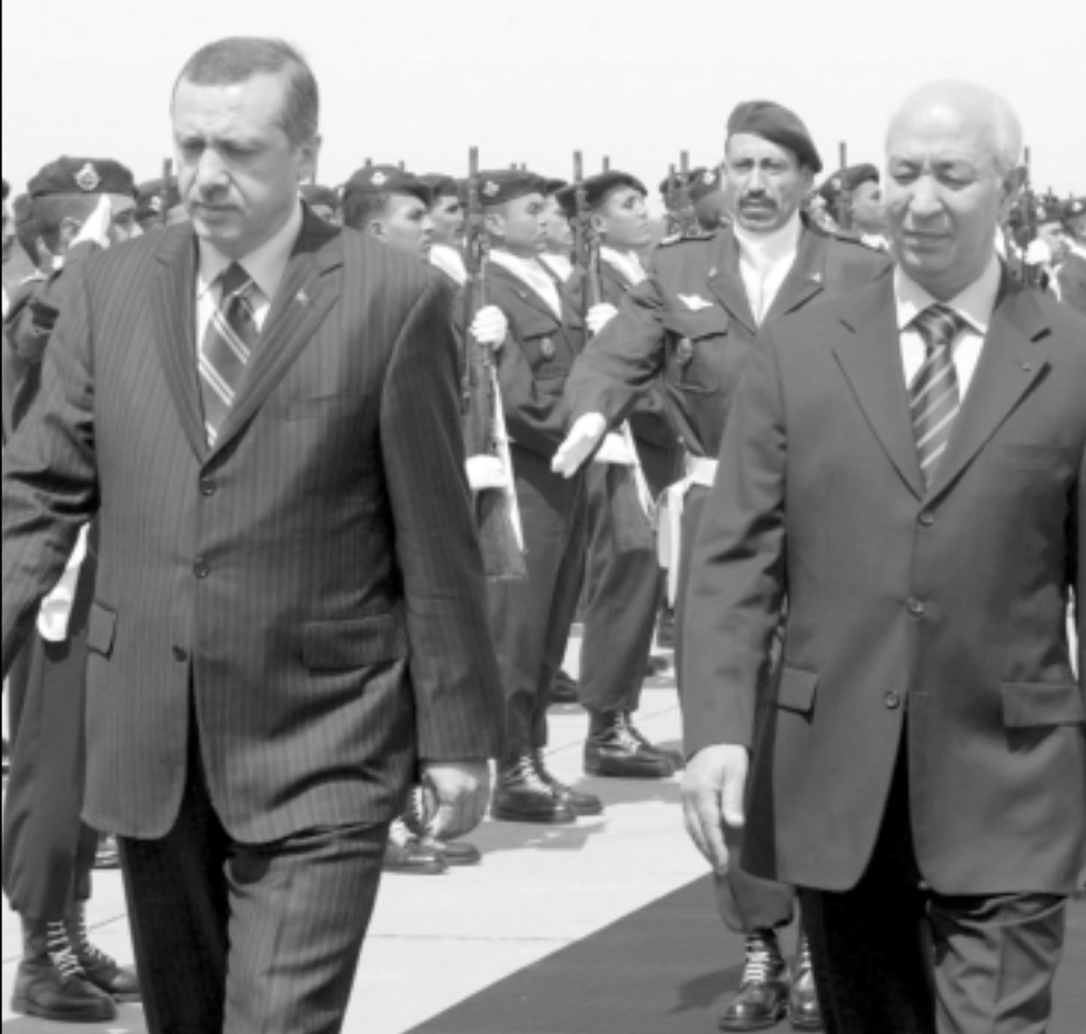
رئيس الوزراء التركي طيب رجب اردوغان وصل إلى الرباط أمس قادما إليها من تونس، وكان في استقباله نظيره المغربي ادريس جطر