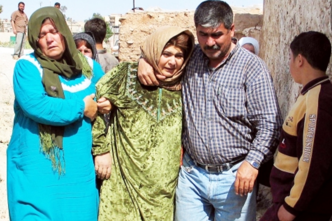
عائلة عراقية تبكي ابنتها التي قتل بمواجهات مع مسلحين في كركوك امس

بغداد - «القدس العربي» - من هاني عاشور: قال الرئيس العراقي الانتقالي جلال الطالباني انه سيرفض التوقيع على أي حكم باعدام الرئيس الخلع صدام حسين اذا ادين بارتكاب جرائم حرب، وفي مقابلة بثتها هيئة الاذاعة البريطانية امس الاثنين قال الطالباني انه يعارض عقوبة الاعداد من حيث المبدأ. وقال في مقابلة عبر الانترنت شخصياً لن «أوقع» وتابع «لكن كما تعلمون فان رئاسة العراق تتألف من ثلاثة اشخاص، وهو لاء الثلاثة يجب ان يتخذوا القرار. وبمجرد ان أمتعت انا عن التصويت، قد انهب لقتضاه عطلة وارتك الاثنين الاخيرين (نانجي الرئيس) يتخذان القرار». واثارت تصريحات الطالباني موجة من المخاوف بشأن منح دور اكبر للمليشيات الحزبية العراقية في الوضع السياسي الجديد في العراق بعد اعلانه عن ضرورة الاعتماد على المليشيات لواجهة العنف لعدم مقدرة الجيش العراقي وقوات الشرطة على مواجهته، وابدأ عدد من الحللين والسياسيين العراقيين مخاوف من هذه الدعوة التي تأتي مناقضة لدعوات سابقة لضم تلك المليشيات الى الجيش العراقي حيث تم العمل