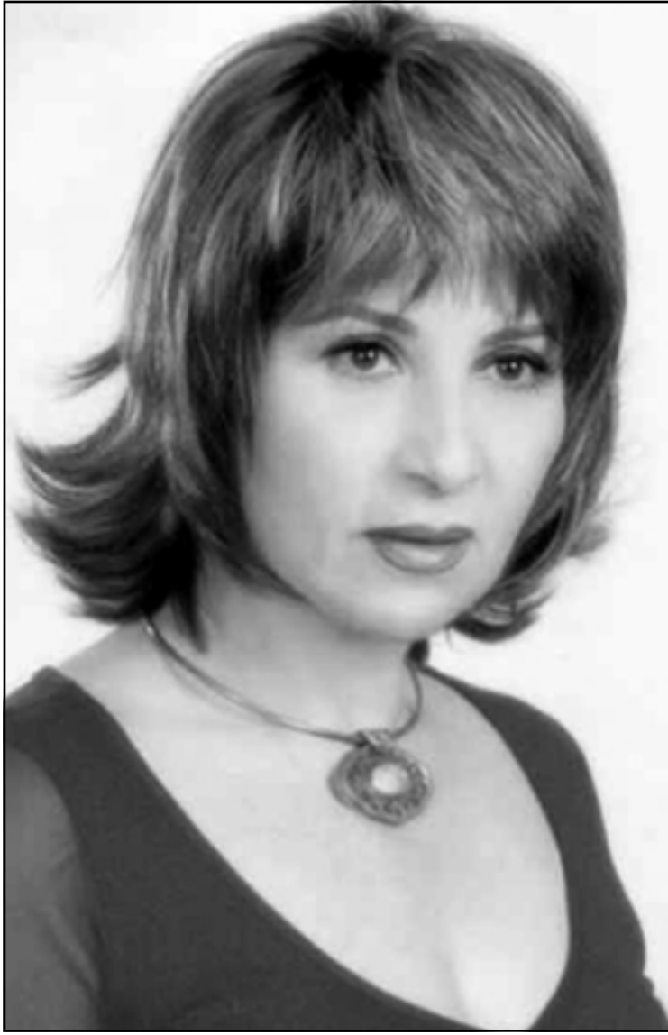
بوسي (القدس العربي)

باقي الاسواق المشتركة، خاصة وأن شعوب بلدان منطقة البحر الأبيض المتوسط قريبة ببعضها البعض في كثير من الأشياء في بعض العادات وفي التكوين النفسي وأيضا المشاكل الاجتماعية، كما أن للمنطقة أيضا تاريخ مشترك. ■ طبعاً رحيله عن خسارة كبيرة، لكن ما يعزينا فيه وجود أعماله بيننا ورغم ذلك فهو في نظري لم يموت، لأن الفنان الجيد لا يموت وأحمد زكي رحمه الله كان فنانا بكل ما تحمل الكلمة من معنى.