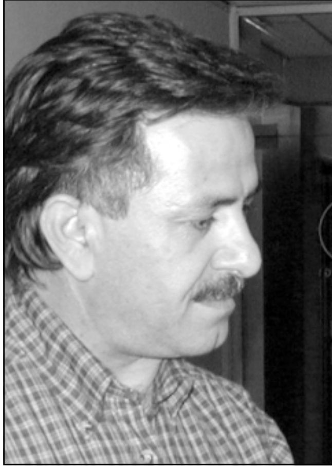
جمال أمين (القدس العربي)

لا تكفي حنين العرب لأشتعال فصول التعب وانكماش الزمان بقبضة كئي سؤالا بغير جواب وهل يكفني بعد سيول التعب فما دامعتي يرعد سيول التعب راودتني الصغافير بن بسمة الصبح أقبل فجر البراءة في بوح سري وفي مشتتها وانتظار الشغب. من طراجة روح العرب وتستمر الحلم أكبر من يسمتي وأكثر من دمعتي لانتشار الطرب يا لها؟ ما بها؟ إنني قاب قوس من الاحتراق على لهب الصمت أيشعق في، في حضور النقاء، الأب؟ وما سر طمعتها في التعب؟ ما سر مستها في العقب؟ وما سر بريق انفجار بديها؟ على ساحل الصمت. غير انتظار وثب أحبك حين تمام المحيطات عن إثرها ويوارى التراب أشتعال الغضب تدوي جروحاً بجرح فلا تشيع النار دون الحطب