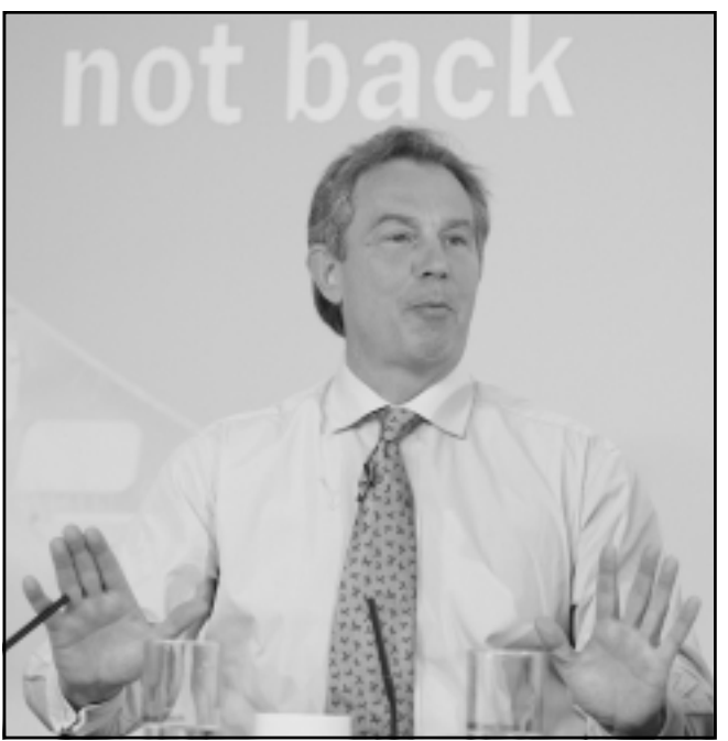
يلير يتحدث خلال حملته الانتخابية

وقال تانغ قوله «شامبوورا» انه في السنوات الاخيرة تراجع الجانب الياباني في التوجه التاريخي ومسألة تايوان وفق ثقة الصينيين.