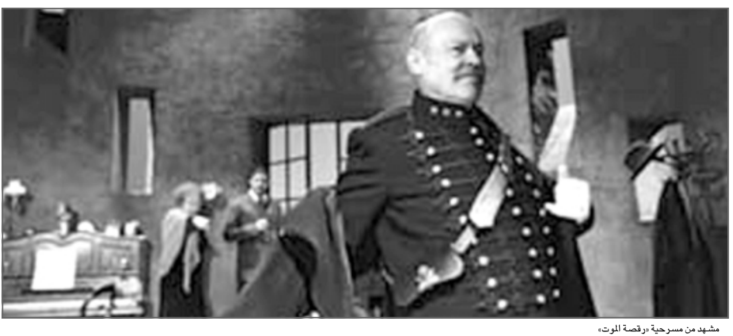
مشهد من مسرحية «رقصة الموت»