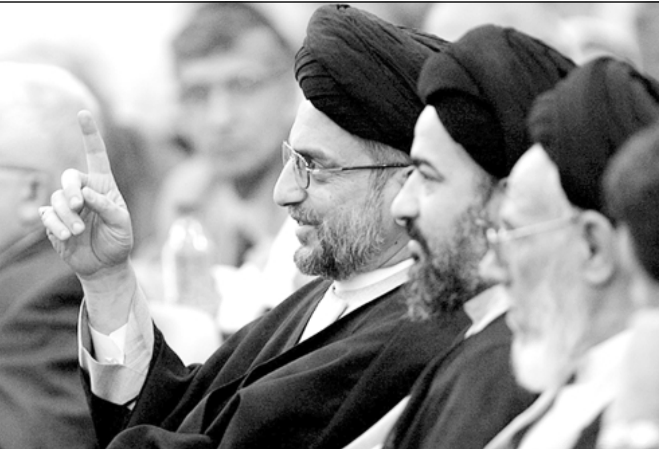
السيد عبد العزيز الحكيم زعيم المجلس الاعلى للثورة الاسلامية اثناء حضوره جلسة برلمانية في بغداد امس

ويשמّل التحرك الجديد، ايضا تقديم اي جندي او عامل منهم باخطاء في العهد الماضي للحماكمة، وتقلت الصحيفة عن حسين الشهرستاني، الذي كان باحثاً نووياً في عهد الرئيس السابق ان خطة تقوم القائمة الشيعية الموحدة باعدادها تقدم تفاصيل عن طريقة التعامل مع الاعضاء الذين عملوا مع العهد السابق، كما تشمل الخطة تقديم قادة المقاومة السننية للحماكمة. ويعتبر الشهرستاني الذي يشغل منصب نائب رئيس الجمعية الوطنية، الخطة القادمة نوعاً من «تحقيق العدل»، وتمثل تصريحاات الشهرستاني، نبرة جديدة تخالف النهج التصلحية التي قدمها عدد من قادة العهد الجديد، الذين يحاولون نزع فتيل المقاومة من خلال ادخال السننية الذين قاطعوا الانتخابات في العملية السياسية، عما دعا الرئيس العراقي جلال طالباني للعبو عن بعض قادة المقاومة والتفاوض مع القادات السننية. ويقول الشهرستاني ان لعب الوراء الاوضاع في التحالف الشيعي، يصغفته مسقربا من اية الله علي السيستاني، الرجعية الشيعية المعروفة ان النقيضة في الكيفية بانها القاعة وليس الحوار والتفاوض، حيث قال «لا اعتقد ان المقاومة يمكن هزيمتها