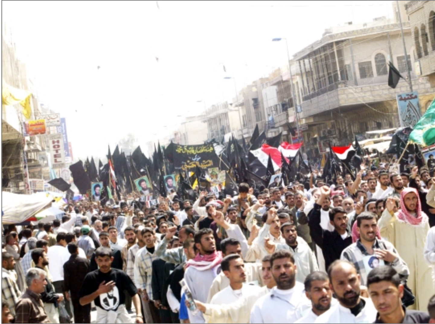
متظاهرون عراقيون يسيرون في حي الكاظمية في بغداد تأييداً للإمام الشيعي محمود الحسني، الذي طالب مجدداً بانسحاب قوات الاحتلال من العراق (اف ب)

مصلحة جميع أبناء العراق، عرباً واكراداً وفرساً وتركمائاً وكافة الاقليات، ان تجد سببلاً للتفاهم والاحترام المتبادل. العراق لكل ابناءه، والعراق سيبقى كما كان خلال اكثر من الف سنة جزءاً لا يتجزأ من الأمة العربية وسيبقى ايضاً صديقاً لجيرانه في ايران وتركيا.