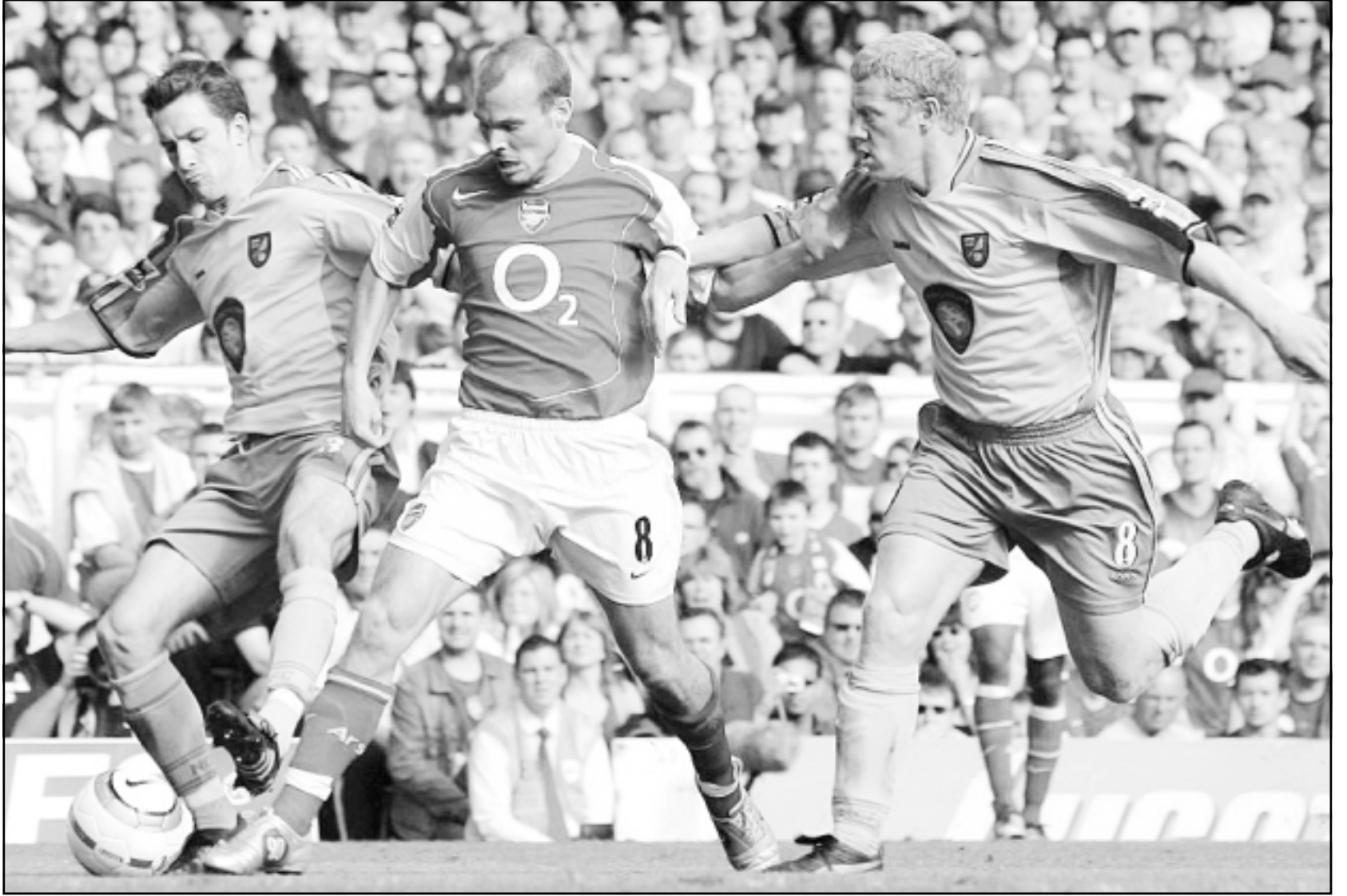
لقطة من إحدى مباريات ارسنال (صورة من الأرشيف)

بخوضها فريقه ضد تشلسي بالذات في المرحلة الرابعة والثلاثين من بطولة انكلترا. وقال ارسن فينغر مدرب فريق ارسنال الانكليزي لكرة القدم ان المهاجم الفرنسي تييري هنري سيغيب على الارجح في مباراة غدا الاربعاء بسبب اصابة اعلى الفخذ. وجلس هنري الذي يتصدر قائمة هدافي الدوري الانكليزي هذا الموسم برصيد 25 هدفا على مقاعد البدلاء في المباراة التي فاز فيها ارسنال على بلاكبيرن روفرز 3/0 وصفر في الدور قبل النهائي في بطولة كأس الاتحاد الانكليزي يوم السبت الماضي، وقال فينغر لوقوع ارسنال على