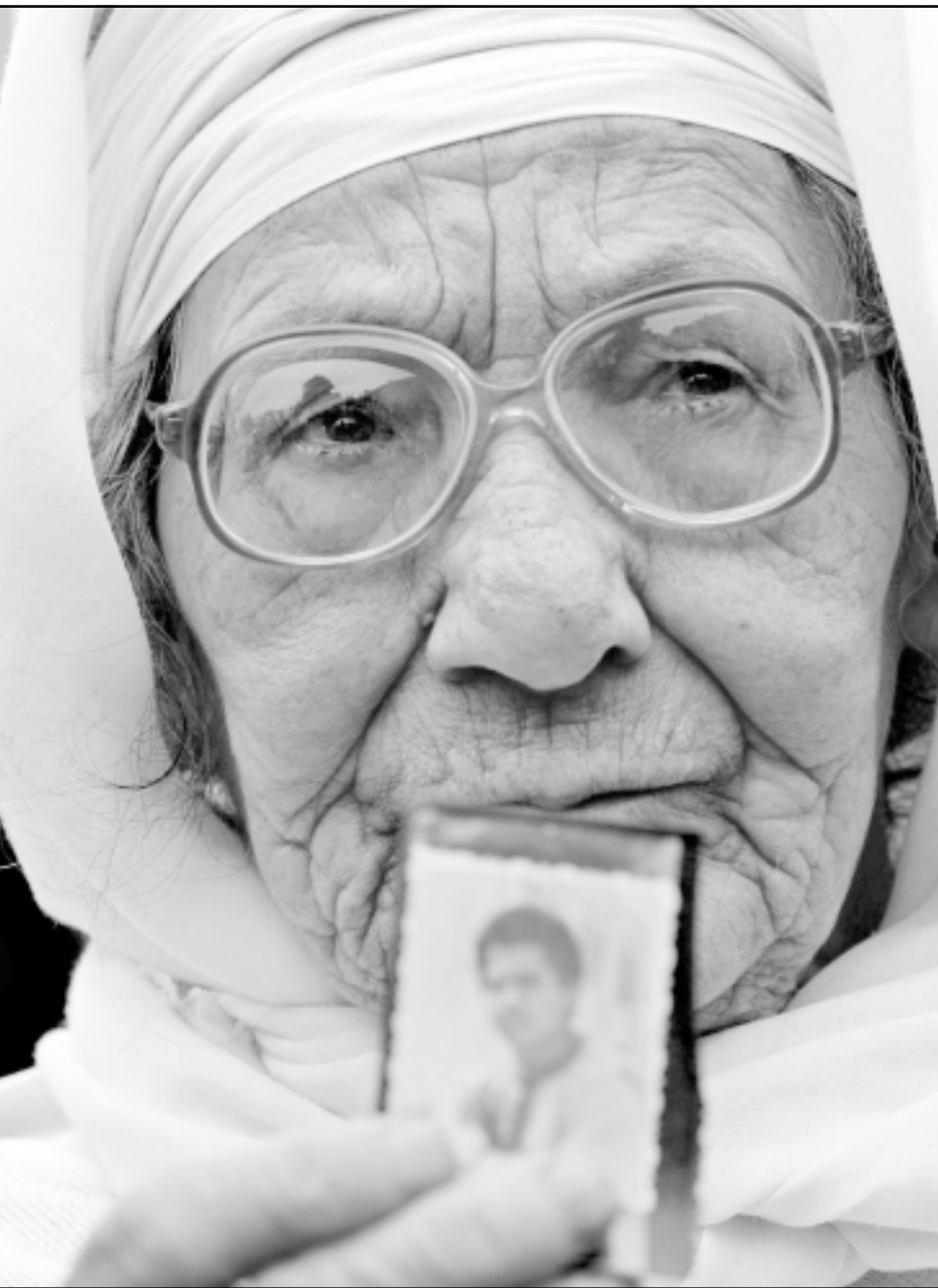
سيدة فلسطينية تشارك في مظاهرة تضامن مع الاسرى في رام الله امس