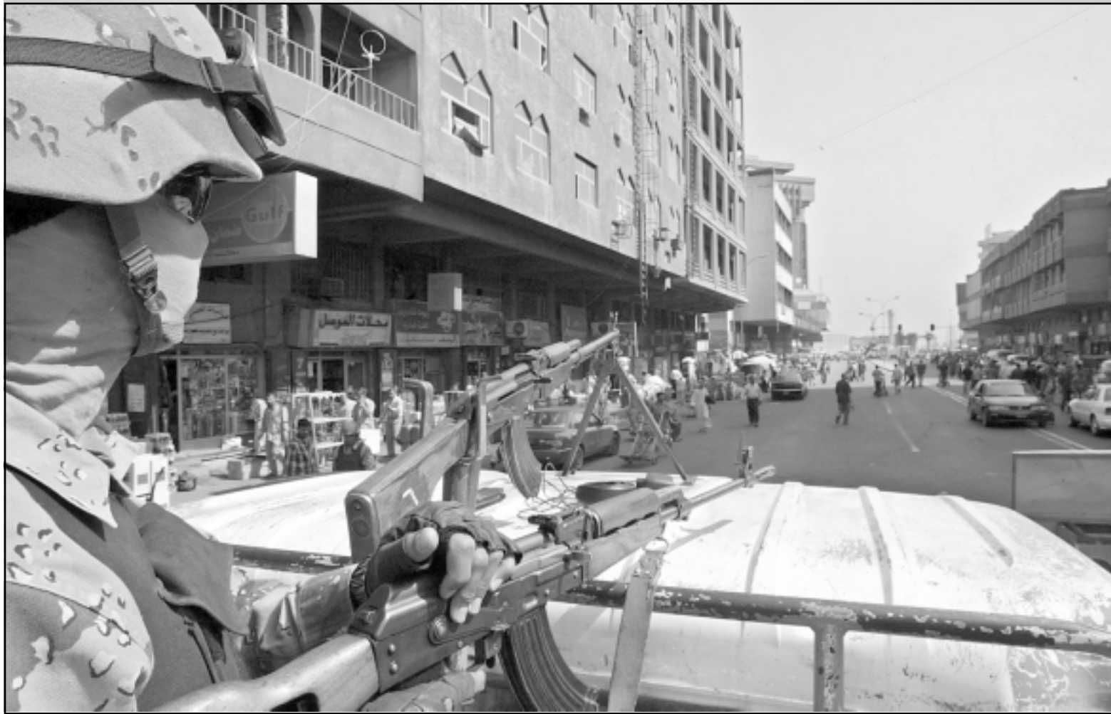
جندي عراقي على ظهر سيارة مدرعة يجول في شوارع بغداد

الكردى - الإيراني يملك مفاجآت للعراقيين. الحكومة الجديدة ذاتها ستكون اول من يفاجأ بعد تشكيلها بأنها حكومة لا تملك من الحكم الا الاسم. فهي لن تقوى على تقديم الخدمات ولا على توفير الامن للشعب. مهما سوف ينحصر في تأمين أمن اعضائها وأمن السرقات التي ما برحوا يرتكبونها حتى يقضي الله امرا كان مفعولا.