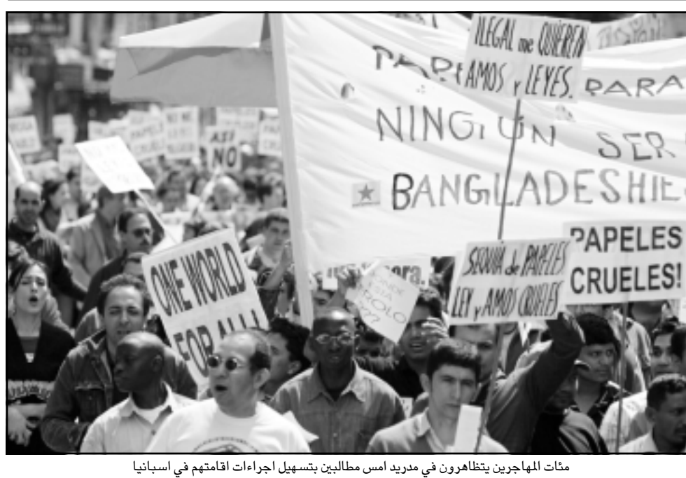
مئات المهاجرين يتظاهرون في مدريد اسام مطالبين بتسهيل اجراءات اقامتهم في اسبانيا

كما ادان قائد جبهة تحرير الساقية الحمراء ووادي الذهب (بوليفاريو) محمد عبد العزيز «الممارسات القمعية» للحكومة المغربية في حق الصحافي لان ذلك من شأنه توجيه وجهها للصحافيي نشرتها في رسالة وجهها للصحافة على موقعها في شبكة الانترنت عبر عبد العزيز عن «تضامنه مع تضال (علي الرباط) من أجل الحرية في مواجهة الحملة العنيفة التي تشنها ضد الحكومة المغربية مستخدمة جميع الوسائل». وأكد عبد العزيز أن «هذه الممارسة التي تتعارض مع شععارات الديمقراطية والاحترام من الدول الإنسانية التي تعلنها الرباط، لا هدف لها سوى إسكات صوت الحقيقة وفتح حرية التعبير». وأضاف أن «عالم اليوم لم يعد يقبل مثل هذه الممارسات التي تعود إلى القرون الوسطى». وصدر الحكم في حق الصحافي المغربي المغربي عن المحكمة الابتدائية بالرباط في 12 نيسان (أبريل) بعد اتهامه «بجحفة الجحفة» في بيان شكوى رفعها