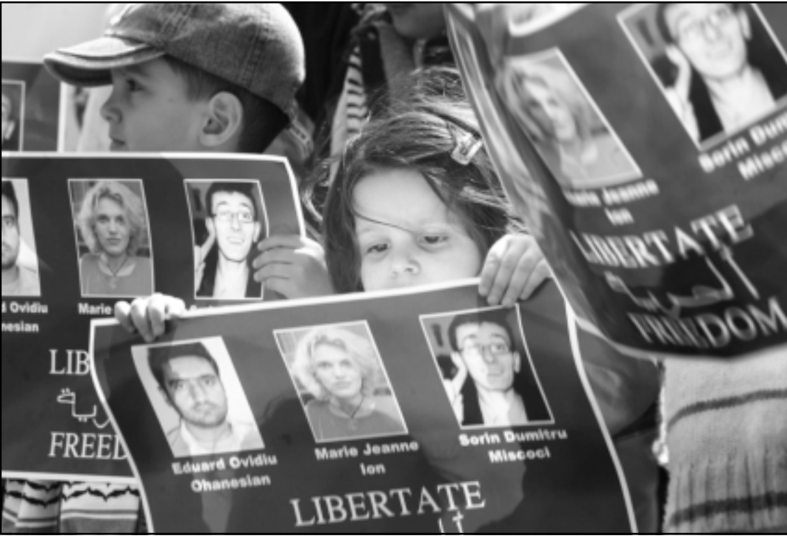
طفلة من أبناء الجالية العربية في رومانيا تحمل منشور مطالب بإطلاق الصحافيين الرومانيين المخطوفين في العراق

الوطنية في عراقنا الجريح.. لقد كانت رسالة الاحتلال إضافة إلى عداوتهم وتدمير العراق توجيه طعنة إلى رواد الشرق للصفحة الإعلام العراقية وإسقاط صوت الشعب الهادئ والحقيقية، وإغلاق فترة احتلالهم للعراق قتلوا عدداً من الصحافيين على أيدي القلعة من القوات المحتلة. وزيادة واحدة إلى مقره النقابة المجاهدة يرى ويسمع ما لحق لأعضاء هذه المنظمة الإنسانية والوجه المشرق للمجتمع العراقي.. منظمة المنطق والحس الوطني من الأمل وجرأتهم الاحتلال. ووجدنا في مقر النقابة أصوات الجهاد والتحرر من سيطرة دول الاحتلال صولت عالمياً مطالبة بالحريّة للصحافة الوطنية العراقية، والمؤمنة أنه في ظل وحدة الصحافيين والإعلاميين سيحقق حلم كل الخالصين في عراقنا الجريح الذين يطالبون بإطلاق سراح وزارة الإعلام.. ووزارة كل الخالصين في عراقنا الجريح.