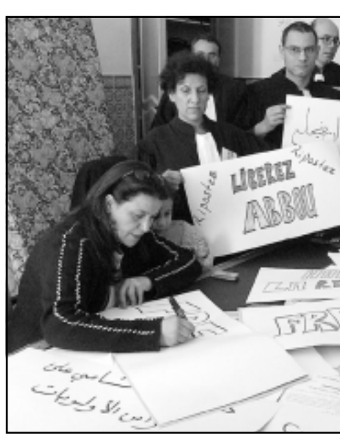
محامون تونسيون يرفعون لافتات تطالب بإطلاق زميلهم

الجزائر - رويترز - أف ب: قالت جماعات معنية بحقوق الإنسان إن حرية الصحافة تتعرض لهجمة جديدة في شمال أفريقيا بعد أن قضت محاكم جنائية في الجزائر والغرب بمعاينة صحافيين بالسجون ومنع آخرين من ممارسة عملهم لادانتهم في قضايا تشهير. وتدعو منظمة مراقبة حقوق الإنسان «هيومن رايتس ووتش» و«مراسلون بلا حدود» ومنظمات أخرى الحكومات إلى احترام حرية التعبير بعد شهر عبس بالنسبة لوسائل الإعلام في المنطقة. وقالت وزارة الخارجية الأمريكية في تقريرها السنوي عن الجزائر أنها شهدت تراجعاً في حرية الصحافة خلال العام الماضي، ووصفت منظمة مراسلون بلا حدود التي تتخذ من باريس مقرها لها بالفرامة والحرمان من مزاولة الصحافة لدرجة شغور بسبب مقال كتبه حول منطقة الصحراء الغربية المتنازع عليها. وقال مصدر في وزارة الخارجية الأمريكية في 28 نيسان (أبريل) أمام القضاء في تونس بسبب كتاباته المناهضة للحكومة التي انتقدت. وحكم على رئيس التحرير الجزائري المنتقد للحكومة محمد بن شيكو وأربعة من صحافييه بالسجون يوم الثلاثاء الماضي بعد خسارتهم قضية سب وكذف رفعتها وزير النفط الجزائري، وفي وقت سابق من هذا الشهر عوقب الصحافي المغربي البارز علي الرباط وهو أحد المتشددين بشدة للظلم الملكي في بلاده بالفرامة والحرمان من مزاولة الصحافة لدرجة شغور بسبب مقال كتبه حول منطقة الصحراء الغربية المتنازع عليها. وقال مصدر في وزارة الخارجية الأمريكية في 28 نيسان (أبريل) أمام القضاء في تونس بسبب كتاباته المناهضة للحكومة التي انتقدت.