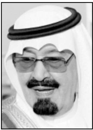
الامير عبدالله بن عبدالعزيز

السعودية النفط وتدفقه لأمريكا فيما تتكفل واشتغل بحماية الملكة عسكريا. ولكن السفير قال ان السعوديين لا بد وان يقوموا بمخصص في استطلاعات الرأي العام، هو فرانك لوتنز قوله ان هناك علاقة طردية بين ارتفاع اسعار النفط وكراهية الامريكين للسعوديين. ويترجم خبير الاستطلاعات قائلا «إذا كنا حذرا فلماذا يرفعون اسعار النفط، وإذا كنا حذرا فلماذا يرفعون اسعار النفط، وإذا كنا حذرا فلماذا يحاولون قتل الامريكين». وكان بوش قد اتهم السعوديين في الاسبوع الماضي انهم لم يفعلوا الكثير من أجل توفير المطلوب من النفط. وقال بوش «اعتقد انهم يخترقون من المعدل العام وتريد جوابا من الحكومة عن ماذا يعنون بقدر انهم الزائفة». ومع كل التصريحات المثيرة حول تربي العلاقات السعودية- الامريكية الا ان روبرت جوردان السفير الامريكى السابق في السعودية يقول لا يتوقع تغيير في العلاقة بين الطرفين حيث يوفر الامريكيون الأمن للسعوديين مقابل حصول الولايات المتحدة على احتياجاتها من النفط.