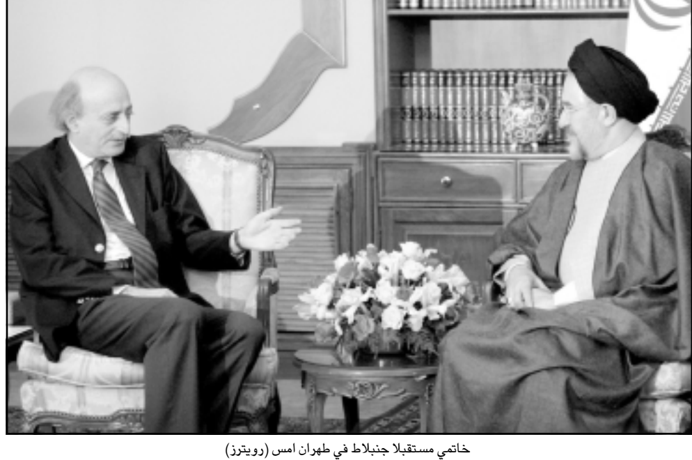
خاتمي مستقبلاً جنبلاط في طهران امس

دوما خاتمي المسلمي التي التيقظ «ازاء مؤامرات الاعداء الذين يريدون توجيه ضربات الى المنطقة والى سورية ولبنان»، واستقبل كمال خرازي وزير الخارجية الإيراني، جنبلاط السبت وشهد ايضا على امية «الوحدة بين مختلف الجهات والجموعات اللبنانية»، وقال خرازي، «ان الولايات المتحدة تسعى الى خلق أزمة في لبنان للاستفادة منها بينما يجب ان يحل اللبنانيون مشاكل بلدهم بأنفسهم». من جهته، أعلن الناطق باسم الخارجية الإيرانية حميد رضا اسفندي ان زيارة جنبلاط تأتي في إطار «سياسة الجمهورية الاسلامية التي ترغب بالحوار مع مختلف المجموعات اللبنانية سواء كانت في الموالاة او في المعارضة»، وقال اسفندي في لقائه جنبلاط المؤثرة. جنبلاط شخصية مؤثرة في لبنان وان زيارته مهمة، ان ايران تشجع اللبنانيين على المحافظة على وحدتهم وعلى التعاون والحذر من مؤامرات الكيان الصهيوني التي لن يوفرت فرصة للاستفادة منها».