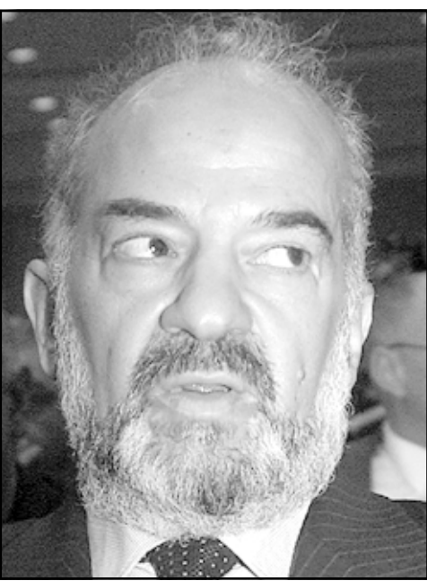
د. إبراهيم الجعفري

وتحت هذا العنوان كتبت صحيفة الزوراء الصادرة عن نقابة الصحافيين العراقيين موضوعاً جاء فيه: يخطئ من يظن أن الإعلام الحر المستورد إلى العراق سيحقق طائرناوات الإنسانية والوجه المشرق للصحافة الوطنية العراقية، والمؤمنة أنه في ظل وحدة الصحافيين والإعلاميين سيحقق حلم كل الخالصين في عراقنا الجريح الذين يطالبون بإطلاق سراح وزارة الإعلام.. ووزارة كل الخالصين في عراقنا الجريح.