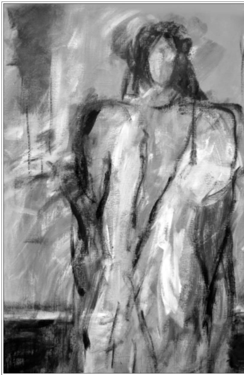
فوزي الدليمي (القدس العربي)