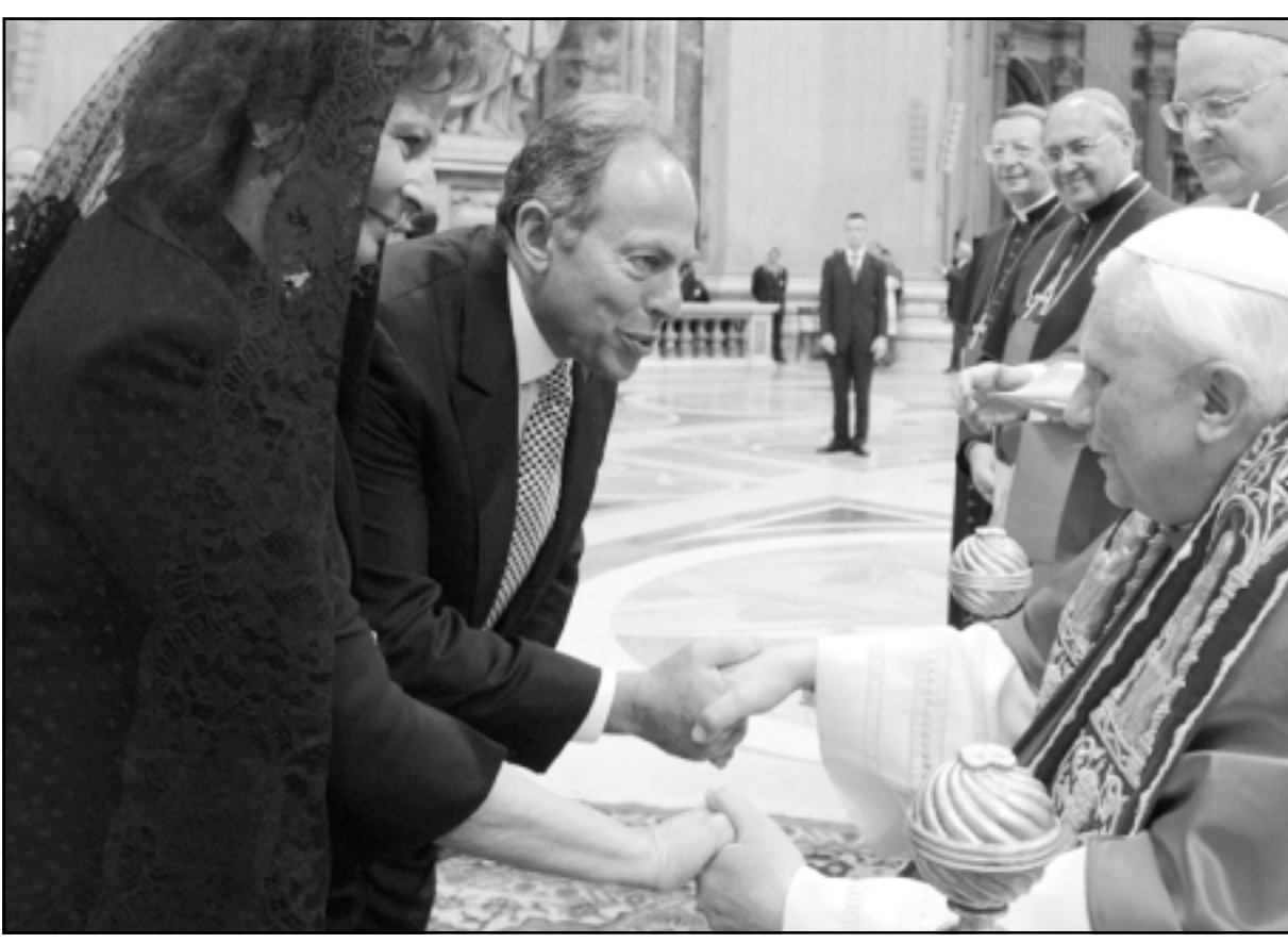
الابايا بنديتك السادس عشر يقابل الرئيس اللبناني اميل لحود وزوجته في الغاتيكمان امس

الكثر قليل، ولكن قد تكون دائرة عالية ويعيدا معاً أفضل له من عاليه وحدها. وهذا القانون يرضي الرئيس نبيه بري ولو كسب الجنوب الى دائرتين، لانه يتيح له التحرك من القضاء والافادة من الخزون الشعبي في صور لاعادة تكوين كتلة محترمة بالتحالف مع حزب الله والبروز مجدداً كمرشح قوي لرياسة المجلس بعد عودته على رأس كتلة محترمة من حوالي 14 نائباً، كما يرضي هذا التقسيم حزب الله فهو سيكون الناخب الاقوى في بعلبك-الهرمل، وسيكون شريكاً مع الرئيس بري في الجنوب، وبالنسبة الى تيار المستقبل فان تقسيمات العام 2000 في بيروت اتاحت