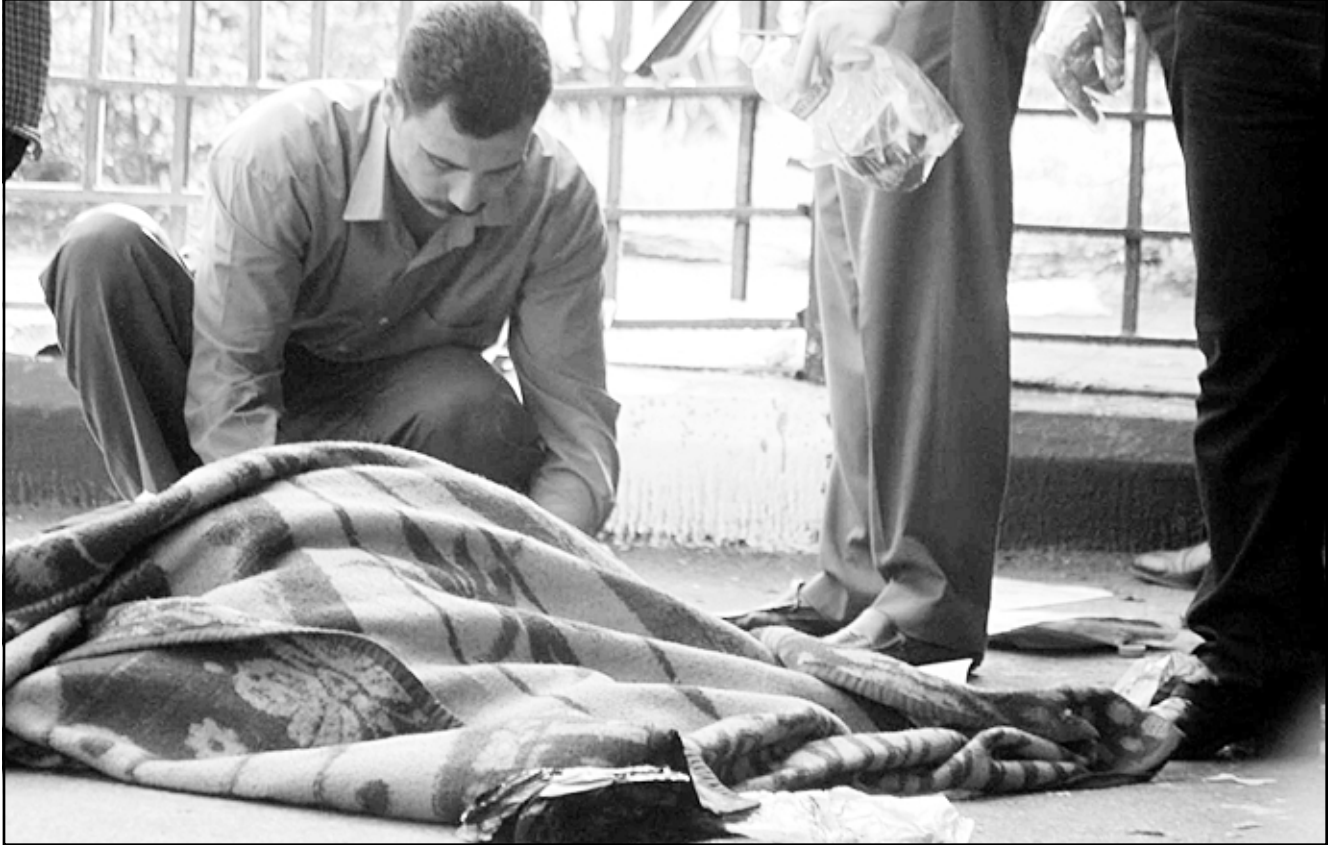
رجل أمن مصري يفحص جثة منفذ هجوم وسط القاهرة أمس الاول