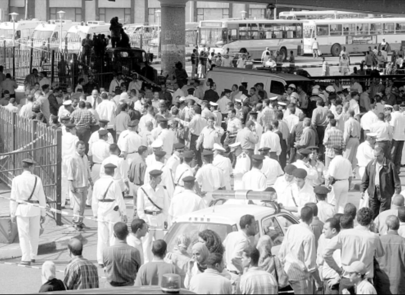
رجال امن مصريون يحاصرون المنحلة حول كوبري العاشر من أكتوبر بعد الانفجار قرب المتحف المصري وسط القاهرة

عائلات المعتقلين عقدا عدة مظاهرات امام المحاكم في القاهرة ومنذ زمن تدور انباء عن نية ابناء هذه العائلات العمل لاجل الإفراج عن ابنائهم، وإلى جانب هؤلاء، هناك من يعتقد بأن اليقظة السياسية التي ترمي إلى تغيير قانون الانتخابات وتنظيم المظاهرات ضد منظمات الارهاب، محرر الجبهة الهامة المصور مكرم محمد احمد، كتب قبل اسبوع في مجلته يقول انه في الاجزاء الحالية في مصر،