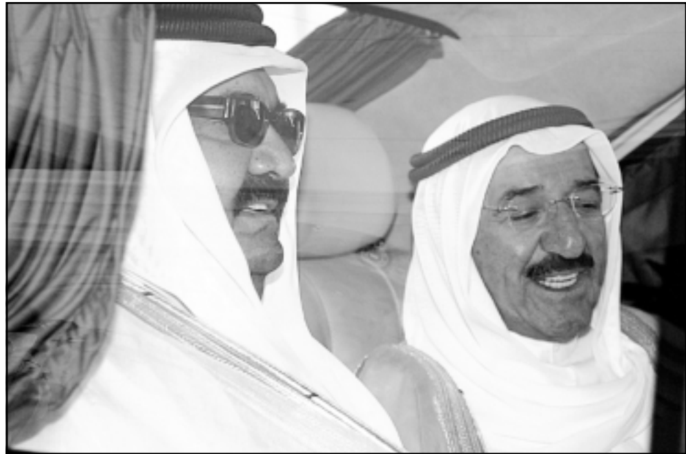
رئيس وزراء الكويت الشيخ صباح الاحمد الصباح أمس لدى استقباله أمير قطر الشيخ حمد بن خليفة آل ثاني الذي يقوم بزيارة للكويت

أخي الملك حمد وأمير منطقة الرياض. وبالرغم من أن الكويت امتدحت نتائج اللقاء فإن العلاقات بين الرياض والدوحة ظلت متوترة. وكان وزير الخارجية الكويتي الشيخ محمد الصباح قال السبت ردا على سؤال بشأن سعي الكويت لوساطة للمصالحة بين السعودية والكويت «الكويت دائما تلعب دورا في المسائل الخيرة (...) لوحة دول الخليج». وأضاف ردا على سؤال هل تتوقع تحسنا في العلاقات بين البلدين؟ قائلا «نأمل ذلك». وكان التوتر في العلاقات بين البلدين زاد اثر بث قناة الجزيرة الفضائية القطرية في حزيران/يونيو 2002 برنامجا نشره لقااء في مونتري كارلو في فرنسا بين أمير قطر والأمير سلمان بن عبد العزيز