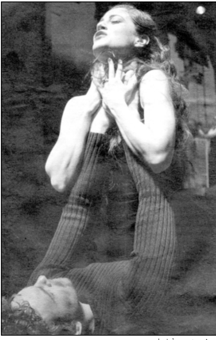
مشهد من مسرحية «فيدرا»

عبر البريد الإلكتروني.. وما زال أمامه وقتا للتخصير.