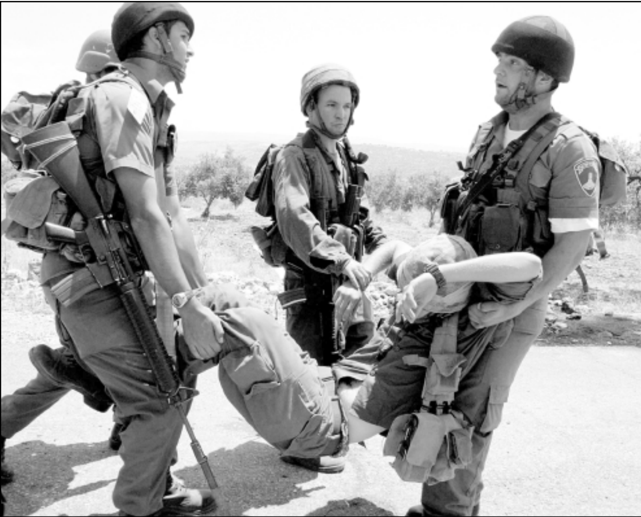
اطفال يرشقون جنود الاحتلال بالحجارة أثناء احتجاج على الجدار في قرية بيلين في الضفة.. والى اليسار جنود اسرائيليون ينقلون جندياً أصيب بجرح