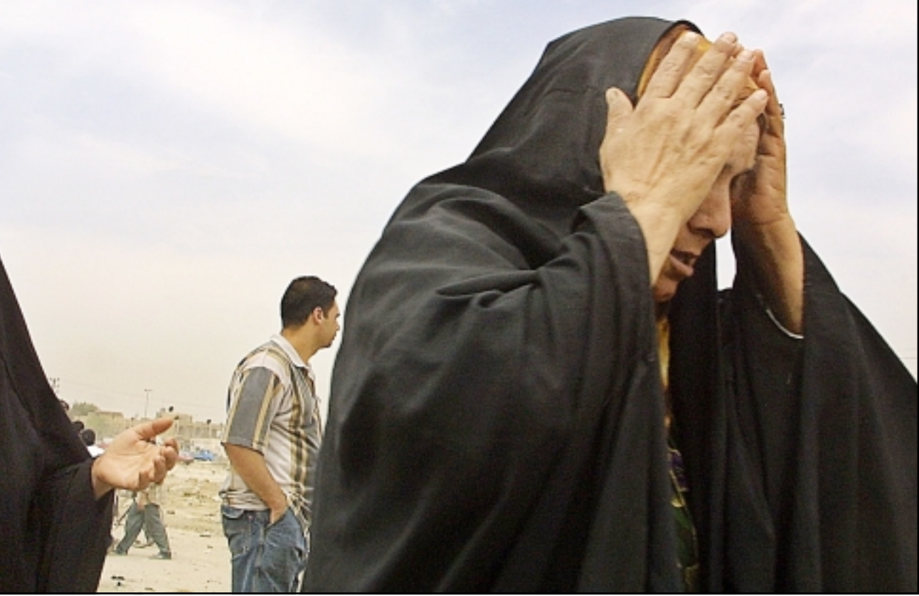
سيدة عراقية تبكي أحد ضحايا هجوم في بغداد أمس

مسعود البارزاني جلسة البرلمان الكرد التي مضى على توقفها قرابة اربعة اشهر، وقالت مصادر ان الخلافات بين الحزبين تتركز بشأن رئاسة الاقليم وتحديد صلاحيات الرئيس وتوزيع بعض المقاعد السيادية، اضافة الى خلاف جوهري حول رفع العلم العراقي في هذه المنطقة. في لندن قالت صحيفة «صنديا تايمز» الصادرة امس ان وثيقة حكومية سرية كشفت ان رئيس الوزراء البريطاني بلير تعهد للرئيس الامريكى سرا باشتراك بريطانيا في الحرب على العراق قبل عام من الغزو.