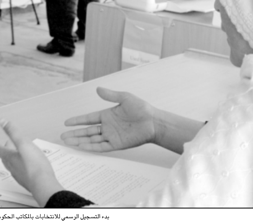
بدء التسجيل الرسمي للانتخابات بالمكاتب الحكومية

وعبرت اللجنة الانتخابية عن ارتياحها لاطلاق «هذه الانتخابات البرلمانية الحرة والديمقراطية الاولى» التي تنظم في بلد موحد بعد الحرب الاهلية وحكم طالبان في التسعينات والاحتلال السوفياتي في الثمانينات. ولا اثر لعملية انتخابية برلمانية مماثلة منذ عهد الملكية الافغانية في السبعينات. وأعلنت اللجنة مساء السبت ان سبع نساء وستة رجال سجلوا كمرشحين لمجلس الشعب في ست ولايات في وسط البلاد بينها كابول. والعامل الجوهري الوحيد والمهم في بلد تهزه منذ الربيع عبود العنف وعمليات القتل التي تنسب الى حركة طالبان خصوصا في الجنوب والجنوب الشرقي هو الامن. وقال بسمال «نحن والتقون انه لن تحدث مشكلة أمنية كبرى خلال الانتخابات». وأوضحت اللجنة ان الشرطة والجيش الافغان سيوليان الحفاظ على امن الانتخابات بمساعدة قوات عسكرية اجنبية وخصوصا أمريكية.