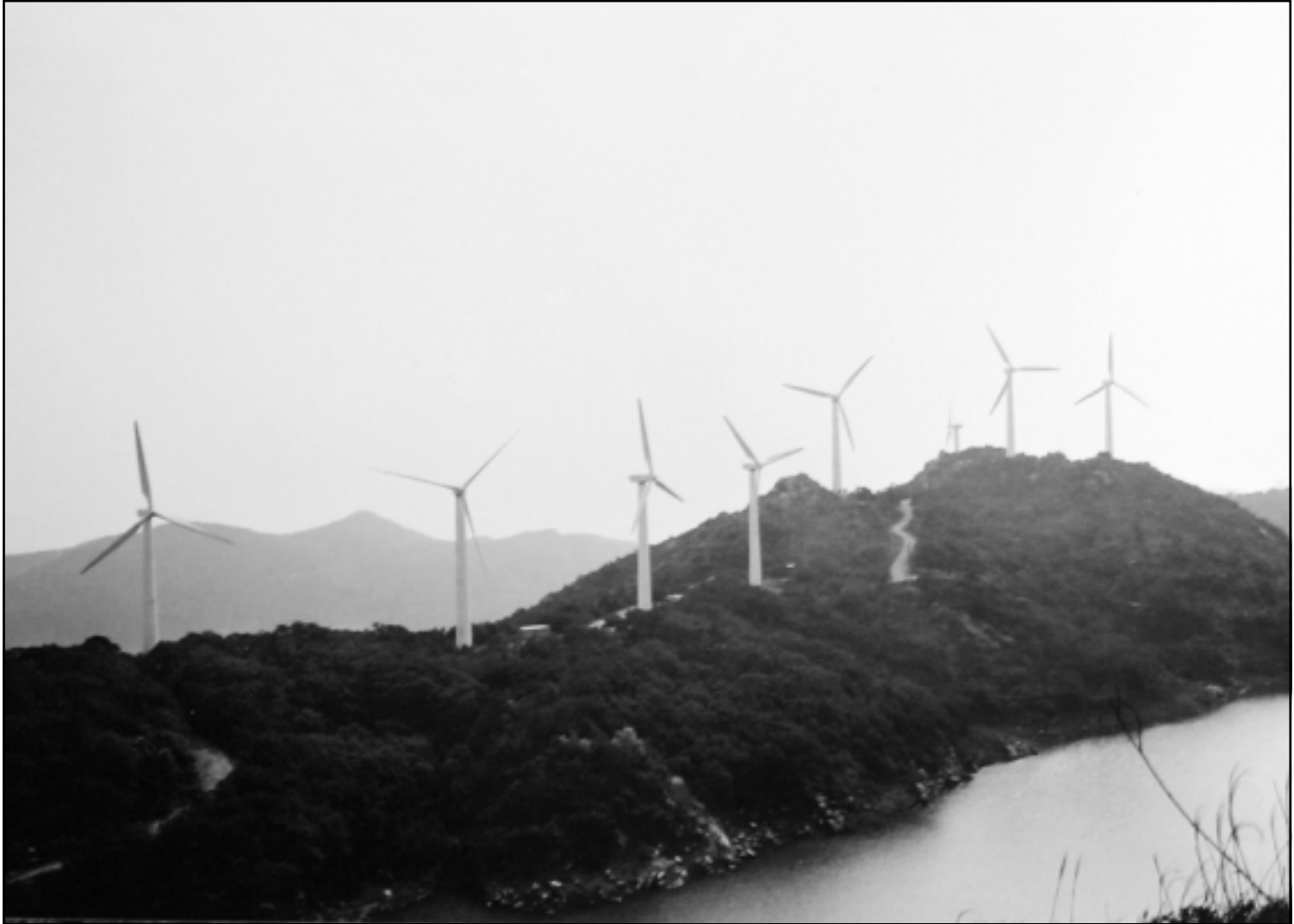
طواحين هواء فوق سلسلة جبلية في جزيرة نانوا جنوب الصين

والصين التي تعد أكبر منتج وأكبر مستهلك للفحم في العالم هي ثاني أكبر منتج لغازات الاحتباس الحراري وتستهدف مناجمها التي تشتهر بانها خطيرة استخراج 2,2 مليار طن من الفحم سنويا بحلول عام 2010.