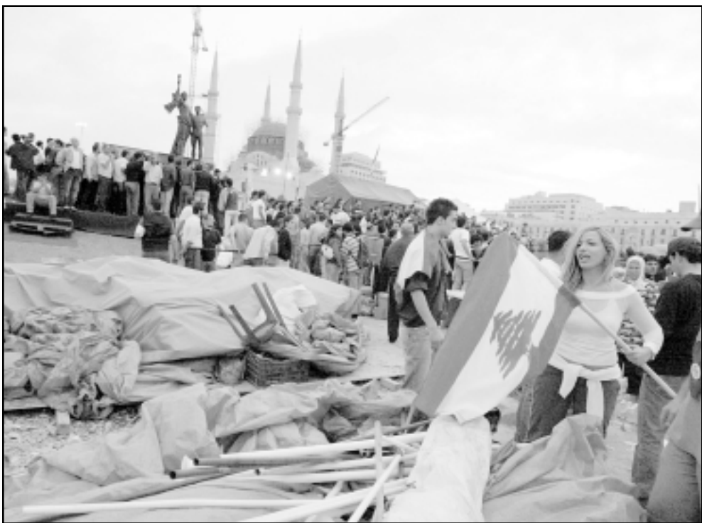
تاشطون لبنانيون معارضون لسورية يشاركون في فك خيمة اقاموها في ساحة الحرية بعد اغتيال رئيس الوزراء اللبناني السابق رفيق الحريري وطلباو بخروج الجيش السوري من لبنان

تام، في ايام رابن، ومنتجاها وباراك كان الاسريكيون نشطاء في اتجاه الجولان اكثر مما فعلوا في شأن الفلسطينيين، يكف حزب الله، وان يعلق مكاتب الارهاب في دمشق وان يتظاهر بديمقراطية اكبر لواطني سورية الباسنين، من أجل أن يستتقد جلد هو ويستتقد بلده فانه قد بقي بتعليقات الاستعمال الامريكية: