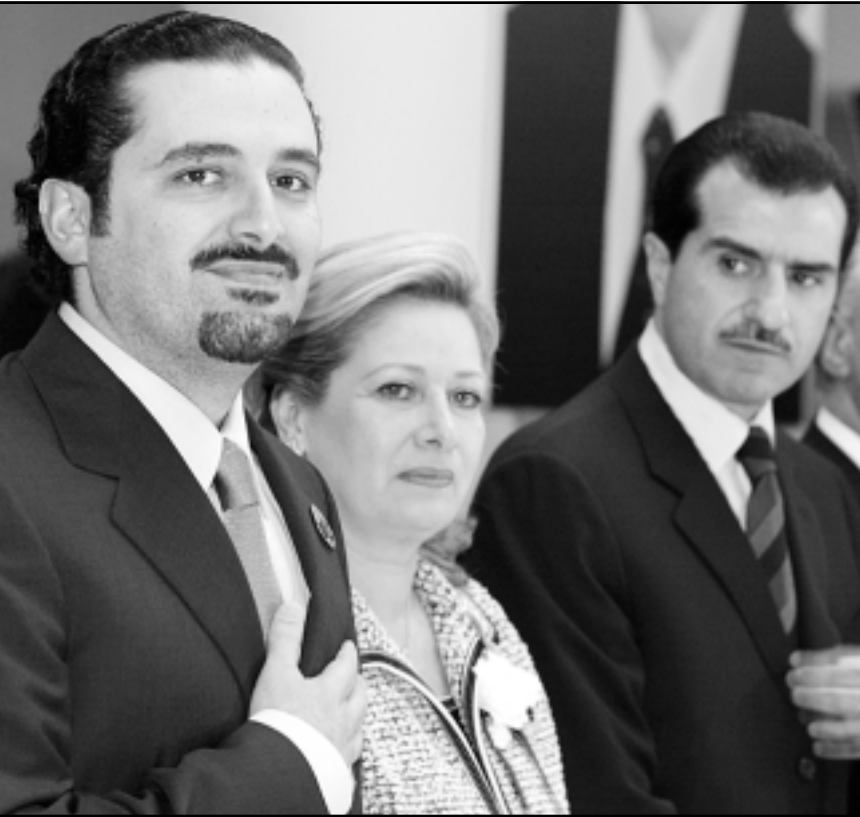
سعد الدين الحريري والى جانبه صولانج الجميل وجبران تويني بعد اعلان لائحته الانتخابية