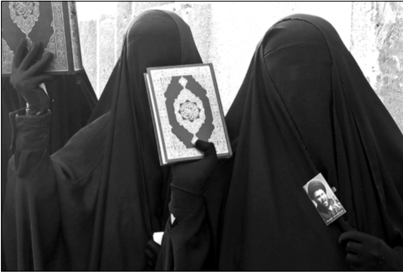
سيدات عراقيات في مظاهرة في السماوة