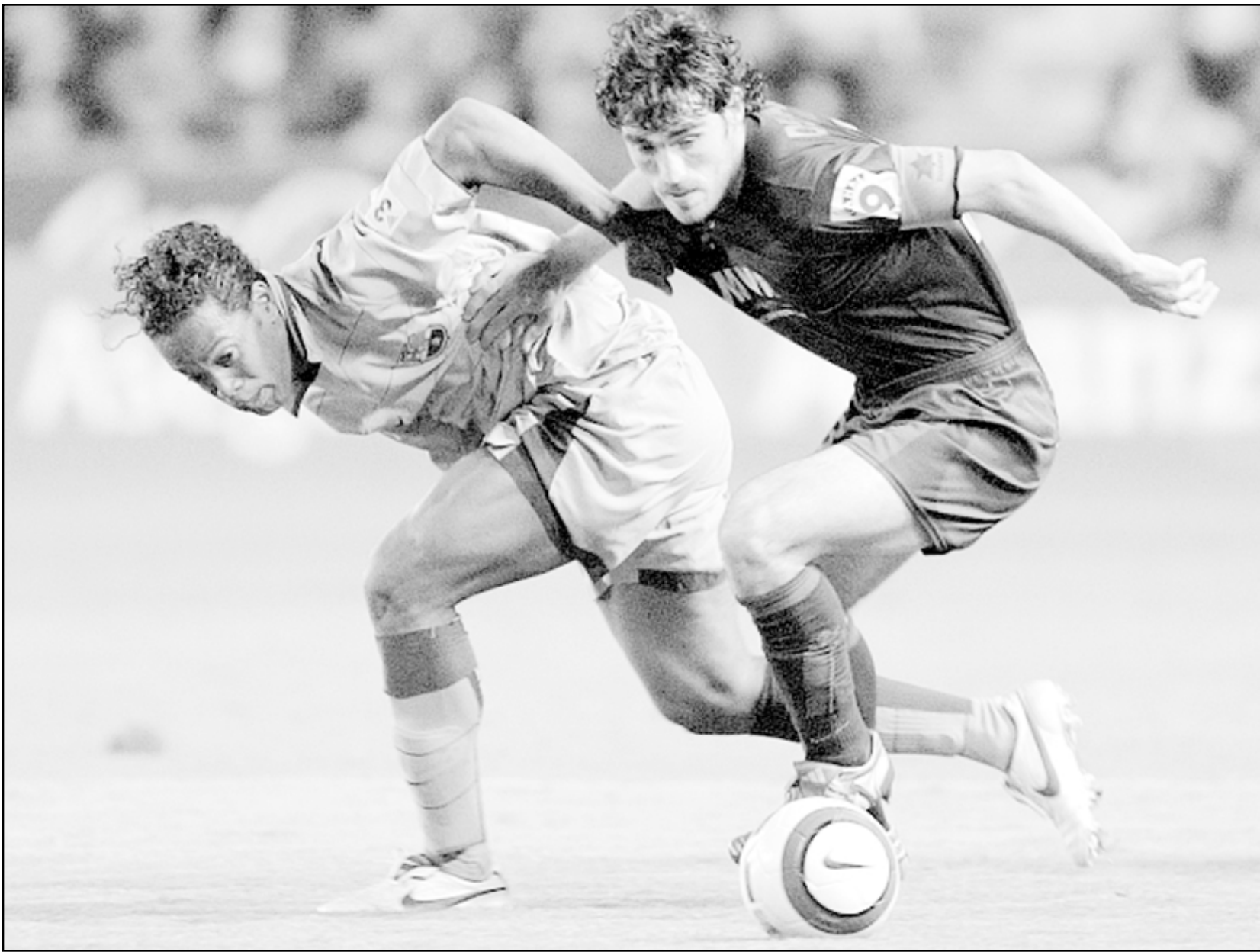
لقطة من إحدى مباريات برشلونة

برشلونة (إسبانيا) - أ ف ب: امتزجت مشاعر الفرحة والفخر والرضى التام عند مسؤولي ولاعبى نادي برشلونة الإسباني بعد فوزهم بلقب الدوري الإسباني لكرة القدم للمرة الأولى منذ 6 أعوام والسابعة عشرة في تاريخ النادي الكاتالوني.