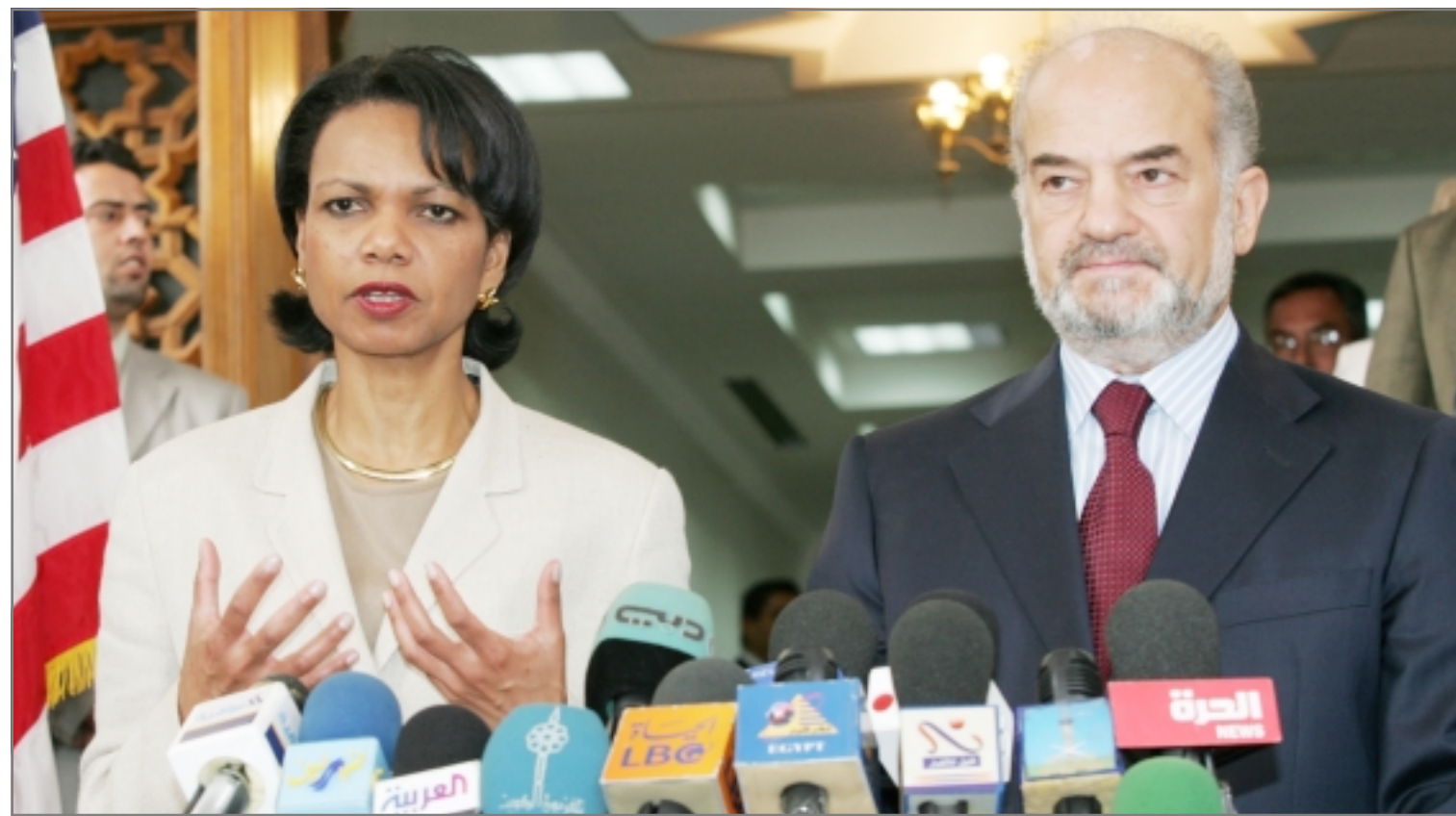
رئيس الوزراء العراقي المؤقت الدكتور ابراهيم الجعفري مع وزيرة الخارجية الامريكية كونداليزا رايس في بغداد امس

في مدينة النجف جنوب بغداد ان «الشيخ قاسم الجعفري، ممثل السيد السيستاني في منطقة بغداد الجديدة (جنوب شرق بغداد) قتل على يد مسلحين مجهولين». واذاف ان «المسلحين فتحوا النار عليه امام منزله صباح امس واروده قتيلا». وأوضح ان «عملية تشييعه ستتم بعد ساعات في مدينة النجف». وفي بغداد، أكد مصدر في الشرطة العراقية فضل عدم الكشف عن اسمه ان «الغواوي قتل واحد مرافقيه امام منزله في منطقة بغداد الجديدة». (تفاصيل ص 3)