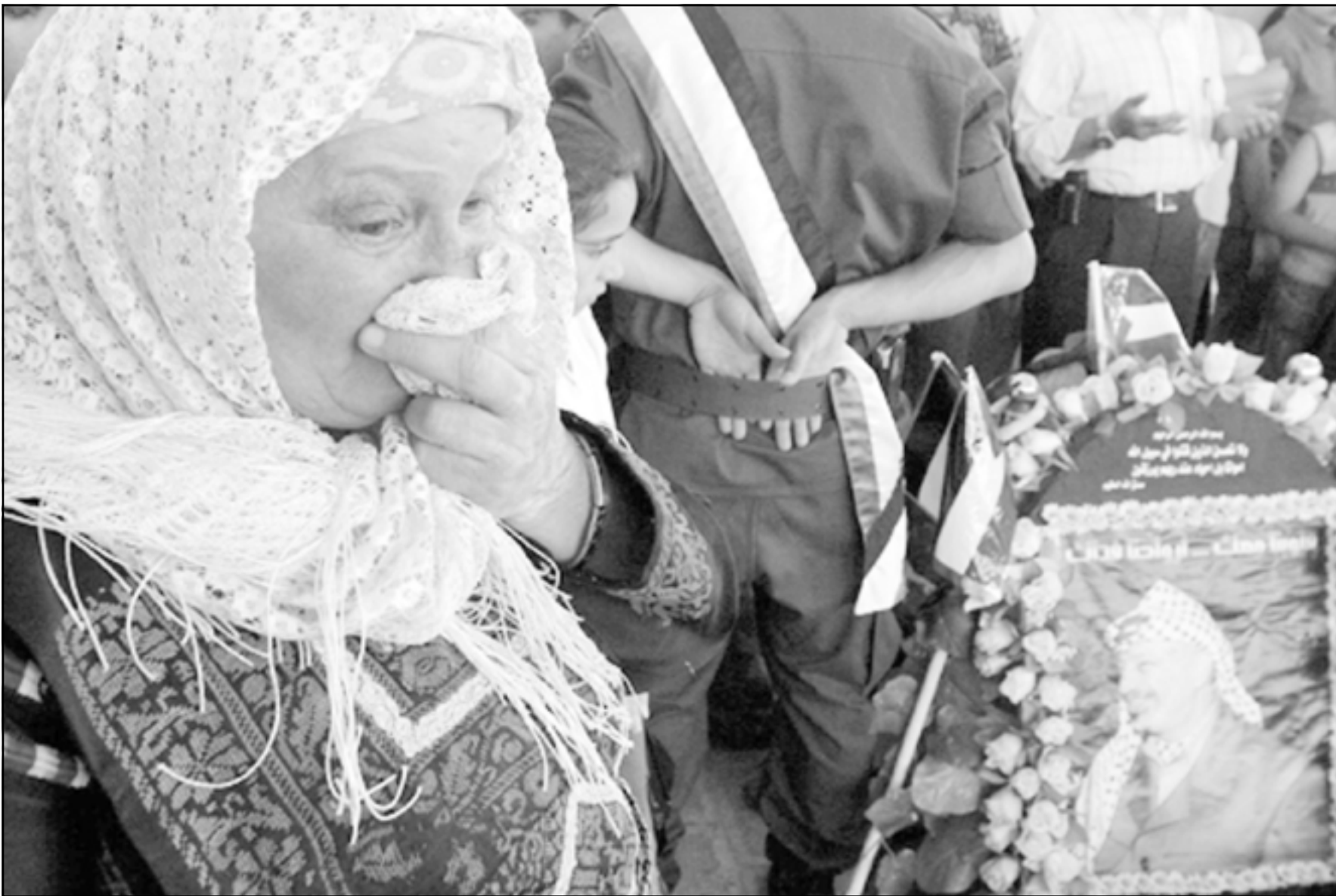
سيدة فلسطينية اختارت احياء ذكرى النكبة بزيارة قبر ياسر عرفات في رام الله

قرار الأمم المتحدة رقم 194، كما أكدته حقوق الملكية الخاصة التي لا تزول بالاحتلال أو بالسيادة فهو حق مقدس غير قابل للتصرف، وهو حق شخصي في أصله لا يجوز فيه النيابة أو التمثيل أو التنازل عنه لأي سبب كان. ومن جانبه علق أسس مجلس نقابة المحامين الفلسطينيين بالمناصفة العمل أمام كافة المحاكم والمراجع القضائية والدوائر الرسمية في فلسطين. وأكدت النقابة على أن حق الشعب الفلسطيني في العودة لوطنه فلسطين حق مقدس تدعمه الشرعية الدولية وهو حق فردي لكل فلسطيني وحق وطني للشعب الفلسطيني، وحق قومي لكل عربي كما أكدت النقابة التمسك بالحق في العودة وبحق شعبنا في قيام دولته وعاصمتها القدس.