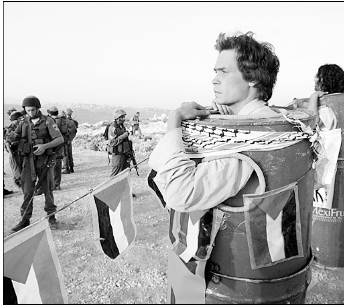
نشطاء سلام اجانب يحشرون انفسهم داخل براميل ملغ قوت الاحتلال من مواصلة جرف ومصادرة اراض فلسطينية في قرية بيلين في الضفة الغربية (رويترز)

يوحنا التابع للبطريركية الأرثوذكسية في القدس، وتابعت المراسل الإسرائيلي قائلا ان الشؤون الفلسطينية في صحيفة «هارتس» الإسرائيلية داني روبينشتاين النقاب عن ان جمعيات المستوطنين اليهود في البلدة القديمة من القدس الشرفية بدعم من الحكومة الإسرائيلية في التي ايرمت صفقة باب الخليل مع البطريركية الأرثوذكسية في القدس، وأوضح الصحافي في تقريره الحصري ان السبب وراء التعنيت الاعلامي يعود إلى خوف الحكومة الإسرائيلية من ردود الفعل الدولية حول تورط الدولة العبرية بشراء املاك تابعة لوقف مسيحي في القدس المحتلة، وتابعت الصحيفة انه من المحتمل جدا ان محاولة التستر على هوية المشترين تأتي بهدف اخفاء ان جهات عامة او حكومية اسرائيلية تقف وراء صفقة باب الخليل، لانه في هذه الحالة ستعرض اسرائيل لاتقادات دولية شديدة بسبب اجراءاتها في القدس الشرقية المحتلة التي يؤكد القانون الدولي على انها ارض محتلة. كما اشارت الى ان الاساليب الملتوية في تحصيل الاموال من الحكومة الإسرائيلية الى جمعيات المستوطنين لا تستوي مع الادارة السلمية، على حد تعبيرها. ويوجب المعلومات التي اوردها الصحفية الإسرائيلية بناء على مصادر اسرائيلية وفلسطينية مطابقة فان الشخص الرئيسي الذي يمثل غلظة المستوطنين اليهود يدعى متياهو دان، وهو ناشط في منظمة «عطيريت كوهانيم»، المرتبطة بوزارة الاسكان الإسرائيلية، وعمل في السنوات الاخيرة على شراء بيوت فلسطينيين في الحي الاسلامي وحي النصارى وفي الاحياء العربية الأخرى في البلدة القديمة من القدس. يشار الى ان هذه الجمعية اليهودية الدينية المنظره تعمل على تخليص الارض التابعة لشعب اسرائيل حسب مفاهيمها من ايدي الأتباع ولتقت الحسم الحكومي السخي اiban تستم الوزير