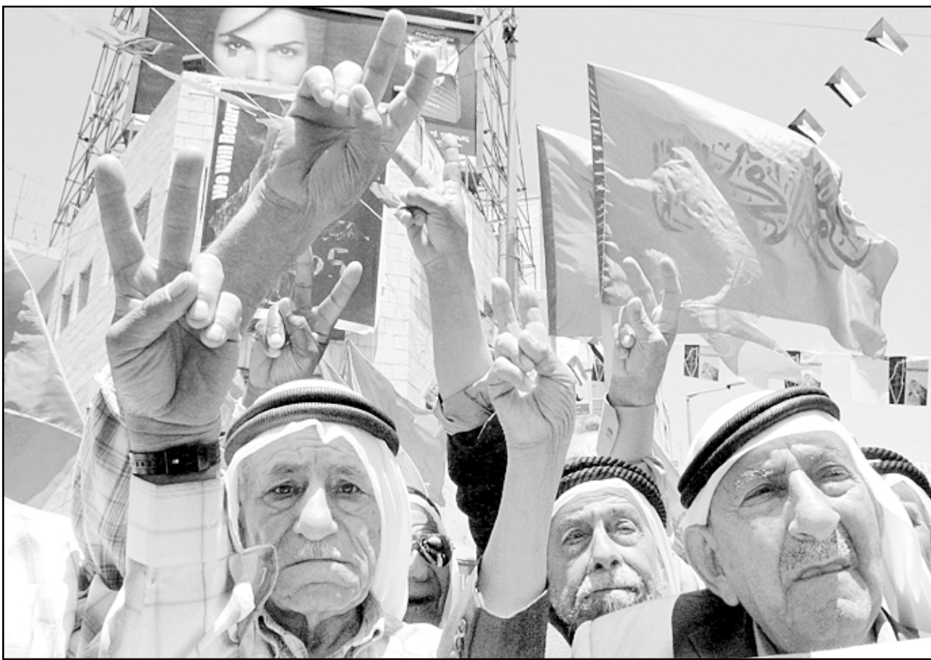
لاجئون يتكئون حقم في العودة إلى اديهم وقراهم التي شرردوا منها في العام 1948

والتسليم في الدناخل الفلسطيني. واستعرضت لانفر، في محاضرتها التي أقيمت في مدينة الناصرة بحضور حشد كبير من المستمعين مشاهداتها الحية لانتهكات حقوق الإنسان الفلسطيني، منذ تهجير السكان من قراهم ومدنهم وبلداتهم عام 1948، وانتزاع ارضهم، وقتل الأبرياء منهم، والمعاملة القاسية وغير الإنسانية التي تعرض لها الأسرى الفلسطينيون داخل أقبية المعتقلات، والتي أسفرت عن استشهاد العشرات من الأسرى الفلسطينيين. وأوضحت أنها واجهت التمييز ضد شعبنا، مؤكدة أن القوات الإسرائيلية تستند في تصرفاتها إلى الدعم الأمريكي، والفيتو في مجلس الأمن الذي يمنع اتخاذ أي قرارات ضدها. وأشارت لانفر، إلى أن الدولة العبرية أظهرت احتقارها للقانون الدولي