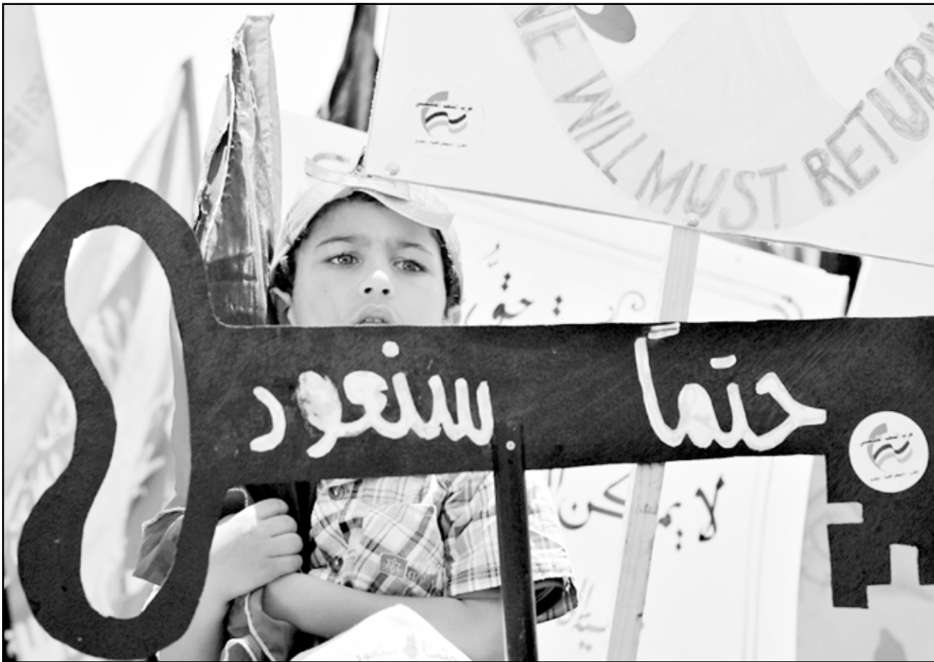
اطفال يتوارثون مفاتيح العودة