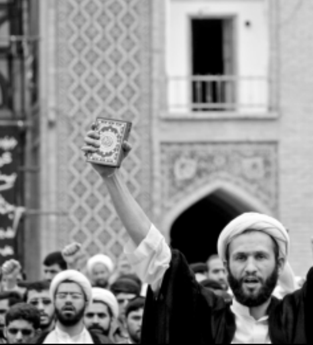
ايرانيون يتظاهرون في قم ضد الولايات المتحدة

الرباط - «القدس العربي»: عبر نواب حزب العدالة والتنمية الاصولي المغربي المعتدل بالبرلمان عن رفضهم «ايه زيادة في معاشات النواب» وذلك في ضوء مشروع القانون المتعلق بأحداث نظام المعاشات لفائدة أعضاء مجلس النواب الذي يناقشه المجلس وقال بلاغ لفريق الحزب ان من شأن هذه الزيادة تحميل خزينة الدولة عبئا إضافيا.