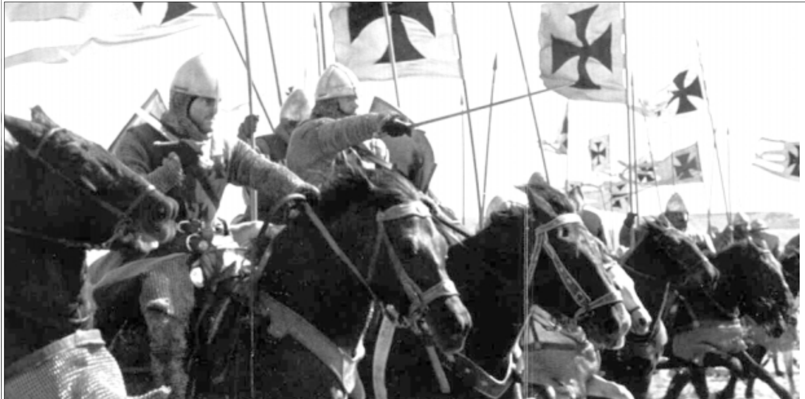
لقطة من حروب «مملكة السماء»