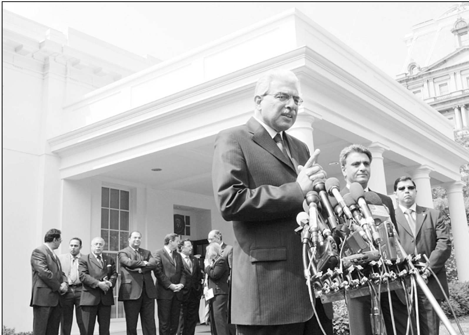
رئيس الحكومة المصرية احمد نظيف يتحدث للصحافيين بعد لقائه الرئيس الامريكى جورج بوش في البيت الابيض امس الاربعاء