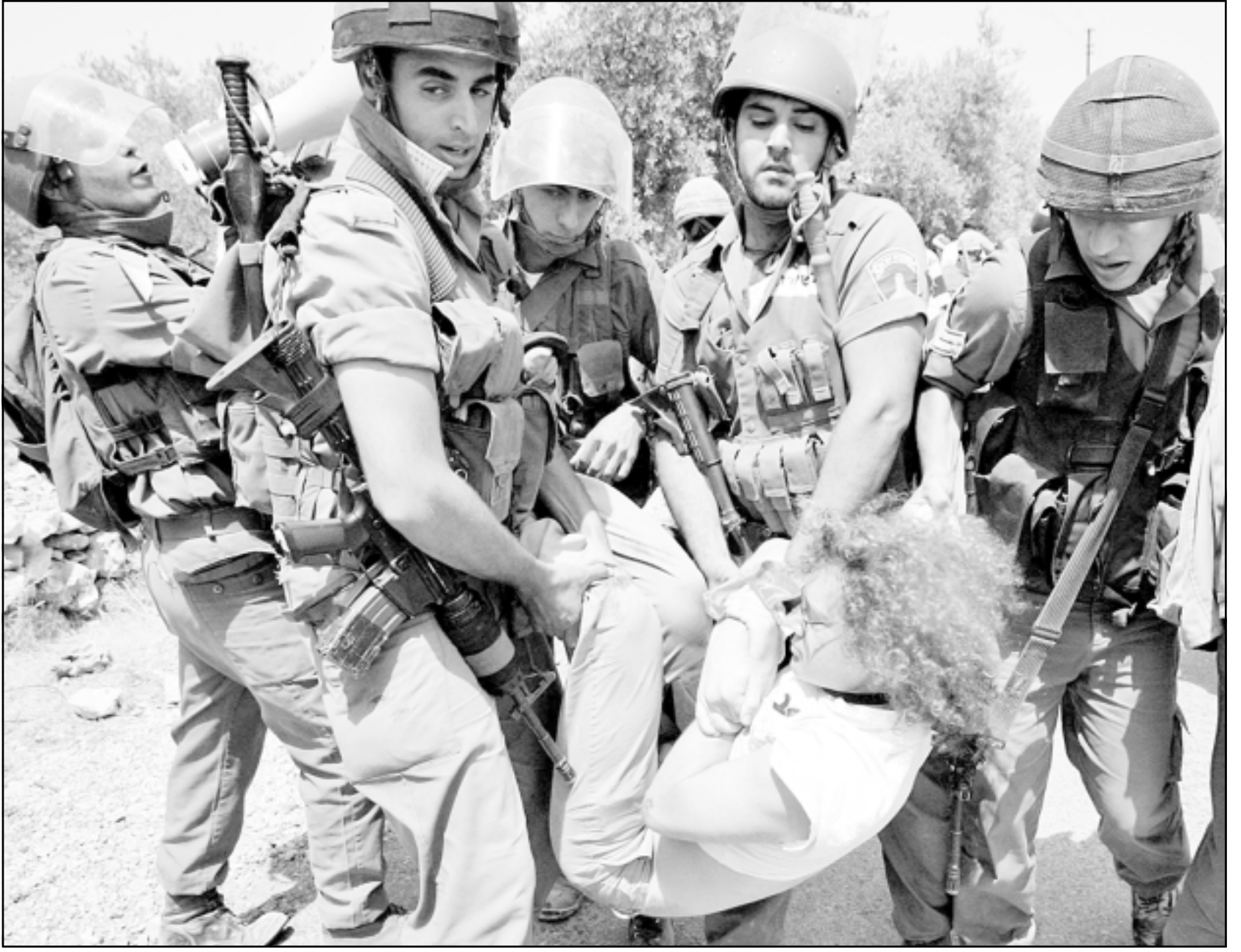
جنود اسرائيليون يعتدون بالضرب على ناشط سلام اجنبي شارك في احتجاج على بناء الجدار العازل في قرية بيلين بالضفة الغربية الجمعة (رويترز)

قال مصدر في الامم المتحدة كوفي عنان سيزور الخرطوم وراثسة الحركة الشعبية بزمبيك ودارفور، في اطار جولة له في السودان واثيوبيا الاسبوع القادم. وفي الاثناء تسلم النائب الأول للرئيس السوداني علي عثمان محمد ودعا أمس توصيات ومقررات صلح قبائل محليتي كتم والواحة بولاية شمال دارفور التي تضم ما لا يقل عن 14 قبيلة الى جانب عهد وميثاق من جماهير المنطقة، وفيما وقعت ذات القبائل الاربعة وثيقة تصالح ومؤاخاة اعتبر النائب الأول لمحلية كتم من صلح دليلاً قطعياً على ان أهل السودان ودارفور قادرون على تجاوز خلافاتهم. نص خطاب