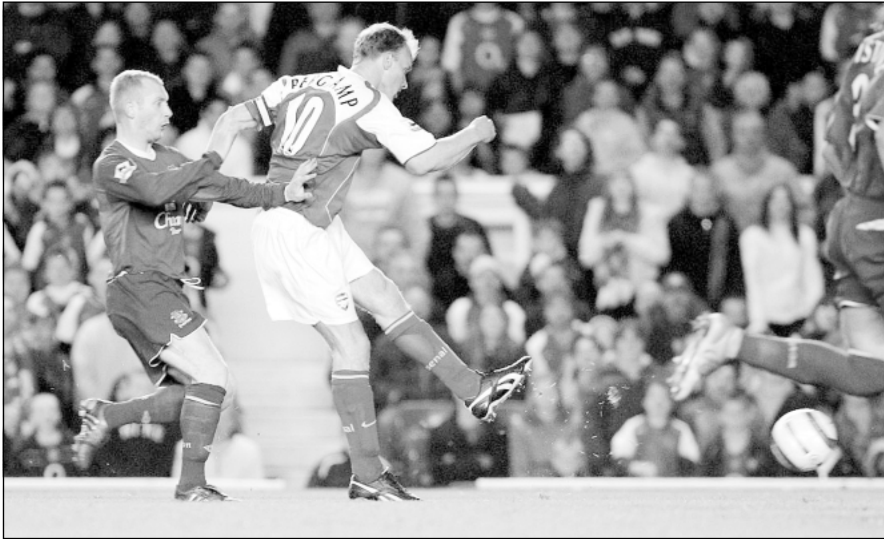
لقطة من إحدى مباريات ارسنال (صورة من الأرشيف)