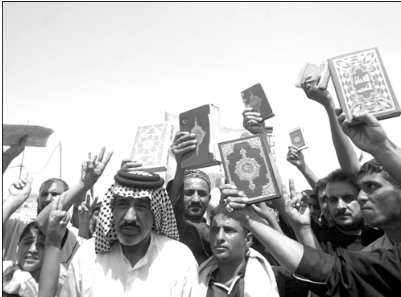
مواطنون عراقيون في مدينة الصدر يرفعون المصحف ويهتفون ضد الولايات المتحدة بعد صلاة الجمعة (أ ف ب)

بغداد - «القدس العربي»: وجدية كاملة في مواجهة المخطط المشؤوم الرامي إلى تمزيق وحدة العراقيين، كما ادعوا الساسة العراقيين ممن تهتمهم وحدة العراق في ممارسة دورهم الإيجابي في المحافظة على وحدة الشعب والوطن، والوقوف بوعي وحزم ضد كل محاولات تخريب البيت العراقي من داخله. وفيما فسر مراقبون هذا البيان بمثل محاولة للتهدئة أصدرت هيئة علماء المسلمين من جانبها بيانا قالت فيه إنها تدعو إلى احتفال ممثل السيد السيستاني الشيخ محمد طاهر العلياق وتؤكد رفضها لهذه الأعمال الإرهابية المحرمة تحت أي مبرر كانت أو ذريعة وترى أنها تزرع الفتنة التي يريدوا اعداء هذا البلد وهذا الشعب. وحذرت الهيئة من ظاهرة استهداف علماء الدين التي تتابعت هذه الأيام في مؤشر خطير على ظهور مخطط خبيث لثارة روح الفرقة بين صفوف المجتمع العراقي، وقد فسر المراقبون أيضا استنكار هيئة العلماء لاغتتيال ممثل السيستاني بأنه محاولة للتهدئة وأشاعر العراقيين بنيد الحرب الطائفية أو اثاره الفتنة بالتعبير عن الوقوف ضد العنف بكل أشكاله. وكانت الهيئة ومن منطلق التعبير عن وقوفها ضد العنف حتى الذي يستهدف الشيعة أنفسهم قالت الهيئة في بيان لها صدر في بغداد أنها تستنكر بشدة ما أقدمت عليه قوات الاحتلال الأمريكي من استهداف مستمر للقوى الوطنية الرافضة لوجوده والمناهضة لمخططاته الأثيمة، فقد أقدمت على مذبحة معتقبي الشيعة الصدر في مدينة الصدر واعتقلت 13 من أعضائه الموجودين فيه. وقال البيان إن هيئة العلماء إذ تشجب هذا العمل غير المبرر فإنها تعلن تضامنها مع الأخوة في التيار الصدري وكل القوى الوطنية العراقية التي تتعرض يوميا للاعتقال والتشريد والتكثير، وتعلن ثباتها على موقفها الساندة للقوى الوطنية.