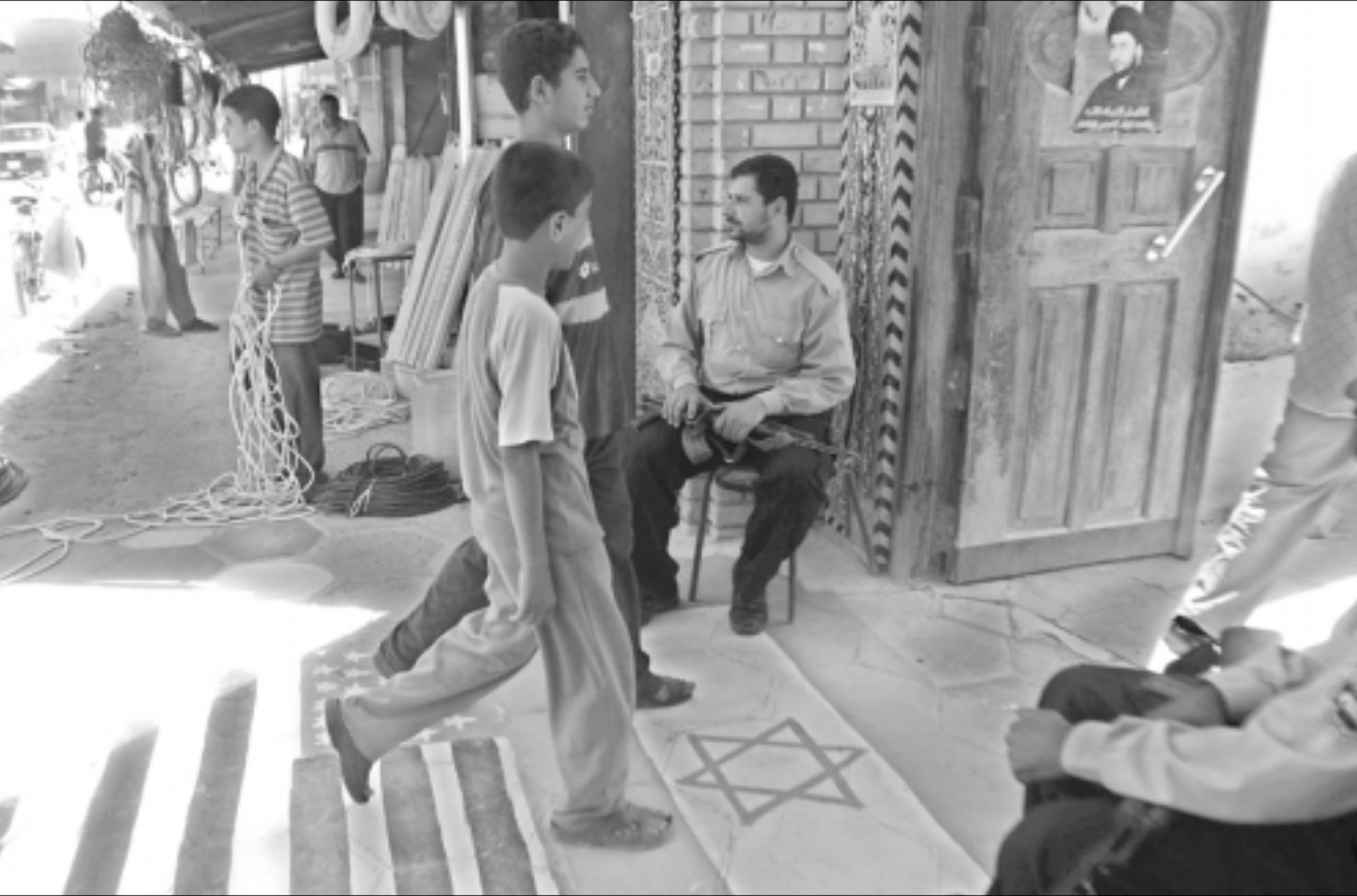
صبيان عراقيان يديسون فوق علمي امريكا واسرائيل عند مدخل احد المساجد في بغداد تنفيذاً لطلب من السيد مقتدى الصدر الجمعة

«صن» ان صدام تتم مراقبته حتى داخل المراض. وزعمت الصحيفة ان صدام سمع له بصياغة شعره بالاسود. ونقلت عن جندي امريكي في العراق شاهد الصور، قوله ان «صدام يبدو مرتاحاً هنا، اي في الزنزانه» وقال الجندي الرجل «صدام» لديه مساحة للعيش اكثر مما هو متوفر للجنود الامريكيين، تعالوا وانظروا الي الخيام التي اعيش فيها والتي اشارك فيها ثلاثين جندياً اخر». وتقول الشرطة التي تحرس صدام، انه في اليوم الذي لا يزوره محاميه، يقضي الوقت متمشياً او يقرأ القرآن، واحياناً متماماً. وتقول ان مصادر في السجن، علقت ان صدام من اكثر السجناء انضباطاً مشيرين ان بعض اللحظات العصيبة سجلت بعد وصوله الى السجن، ويبدو انهم قبلوا وضعهم وان ايامهم صارت موعودة، حيث ينتظرون المحاكمة التي ستقود الى حيل المشقة». وكشفت الصحيفة قاسلة ان الصور التقطت في مكان يتمتع بالحراسة الامنية العالية في العراق، حيث علمت الصحيفة اسم المكان. ويبدو ان الحكومة الامريكية اطلعت على الصور ونية الصحيفة، حيث تقول ان الحكومة الامريكية طلبت عدم ذكر اسم المكان، خشية ان يتعرض الجنود الامريكيون للقتل المستهدف. وحصلت الصحيفة على الصور من قادة عسكريين قالوا انهم يرغبون بتوجيه ضربة للمقاومة جراء نشرها، وقال مصدر عسكري «صدام حسين ليس رجلاً خارقاً او لها، هو رجل عادي وبسيط الان». مشيراً ان «هذا ربما قلل بعض التعاطف والحساس عند الذين يداؤعون عنه».