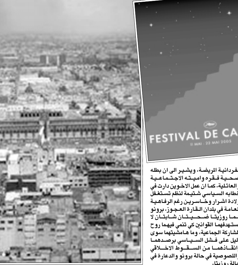
لقطة من فيلم «معركة في السماء»