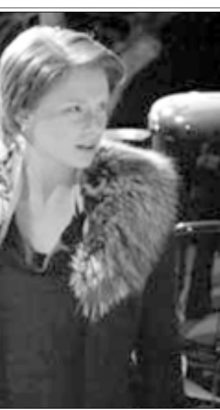
لقطة من فيلم «مندرلاي»