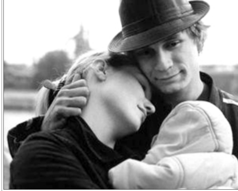
لقطة من فيلم «طفل»

ويبدا من اللقاء الطبيعي سيعدم الي اغتصابها بروحسية، فقد حقق انتقامه الشخصي قبل القصاص منه جماعيا، وهو يخاطبهم بعريسي لا تنسى انك قد صنعتينا، تجد البطة انها تورض ضمن البطة من ذواقه هو الحكيم واليام (داني غلوفر) المصغر على ان امريكا غير مهيبة لساواة التزوج مع البيض.