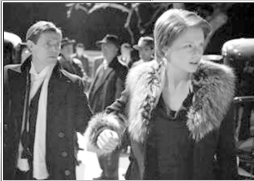
لقطة من فيلم «مندرلاي»

«الطفل» شريط غليل، بينهم، وبين جهدها في اعاداة تنظيف «اسرتها الجديدة»، تاسرها اغواءات تيموثي ستوقع بفريسي.