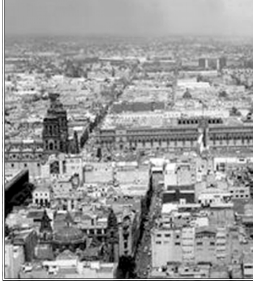
لقطة من فيلم «معركة في السماء»