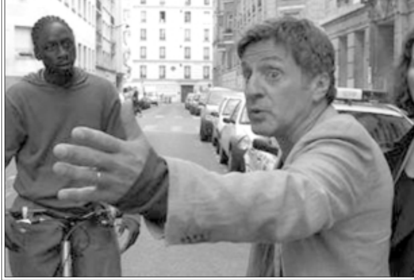
لقطة من فيلم «مخفي»