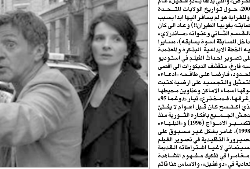
لقطة من فيلم «مخفي»