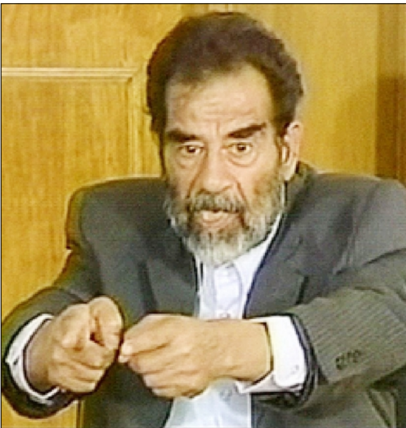
بغداد - لندن -