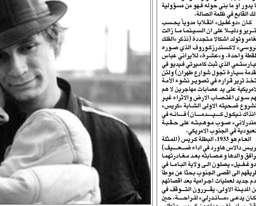
لقطة من فيلم «طفل»