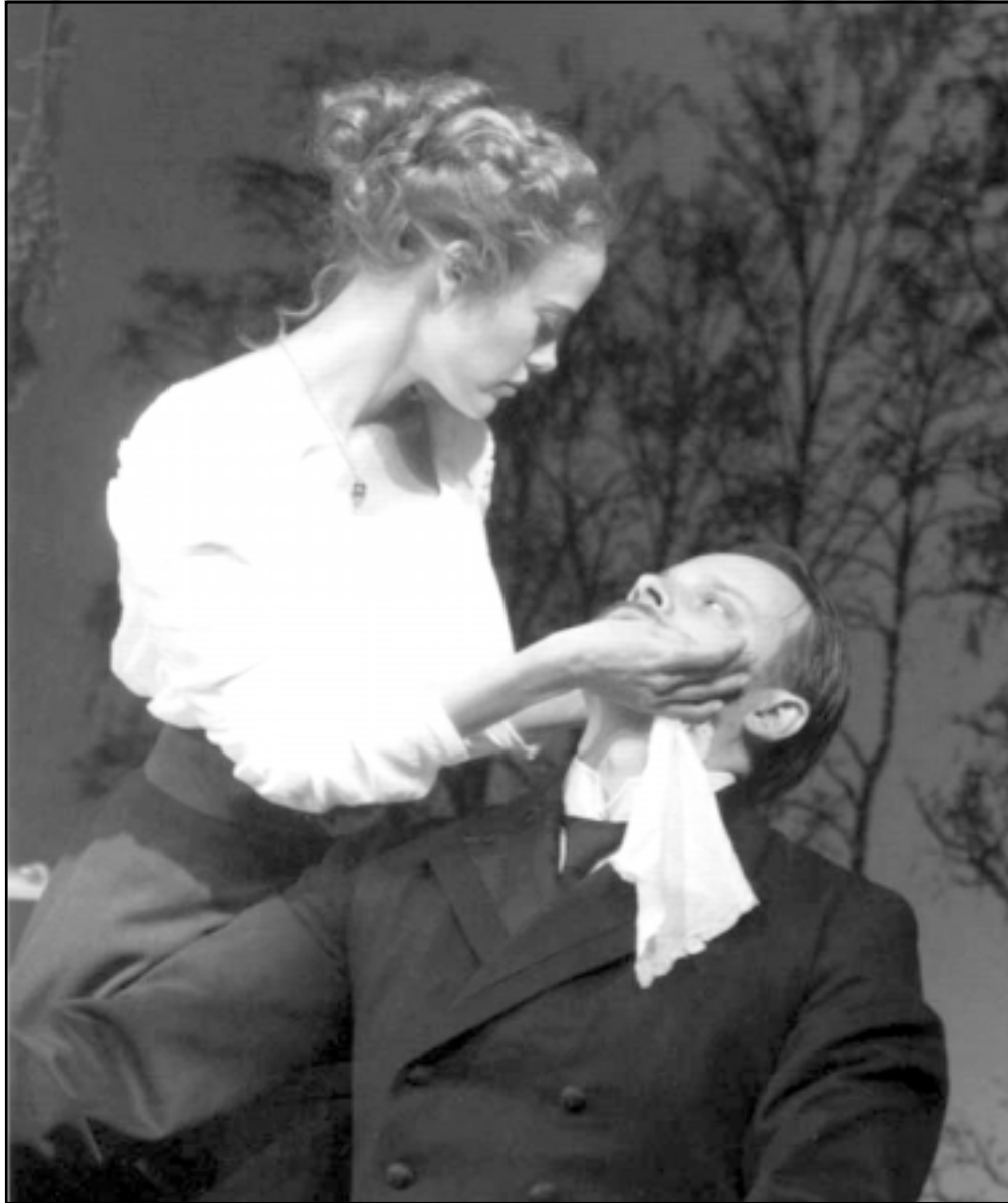
لقطة من مسرحية السيدة جولي

يبدو ان المؤلف استمد هذه الصورة من احدي سمات والده.. حيث ان والد المؤلف كان يعمل في بيته خادماً كل يسمح حذائه ويديه بالفاخر وهذا ما شاهدناه في شخصية جان وهو يمسح حذاء الكونت، وعلى الرغم من ان مسرحية السيدة جولي حوارية لكن عن ذلك لم نشعر بالملل، ربما يكون السبب بالخادمة كريستين.. ويعتبر اوجست سترندبري احد مؤسسي المسرح فيه المتلقي انه في جو اسري.