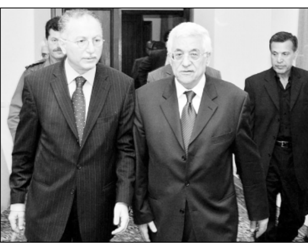
الامين العام لمنظمة المؤتمر الاسلامي اكليل الدين اوغلي يزور رام الله ويلتقي محمود عباس (بوتز)

الناصره - «القدس العربي» - من زعيم اندراوس: وجهت الادارة الامريكية صفة جديدة وقاسية للسلطة الوطنية الفلسطينية ولرئيسها محمود عباس، امس الاثنين بعد ان اعلنت ان اموال الدعم الامريكي للشعب الفلسطيني ستحوط الى حسابات المنظمات غير الحكومية الناشطة في الضفة الغربية المحتلة وقطاع غزة وليس الى وزارة المالية الفلسطينية، كما طالب الفلسطينيين، وقالت صحيفة «هارتس» الاسرائيلية التي اوردت النيا امس استنادا الى مصادر امريكية ماثوثة في واشنطن ان الرئيس جورج بوش، بقراره هذا لا يرغب في خرق التعليمات التي اقراها الكونغرس الامريكي والتي بموجبها يتم تحويل الدعم بقيمة 200 مليون دولار الى المنظمات الفلسطينية غير الحكومية فقط. وتابعت الصحيفة الاسرائيلية قائلة انه في الاشهر الاخيرة حاول اركان السلطة الفلسطينية تخفيف القيودات الصارمة التي اقراها الكونغرس الامريكي والتي بموجبها يحظر على ادارة الرئيس جورج بوش تحويل اموال الدعم الى السلطة الوطنية مباشرة، وطالبت السلطة بوضع ممثلها الذين اجروا محادثات مع صناع القرار في واشنطن ان يتم تحويل قسم من اموال الدعم الى السلطة الفلسطينية مباشرة لدفع الرواتب للمستخدمين واستئجار اختصاصيين لتنفيذ مشاريع عمرانية مختلفة في مناطق السلطة، ولكن الكونغرس الامريكي رفض الانصياع