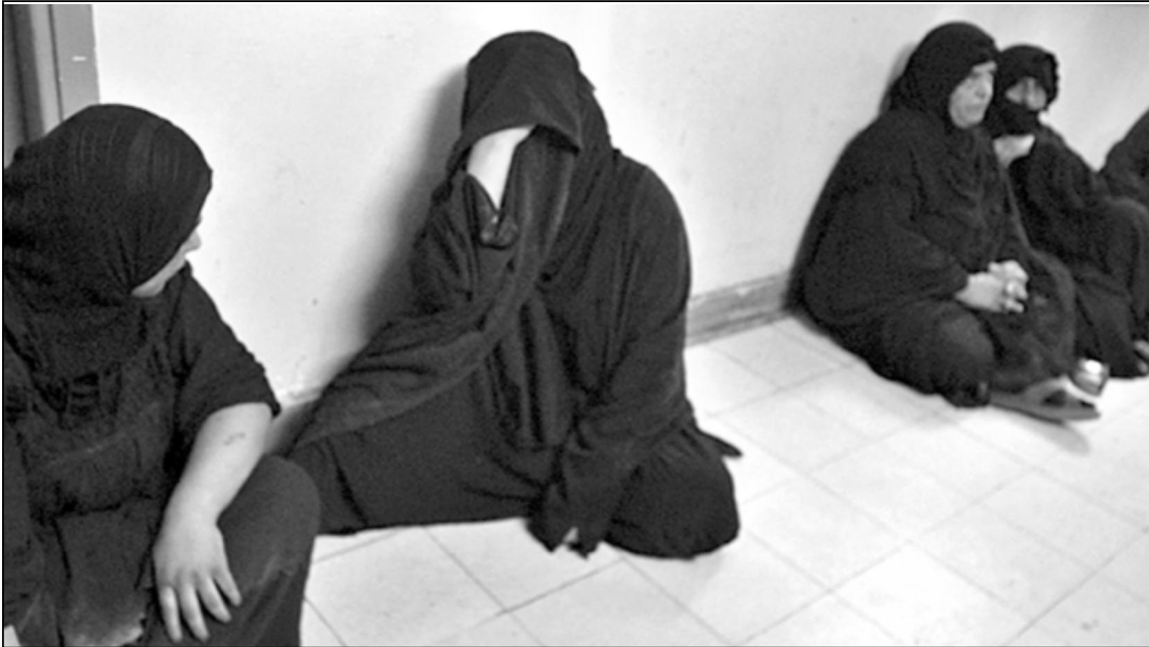
سيدات عراقيات ينظرن في إحدى المستشفيات بعد انفجار السيارة المفخخة أمام مطعم في سوق بغداد.

واعتبر الامريكيون الاشارات المزدوجة التي يقوم الصدر باصدارها، دليلا على ان الصدر الذي اجبر على إيقاف القتال ونزع اسلحة جيش المهدي يحاول الدخول في الميدان السياسي. وبحسب صحيفة «نيويورك تايمز»، فاذا قرر الصدر في النهاية دخول اللعبة السياسية، فان هذا اشارة على ان اكثر المتحمسين ضد الوجود امريكي، قد اجبروا على المشاركة في العربة السياسية والخلي عن السراح. وفي لقاء مع قناة «العربية»، مع الصدر، أكد عليه انه يريد حل التوتر القائم بين السنة والشيعية، سياسيا واجتماعيا وبطريقة سلمية. واعتبر