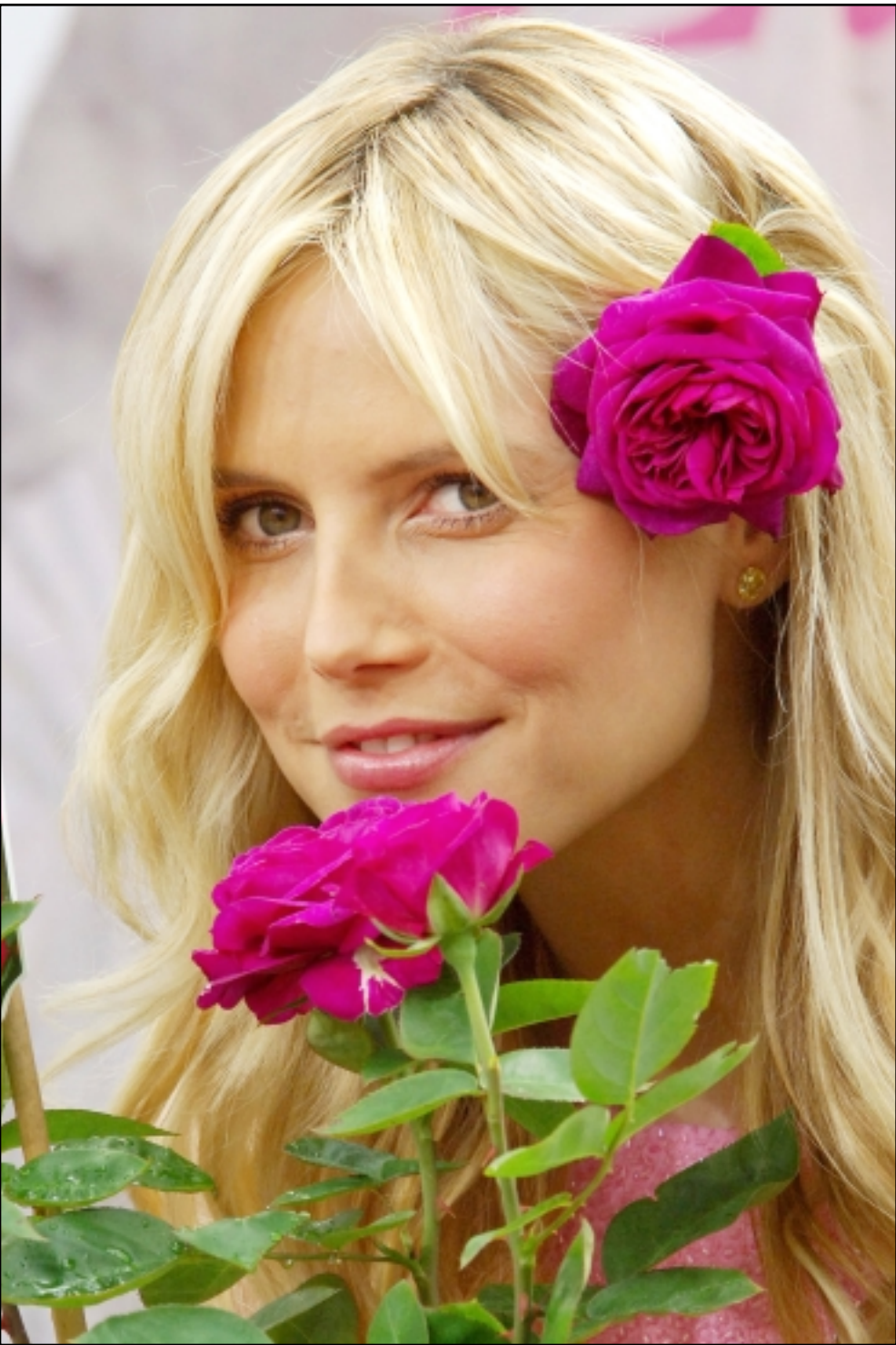
عارضة الأزياء الالمانية الشهيرة هايدي كلوم (31 عاما) ظهرت امام العدسات والكاميرات العالمية مع مجموعة من الازهار التي اطلق عليها اسمها، في مدينة كولون الالمانية

● «القدس العربي» حاولت سؤال الدكتورة سحر زوجة الفنان عبد العزيز مخيون حول مزاعم منير فرغوضت الاجابة وانفجرت في موجة من الزبائث تايلور ظهرت مجموعة من الافلام وحوالي 700 حلقة تلفزيونية مدة كل منها نصف ساعة.