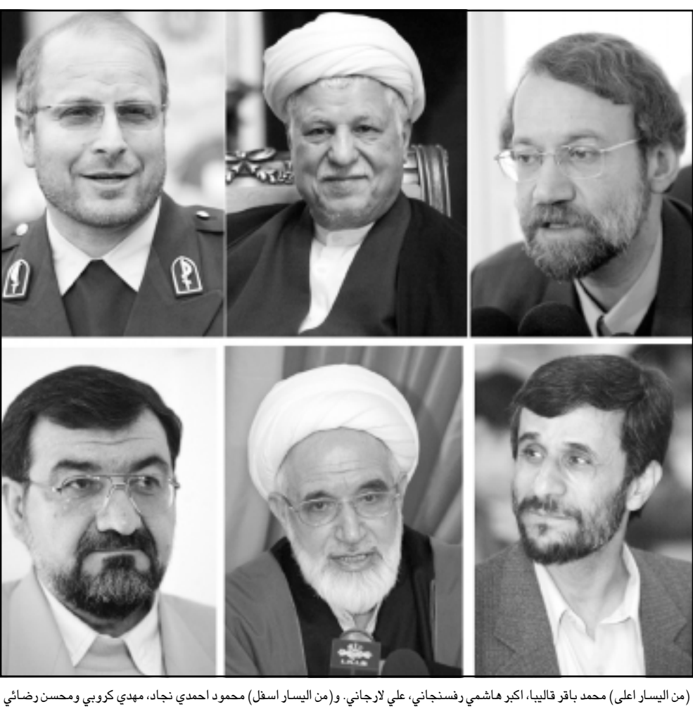
(من اليسار إلى اليمين) محمد باقر قاليباف، اكبر هاشمي رفسنجاني، علي لاريجاني، و (من اليسار اسفل) محمود احمدى نجاد، مهدي كروبي ومحسن رضائي