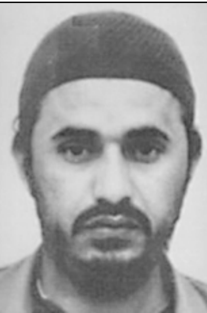
ابو مصعب الزرقاوي

بالطالبة بطلاق سراح الشياخ المعتقلين في سجون السعودية آنذاك من أمثال الشياخين سلمان وسفر. وربما تكون الجماعات التي تنفذ مثل هذه الأعمال فهدمت آنذاك لأن الرسالة يمكن إيصالها دون تبني العمل علنا، فالأمريكان والأنظمة العربية عرفوا من خلال القراءة المخابراتية لبيهان من يقف خلف القضية، وأما الجمهور فيكفيه أن يقرأ الطالب في البيان دون معرفة الجبهة، وإذا كان هناك ما لا تريد هذه الجماعات أن يرتبط بها من آثار سلبية للحادث فإنها تكون قد خلصت منه من خلال عدم تبني الحادث بشكل صريح ومعلن.