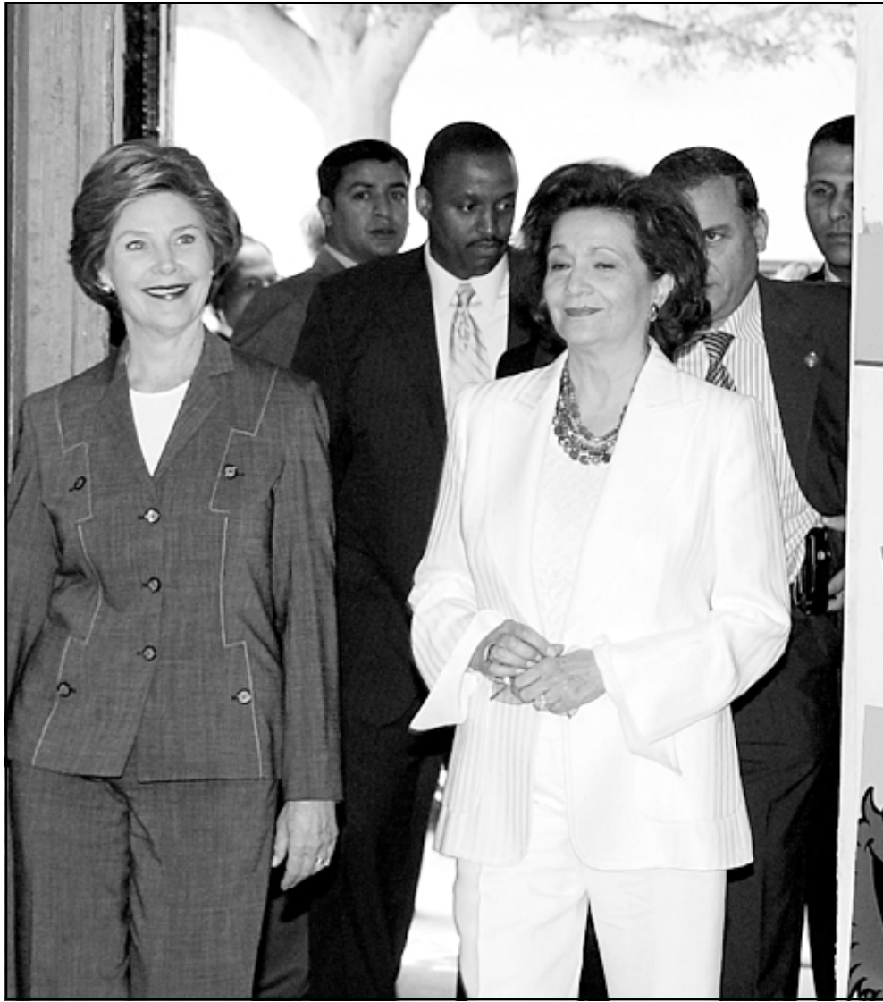
السيدة الأمريكية لورا بوش في زيارة للإثار المصري زاهي حواس، واليسار مع السيدة سوزان مبارك في افتتاح برنامج «افتتح يا مسمم» للاطلاع في القاهرة