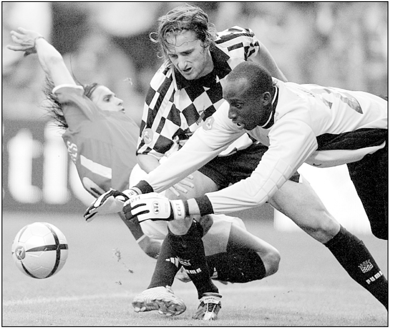
لقطة من إحدى مباريات بنفيكا البرتغالي

وأشار متولي الي انه نجح ايضا في التعاقد مع