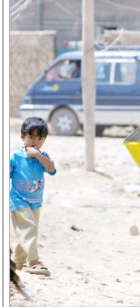
عراق ما بعد الاحتلال، فطلتان عراقيتان تتقلان المياه في مدينة الصدر شمالي بغداد التي تغتفر الكثير من احيائها الى المياه والكهرباء والخدمات الأساسية