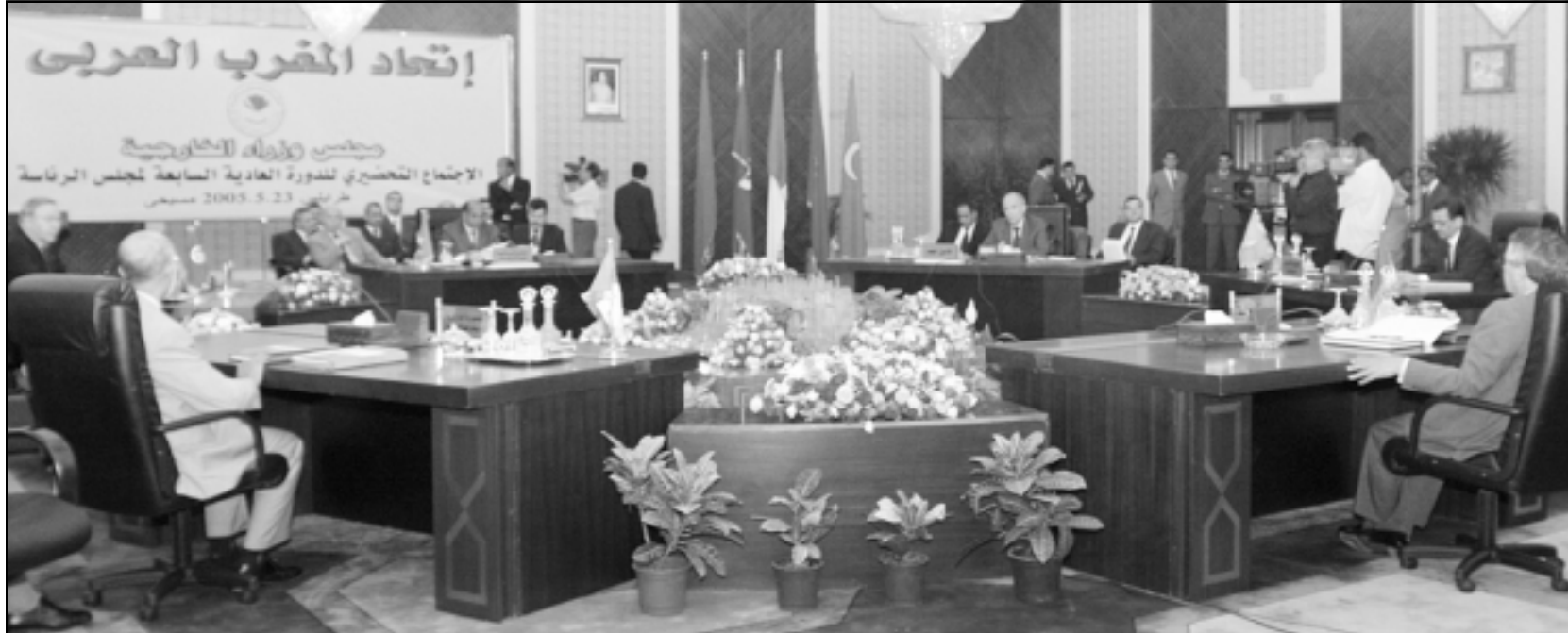
وزراء خارجية المغرب العربي مجتمعين في طرابلس

■ طرابلس- الرباط- يوبي أي- اف ب: أقر العاهل المغربي محمد السادس عدم المشاركة في قمة اتحاد المغرب العربي المقرر عقدها في 25 و26 ايار (مايو) الحالي في طرابلس بسبب موقف الجزائر من قضية الصحراء الغربية كما أعلن مصدر رسمي في الرباط مساء الاثنين.