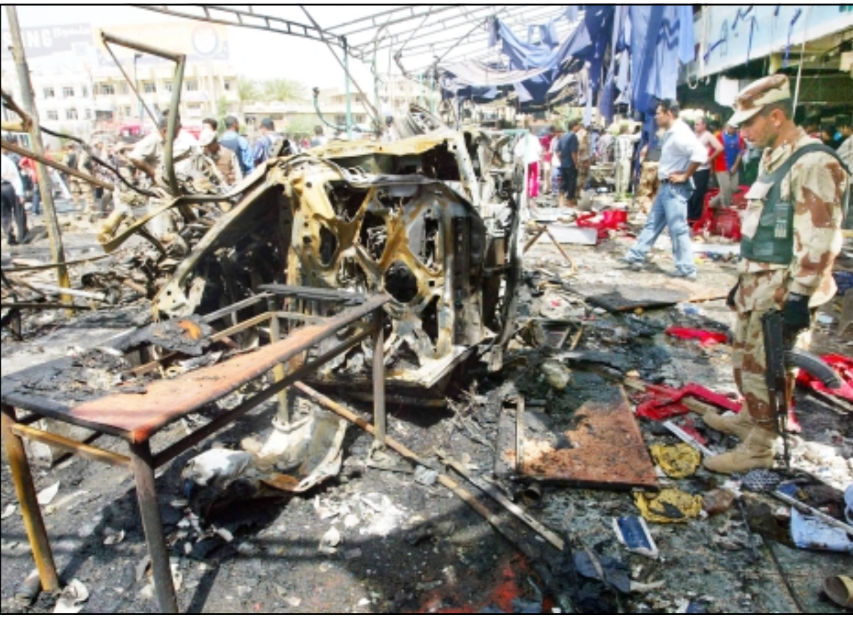
جندي عراقي ومواطنون يعانقون آثار تفجير السيارة المفخخة بطعم في بغداد أمس

لناقشة الأزمة، وقتل أكثر من 12 من كبار مسؤولي الحكومة بالرصاف في بغداد في هجمات دبرت بعناية في الأيام الأخيرة في محاولة لنزع فتيل التوترات الطائفية التي تزايدت منذ فوز الشيعة بانتخابات 30 كانون الثاني (يناير) التي أدت إلى تهيم السنة الذين كانوا الفئة المسيطرة تحت حكم صدام حسين.