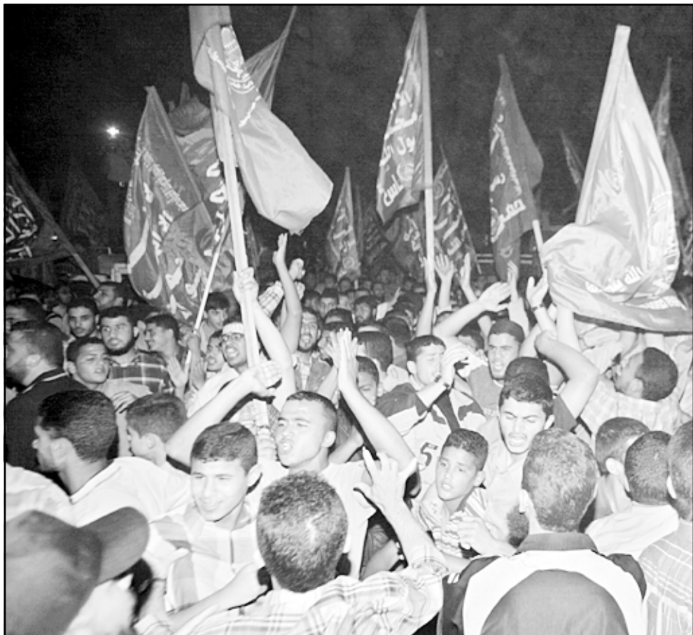
مؤيدون لحركة المقاومة الاسلامية حماس جظاهرو امام المحكمة الفلسطينية في غزة

في مقابلة هذه الاقوال أنت تبقى بلا لائحة دفاع، بالتناقفة السياسية التي تُفسد هنا كل شيء، تمنح الشرعية لكل المسافرين، ابن خيالي، الاديب يوسي سوكرى، هام منذ وقت غير بعيد من زيارة للجماعات الاسرائيلية في استراليا، التي هناك رجال هائي، واطباء، ومدقق حسابات، وذوي من حرة، وفي اساس العمود الفقري النوعي للدولة، وهو الرفاق تركوا واقاموا مواقع سكتية بديلة في سانت كلر، من هنا يفضل الاسرائيل من الناحية الداعمية ان يُجنى على هذه المنازل التي يكلف تدميرها بحد ذاته