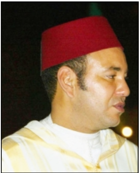
الملك محمد السادس