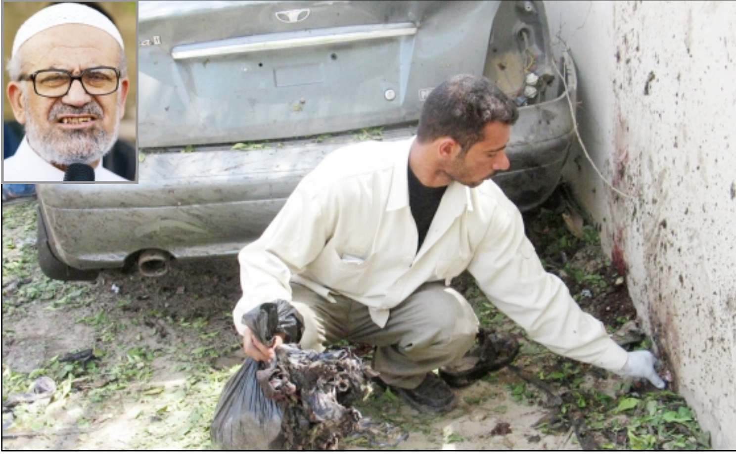
شاب يجمع اشلاء بشرية في موقع الانفجار بمدينة الحلة أمس، وفي الاطار محسن عبد الحميد رئيس الحزب الاسلامي العراقي

اعلن ان جنودا امريكين يتجاوز عددهم 50 جنديا داهموا منزل عبد الحميد في الساعة الرابعة فجرا واعتقلوه مع ابنته الثالثة ياسر ومقداد واسيد. ونفى عبد الحسين شندل وزير العدل العراقي ما صرح به مسؤولون عراقيون من قبل عن تحديد موعد محاكمة اركان النظام العراقي السابق. وقال شندل في تصريحات لراديو (سوا) امس ان التحقيقات مع كافة اركان النظام العراقي السابق لم تستكمل حتى الان حتى يتم تحديد موعد محاكمتهم. وفي وقت لاحق من وجه زعيم تنظيم «القاعدة» في بلاد الرافدين ابو مصعب الزرقاوي خطابا الى زعيم تنظيم «القاعدة» اسامة بن لادن تحت عنوان خطاب من جندي الى قائده، وأكد الخطاب استمرار الزرقاوي في مواجهة القوات الامريكية بالعراق، ونفى تكهنات ثارت مؤخرا حول انتقاله الى بلد مجاور للعراق لتلقي العلاج واختيار التنظيم خليفة له، وقال الزرقاوي انه موجود في العراق وأنه تعافى من الاصابة التي تعرض لها مؤخرا في العمليات العسكرية.