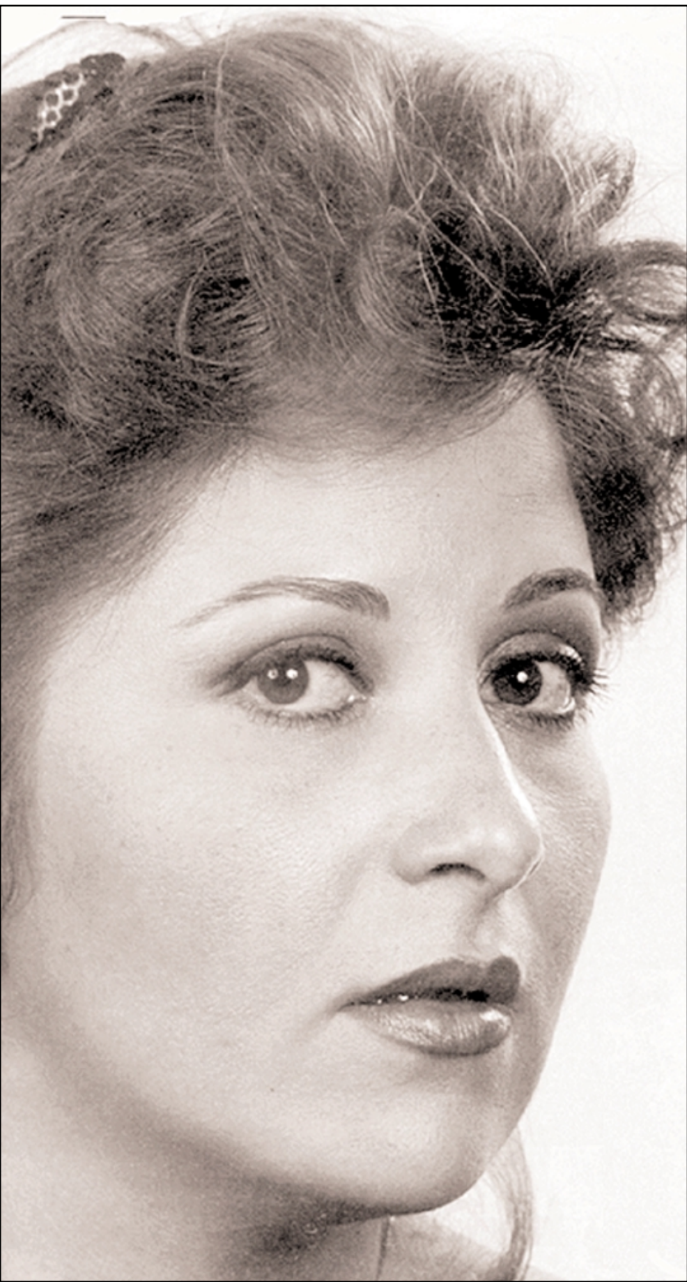
تستعد الفنانة المصرية بوسي للعودة الى الشاشة الصغيرة حيث ستقوم بدور البطولة في مسلسل جديد بعنوان «الحب بعد المداولة» للمخرج تيسير عبود

ولعل المعركة الاكبر التي تخاض هي معركة اسرائيل. فاسرائيل باتت تشكل نغمة اخلاقية، وصار الدفاع عن نظام التمييز العنصري الذي تقيمه في فلسطين شبه مستحيل. لذا تتخذ السياسة شكل اوهاب فكري، كما حصل مؤخرا في جامعة كولومبيا في نيويورك، في الحملة الترويجية الفجة ضد الاستاذ الفلسطيني جوزف مسعد. ولا يتكلم الراهب الفكري الا بالتهريج الثقافي. اي ان المهرج يلعب دور كومبارس للقمع. يصعد الي شجرة العرض، يتسعدن مقلدا اسباده، ومثيرا فيهم مزيجا من السخرية والراء. التهريج الثقافي يرس حركا على السيد علي سالم، كي يحوله الي ظاهرة، كما يجب ان يرس نفسه، وكما يريد الاسرائيليون الصهانية تسويق. التهريج جزء هامشي وموجود في الثقافة. لكن فضيلة السيد سالم انه حوله الي نكتة. ولكنها نكتة لا تثير الضحك او الحزن او حتى الشفقة. انها مجرد عارض اخلاقي اصاب صاحبها وكفى.