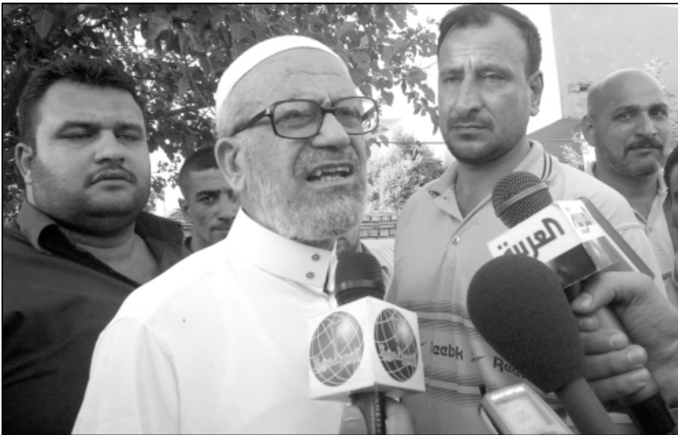
محسن عبد الحميد رئيس الحزب الاسلامي يرد على اسئلة الصحافيين امام منزله في بغداد امس