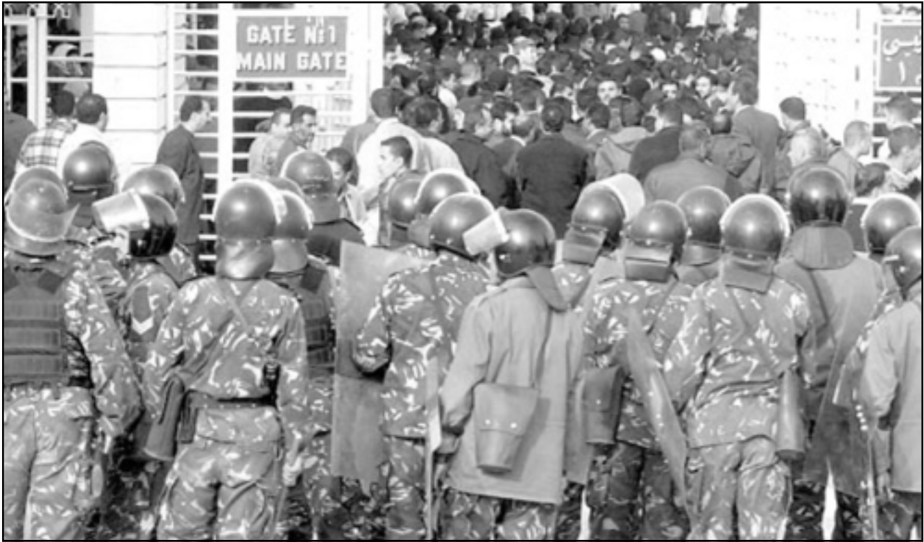
الجهاز الأمني من الأجهزة التي ما زالت تتحكم إلى حد بعيد بالحرية الصحافية في الأردن.

للوزراء بعد نشر مقال يتحدث عن ثمار مالية يجنيها بعض المسؤولين والوزراء، وتمت محاكمة الخيطان وادانة الصحفية مع غرامة خمسة دانانير لكن الصحفية رفضت قبول قرار الادانة واستأنفت الحكم ونقل عن رئيس تحريرها القول بالتمسك برفض الادانة.