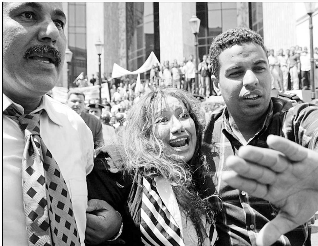
صحافية مصرية تعرضت للاعتداء على ايدي انصار الحزب الحاكم في يوم الاستفتاء الاربعة الماضي