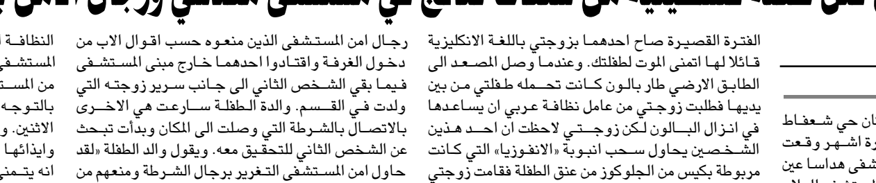
الطفلة القصيرة صاح احدھما يزوجتي باللغة الانكليزية

الفترة القصيرة صاح احدھما يزوجتي باللغة الانكليزية قائلا لها اتمني الموت لطفلك. وعندما وصل المصعد الى الطابق الارضي طار بالون كانت تحمله طفتي من بين يديها فطلبت زوجتي من عامل نظافة عربي ان يساعدها في انزال البالون لكن زوجتي لاحظت ان احد هذين الشخصين يحاول سحب انبوبة «النفوزية» التي كانت مربوطة بكيس من الجلوكون من عنق الطفلة فقامت زوجتي باخراج الطفلة بسرعة من داخل المصعد فيما تابع الاثنان النزول الى الطابق الاسفل. ويتابع محمد قائلا ان عامل النظافة العربي الذي لاحظ ما حصل لحق بالانثين بواسطة مصعد آخر الى الطابق الاسفل الذي يقود الى قسم الولادة محاولا اللصاق بهما وبعد ان فتش في ارجاء القسم كد لاحظ عامل النظافة ان إحدى الغرف مغلقة على غير عادة فقرر دخوله ليجد احدھما مختبئا تحت السرير والآخر خلف الباب، وعلى الفور قام عامل النظافة باستدعاء