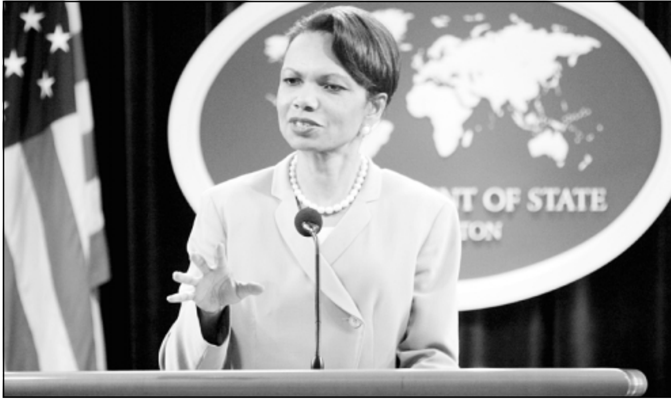
وزيرة الخارجية الامريكية كوندوليزا رايس خلال مؤتمر صحفي في واشنطن الجمعة

واشنطن - من بيتر ماكلر: اطلقت وزيرة الخارجية الامريكية كوندوليزا رايس عشية اول جولة كبرى لها في المنطقة، دعوة الى دول الشرق الاوسط لاحلال الديموقراطية واعربت عن قلقها من مبيعات الاسلحة الاسرائيلية للصين. وعقدت رايس مؤتمرا صحافيا لتمهيد لجولتها في الشرق الاوسط التي تشمل الضفة الغربية وايران والاردن ومصر والسعودية قبل ان تتوقف في بروكسل للمشاركة في مؤتمر حول العراق وفي لندن لحضور مؤتمر مجموعة الثماني. واوضحت رايس في المؤتمر الصحفي الذي عقد ليل الخميس الجمعة انها ستعمل خلال جولتها راية الاصلاحات الديموقراطية التي رفعها الرئيس الامريكي جورج بوش في تلك المنطقة المضطربة من العالم. وأضافت «أمل في التحدث مع كافة الشعوب حول التغييرات التي تجتاح المنطقة وحول مسؤولياتهم كاعضاء مهمين في العالم العربي لنشر التغيير في الشرق الاوسط». وقالت رايس انها ستلتقي في مصر أكثر المحطات حساسية في جولتها الشرق اوسطية، خطايا يتعلق بالسياسة، وكانت الوزيرة الامريكية قد الغت زيارة الى ذلك البلد في آذار (مارس) الماضي لأسباب من بينها اعتقال احد زعماء المعارضة المصرية. وحدثت رايس مصر الحليفة الرئيسية للولايات المتحدة، على تطبيق الاصلاحات السياسية بعد ان سمحت باجراء اول انتخابات رئاسية يشارك فيها عدد من المرشحين. واعربت رايس عن أملها في ان تسمح مصر للمراقبين الدوليين بالاشراف على الانتخابات الرئاسية التي ستجري في ايلول (سبتمبر) ويشارك فيها للمرة الاولى