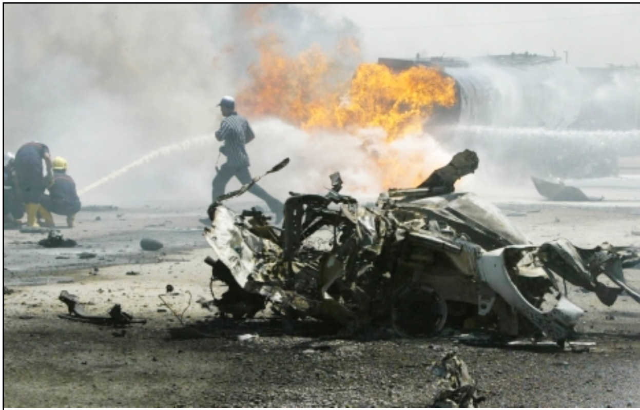
حلم سيارة ملغومة انفجرت في بغداد الجمعة (18 أيار)

مصرع عصري مارينز في الرمادي.. وواشنطن ضللت لندن حول استخدام النابالم بالغزو