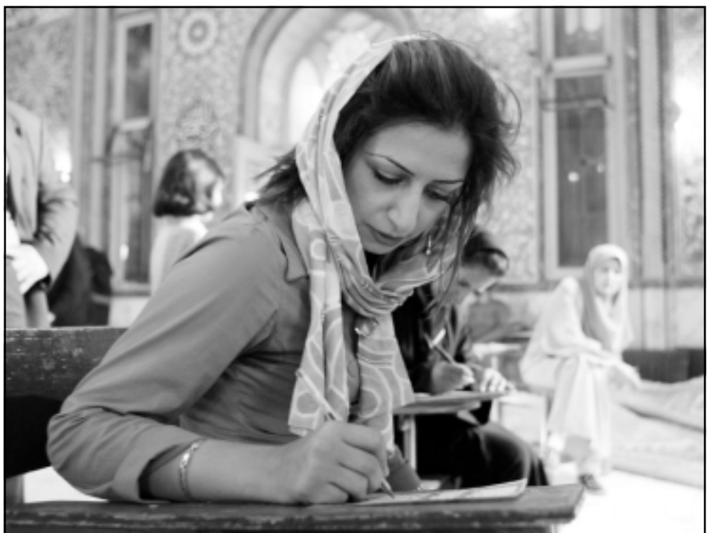
ايرانية تدلي بصوتها في أحد مراكز الاقتراع في طهران الجمعة