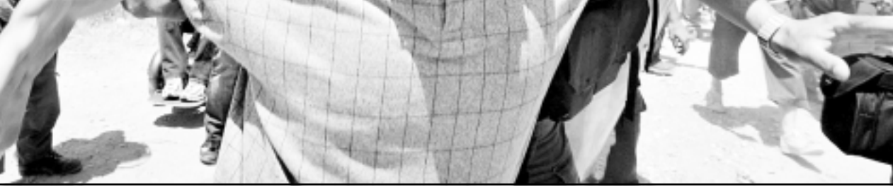
احد المتظاهرين الفلسطينيين اثناء اعتقاله وهو يحتج ضد جدار الفصل العنصري في قرية بلعين

واضافت الوثيقة بحسب «يديوت» ان ابداء من 10 تموز (يوليو) سينقل الجيش الاسرائيلي الطرق في شمال المنطقة بهدف منع مستوطنين من مستوطنات مثل (يتسهارا وايتمار ونواح وكوسيم) من عرقلة تنفيذ خطة فك الارتباط.