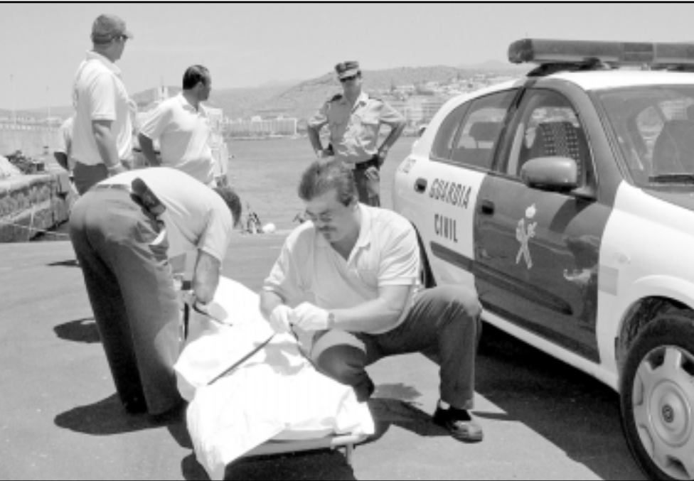
مسعفون وضباط اسبان يعتنون ببعثة مهاجر وصل الخميس متبا برفقة آخرين الى جزر الخالدات

وستبدا الشرطة السبت بترحيل المهاجرين المغاربة الى بلدهم بموجب اتفاقية موقعة بين مدريد والرباط تقبل الأخيرة بموجها استقبال مواطنيها الذين يحاولون الدخول بطريقة غير قانونية الى الأراضي الإسبانية ورغم أن اسبانيا وبعد انتهاء مسلسل تسوية اوضاع المهاجرين السريين يوم 7 ايار/مايو الماضي قد اكدت انها ستعذر المهاجرين السريين الذين يوجدون في البلاد او الذين يهاجرون لاحقا، فانغاربة ما زالوا يتوافدون على اسبانيا.