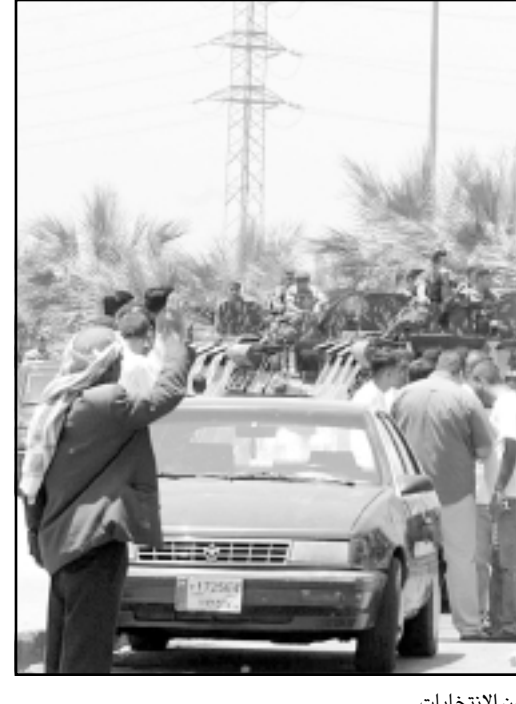
قوات لبناية تجوب شوارع طرابلس عشية الجولة الاخيرة من الانتخابات

1- وجود معادلة قديمة/ جديدة تقضي باختيار رئيس البرلمان سواء من الجنوب أو من البقاع حيث الاكثورية الشيعية التي حسمت كتلتها الكبريتية خيارها مبدئياً في اتجاه بري وفاقاً لاتحادات لبناية بان ترشح الطائفة الشيعية شخصية للرئاسة الثانية وتوافق عليه الطوائف الاخرى. 2- تاييد كتلة اساسيين/اساسيين اعاداة انتخاب بري مما كتلته النائب يصفهان الاكثورية المطلقة في المجلس وليد جنبلاط اللذين يصفهان الاكثورية المطلقة في المجلس مع كتلتتي «حزب الله» والرئيس بري، و«شيء يوحى