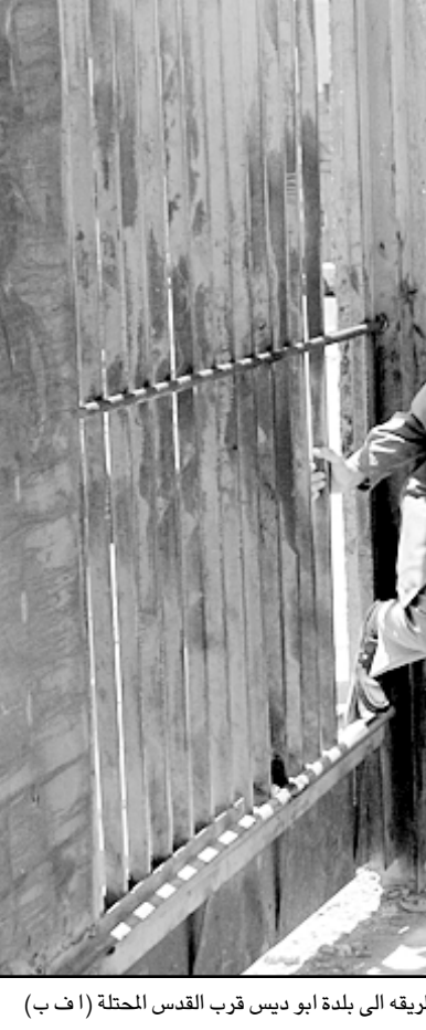
مسن فلسطيني يستغل وجود فتحة في الجدار لواصله طريقه إلى بلدة أبو ديس قرب القدس المحتلة

إطلاقها سراح 400 أسير في الثاني من شهر حزيران (يونيو)، صعدت من حملات الاعتقال الواسعة بحق المواطنين خاصة جنوب الضفة الغربية.