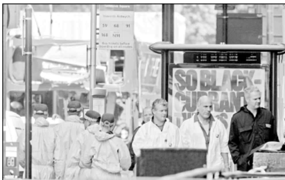
خبراء متفجرات يتفقدون الباص قبل سحبه من موقع الانفجار وسط لندن

بقوة صفوف أبناء الثور في مواجهة أبناء الغلام، وهي تفرس بالاساس الاعتقاد بامكانية الانتصار على الازهاب بالوسائل العسكرية فقط. من الاكثر سهولة ارسال عدد كتاب عسكري الى افغانستان لتطهير جنوب طالبان او خوض حرب شوارع في الفلوجة، ولكن من غير الممكن تقريباً القضاء على الفلج. ولكن بين هذين الطرفين البعدين توجد مساحة هائلة من التعاون التي يمكنه ان يقصص الدعم والاسناد لمنظمات مثل القاعدة، وزيادة احتمالات احباط عملياته واعتراضها. وزير خارجية انكلترا السابق، روبين كوله، قال في مقالة انتقادية لشعرها في «الغارديان» بعد عمليات لندن بيوم واحد بان أبناء الثور الغربيين لم يسارعوا في السابق لمساعدة المسلمين في الصرب خلال الدعوة للحرب العالمية ضد الازهاب