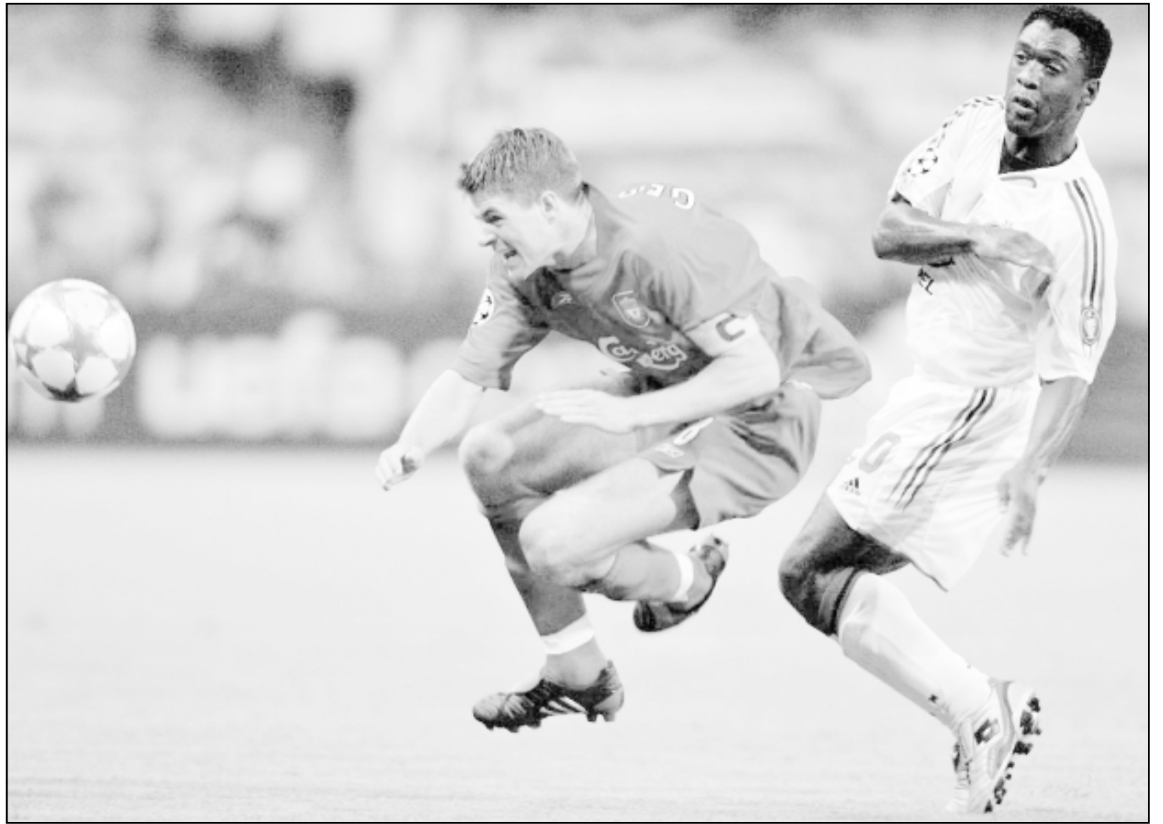
لقطة من إحدى مباريات ليفربول

وتشارك في البطولة عشرة منتخبات من كل من صربيا وكندا والولايات المتحدة وفرنسا وأستراليا وكندا والولايات المتحدة وكوريا الجنوبية إضافة إلى المنتخب السويدي بكامله مرة أخرى.