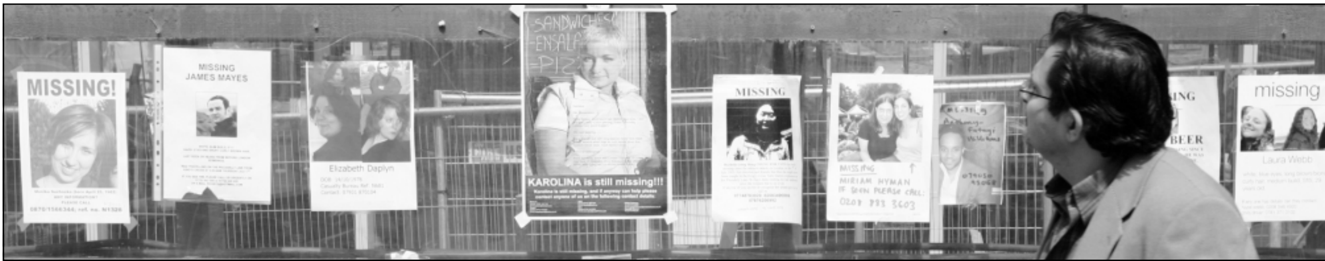
بريطاني ينظر الى صور المفقودين في انفجارات لندن