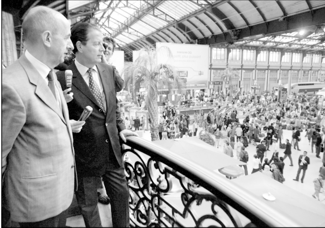
وزير النقل الفرنسي دومينيك باربان (يمين) خرج السبت لتفقد اجراءات الامن «محطة ليون» إحدى أكبر محطات القطار بباريس مرفوقاً بعميد شركة النقل بالسكة الحديدية لويس غالوا

حيث بدأت الأمور طبيعية جداً. وابلغ متحدث باسم الخطوط الجوية الفرنسية «القدس العربي» ان الهجوم على لندن لم يكن له أي مردود سلبي على برنامج رحلات الخطوط الجوية الفرنسية. وأوضح المتحدث ان الشركة الفرنسية للطيران تضمن 18 رحلة يوميا بين العاصمتين باريس ولندن. ولقد أهملت الشركة المسافرين عبر رحلاتها مدة أسبوعين لتأجيل سفرهم أو الغائه مقابل تعويض تذكر السفر. ووجدت عمالها لضافة الحذر بدءاً من مراقبة قوائم المسافرين وأمتعتهم وأكثر من شخص، خاصة في خاتمة «الخطر» الاتجاهات المصنفة في خاتمة «الخطر» مثل دول المغرب العربي واسرائيل والولايات المتحدة. وفوق السماح لرجال أمن مدنيين مسلحين داخل الطائرات يسمع أحياناً بوجود قوات تابعة لقوات درك مختصة في مكافحة الإرهاب أي من الطائرات والتي تعرف اختصاراً باسم «جي جي ان».