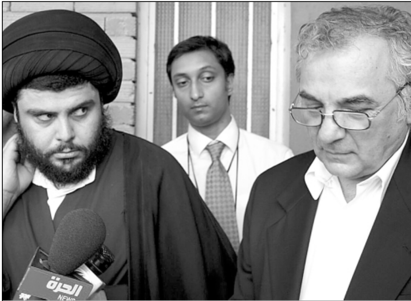
السيد مقتدى الصدر مع مبعوث الامين العام للامم المتحدة في النجف امس