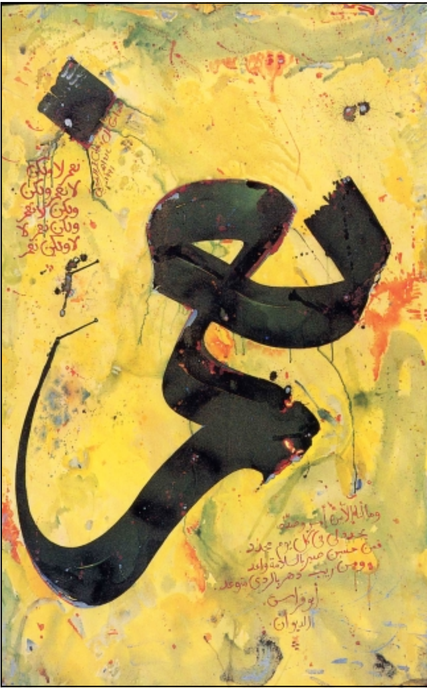
من أعمال الفنان علي عمر ارميص، «القدس العربي»

حدت قرب اليابان من آسيا وابتعادها عن الغرب، إلى جانب الظروف التاريخية، الممارسة والمواقف من الترجمة، وكانت الحاجة أوى إلى المعلومات، قبل الاهتمام بالحضارة الغربية في ذاتها، وإن نتج عن هذا إدخال أفكار جديدة وصيغ أدبية غير معهودة، وعبارات وتراكيب نحوية غير تقليدية. ذلك كان له تأثير بالغ في