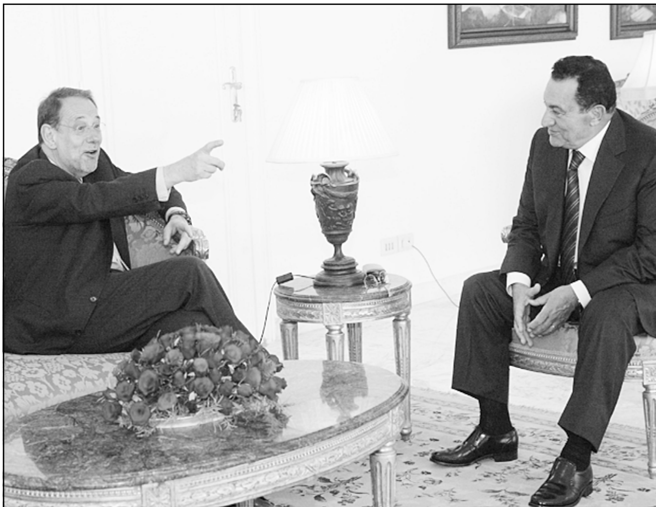
الرئيس المصري حسني مبارك لدى استقباله خافيير سولانا منسق السياسة الخارجية للاتحاد الاوروبي امس

تسلطت الاضواء من جديد على الداعية الاسلامي الشيخ يوسف القرضاوي الذي يزور وطنه الاصلى مصر، حيث كانت له تعليقات حول ثلاث قضايا خلال الساعات الاخيرة، واحدة تتعلق بما تردد من شائعات حول اهدار دم الرئيس حسني مبارك، والثانية بشأن تفجيرات لندن، والثالثة حول اعدام السفير المصري في بغداد. ففي رد على سؤال قناة «الجزيرة» في القاهرة نفى القرضاوي بشدة ان يكون قد اذنت بقتل الرئيس المصري، متهمًا على الذين يقولونه، ما لم يقله وكأنه آلة لانتاج الفتاوى. و اضاف القرضاوي انه رغم اختلافه مع الحكومة المصرية بشأن سياساتها الطبيعية مع اسرائيل، فانه لا يلجأ الى مثل تلك الفتاوى، مع اشارة الى انه لو اراد فعلا اصدار مثل هذه الفتوى لاصدرها وهو خارج مصر ليامن شر الملاحقة! اما بالنسبة لتفجيرات مترو الانفاق في لندن فقد ابلغ القرضاوي صحيفة الشرق القطرية انه يستنكر بشدة تلك التفجيرات، مضيفا انه قد فوجيء متلما فوجيء العالم كله بما حدث في لندن من تفجيرات راح ضحيتها العشرات من الارباء والاعميين الذين لم