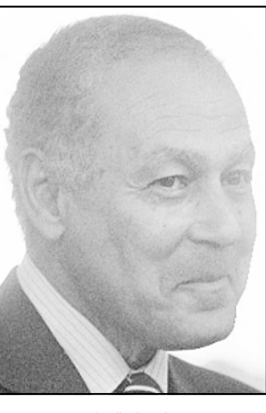
أحمد أبو الغيط

وأضاف أبو الغيط «لا يمكن لإسرائيل أن تأكل الكعكة وتبقىها كاملة إلى مصر والفلسطينيين وكل العالم».