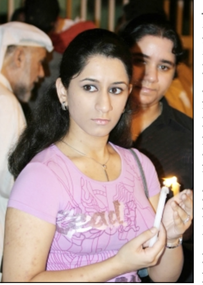
فتاة بحرينية تشعل شمعاً أمام السفارة البريطانية في النمامة تابيناً لضحايا

اعتقلت الشرطة البريطانية ثلاثة اشخاص في مطار هيثرو اللندني بموجب قانون مكافحة الارهاب حسبما اكد مسؤول بارز في الشرطة البريطانية امس الاحد مشيراً الى انه لم يثبت وجود «علاقة» بين عملية الاعتقال وتفجيرات لندن. وصرح برابن باديك كبير المتحدثين باسم الشرطة البريطانية في مؤتمر صحافي «تم القاء القبض على ثلاثة اشخاص في مطار هيثرو بموجب قانون مكافحة الارهاب لكننا لا نعرف بعد ما اذا كانت هذه الاعتقالات تتعلق بعلاقة» بالمتفجرات التي هزت مدينة لندن الخميس، واذ كان «هذا النوع من الاعتقالات يحدث اسبوعياً» ومن غير المناسب التكهن بوجود علاقة مباشرة بينها وبين الاعتداءات. وتكررت مجلة «تايم» امس الاحد ان محققين في لندن يدرسون احتمال ان تكون التفجيرات التي وقعت في لندن الخميس تمت باستخدام متفجرات عراقية وفرها ابو مصعب الزرقاوي، زعيم «تنظيم القاعدة في بلاد الرافدين» ونقلت تلك التفجيرات في تقرير نشرته على موقعها على الانترنت عن مسؤول امريكي قوله ان «الزرقاوي هو مصدر محتمل (للك المتفجرات) لانه يسيطر على كمية غير محدودة من المتفجرات والخدرة في العراق».