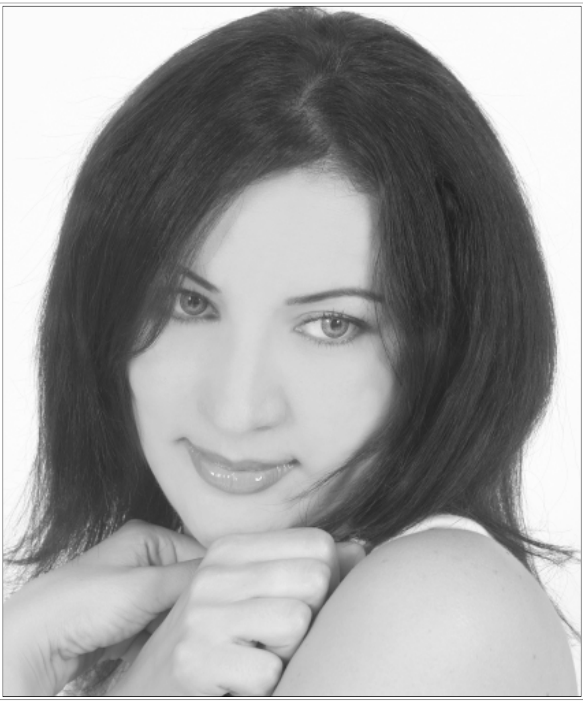
عاليا الركاب

أضاف: لم يقلل الإعلان من نجومية الفنان أو حتى يساهم في تقليل شأنه أمام جمهوره.. وهذه وجهة نظر