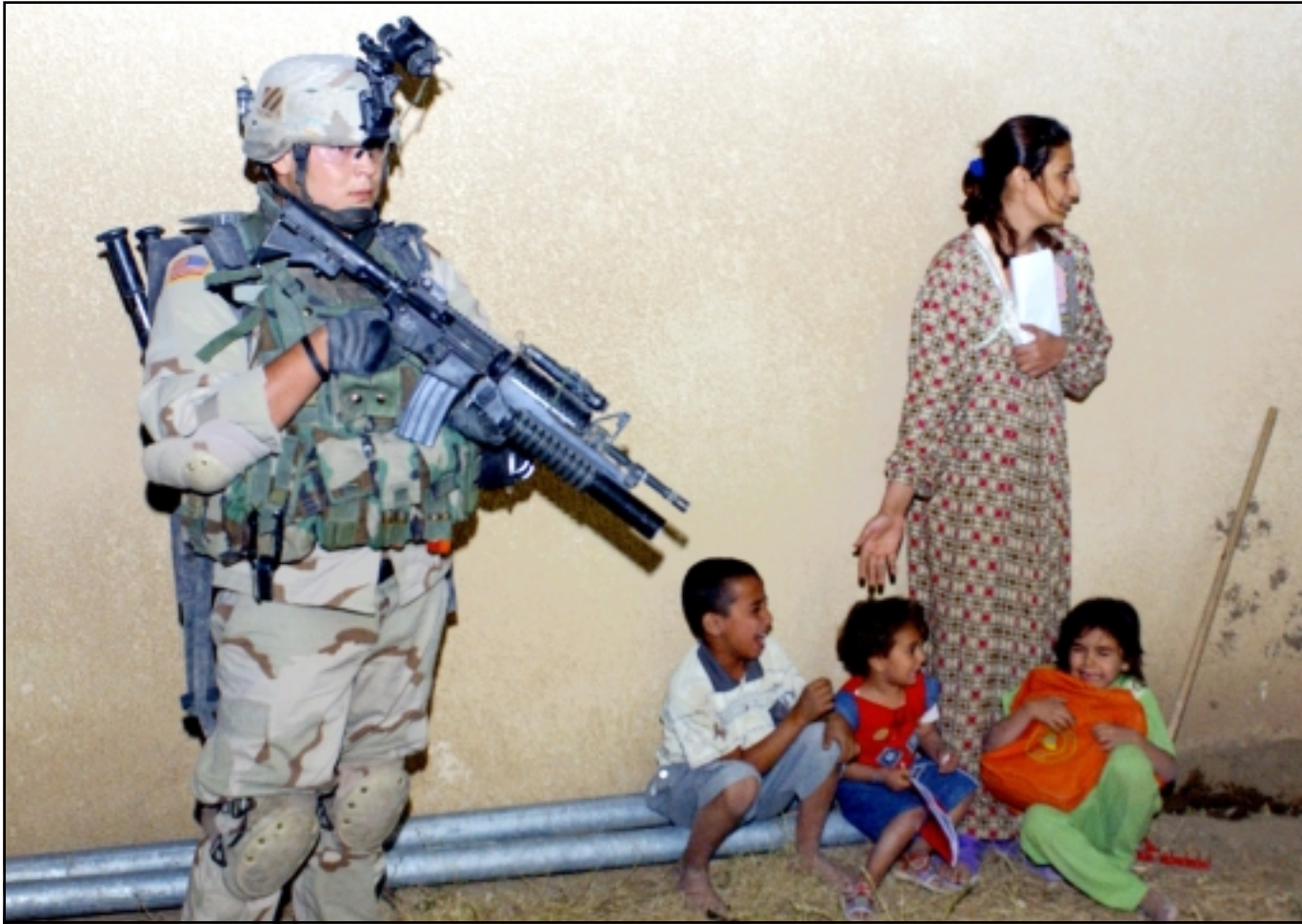
جنود امريكيون يقتحمون منزلا في مدينة تكريت ليليا ويعبرون الاهالي

وقتل احد عناصر حماية وزير الصناعة العراقي اسامة التجني (سني) واصيب آخر في هجوم مسلح في غرب بغداد استهدف امس موكبه الذي لم يكن الوزير فيه حينما أعلن مصدر في وزارة الخارجية العراقية، وأكد المصدر ان «وزير الصناعة لم يكن موجودا في موكب العجلات عند حدوث الهجوم». وقال مصدر الداخلية الذي رفض الكشف عن اسمه «قتل احد عناصر حماية وزير الصناعة العراقي واصيب اءخر في اطلاق نار من مسلحين مجهولين، مضيفا ان الهجوم وقع في منطقة العامرية (غرب بغداد). حسين ابي ان يعانى من نقص في المال، موضعا انه «لم يتلق اجرا من عائلة صدام حسين لانها لا تملك