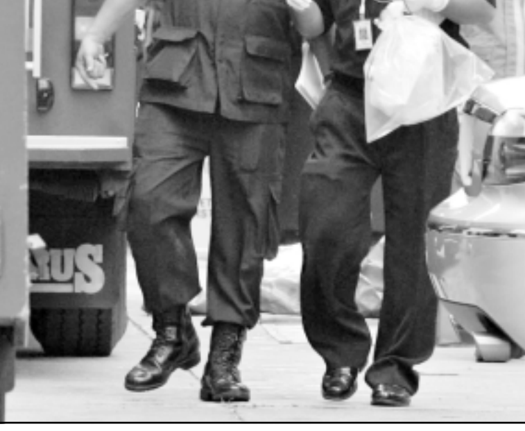
عناصر من الشرطة المالبزية يحملون طردا مشبوها وصل الى السفارة الاسترالية في كوالالمبور

من جهة اخرى، وجه الامين العام لمنظمة المؤتمر الإسلامي اكمل الدين اوضحت وكالة انباء الاناضول ان اثنين من المصابين السبعة في حالة خطيرة.