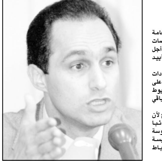
القاهرة - «القدس العربي» من حسام ابو طالب:

علمت «القدس العربي» من عضو بارز في الامانة العامة للجنة السياسات والتي يرأسها جمال مبارك ان مفاوضات سرية بدأت بالفعل بين الكنيسة واسانة اللجنة من أجل الترتيب والتنسيق كي يحظى الحزب الوطني بنفس ايدى الكنيسة التي حصل عليه في انتخابات الرئاسة القادمة. وتشير المعلومات الى ان جمال مبارك عرض على قيادات الكنيسة اختيار عشرين فصيلا لخوض الانتخابات على مستوى القاهرة وعشائر الإسكندرية والبحيرة وأسيوط بالإضافة لعدد آخر لا يتجاوز ثلاثين مرشحا في باقي المحافظات. غير ان معلومات الكنيسة تؤكد ان البابا شنودة يطمح لأن يفت تحت سقف البرلمان في دورته القادمة ثلاثون نائبا فقط ومن المتوقع حسب تصريحات خاصة لأحد النساوسة لـالقدس العربي» طالبا عدم ذكر اسمه ان تقوم الكنيسة بسحب دعمها للحزب الوطني اذا ما تم التعامل مع الأقباط بنفس الأسلوب الذي اتبع في الانتخابات السابقة. من جانبه اشار الاب يوفانيو راهب كنيسة العذراء مريم بعشوية البكاري يحي فيحصل الى ان الأقباط يأتون لهم التواجد في مختلف مؤسسات الدولة وفقا لنسبة عددهم في المجتمع. وأشار الى ان الأجهزة السياسية المختلفة تعلق ابوابها في وجه الأقباط وقد جاء الوقت الذي ينبغي على الاعتراف ان يستجيب طابعهم التاريخي. وقال مصدر قريب من كاتدرائية العياضية لـالقدس العربي» بوجود مفاوضات سرية مع الحزب الوطني. وقال بالتمس: «أرجو ان يكون السيد جمال مبارك متسع الألق كوالده الذي يستجيب لمطالب عنصري لامة».