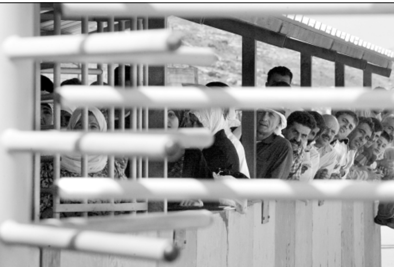
عشرات الفلسطينيين عالقين عند حاجز عسكري قرب مدينة نابلس في الضفة

الشاطيء وحى الشيخ رضوان، أصيبوا برصاص الشرطة المركزي الخيم، من خلال دمددم متفجر محرم استخدامه دولياً». وقالت المصادر إن «صور الأشعة التي أخذت لعدد من الجرحى أثبتت أنهم أصيبوا برصاص متفجر من نوع دمددم المحرم استخدامه دولياً». غير أنه لم يتسن لسالقدس العربي» التأكد من صدقية ذلك.