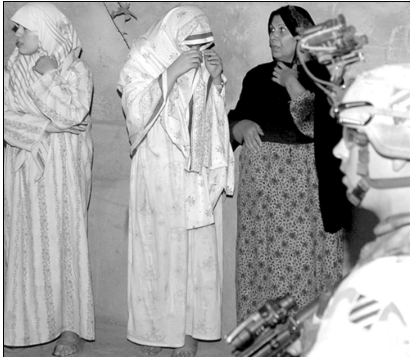
جندي امريكي يراقب سيدات عراقيات خلال عملية اقتحام في تكريت امس

وقال أحد مواطني الحديثة، «إذا اردوا تنظيف المدينة، عليهم ان لا يقوموا بعملهم من خلال اطلاق النار على اهنا». وقال أحد مشايخ بلدة مجاورة الحديثة ان الجنود الامريكيين قاموا بمحاصرة المدينة، ووصفوها، ثم ادخلوا القوات البرية، وقال ان الجنود العراقيين وان كانوا جزءا من العملية انهم لم يشاهدوا مع الجيش. وفي الوقت الذي يقول فيه الجيش ان الهدف