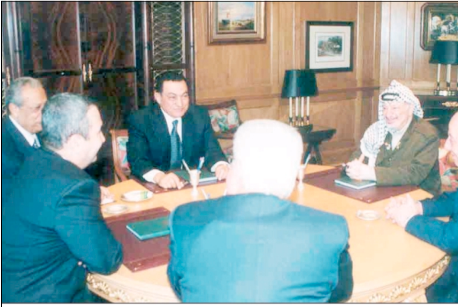
الرئيس مبارك، الرئيس عرفات، أبو علاء، إيهود باراك، دافيد ليفي