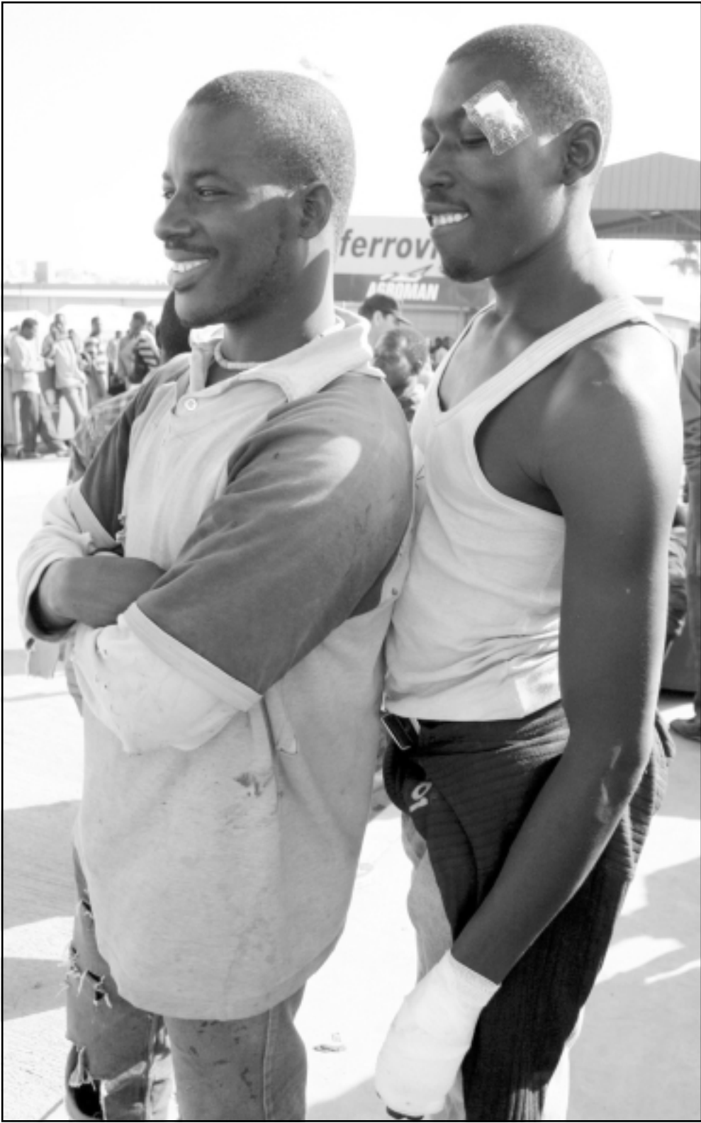
افريقيان كانا ضمن ال500 مهاجر الذين حاولوا اقتحام اسوار مليلية فجر امس الاربعااء

بمركز اعتقال الأجانب بلانزاوتي في انتظار ترحيلهم نحو بلدهم الاثني فورا صباح الثلاثاء من المركز بعد ان اكسروا أحد صفايح سياج سقف مدخل المركز المذكور الواقع ببطار الجزيرة.