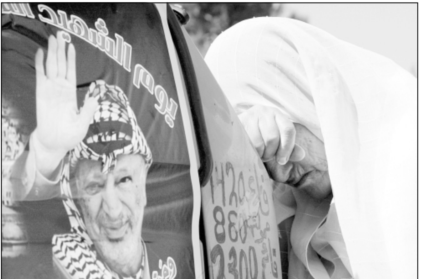
سيدة فلسطينية تتكلم على حائط غلقت عليه صورة عرفات اثناء مظاهرة امام المجلس التشريعي في رام الله

وأضاف بركة: رأيت انه من المناسب توجه هذا النداء قبل اسبوعين من قلب رام الله المحاصرة، واليوم لثابت نرى ان هناك بوادر لحالة تدهور جديدة، وتكرر نداءنا الحار من هنا، من قلب مدينة الناصرة، وعاصمة وقعة نضالنا، نحن ابناء الشعب الواحد المتحذرين في وطننا، اننا نقول لاخوتنا ان الجدل والنقاش الفلسطيني الداخلي يحسم فقط عن طريق صناديق الاقتراع، وليس عن خلال توابيت نقل شهداء سقطوا بنبوان ابناء شعبهم. وأوضح ان الاحتلال الاسرائيلي يمتدني دوام هذه الحالة الصعبة، لانها تخدعه هو فقط، على ابناء شعبيته، اننا نرى ضرورة وجود سلطة واحدة وقانون واحد وسلطة واحد، ولا يجوز تدنيس النضال الفلسطيني العريق المتميز على مدى عشرات السنن باقتتال داخلي بغضض، وتابع ابناء هذا