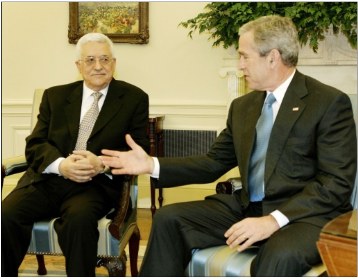
الرئيس الامريكى جورج بوش بعد يده لمصاحفة رئيس السلطة الفلسطينية في البيت الابيض امس

الخطر الحقيقي يكمن في مخطط الفصل بين الضفة الغربية وقطاع غزة، معتبرين ان خطوات إسرائيل المتشددة في الضفة الغربية اقليماً متحدا كونفدراليا مع الأردن.