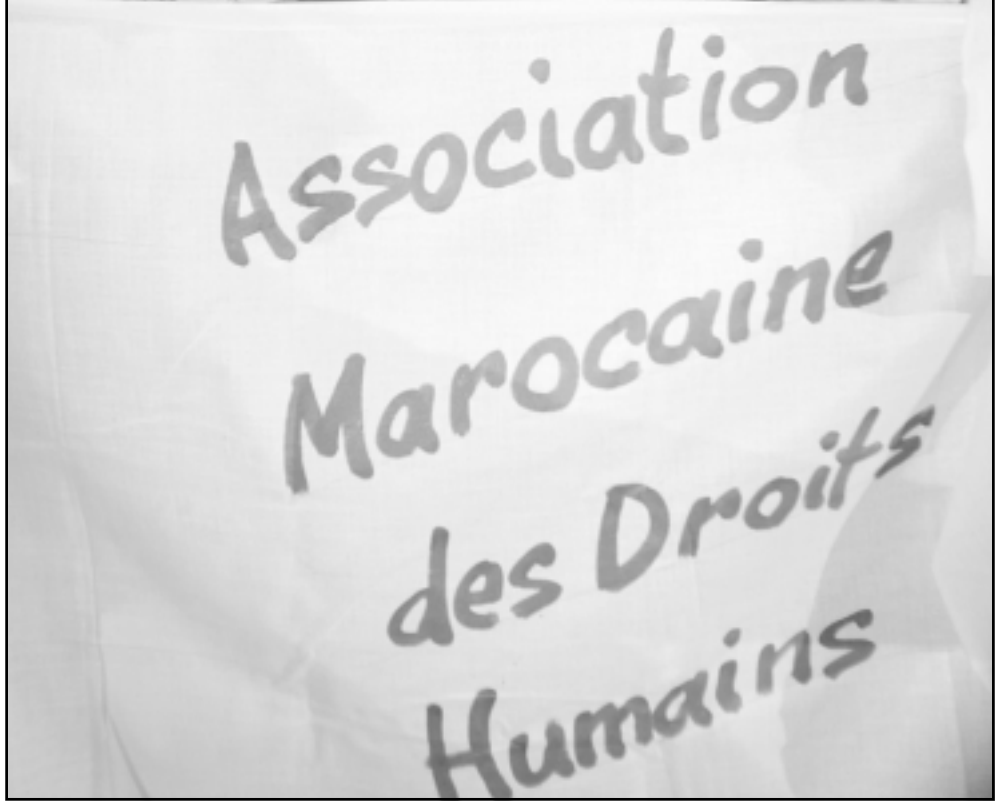
جانبا من المظاهرة التي جرت امام البرلمان المغربي بالرباط