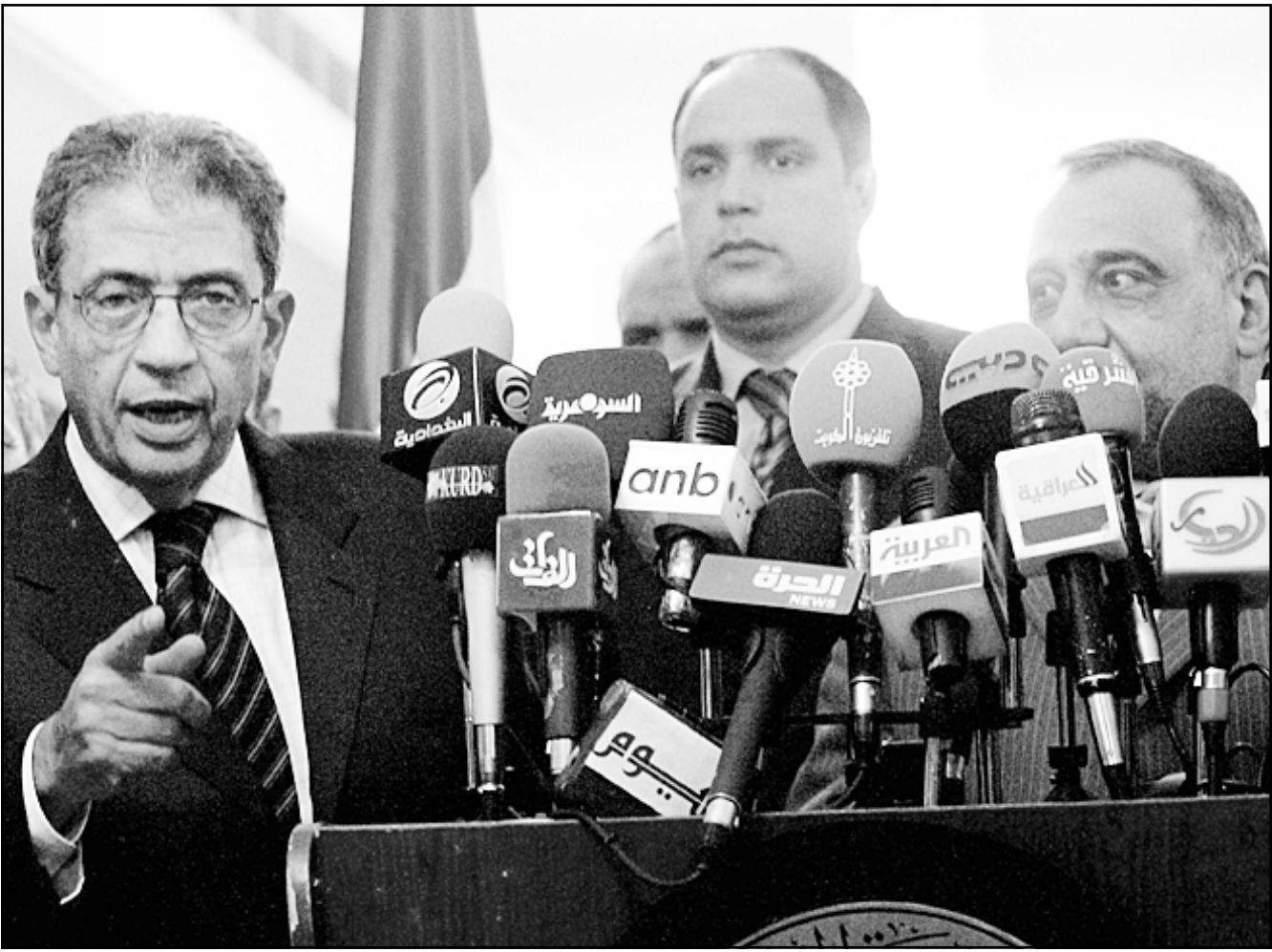
الامين العام للجامعة العربية عمرو موسى مع نائب الرئيس العراقي عادل عبد المهدي في مؤتمر صحافي في بغداد امس

في خطوة جديدة تعكس اهتمام واشنطن بإحلال السلام في السودان تبعداً اليوم جبراندي فريزر مساعدة وزيرة الخارجية الامريكية كونداليزا راييس زيارة رسمية الى السودان تستغرق ايام لتلتقي خلالها بكيار المسئولين في الحكومة. يأتي ذلك في الوقت الذي أعلن فيه وفد الحكومة السودانية لمفاوضات أوجا قبوله بجدول عمل قادمة التزوة الذي طرحته سكرتارية المفاوضات على الأطراف المشاركة لاعتماده لهذه الجولة على المفاوضات. من المقرر ان تلتقي مساعدة راييس بعدد من المسئولين بالسودان وتزور مدينة جوبا مركز خلاصها على بحث الأوضاع في دارفور وخطوات تنفيذ اتفاقية السلام والعلاقات الثنائية بين الخرطوم وواشنطن. وتضع الإدارة الأمريكية عدة شروط للتطبيق مع حكومة السودان أهمها تنفيذ اتفاقية السلام واستقرار الوضع بدارفور