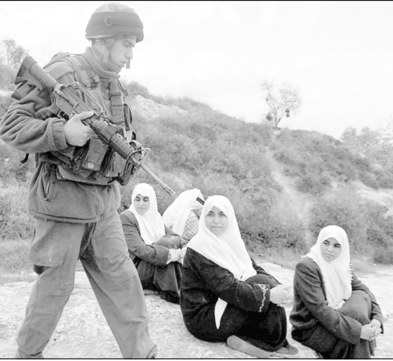
فلسطينيون ينتظرون السماح جنود الاحتلال لهم بدخول اراضيهم لقطف ثمار الزيتون في بلدة سالم

■ واشنطن - «القدس العربي» - وكالات: دعا رئيس السلطة الفلسطينية محمود عباس أمس الخميس في مؤتمر صحافي مع الرئيس الامريكى جورج بوش في البيت الابيض الى البدء بتنفيذ خارطة الطريق وصولا الى مفاوضات الوضع النهائي واداك العمل على ضمان استمرار الهدنة. من ناحية اعتبر الرئيس الامريكى ان على اسرائيل «ازالة النقاط الاستثنائية العشوائية ووقف التوسع الاستيطاني». وقال بوش ان السلطة الفلسطينية يجب ان ترفض وتتصدى لـ «الارهاب»، حتى يستنى مضي عملية السلام قدما. واذاف «الطريق الى الامام يجب ان يبدأ بمواجهة التهديد الذي تمثله عصابات مسلحة فلسطينيديمقراطية حقًا. وفي الاجل القصير يجب على السلطة الفلسطينية كسب ثقة جيرانها برفض ومكافحة الارهاب.» وتمارس واشنطن ضغوطا على