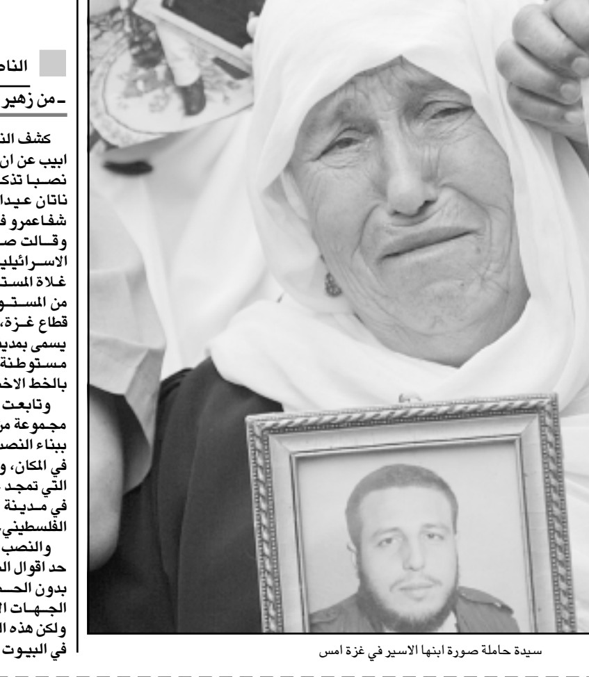
سيدة حاملة صورة ابنها الاسير في غزة امس

■ الناصرة - «القدس العربي» - من زهير اندراوس: كشف النقاب امس الخميس في تل ابيب عن عن غلاة المستوطنين اقاموا نصبًا تذكاريًا للارهابي اليهودي ناتان عيدان زادا، الذي نفذ مجزرة شفاعمرو في آب (اغسطس) الماضي. وقالت صحيفة «معاريك» الاسرائيلية التي اوردت النبا، ان غلاة المستوطنين الذين تخلأوهم من المستوطنات الكولونيالية في قطاع غزة. انتقلوا للعيش في ما يسمى بمدينة التيفوت، الى الشرق من مستوطنة تيناموت داخل ما يعرف بالخط الاخضر. وتابعت الصحيفة قائلة ان مجموعة من الشبان المتطرفين قاموا ببناء النصب التذكري للارهابي زادا الضفة الغربية المحتلة. وفور وصول التي تمجد عمله البطولي الذي نفذه في مدينة شفاعمرو في الداخل الفلسطيني. والنصب التذكري الجديد، على حد اقوال الصحيفة الاسرائيلية، اقيم بدون الحصول على تصاريح من الجهات الاسرائيلية ذات الصلة، ولكن هذه السلطات لم تقم كما تفعل في البيوت العربية غير المرخصة في