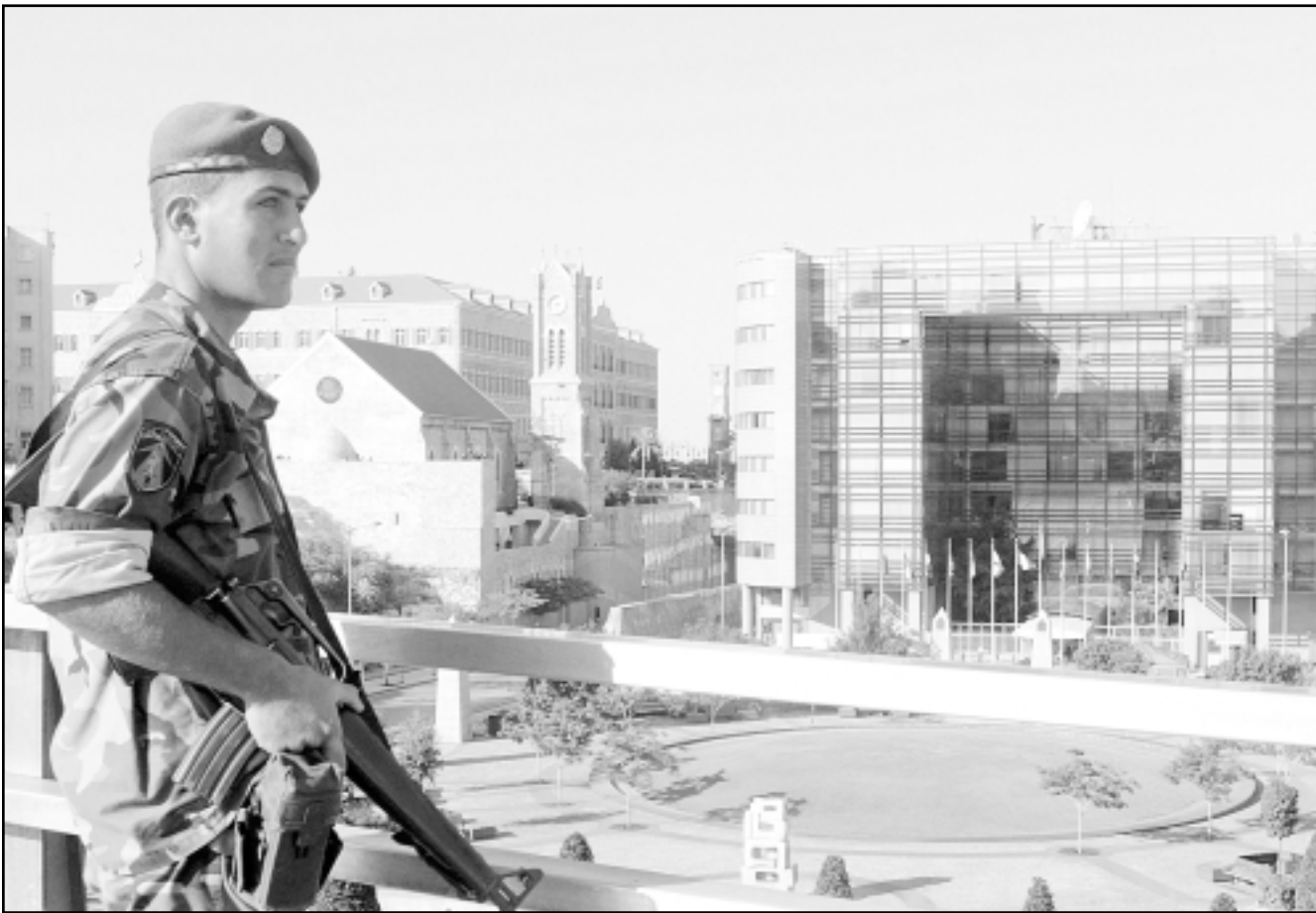
جندي لبناني يجرس مبنى الأمم المتحدة في بيروت أمس