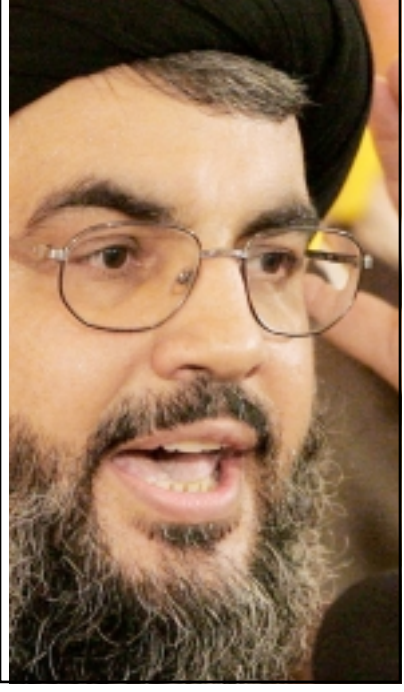
الشيخ حسن نصر الله

الشيخ حسن نصر الله عن امه في ان لا يكون تقرير ميليس «مسياساً» وان يتضمن «ادلة دامغة». وقال خلال اطار في الضاحية الجنوبية الشيعية لبيروت «نحن نخاف من التسييس لانه سيكون له تداعيات خطيرة وكبيرة لان الجريمة غير عادية وكبيرة». وأضاف «نريد استنتاجات واضحة وادلة دامغة».