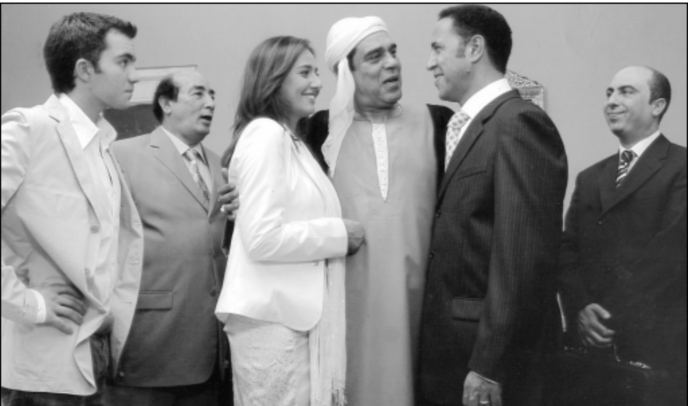
لقطة من فيلم «أريد خلعا»