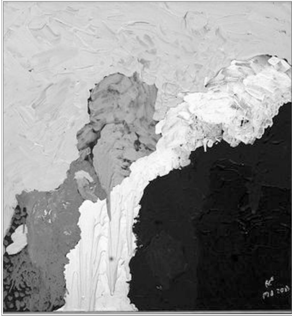
من أعمال الفنانة

ويصو الفيلم أيضا لقطات لقيور فلسطينيين دفنوا في اول مقبرة شيدت لهم في تونس اثر الغارة الجوية الاسرائيلية على مقر منظمة التحرير الفلسطينية بجمام الشط في تشرين الاول (اكتوبر) 1985 وقبر صلاح خلف (أبو اياد) الذي اغتيل في 1991 في ثاني عملية استهدفت