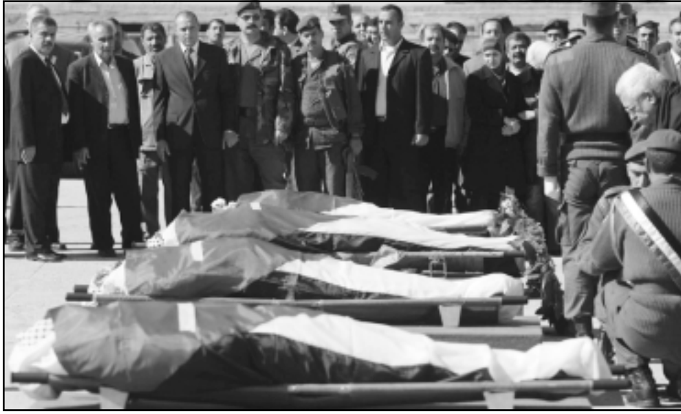
الغلمسيون يشيعون في جنازة رسمية أربعة مسؤولين فلسطينيين قضا في تفجيرات عمان في مقر الرئاسة الفلسطينية بمدينة رام الله بعد صلاة الجمعة. وشارك الرئيس الفلسطيني محمود عباس وأحمد فريخ رئيس الوزراء، وروحي فتوح، رئيس المجلس التشريعي، وعدد من الوزراء والمسؤولين وذوي الضحايا في مراسم التشييع. والمسؤولون الاربعة هم اللواء بشير نافع قائد الاستخبارات العسكرية الفلسطينية في الضفة الغربية ومجاهد فتوح الملحق التجاري في السفارة الفلسطينية في مصر وشفيق رئيس المجلس التشريعي الفلسطيني، وعبد الوان مدير عام في وزارة الداخلية وبشار القدومي مدير مكتب عضو اللجنة التنفيذية في منظمة التحرير الفلسطينية اميل جرجوعي في مدينة القدس.

اشركته لن توقف إستثماراتها في الأردن فقط بل ستعمل على زيادتها بعد الحادث الإجرامي. وتعهده ممثلون لشركة الكويت القابضة وعدة شركات في الإمارات وفسطين بالضفة قبلما في استثماراتهم في إطار التضامن مع الشعب الأردني كما تعهد صاحب سلسلة فنادق راديسون ساس في العالم كيت ريتز الذي وصل عمان بإقامة المزيد من الفنادق في الأردن وهو ماقله ممثل مجموعة الحريري الإستثمارية بهاء الدين الحريري عبر الإشارة لإن إستثمارات المجموعة ستواصل ولن تأثر بما حصل. وفي إطار مساندة وزير السياحة السياحي نجح سريعا في إمتصاص الآثار السلبية للتفجيرات مشيرة لإن نسبة الأشغال حاليا في فنادق مدينة العقبة جنوبي البلاد تبلغ 100% وإن ضربت بالتفجيرات عافيتها فوراً وتمت صيانتها بسرعة وبمعونة السلطات الرسمية فيما إستؤنفت نشاطاتها المتعددة إلا ان الحراسات الأمنية إنتشرت بكثافة في جميع المناطق في العاصمة تحسبا لحملات إعتقال إجترافية مشتبه بهم حيث أقيمت نقاط غلق أمنية وخضعت السيارات للتفتيش وحصل ذلك فيما برزت توجهات