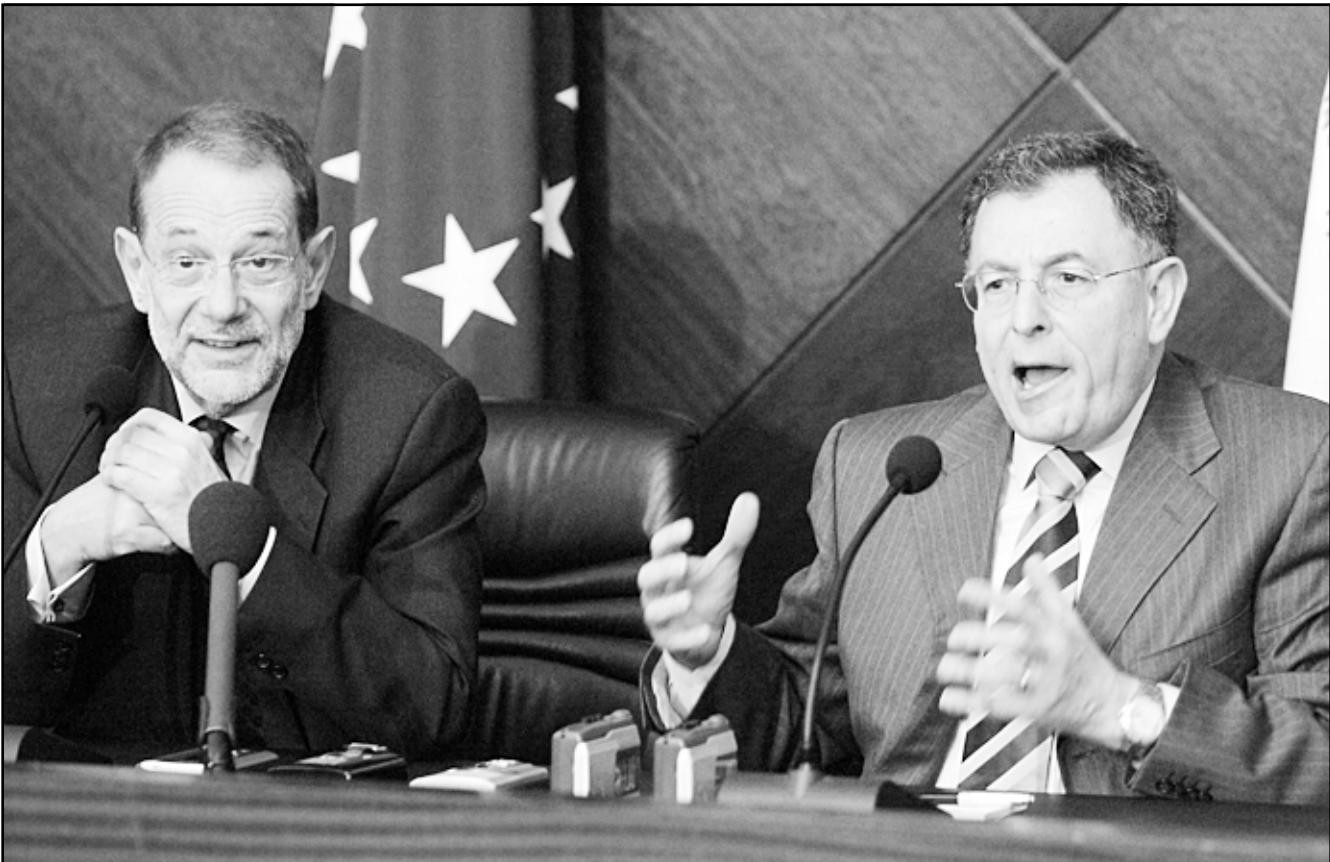
سولانا والسنيرة يتحدثان للمصافيين في بيروت الجمعة

الاسد على اللبنانيين، مواطنين وإسلاميين وسياسيين، امر مفوض ومستهجن، فالشعب اللبناني لم يكن يوماً قليل الاصل وناكراً للمعروف، وان تحمله وصبره طوال ثلاثين عاماً على الاستبداد المخابراتي الآمن السوري هو في حد ذاته اكبر من صبر ايوب..