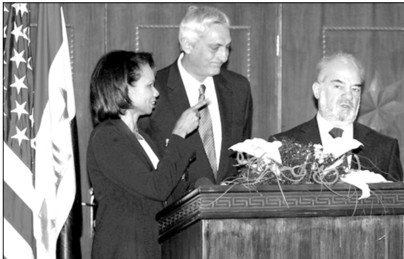
رئيس الوزراء العراقي المؤقت ابراهيم الجعفري ووزيرة الخارجية الامريكية كوندوليزا رايس اثناء مؤتمر صحفي في بغداد الجمعة (13 ف ب)