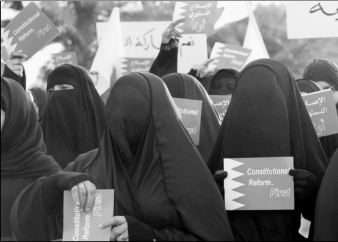
بحرينيات يتظاهرن للمطالبة باصلاحات دستورية في المنامة امس

عملية التنمية والوعي بالتغيرات التي حدثت، وشرك وزراء خارجية 13 دولة عربية الى جانب وزير خارجية بريطانيا جاك سترو والولايات المتحدة كوندوليزا رايس بالخصوص في المنتدى الجمعة في عشاء عمل للتباحث في هذه المشاريع والوضع في المنطقة، حسب ما ذكره أحد المنظمين.