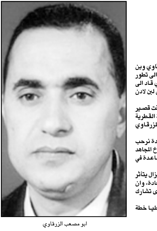
ابو مصعب الزرقاوي

معظم الهجمات الارهابية الكبيرة بعد 11 ايلول (سبتمبر) 2001. وصف (الزرقاوي) في خطاب باول بائه لاع اساسي في شبكة القاعدة. مع الاحتفاظ «باسطورة مروعة» للزرقاوي، قالت المؤلفة «ربحت كل من الولايات المتحدة والاكراد والاردنيين... لكن الجهاد حصل على زخم». بعد نزاعات داخل المجموعة وبعد ان تركت عمليات التحالف الامريكي نواة القاعدة عاجزة. كتبت نابليوني في مقالها «اخيرا نجح الزرقاوي في التقاط تعريف بن لادن للعهد البعيد، الولايات المتحدة». واضافت «وجودها في العراق كقوة احتلال اوضح له ان الولايات المتحدة كانت مهمة كهدف مثل بقية الانظمة العربية التي نشأ على كرها». وكتبت نابليوني «الاسطورة التي نسجت حوله كانت في اساس تحولها الى قائد سياسي. مع محاصرة بن لادن في مكان ما في افغانستان وباكستان. تحول الزرقاوي سريعا الى قائد رمز جديد في النضال ضد امريكا ومديرا لكل من كان يبحث عن ان يكون جزءا من النضال».