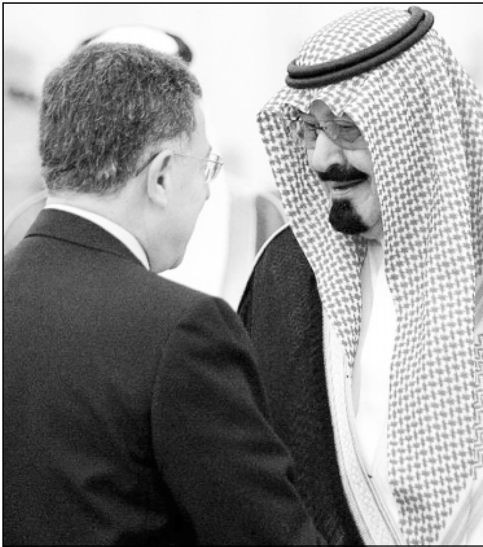
الملك عبد الله يرحب بالسنيورة اثناء المؤتمر الاسلامي في مكة امس