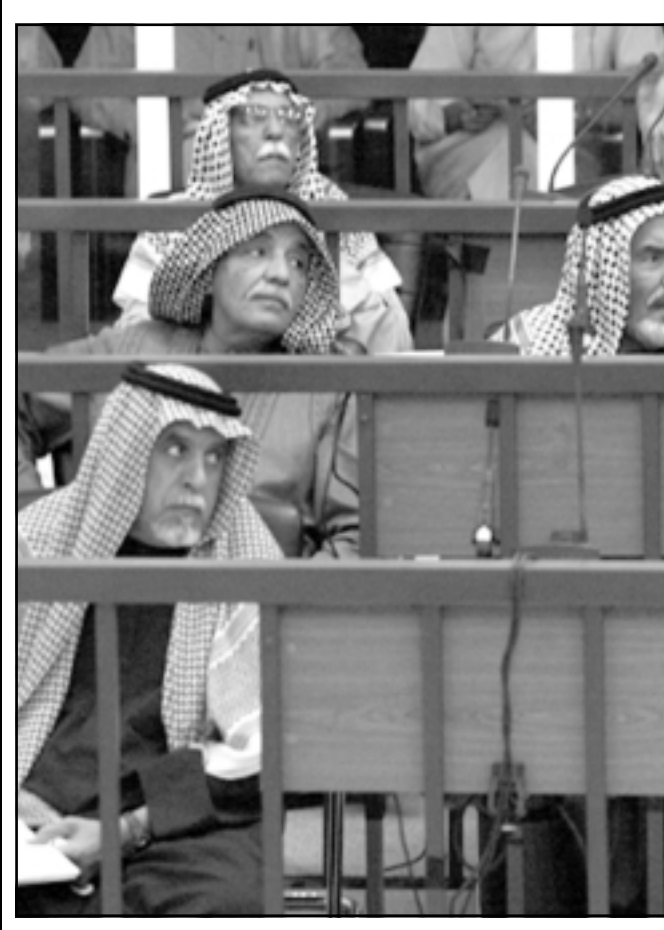
جانب من قاعة المحكمة وبدا كرسي الرئيس العراقي السابق خالبا (رويترز)

بغداد - رويترز: قالت الشرطة العراقية امس الاربعاء ان مسلحين خطفوا طفلا عمره ثمانية سنوات هو ابن أحد الحراس في المحكمة التي تنظر قضية الرئيس العراقي السابق صدام حسين. ولم يتضح على الفور ما اذا كان للمخطف الذي وقع امام منزل الحارس في بغداد صلة بالمحاكمة التي يقيم فيها صدام بارتكاب جرائم ضد الانسانية. ومنذ الاطاحة بصدام عام 2003 خطف رفض صدام التؤل امام المحكمة.