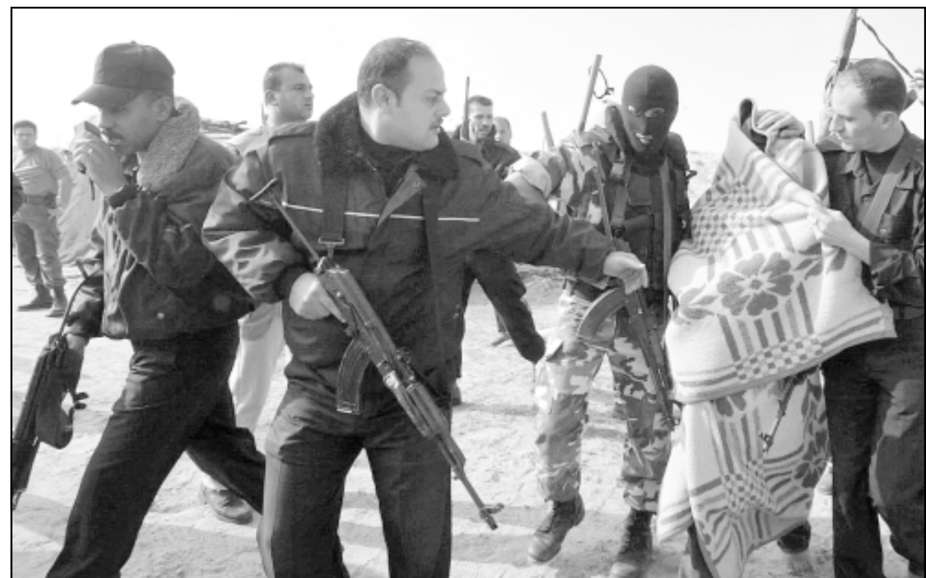
عناصر الشرطة الفلسطينية يعتقلون ناشطا في بيت لحم (أعلى).. وفي غزة (أسفل) يعتقلون مهرب اسلحة قرب الحدود مع مصر