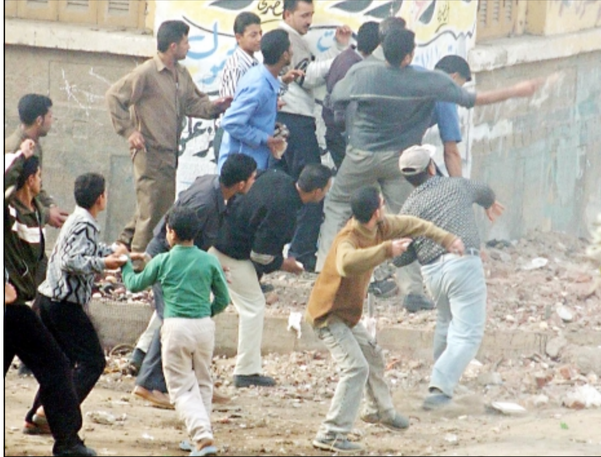
متظاهرون مصريون يرمون الحجارة على شرطة مكافحة الشغب في مدينة المنصورة امس

واثر انفلات الوضع الأمني تحولت مدن وقرى الدقهلية الى مناطق ملتهبة حيث اضرم اهالي عدد من القرى النار في اطارات السيارات لمنع زحف قوات الشرطة والبلطجية على منازلهم وليتمتعوا من الوصول للجان الانتخابية. وتعد المحافظة مقعلا لانصار جماعة الإخوان المسلمين وقد قام