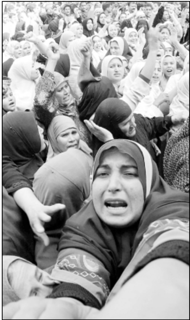
نساء مصريات امام احد لجان الانتخابات بعد منعهن من الدخول