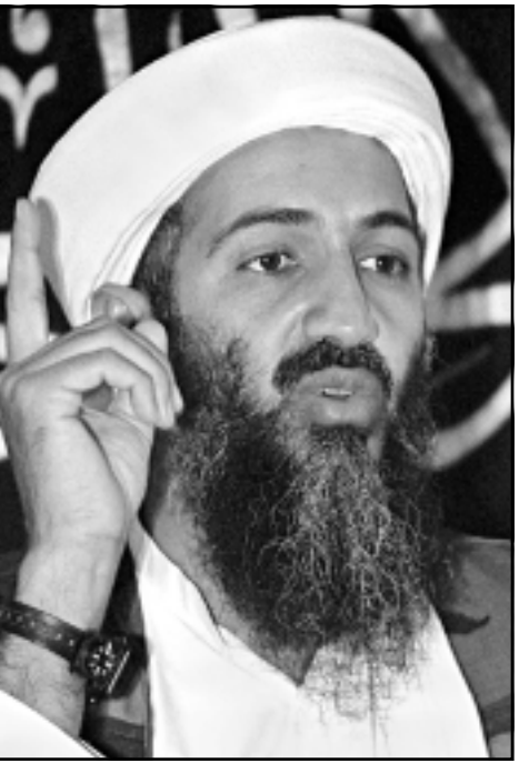
اسامة بن لادن

وعرض التلفزيون اليمني امس الاربعة وعرض قائمة الدمجة بشخصيات ومؤسسات متممة بتحويل الارباه في العالم، وهي قائمة صالح الى مطار جدة الدولي للمشاركة في بلاغ القمة الاسلامية وهو يصطب مع الشيخ عبد المجيد الزنداني احد اهم المطلوبين للإدارة الامريكية في قضايا تمويل الارهاب. والزنداني هو عضو مجلس الرئاسة السابق ورئيس جامعة الإيمان الاسلامية حاليا والذي تنهه امريكا بتمويل الارهاب، وهو الخروج الاول منذ اندراجه في قائمة ممولى الارهاب في العالم من قبل مجلس الامن الدولي في ارباهية.