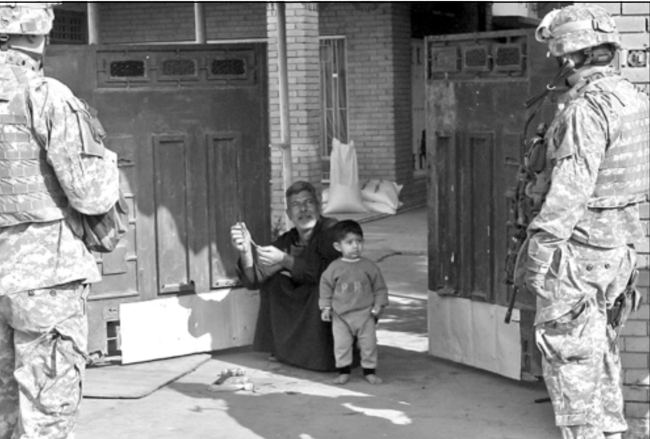
قوات امريكية تستجوب عراقيا امام منزله في بغداد امس (ا ف ب)

وفي بغداد اعلن مصدر في وزارة الداخلية العراقية امس مقتل عراقي واصابة ثلاثة آخرين من عمال شركة اعلانات دعائية ضوئية كانوا يقومون بنصب اعلان دعائي لقائمة الائتلاف العراقي الموحد (الشيعية) جنوب بغداد. وقال المصدر الذي رفض الكشف عن هويته ان «مسلمين يستقلون سيارة من طراز (بي ام دبليو) المانية الصنع اطلقوا النار على عمال شركة اعلانات ضوئية كانوا يقومون بنصب اعلان دعائي لقائمة الائتلاف العراقي الموحد ما ادى الى مقتل عامل واصابة ثلاثة آخرين». واوضح ان «الحادث وقع عند الساعة 10:00 بالتوقيت المحلي (07:00 ت غ) في منطقة حي العمال جنوب غرب بغداد». ويشار الى ان حمى الانتخابات وصلت الى اوجها خصوصا في العاصمة العراقية بغداد حيث تنتشر ملايين الاعلانات الدعائية ل مختلف القوائم العراقية المشاركة في الانتخابات. وتتعرض الشرطة للعديد من هذه الاعلانات لهجمات خصوصا تلك المتعلقة بالقائمة العراقية الوطنية التي يتزعمها رئيس الوزراء السابق ابادي علاوي. وفي اربيل اعلن الاتحاد الاسلامي الكردستاني بزعامه صلاح الدين محمد بهاء الدين امس مقتل ثلاثة من عناصره بينهم قيادي ومرشح الحزب للانتخابات التشريعية المقبلة في هجمات تعرضت لها مقرات الحزب في محافظة دهوك (450 كلم شمال بغداد) الثلاثاء. وقال الحزب في بيانه ان «مشير احمد القيادي في الاتحاد الاسلامي ومرشحا للانتخابات العراقية القادمة قتل مع اثنين آخرين من مركز زاخو للحزب واصيب عدد آخر بجروح». واوضح البيان ان «مقرات الاتحاد الاسلامي الكردستاني في كل من دهوك وزاخو وعفره وعمادية