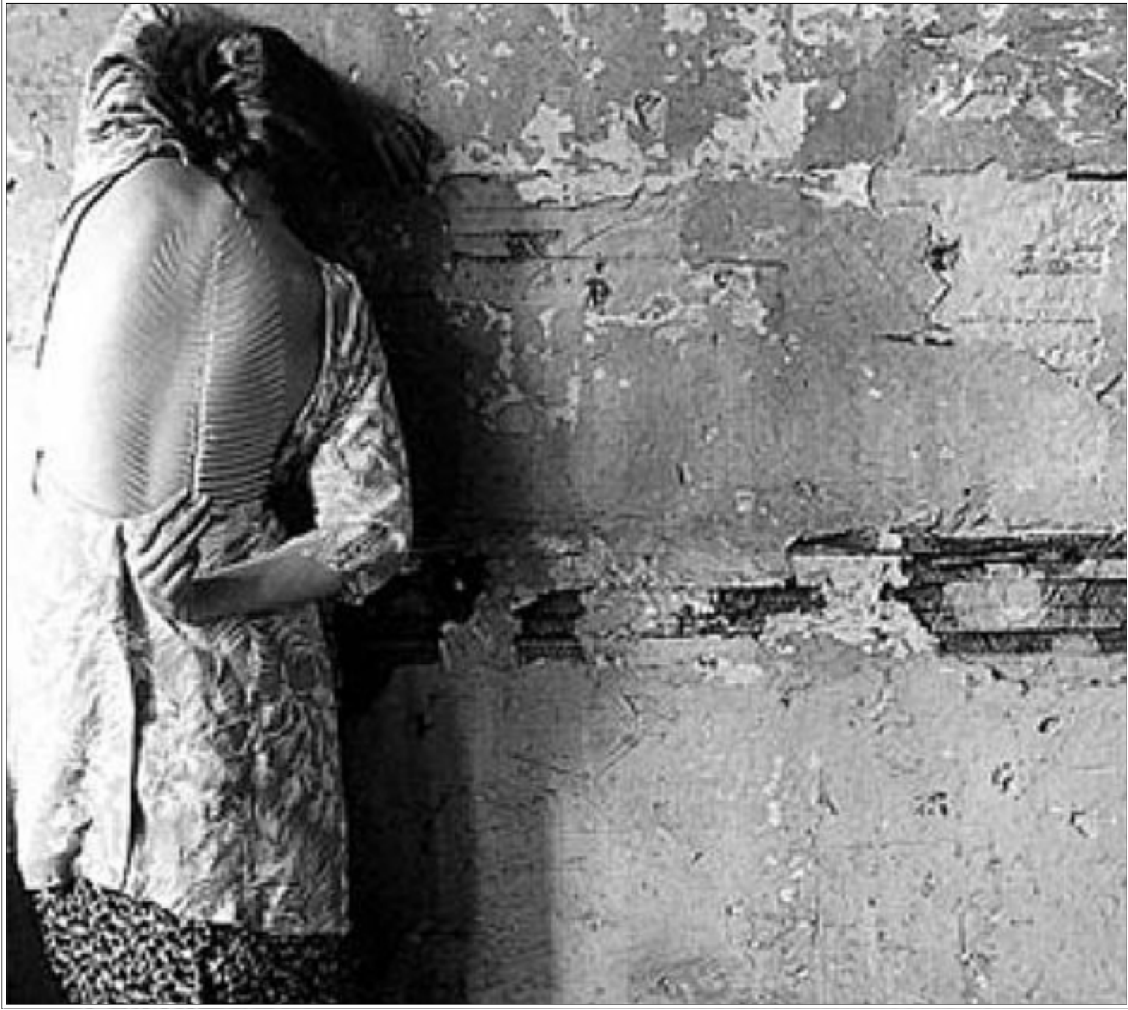
عملان لفرانثيسكا وودمان

القت بنفسها من النافذة في منهاتن، لتصبح نموذجا للحقيقة التي طالما صنعها خيالها: المرأة الوحيدة الملقاة ميتة على اسفلت الشارع. بل صنعت فرانثيسكا صورها من أجل التمهيد لنهايتها النسائية؛ هناك صورة واحدة فقط من بين العشرات من صورها، هي الصورة الوحيدة التي رايت فيها ابتهاسا، ويا لبرقة تلك الابتهاسا، يا لنضارتها وسط بياس الفكر وخشونته، لم تكن فرانثيسكا تصور نساءها إلا وهن في حالة غياب كامل عن أجسادهن. عري تلك الأجساد لم يكن عريا معدا لنزعة الإبصار. عن طريق ذلك التغميب كانت تقطع الطريق أمام أي سوء فهم محتمل. في منزل يحترق لا يفكر المرء حين ينفذ امرأة عارية بعريها، هناك معنى مختلف للانتصار تتجزئه بدهاء اللحظة المتسففة والزهوة ببطولتها. غالبا ما تصور فرانثيسكا نساءها وهن مقلقات أو متزججات بالطبيعة أو راقدات بطريقة غامضة لا تنبئ بحياة من نوع ما. لديها امرأة تغطي أجزاء من جسدها بورق الجدران، فيما الجدران من خلفها تحتاج إلى الترميم أكثر