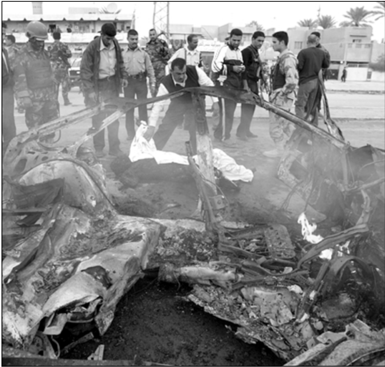
شرطي عراقي يغلي جثة انتحاري فجر نفسه في بغداد الجمعة

واضاف «اجتمعنا بالسيناتورين الامريكي والبريطاني في بغداد وبلغناها اننا مع التهديد ومشاركة كل الاطراف في العملية السياسية انما نرفض ان تكون المشاركة في العملية السياسية غطاء للارهاب والعراق».