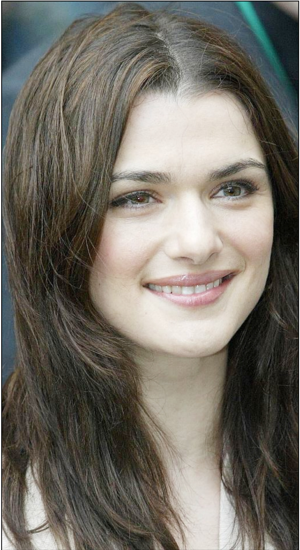
النجمة راشيل ويلتز التي تشارك في بطولة فيلم «البستاني» رشحت للوزع بجائزة أفضل ممثلة مساعدة عن دورها في الفيلم، وستوزع الجوائز يوم 2٨ من الشهر الحالي في لوس انجليس

وقالت نانسي هيمنواي المديرة التنفيذية للمجلس العالمي حول المعلومات الشخصية الذي يتخذ من واشنطن مركزا له لنيوتانيد برس انترنتناشونال» قد تكمن دوافع مختلفة لدى مستخدمي الإنترنت، ويقول الباحثون التجارون مثل جيمس شانغ رئيس شركة «ريتش أندآرترز» في شيكاغو أن الشركات تدرس الخلافات بين الجنسين من أجل تطوير برامج تسويقية على الإنترنت.