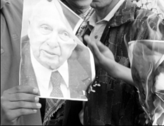
فلسطينيون يحرقون صوراً لشارون خلال مظاهرة ضد الجدار الفاصل في قرية بيلين بالضفة الغربية المحتلة

وكان من المقرر ان تجري جراحة لشارون الخميس في مستشفى هداسا لعلاج ثقب صغير في القلب يعتقد انه تسبب في الجلطة الخفيفة التي نقل على انحاءا لتأجيل الانتخابات الفلسطينية المقررة في 25 من كانون الثاني (يناير) الجاري وتساعد الاضطرابات الداخلية في قطاع غزة والضفة الغربية فضلاً عن