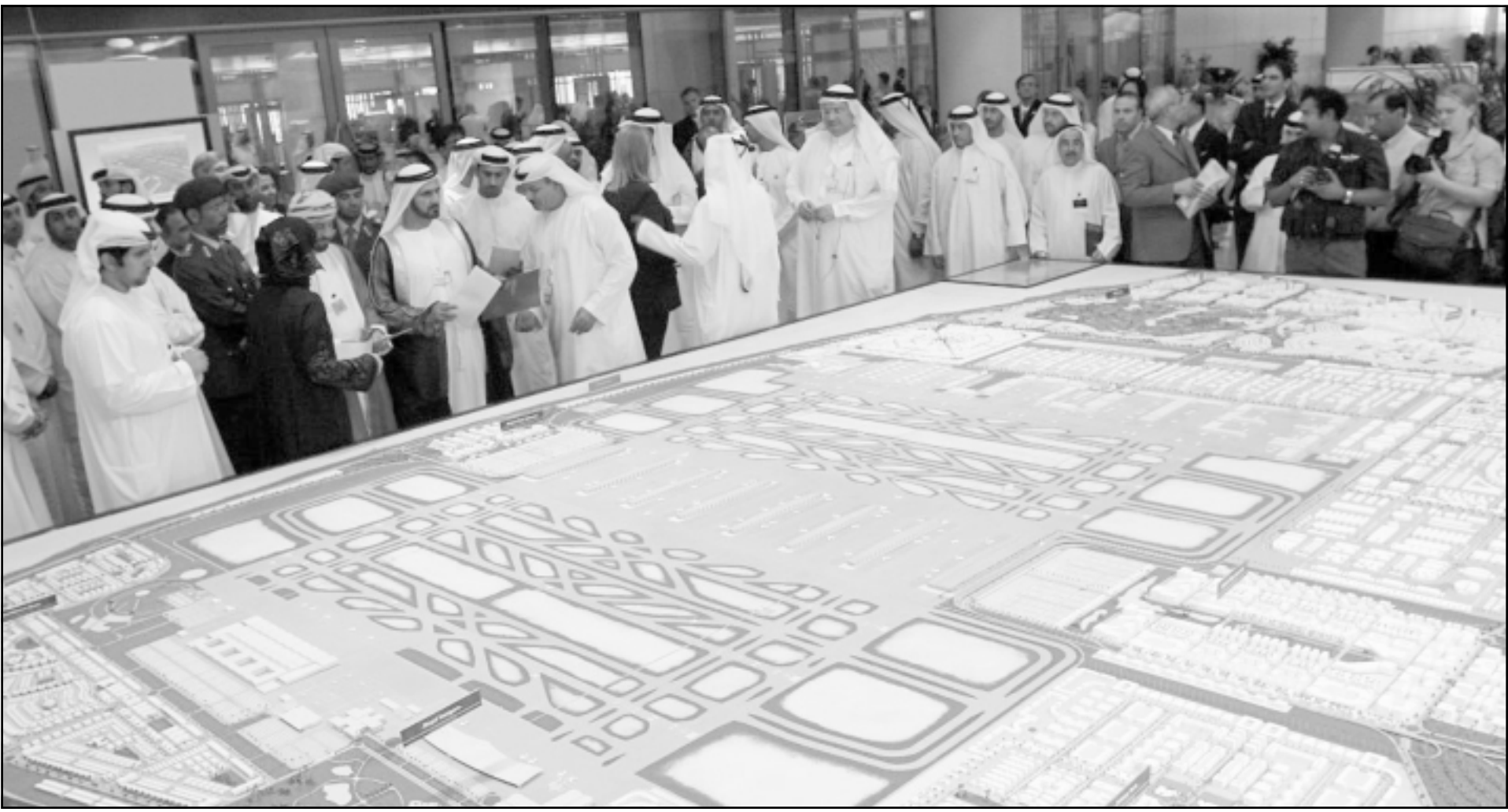
حاكم دبي الجديد الشيخ محمد بن راشد آل مكتوم (الرايع من اليسار) ينظر الى مخطط مجسم مطار مدينة جبل علي

تجارية واجتماعية متكاملة لخدمة قطاع كبير من المقيمين والعاملين في المشروع، والمتوقع أن يبلغ عددهم 750 ألف نسمة. وسيشتمل منتجج الغولف الجوار أكبر ملعب غولف في العالم إلى جانب أبراج سكنية وفلل تتميز بإطلالة فريدة على مناظر طبيعية رائعة. وسيتمتع مجمع العلوم والتكنولوجيا وسيتولى مجمع المعارض من المعرض فريدة على خدمة قطاع التقنيات المتقدمة والصناعة. وسيتمتع معرض دبي للطيران إلى مدينة المعارض في مدينة مطار جبل علي والتي ستكون جاهزة لاستضافة الدورة الحادية عشرة من المعرض خلال العام 2009.