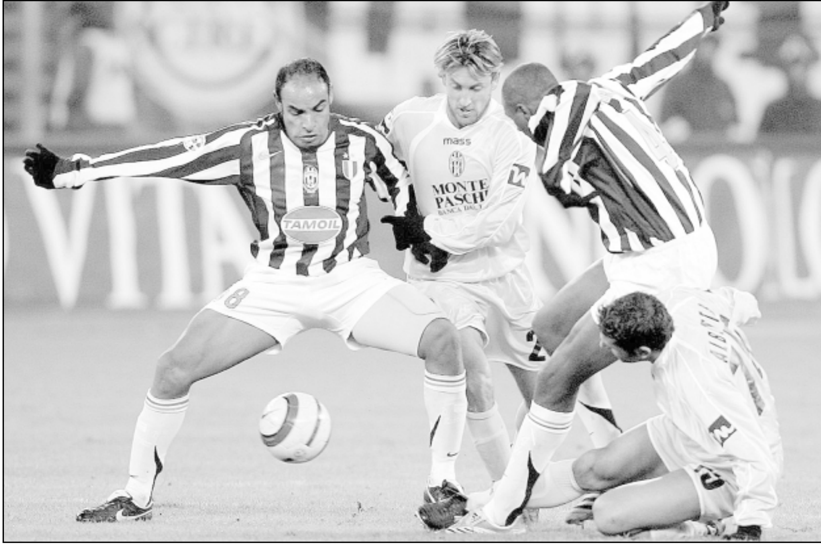
لقطة من إحدى مباريات يوفنتوس الايطالي

■ نيقوسيا - أ ف ب: تعود العجلة الى الدوران في بطولتي ايطاليا واسبانيا لكرة القدم بأقامة المرحلة الثامنة عشرة بعد توقف لمدة اسبوعين بسبب اعياد الميلاد وراس السنة الجديدة.