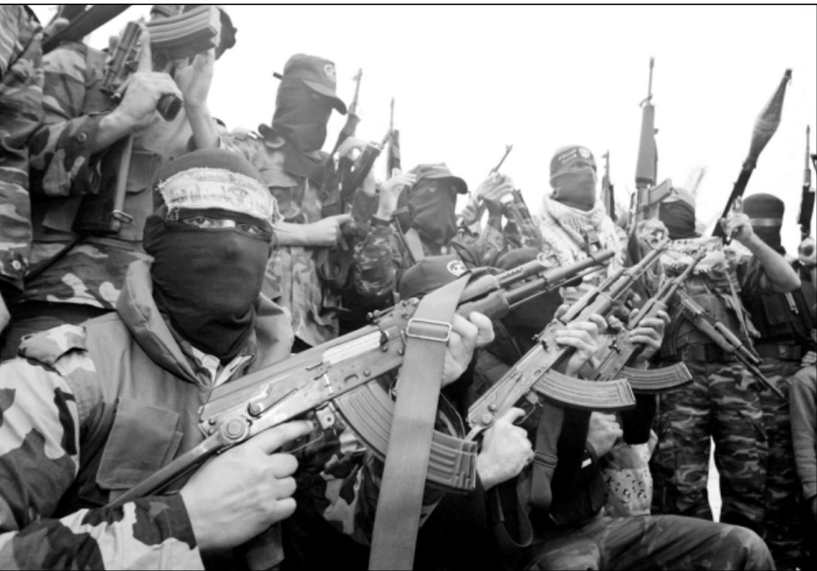
عناصر تابعة لـ 6 فصائل فلسطينية تشكلت اسس لوضع حد للفلتان الأمني في غزة

وقالت الحركة: إننا بادرت في «فتح» بالاتصال مع قيادة حركة «حماس» ليلية أسس الأول بهدف توقيع الحدت ومع تفاسقه، واقرحنا تشكيل لجنة التحقيق المشار إليها.