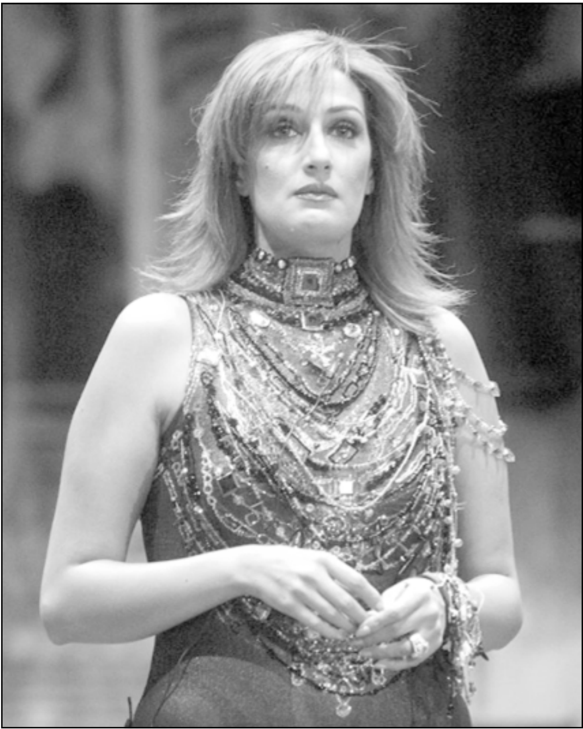
غادة عبد الرزاق

نفسها ولكن من دخولي هذه التجارب المختلفة في حياتها الفنية أو الشخصية، وتحاول هذه الأيام أن تركز على السينما بشكل كبير حتى تحقق فيها النجاح المطلوبة، لكنها تواجهها بعض المشاكل مثل محاضرتها بالدر الرومانسية ودخولها في ثلاثة أفلام مرة واحدة أدى إلى شائعات تقول بانها أفلام متشابهة لأنها تعمل بأموال زوجها المنتج الذي تردد أنه طلقها وانصل عنها للمرة الثالثة.