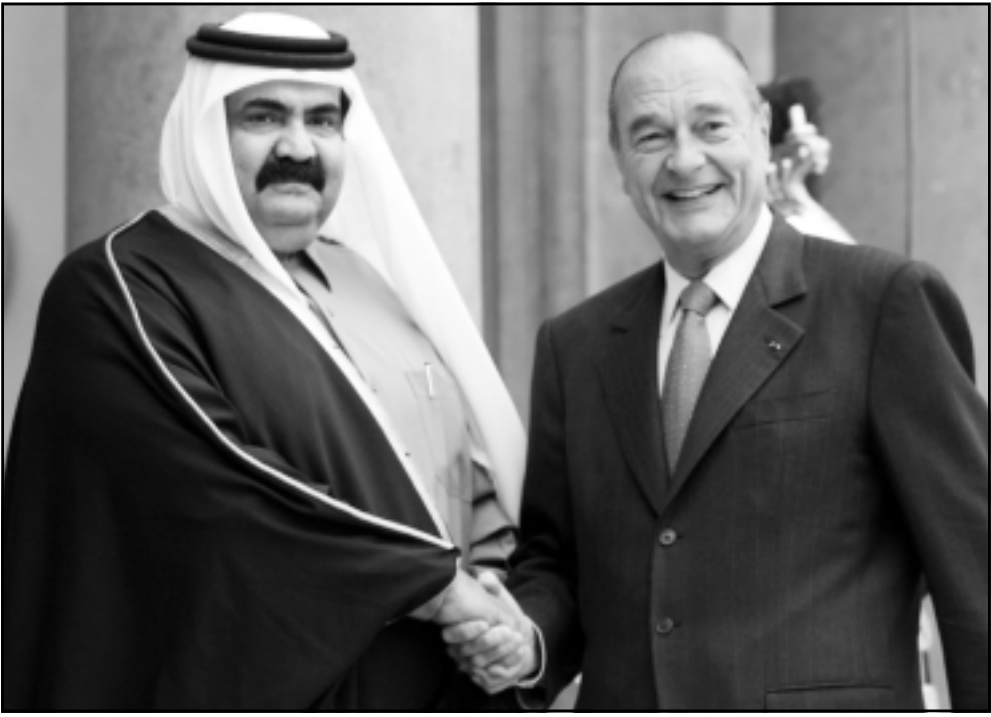
الرئيس الفرنسي لدى استقباله امير قطر

باريس - يو بي آي: بحث الرئيس الفرنسي جاك شيراك الجمعة مع امير دولة قطر الشيخ حمد بن خليفة آل ثاني عددا من الملفات الثنائية والاقليمية والدولية.