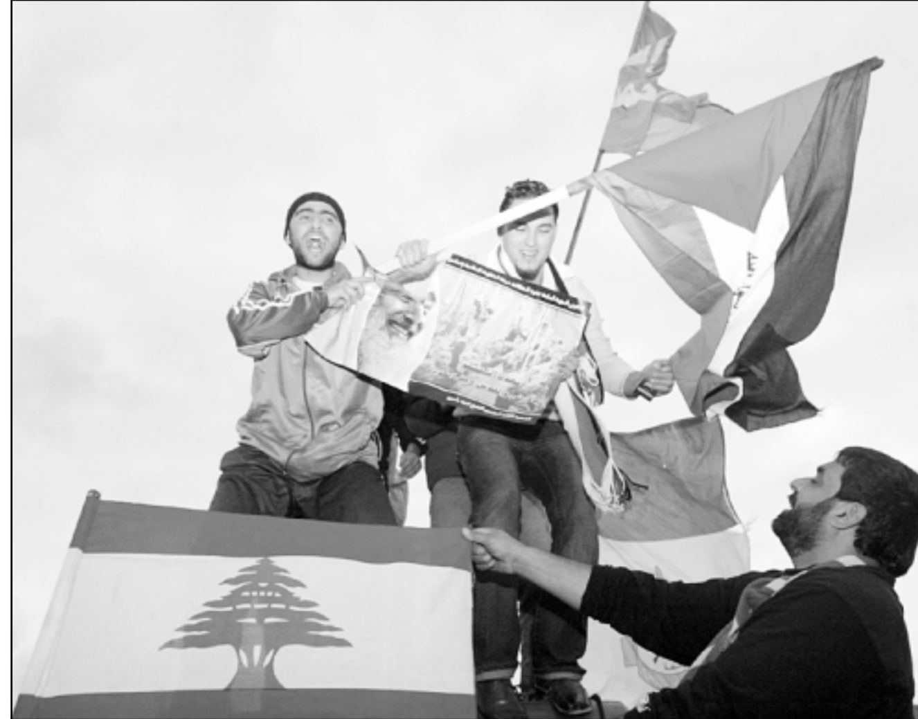
فلسطينيون من مخيم عين الحلوة بجنوب لبنان يتأملون الجمعة بفوز حركة حماس، ويلوحون بعلمي لبنان وفلسطين مع علم الحركة (1 أ ب)

والمستقلة وعاصمتها القدس ودعوة السوريين القومي الاجتماعي النائب مروان فارس إلى مسؤول لبنان في حركة حماس اسامة حمدان مهنتاً بنجاح الحركة في الانتخابات الاخيرة في فلسطين المحتلة، وقال: «ان انتقال حركة حماس من المعارضة إلى السلطة، ليس انتقالاً عادياً وتقليدياً، فعند الشعب الفلسطيني لا معارضة ولا سلطة بل حركة ثورية واحدة مختلف