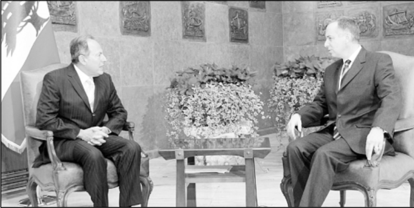
الرئيس اللبناني اميل لحود يستقبل مساعد الامين العام للامم المتحدة للشؤون القانونية نيكولاس ميشال في قصر بعبدا يوم الجمعة

جهته أنه سيؤدي دور الرئيس بري نماذج عن محاكم وخصوصاً تفاصيل نصوص المحكمة السورية، واتفق على أن يبقى التواصل قائماً ولا سيما أن هناك أرواحاً تعرضت لاعتقال على المجلس اللبناني. وشملت محادثات المسؤول الدولي وزير الخارجية والمغتربين فوزي صلوخ ووزير العدل شارل رزق.