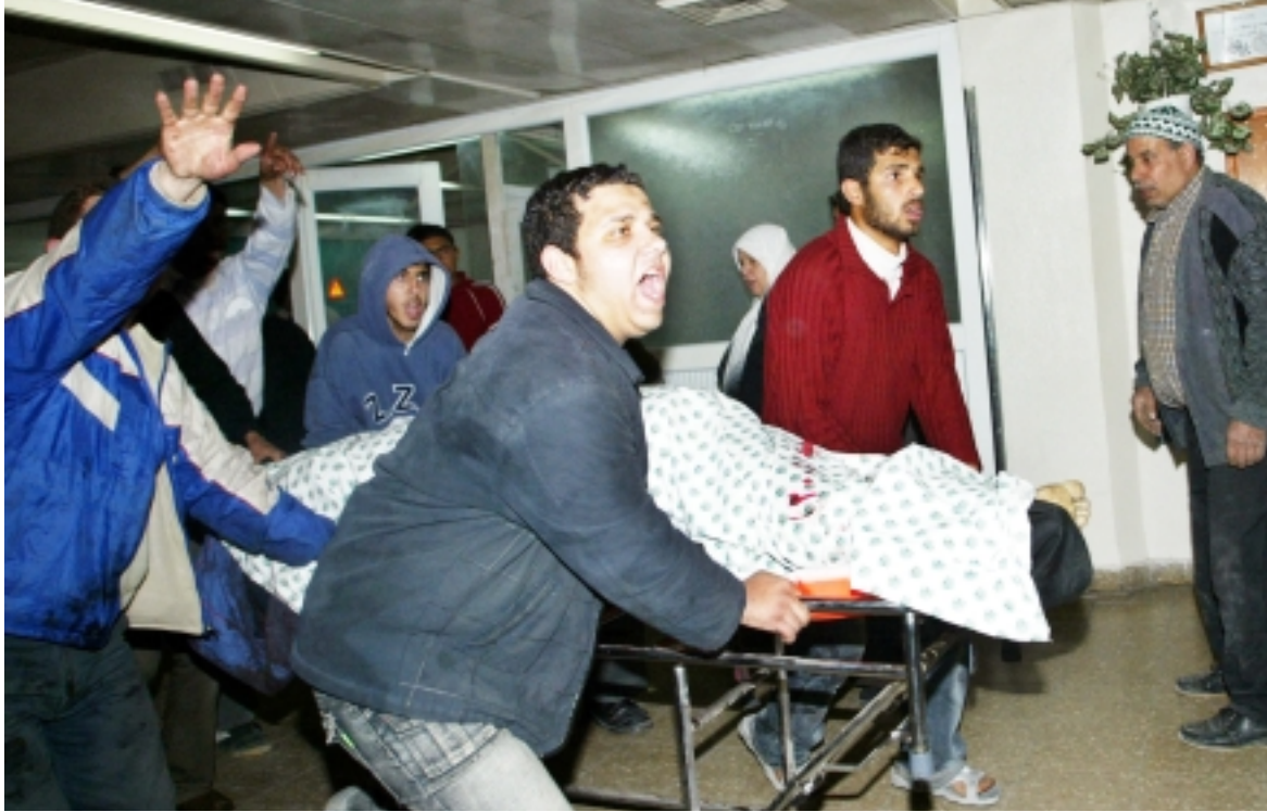
فلسطينيون يهرعون باحد ضحايا القصف الاسرائيلي الى المستشفى في غزة أمس