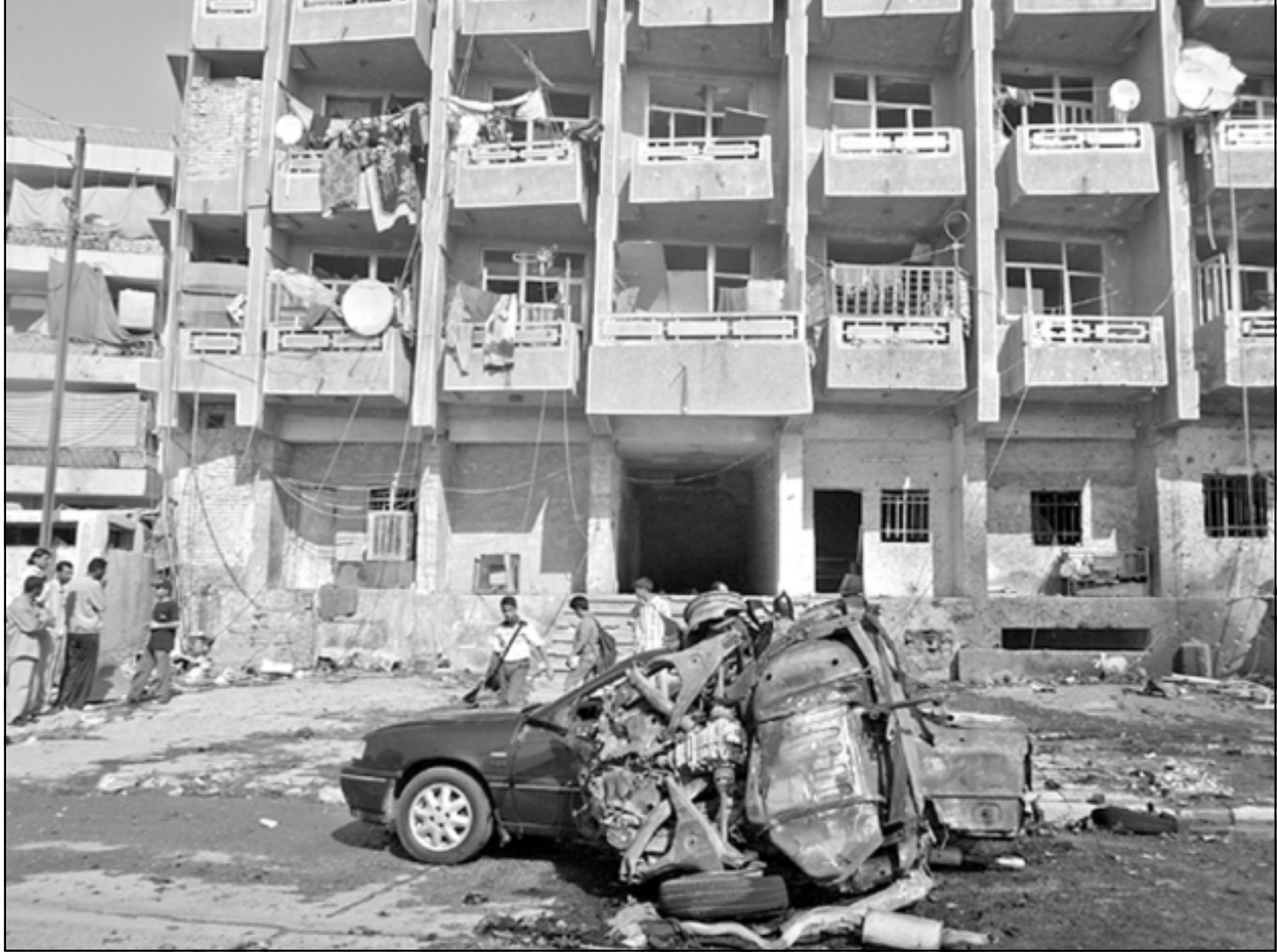
حطام سيارة فجرت امام مساكن في وسط بغداد امس