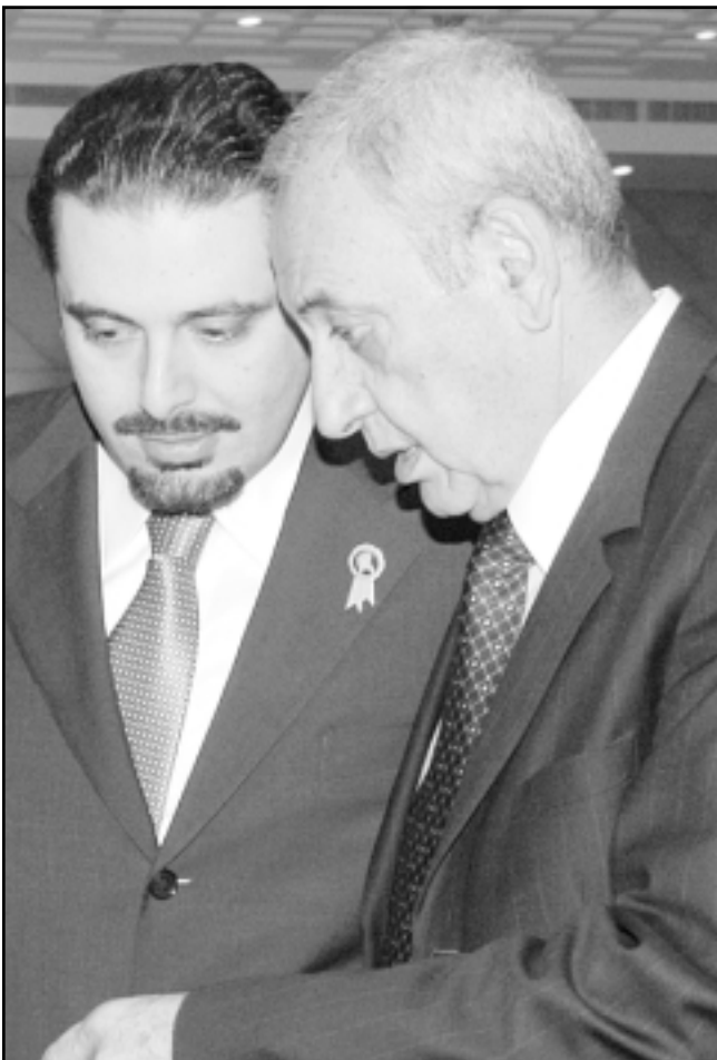
نبيه بري يتحدث لسعد الحريزي بعد الجلسة الحوارية بين القادة اللبنانيين

بالتزامن مع مناقشة مسألة نزع السلاح الفلسطيني خارج المخيمات وضبطه داخلها، عقد أمين سر «الجبهة الشعبية لتحرير فلسطين» القيادة العامة، نور جراح، مؤتمراً صحفياً في مقر القيادة في مخيم برج البراجنة امس، استهله بالقول «ان الفلسطيني في لبنان ليس جسماً غريباً او حالة مرضية يجب ان يحجر عليها، فالسبني في لبنان يفرح قلبه عندما يشعر بقوة لبنان، وعندما يشعر انه يتم التعاطي معه على المستوى الرسمي والسياسي بوصفه انساناً وصاحب قضية، فماذا ان كان هناك غياب مطلق وكبير وخطير لمقومه الانسانية بالتعاطي مع الفلسطيني؟ نحن لا نبالغ ان قلنا ان هذه المخيمات قد تحولت وبفضل السياسات، وللافسد الخاطئة على الصعيد الرسمي والحكومي، وعلى مستوى بعض القوى والاحزاب اللبنانية التي معسرت اعتقال، نحن هنا معكمومين وسياسة وثقافة عنصرية حولت هذه المخيمات الى جزأ منية، اننا نتعرض عملياً على عملية اعادة في المعنى الوطني والقومي، هذه الابداء اتت الى تهجير الفلسطيني، حتى الآن هناك أكثر من مئة الف فلسطيني اصبحوا خارج لبنان ونعموا من العودة رغم انهم يحملون الوثائق الفلسطينية اللبنانية بقرار رسمي يمنع الفلسطيني الذي يخرج من لبنان بالعودة الى أهله»، وسأل رجا «الآن وقد بدأت طاوله الحوار المستديرة، فماذا يريد الفلسطيني من هذا المؤتمر؟»، استطرد بالقول «الفلسطيني يريد ان يعامل كصاحب قضية، نحن فرحنا كثيراً في المؤتمر، وشعبنا يتابع بفرح هذا المؤتمر مثل أي مواطن، ولكن مع التسريبات التي وصلت ومع العناوين الرئيسية التي بدأت تتناول الموضوع الفلسطيني، لقد اصابت بخيبة أمل ونحن في حالة حزن وقلق على ان يقارب البعض الموضوع الفلسطيني، الملف من زاوية امنية ومن زاوية ملف السلاح الفلسطيني».