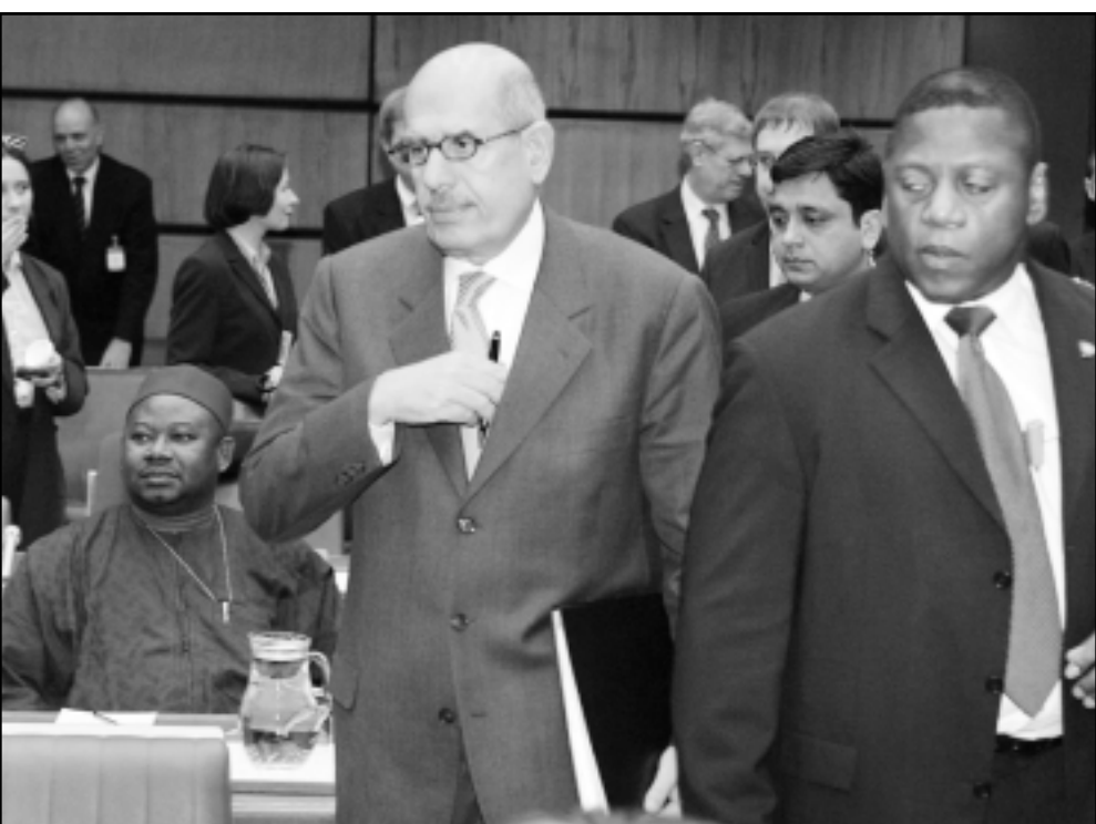
مدير الوكالة الدولية للطاقة الذرية محمد البرادعي قبيل بدء جلسة المفاوضات بين الأوروبيين وايران

وصرح رئيس الوفد الإيراني الى وكالة الطاقة الذرية ان ايران تقترح تسوية على الاوروبيين تنص على احترام برنامجها للابحاث في مجال تخصيب اليورانيوم لكنها مستعدة للتخصيب في حال نقل الملف الى المجلس الامن الدولي. وقال فطحي وعبيدي في حديث لوكالة فرانس برس «نحن هنا للتوصل الى تسوية (...) وهذا يتطلب تهدئة الامور...» وأضاف «في منطقتنا الذين يعرفون كيف يقاوتون هم الذين يعرفون كيف يصنعون السلام ايضا».