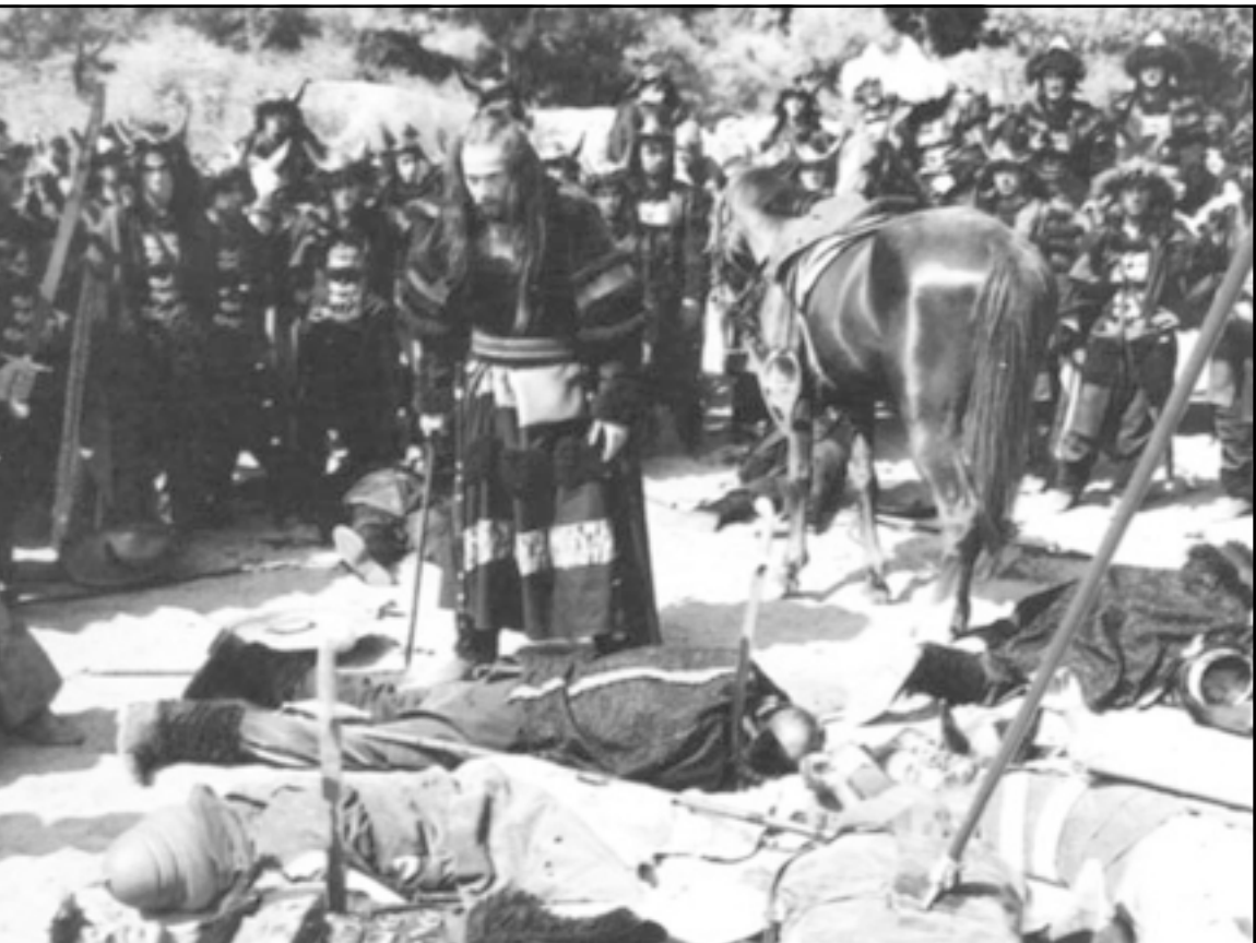
لقطة من «الظاهر بيبرس» يصرّ معركة عين جالوت