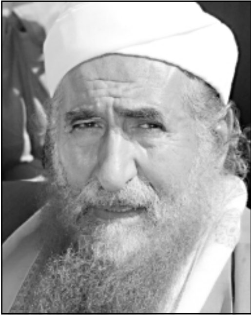
الشيخ عبد المجيد الزنداني

مساعدا الفئات الرسمي باسم الخارجية الأمريكية آدم إبرلي».