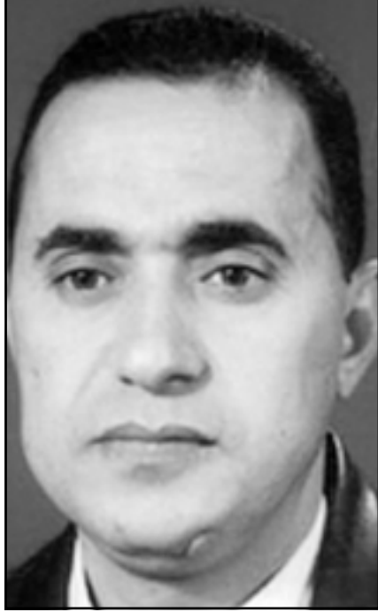
ابو مصعب الزرقاوي

ودعا تحالف أوقفوا الحرب ناشطيه ومؤيديه الى التجمع أمام أبنية «بي بي سي» في الرابع من نيسان (ابريل) المقبل في لندن ومانشستر وليدز وبريستول وكامبريدج وغلاسكو.