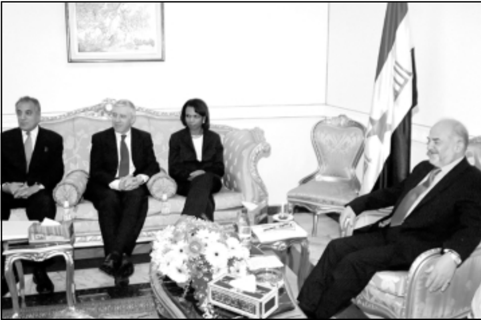
رئيس الوزراء العراقي ابراهيم الجعفري لدى استقباله ووزي خارجية امريكا وبريطانيا بحضور السفير الامريكي في بغداد

واضاف البيان ان الطالباني اطع الوزيرين على «تفاصيل المفاوضات والتشاورات الجارية بين رؤساء ومثمتي الكتل البرلمانية وما تمخض عنها من نتائج لا سيما تلك المتعلقة بالاتفاق على تشكيل المجلس السياسي لامن الوطني واللجنة الوزارية لامن الوطني بالإضافة الى البرامج السياسي للكتل المؤلفة لتشكيل الحكومة المقبلة». وتفجرت أعمال العنف الطائفية منذ تجعير مرقد الاماميين على الهادي والحسن العسكري في الشهر الماضي مما أشعلت أعمالا انتقامية ووقع بالعراق الى الحرب الأهلية. وظهرت المئات من الجثث للعراقيين في الشوارع وحمل الكثير منها آثار التعذيب.