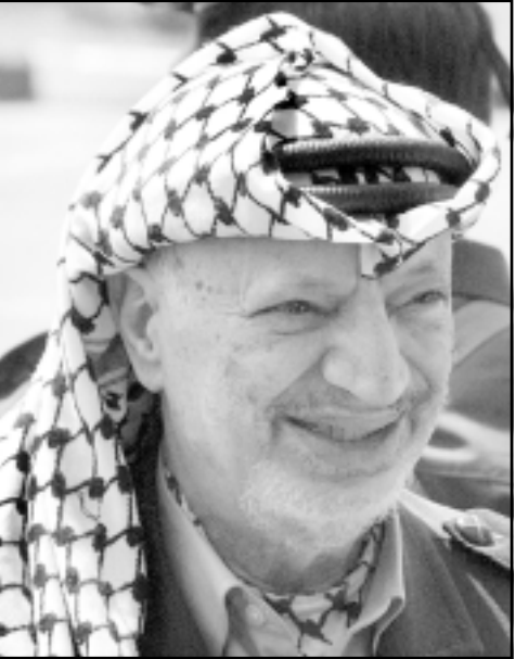
يطلبوا أكثر. وسيعملون دائما كمقدمي تسويات لكل رفض فلسطيني.

وثيقة تأسيسية لليسار الراديكالي - تأخذ في الأساس بزعامة الجانب الفلسطيني، وتفتح الباب لحل «دولة واحدة كبيرة»، وتؤيد في الأساس حق العودة. في الواقع تلك الوثيقة تشجع الرض الفلسطيني. بسبب جبهة رفض أية تسوية، والتي تشمل على انصار عرفات، وعلى حماس، وعلى اليمين الايديولوجي واليسار الراديكالي - ما يزال الاسرائيليون والفلسطينيون معا يعانون. الانطواء المقترح للخروج من الوحل. في الواقع السياسي الذي نشأ، لا استبعاد انها ستتحقق في الواقع، لكن لا يجوز بالتأكيد التنازل عنها. فقط لأن لجبهة الرض الفلسطينية - الاسرائيلية، اليسارية - اليمينية، حولا من قسم الهذيان.