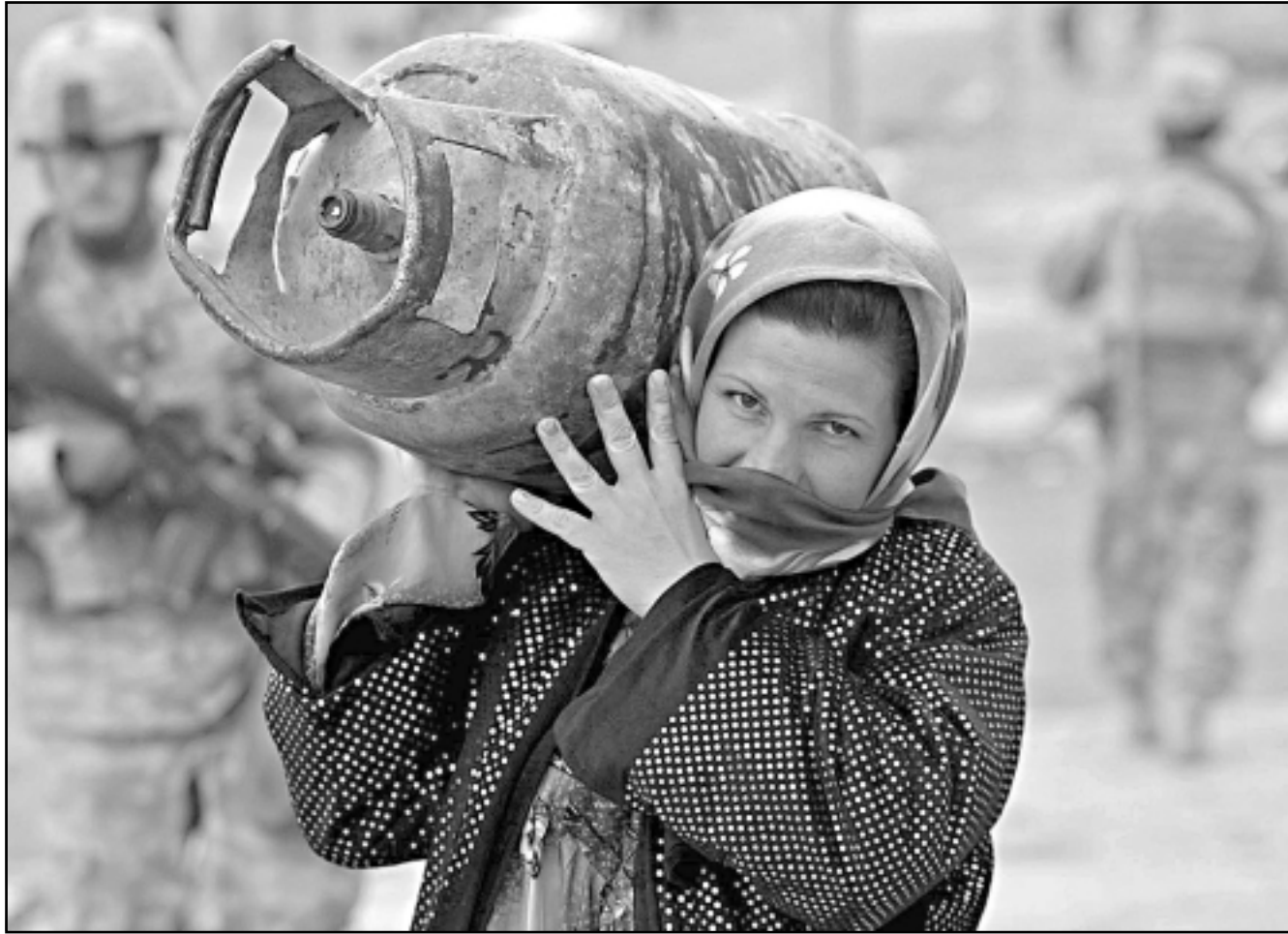
سيدة عراقية تسير امام جنود امريكيين حاملة عبوة غاز فارغة في تلغراف