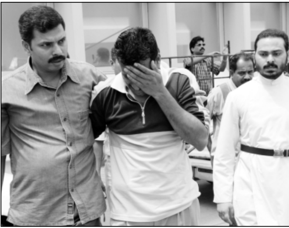
اقارب احد ضحايا العبارة يبكي قبل استلام الجثة من الشرطة في المنامة

ووقف عشرات الأشخاص اعليهم من الاسويين بين ام مستشفى السامية اليوم وقد بدأ الحادث الشديد على بعضهم في انتظار تسلم جثث اقاربهم.