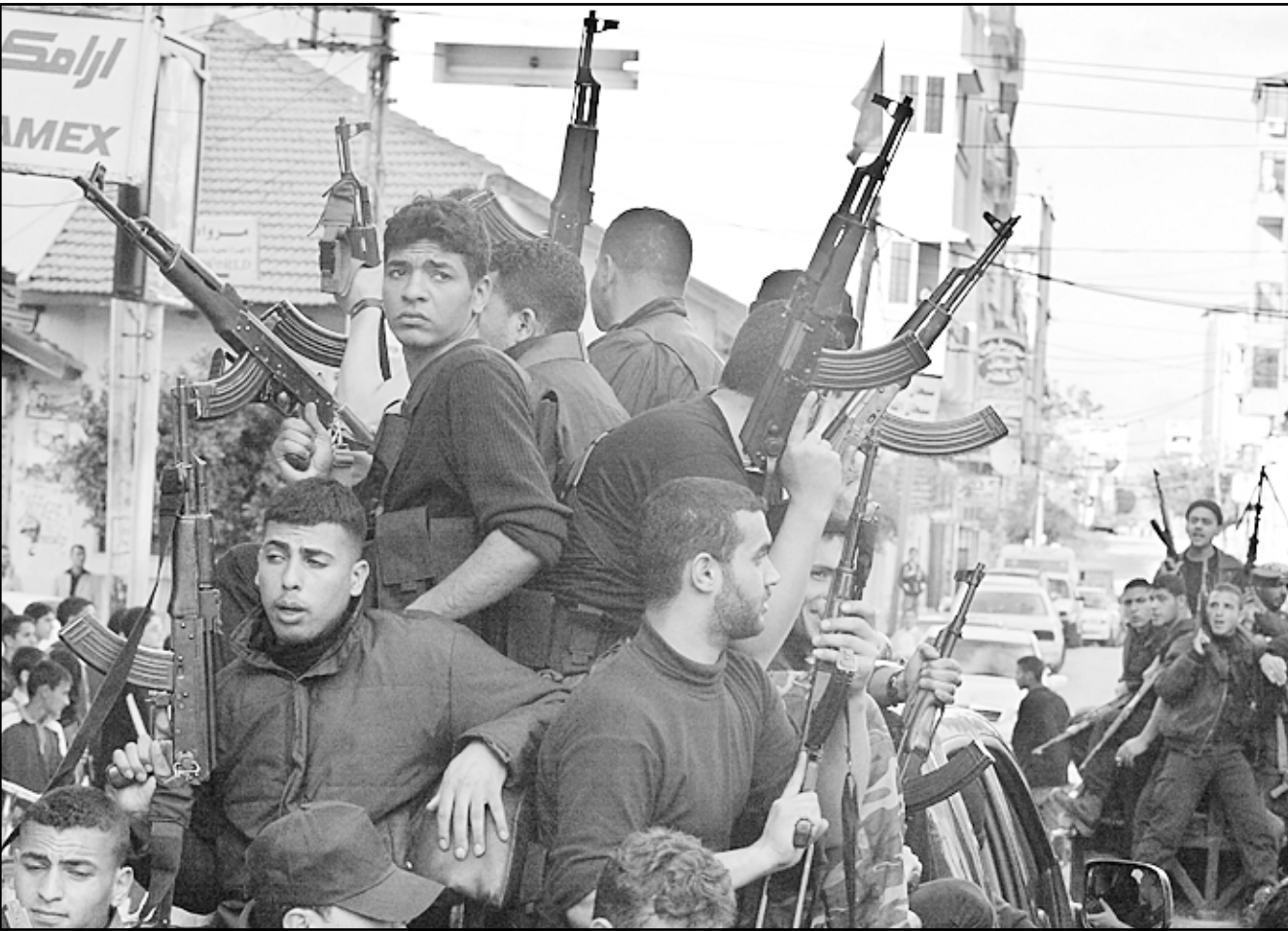
مؤيدون لحركة فتح يتظاهرون في غزة

المطلوب للقضاء على سلطة حماس قبل أن ترسخ في مناطق السلطة. ستقدم مسودة الاتفاق بالطبع الى البرلمان - وفيه لحماس أكثرية الآن - وسيرفضه ممثلوها. وهي خطوة ستتمحور أيا مازن فورا الشرعية المطلقة لاقامة انتخابات جديدة، في حين يكون