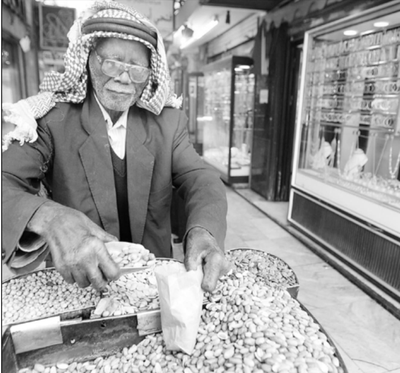
باتع مكسرات في سوق الصاغة في العاصمة الاردنية عمان حيث يتزايد اقبال على شراء الذهب كتحوط لهبوط اسعار الاسهم

وقال غريغ ايب مراسل (وول ستريت جورنال) في مجلس الاحتياطي الاتحادي والذي ينظر اليه احبانا على انه يعكس تفكير البنك انه رغم ان الاسواق تتوقع ان يرفع المجلس مسؤولي المجلس «غير مقتنعين بانهم بحاجة الى مواصلة رفع اسعار الفائدة بعد خطوة متوقعة في ايار (مايو).