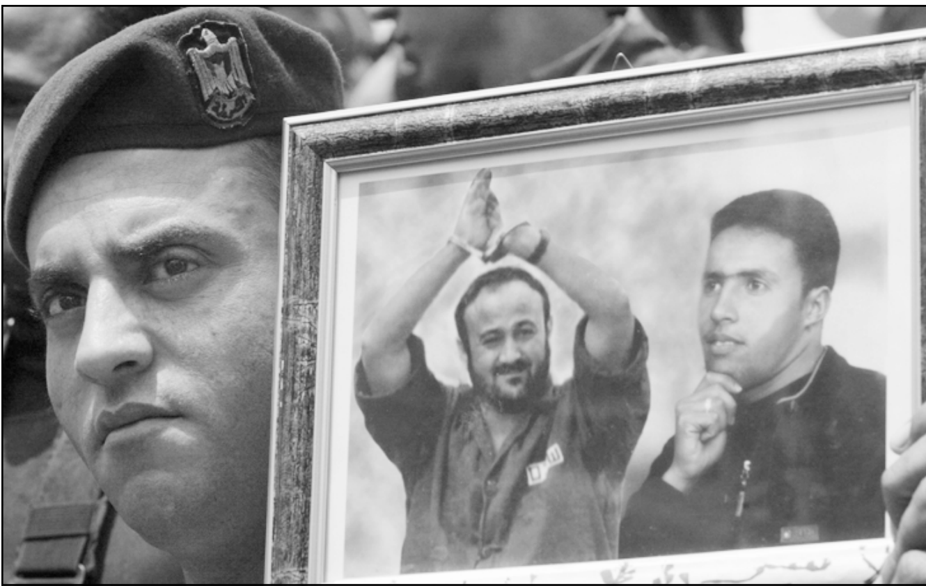
فلسطيني يرفع صورة شقيقه (يمين) والى جانبه مروان البرغوثي خلال مسيرة لاهياء يوم الاسير

مع الحركة سيزداد في هذه الحالة. وزير الخارجية، محمود الزهار، قال في نهاية الاسبوع الماضي بأن الحصار المتعدد الجبهات الذي ضرب حول هذه الحالة جماهير كثيرة نائمة على حولها، ويبدو أنه كان مقلقا في قوله هذا، كلما رفض العالم قبول الخيار الديمقراطي في الضفة وغزة، كلما ازداد غضب الجمهور وشعوره بالاهانة. يلعبون معهم لعبة غير نزيهة - حسب اعتقادهم - طالبوهم باجراء انتخابات ولكنهم لا يوافقون على نتائجها. المرشحون الوحيدون لاستبدال