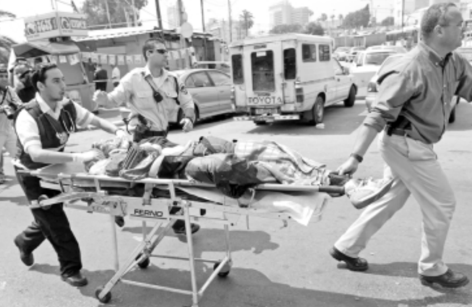
عمال الانقاذ يسعفون احد الجرحى