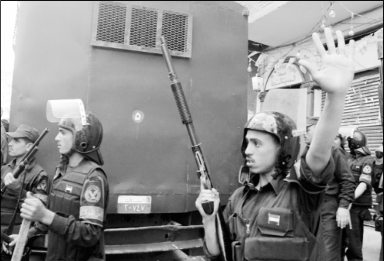
اقراء قوات الامن المركزي في مواجهة المتظاهرين في الاسكندرية امس الاول

التقرير عن عمليات عزل المثقفين الفاعلين في الحياة الثقافية العراقية تحت ذريعة علاقاتهم بالنظام السابق، ووضحت الاحزاب الجديدة والقادمة من الخارج العربية التي يحاول الكثير من الكتاب والمثقفين الدخول في الوسط الثقافي مع ان هذه الاحزاب لا تعبر الا عن مصالح فئوية أو إثنية أو طائفية. وقد تبنت بعض الاحزاب مثقفين مرحليا وحاولت تسخير جهودهم في ما يصيب في خدمة مصالحها. واصبحت الثقافة والاعلام رهن وجهات نظر علمانية او دينية باتت تتصارع على الوضع القائم في العراق. ويعترف التقرير ان الوضع العراقي الجديد الذي يشير الى تعدد سياسي لم ينجح حتى الان بخلق قطاع خاص ينشط بشكل حقيقي وفعلي في مجال بناء مؤسسات ذات طبيعة ثقافية تمتلك استقلالها الذاتي. ووصف التقرير الواقع الثقافي، والتعليم والاعلامي بالمشوه والمهزوم من الداخل، والسبب في الوضع الجديد لثقافة طائفية فتوية يشير اليها التقرير بالنزعات «اللاتقافية» تشير لعملية فرز تقوم على أسس غير ثقافية كالكلاس الطائفية أو العنصرية أو العربية أو القومية أو السياسية ذات