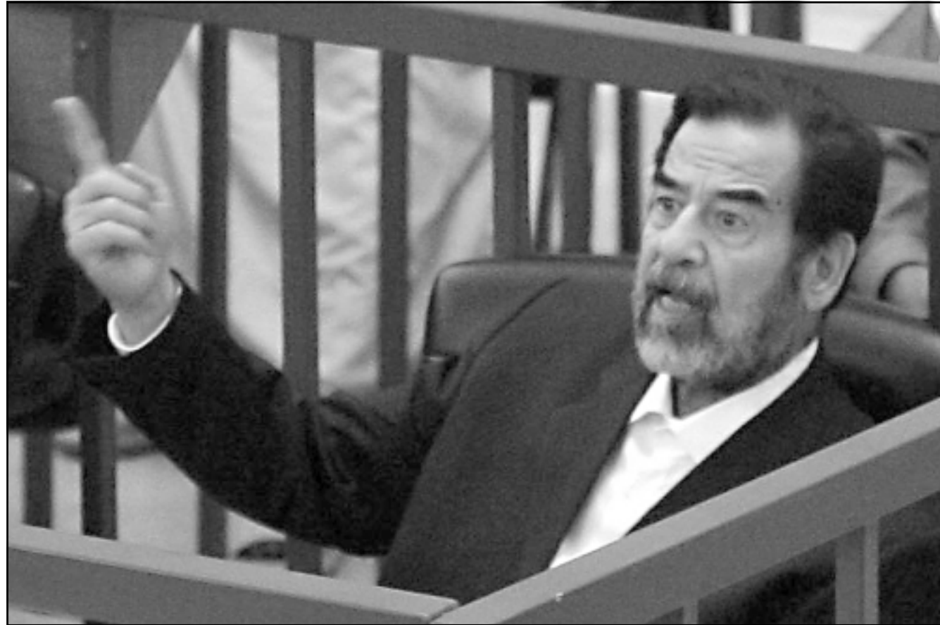
الرئيس العراقي السابق صدام حسين اثناء حضوره جلسة الامس

بعد تأجيل انعقاد البرلمان في ظل مسلسل فشل الصفقات المستمر