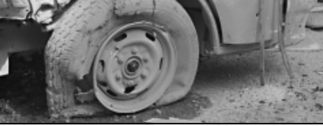
سيارة دمرها انفجار في بغداد امس

وصرح لقناة «العربية» الفضائية الاخبارية الاسبوع الماضي «انا كذا سنغير وزير الدفاع في كل مرة يختلف اثنان او ثلاثة من آلاف وآلاف الاميرالات والجنرالات، فان الامر سيتحول الى دوامة».