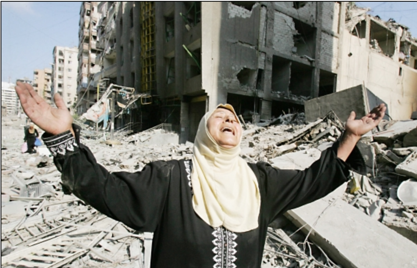
لبنانية تصرخ وسط حطام منزلها في الضاحية الجنوبية في بيروت امس