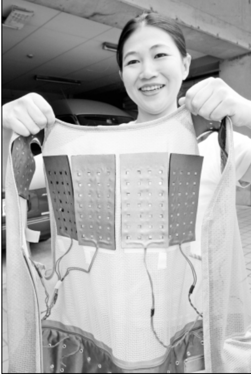
عارضة تقدم نموذجاً تجريبياً لسفرة مبردة برفائق من اشباه الموصلات التي تستخدم في تبريد اجهزة الكمبيوتر. وقد تم تصميم هذه السترة للمرضى وكبار السن ممن لا تستطيع اجسامهم ضبط درجة حرارتها

وارتفع الاتفاق بنسبة 0,2 في المئة للشهر الثالث على التوالي في حين سجل الدخل الحقيقي بعد خصم الضرائب ارتفاعا بنسبة 0,4 في المئة وهي أكبر زيادة منذ كانون الاول (ديسمبر) الماضي.