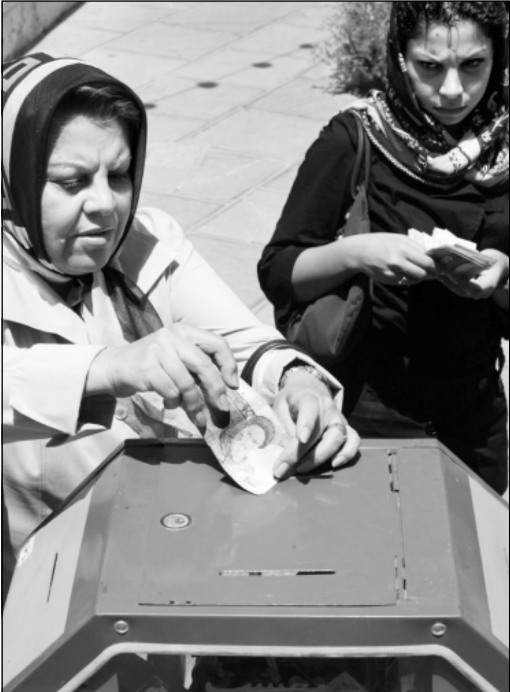
ايرانيات يتبرعن لضحايا لبنان

كما أعلن وزير الخارجية الكندي بيتر ماكاي انه يدعم «بلا تحفظ» القرار الذي تم تبنيه الائتين في مجلس الامن الدولي ويمهل طهران شهرا لتعليق أنشطة تخصيب اليورانيوم. وأضاف الوزير ان «البيان تران» المرحلة الحالية حاسمة نحو تسوية دبلوماسية للملف النووي الإيراني» وتعد فيه ببقاء الأسرة الدولية من الأنشطة الإيرانية النووية السابقة والحالية..