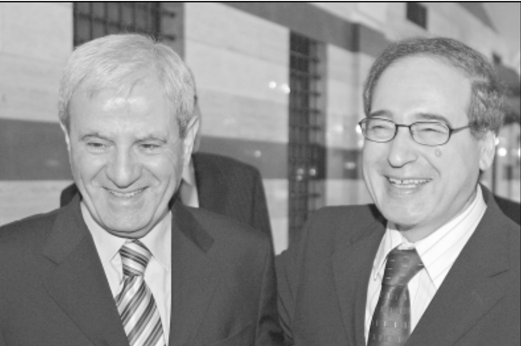
مساع وزير الخارجية السوري فيصل مقداد (يمين) لدى استقبال وزير الخارجية اللبناني فوزي صلوح

وقال «ان هذا الاحتمال قائم، وعلى سورية أن تتعامل بكل حذر مع هذه النوايا المبيتة».