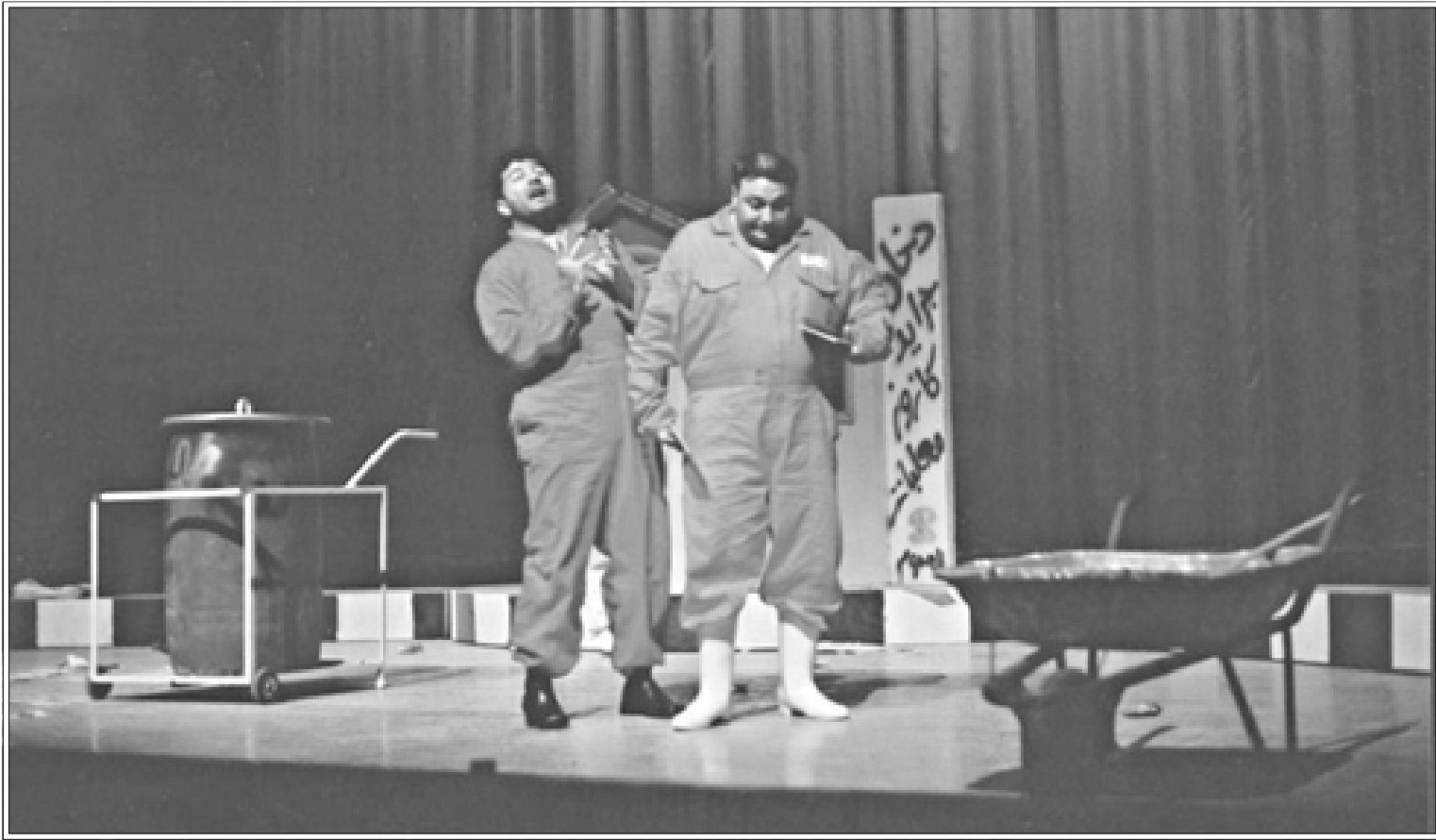
مشهد من المسرحية

قدمت «الفرقة المسرحية» التابعة لنقابة فناني حماه عرضها «العاري والأنيق»، مساء يوم الأربعاء 7/ 2006 على خشبة مسرح اتحاد نقابات العمال بدمشق، ضمن فعاليات مهرجان الهمزة المسرحي الأول في سورية. وبدائية نذكر بعضاً من أعمال الفرقة المسرحية السابقة كالأشجار تموت واقفة، السيد صفر عن نص «الألة الحاسية»، الزوجات الثلاث، قبل أن يذوب الجليد، وسواها من الأعمال التي أخذت العديد من الجوائز على صعيد المسابقات الفنية في المحافظات السورية. «مولود داؤد» يقدم عرضه الرابع مع الفرقة، عن نص يحمل توقيع المخرج الإيطالي «داريو فو» محافظاً بأمانة على روح الكوميديا ديلازته التي يحملها النص، وينجح في تقديم عرض يكسب الصالة دون أن يفقد نقادها تماماً!