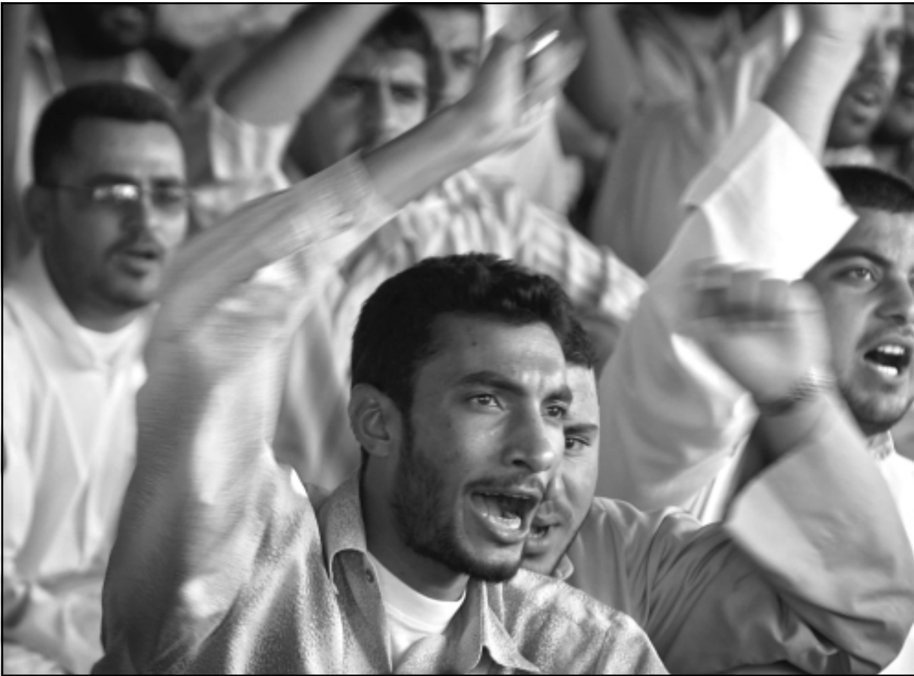
عراقيون يهتفون دعماً للبنان بعد صلاة الجمعة في البصرة

وأكد د. مصطفى حرص السودان على انعقاد قمة عربية بمشاركة كافة الدول واجراء مشاورات واتصالات واسعة لضمان نجاحها وقال اننا لا نريد الاسراع بقمة تخرج بانسجام وقرارات تعود