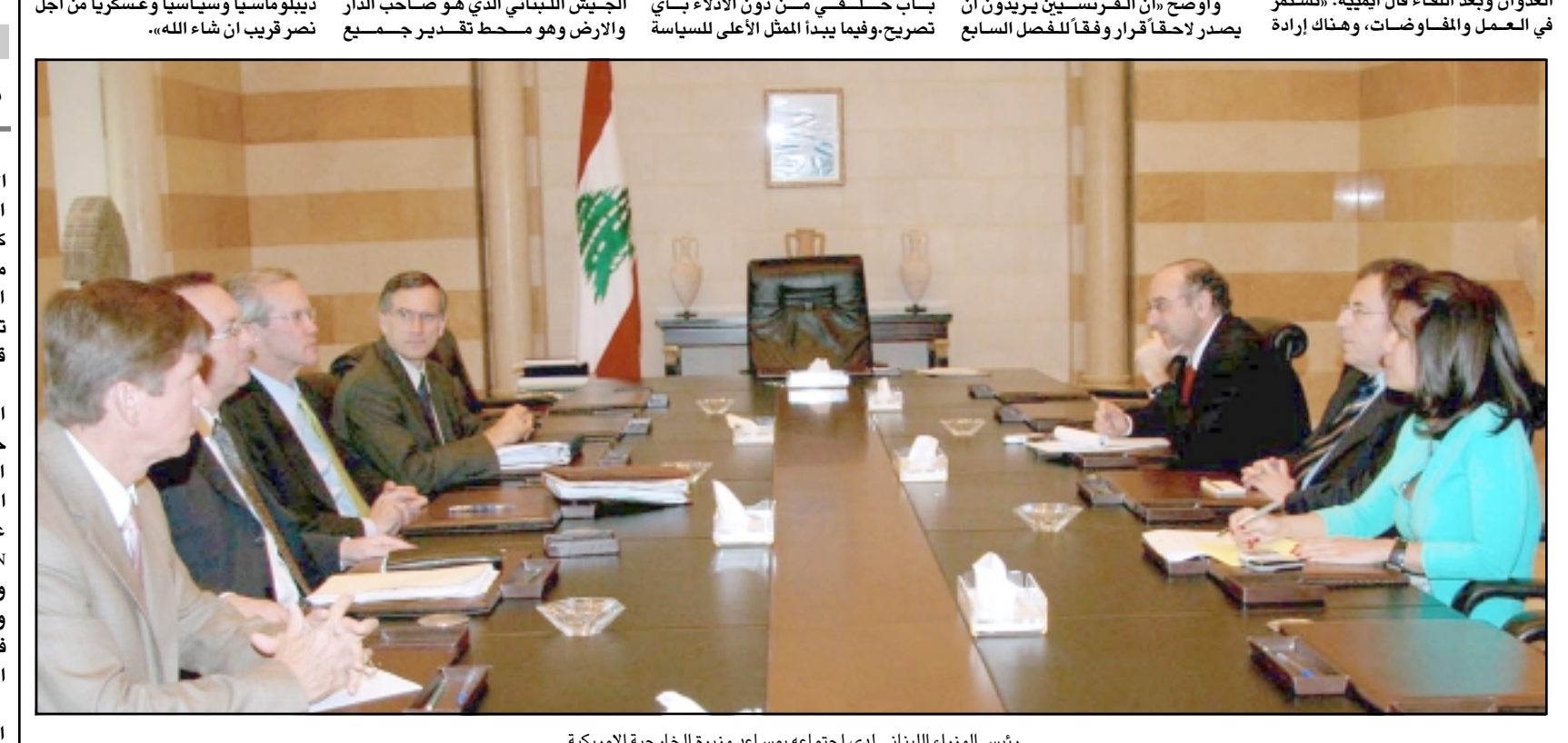
رئيس الوزراء اللبناني لدى اجتماعه بمساعدة وزيرة الخارجية الامريكية

المصورين الصحافيين بياناً جاء فيه «اننا وعلى الرغم مما يعاني منه المواطنون من اصابات متوثرة ومشدودة، فان ذلك لا يبرر ولا في اي شكل من الاشكال التعرض للمصور الصحافي في اي ظرف من الظروف، وتحت اي سبب من الاسباب حيث ان عمل المصور الصحافي يوازي في قيمته ما يقوم به الفاوضات لا تزال سارية حول التدابير العملية لتأمين تغطية لفصح العدوان اليكفي ما يتعرض له المصور الصحافي من مخاطر يومية في سبيل تامين تغطية لفصح العدوان». واضاف: «ان نقابة المصورين الصحافيين اذ تستنكر اشد الاستنكار وترفض ما يتعرض له المصور الصحافي من اعتداء واعاقلة لعمله، تتأشد جميع الهيئات الرسمية والخاصة وقوى الامن والجيش والمواطنيين العاديين تقدير الدور الذي يقوم به المصور وعدم التعرض له في حياته وممتلكاته، واحترام الدور الذي يقوم به في سبيل فضح العدوان وماسيه».