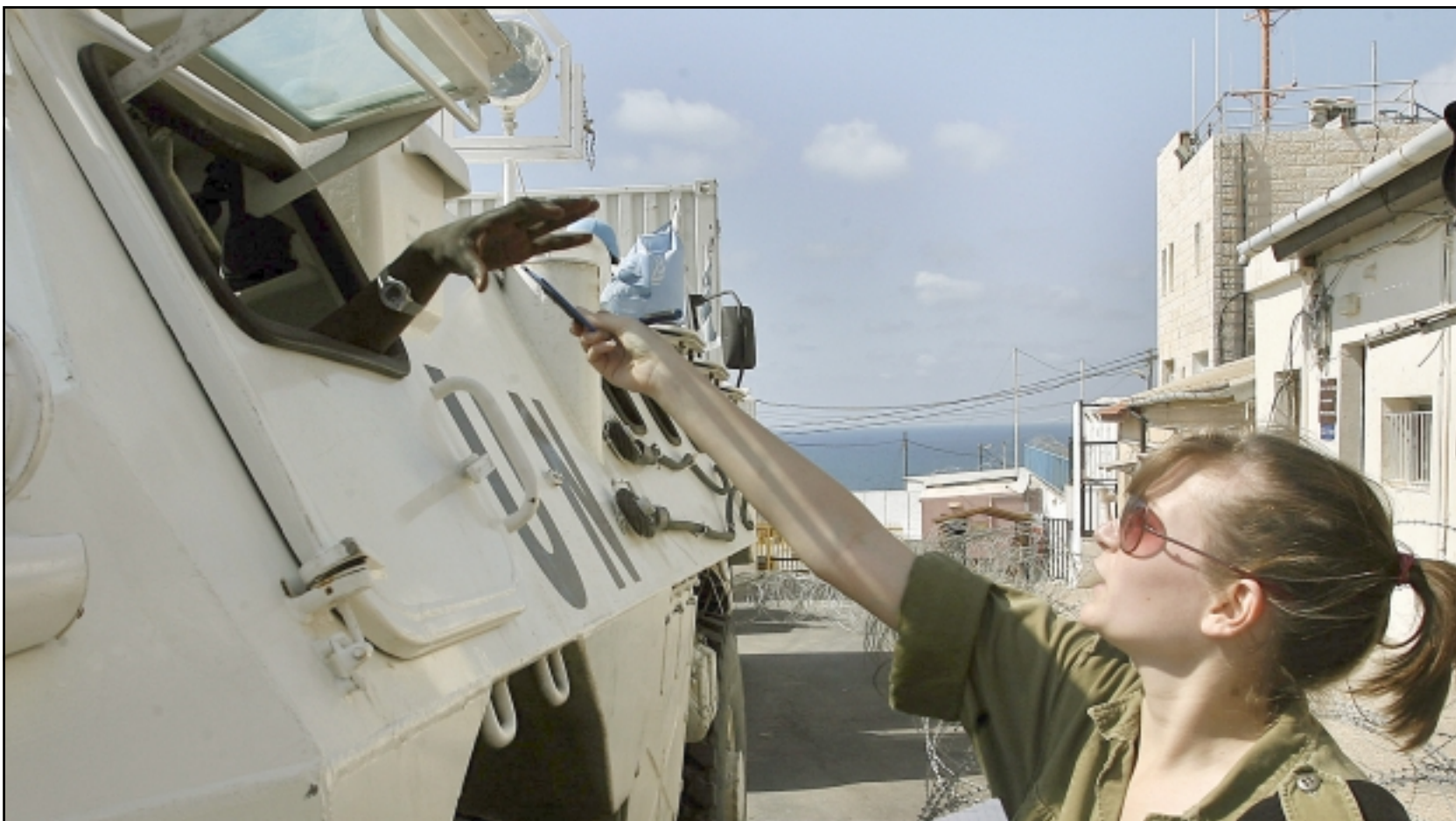
جنديّة اسرائيليّة تتفحص هويات قوات اليونيبيل على الحدود اللبنانيّة الإسرائيليّة