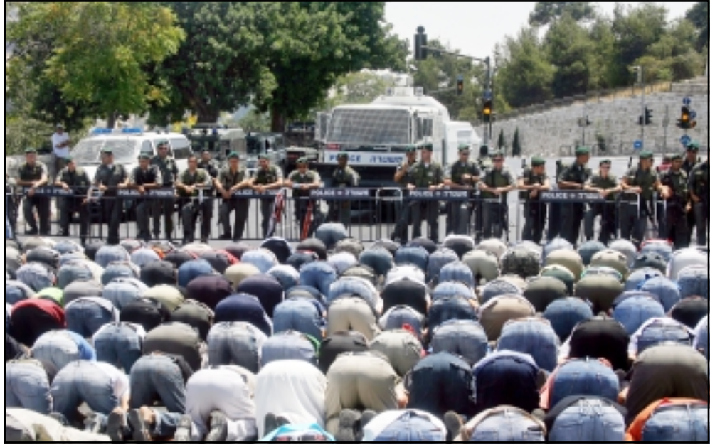
فلسطينيون يصلون على مشارف القدس بعد منعه من الوصول الى الاقصى

رام الله - «القدس العربي» - من وليد عوض: