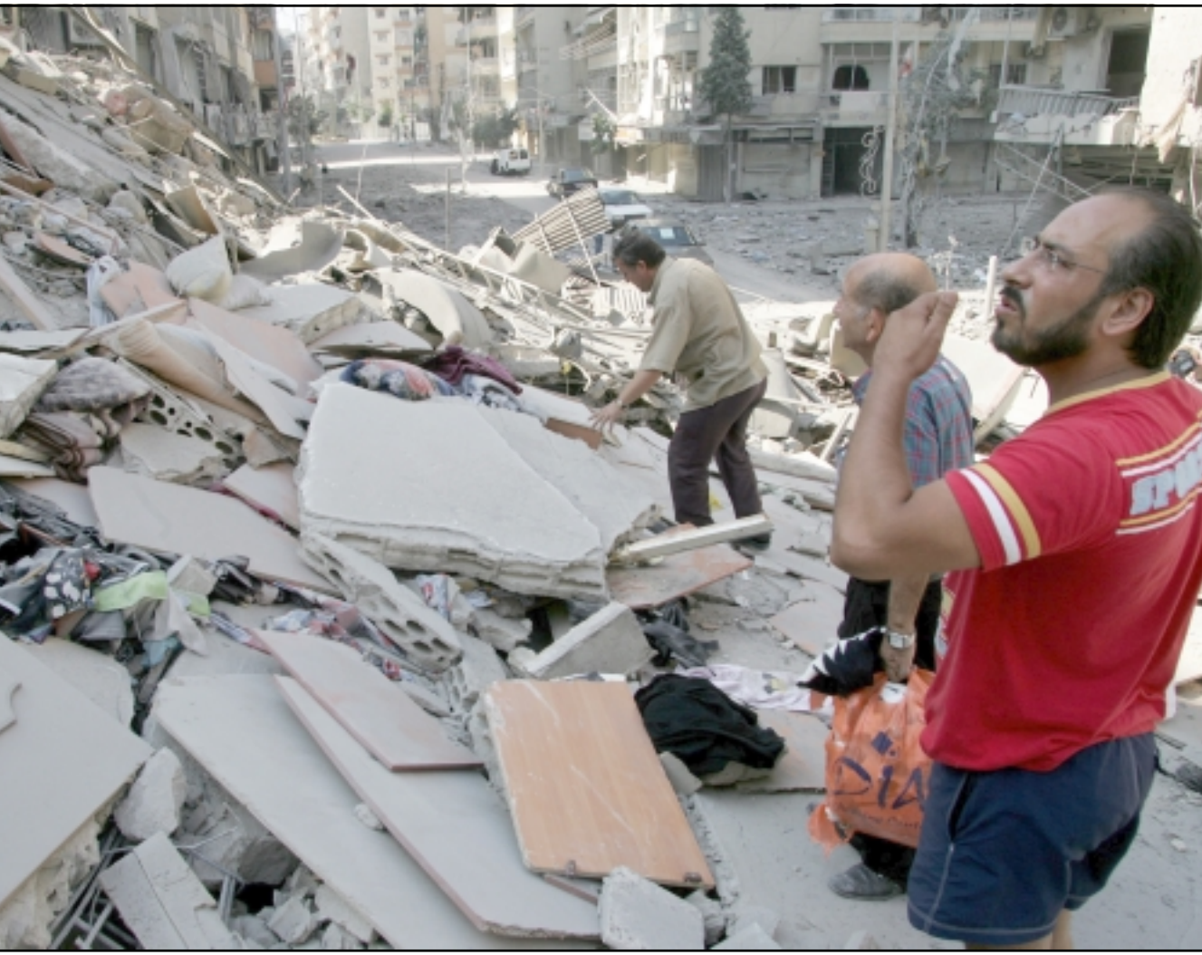
... ولبنانيون يبحثون عن ممتلكاتهم بين انقاض منازلهم المدمرة