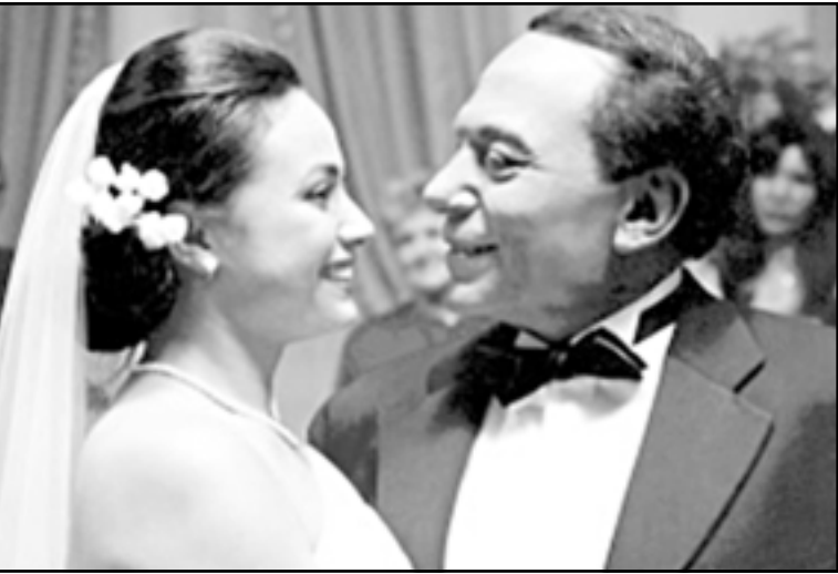
أحدى لقطات فيلم «عمارة يعقوبيان»