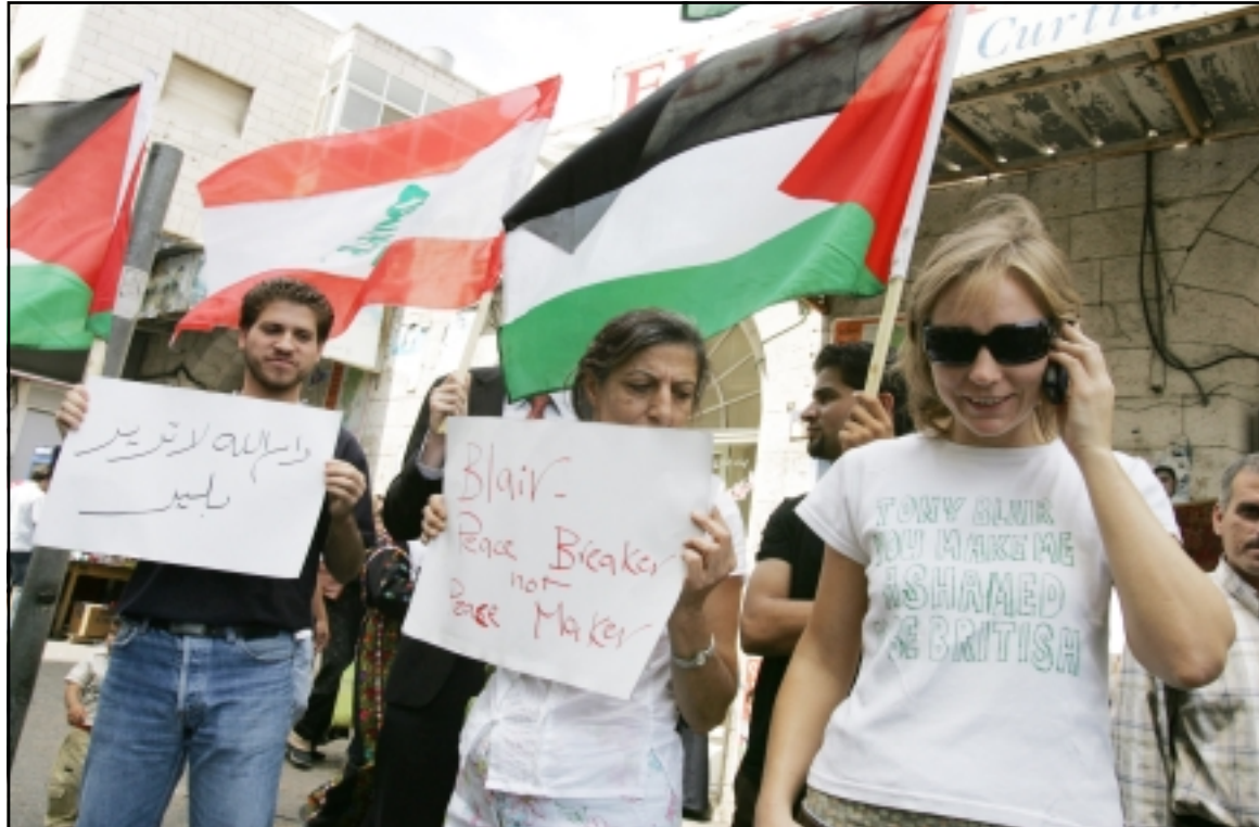
فلسطينيون يرفعون العلمين اللبناني والفلسطيني اثناء مظاهرات احتجاج على زيارة بليز للاراضي الفلسطينية