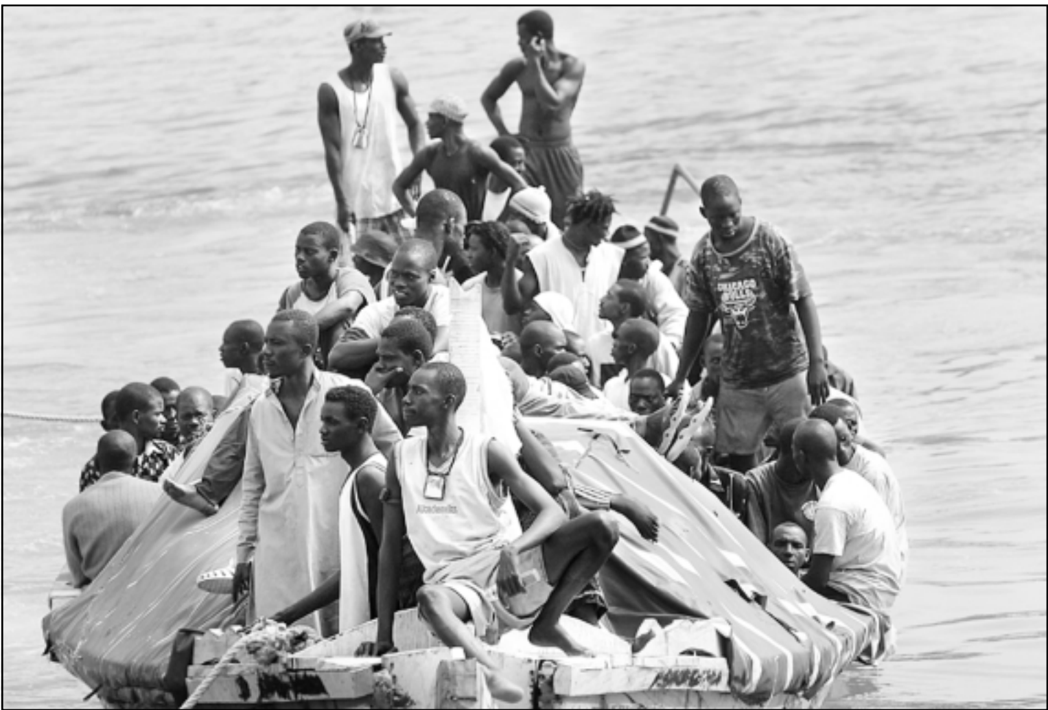
104 مهاجرا افريقيا وصلوا امس الاحد الى سواحل جزر الخالدات الاسبانية بعد رحلة شاقة وعذاب لا يوصف... أوروبا هي حلمهم الاقصى، اما أمريكا بعيدة جدا

وقالت «لقد أتيت الى الولايات المتحدة لأنني أردت تطوير نفسي، هذه ولادتي الثانية».