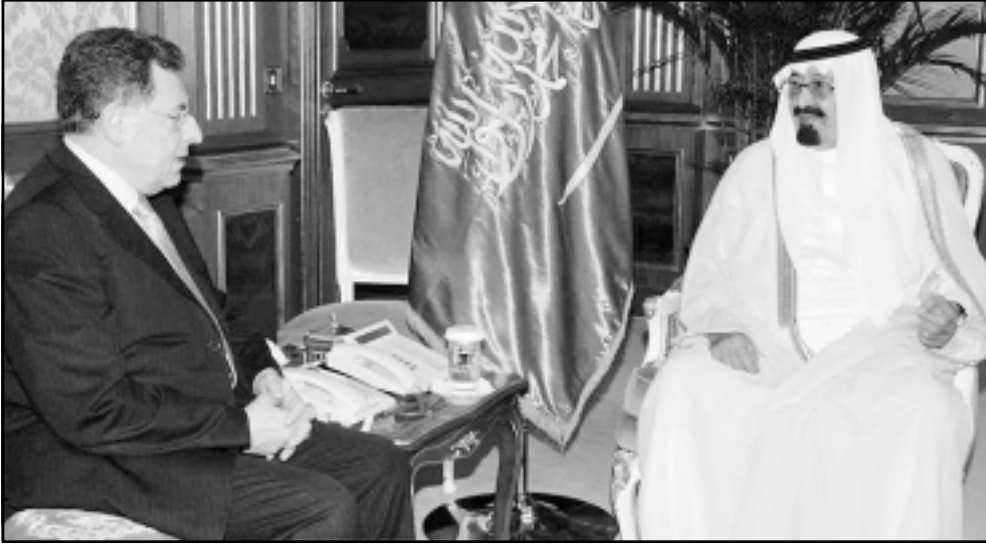
العاهل السعودي لدى استقباله رئيس الحكومة اللبنانية في الرياض امس