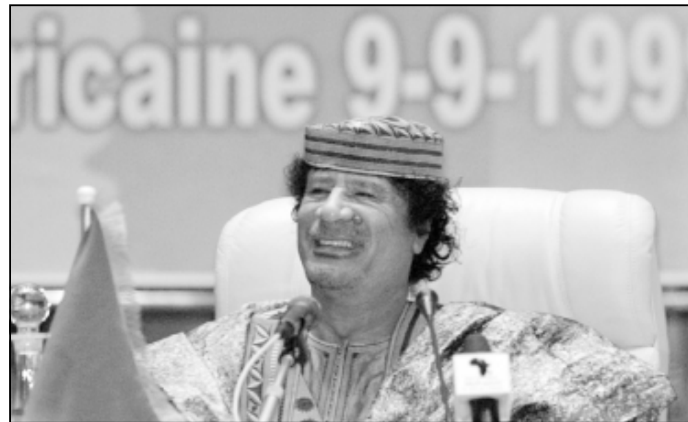
العقيد معمر القذافي في احد اجتماعات قادة الاتحاد الافريقي بسرت السبت

من جهته، ندد الزعيم الليبي معمر القذافي الذي يستضيف الاحتفالات، بقرار ارسال قوات دولية تابعة لمام المتحدة الى دارفور، معتبرا انه «استعمار» جديد.