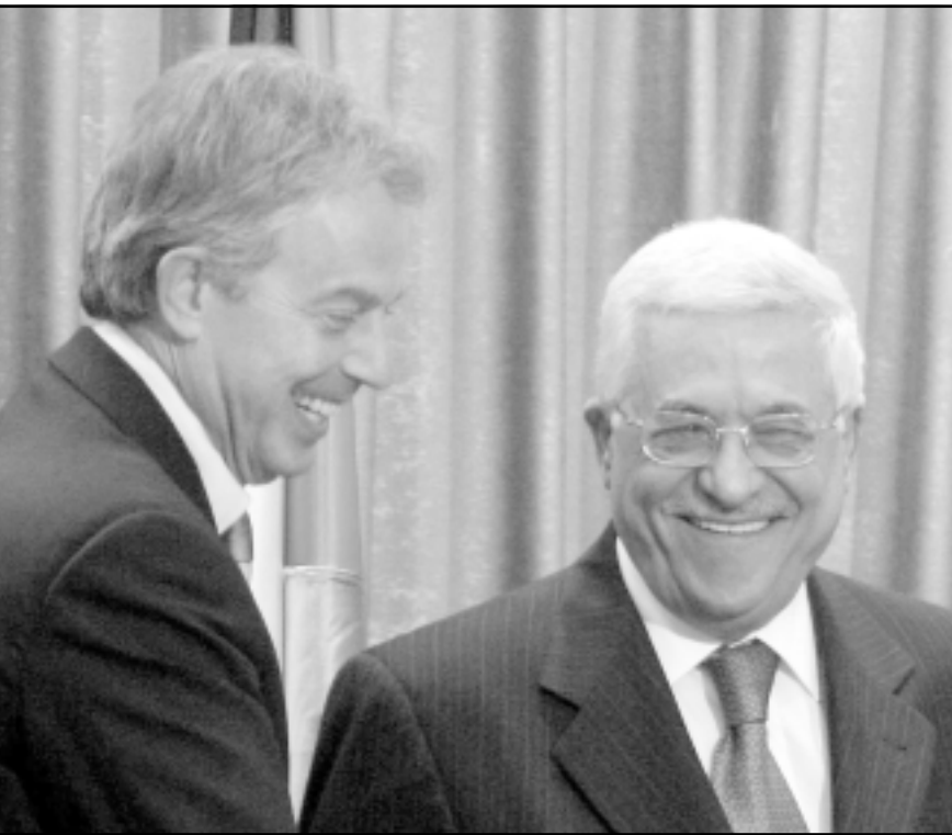
الرئيس الفلسطيني محمود عباس ورئيس الوزراء البريطاني توني بلير في مستهل مؤتمرهما الصحافي في رام الله

شروط (...) فهذا لن يضرب بل على العكس سديمع موقفا ويعطي فرص التعاون الاقليمي ضد قوى الشر». وردا على اسئلة الصحافيين قال وزير السياحة اسحاق هرتسوغ «بعد الحرب (على لبنان) هناك فرصة يساعد لقاء بين أولرت و ابو مازن». واما زرة التعليم بولي تامين فرأت انه «لإعادة الهدوء الى المنطقة لا بد من بدء مفاوضات مع ابو مازن و (فؤاد) السنيورة و بشار الاسد».