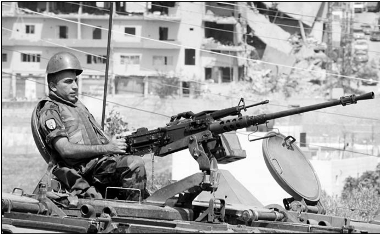
جندي لبناني على مدرعة استعدادا لدخول بلدة بنت جبيل

لبنان عام 2000 وضد سورية وايران اللتين ترفضان الخضوع للهيمنة الامريكى والشروط الاسرائيلية وضد الشعب الفلسطيني التمسك بحقوقه المشروعة، ووفق حزب الله في بيانه على الحاجة الملحة الى استعادة ثقة اللبنانيين بوطنهم ودولتهم، معتبراً ان ذلك «يعداً من خلال السعي الجسدي لبناء دولة عادلة وقادرة وديمقراطية وشفافة»، وقال «ان بناء دولة مملوكة ليس في استطاعت قوى تخلف بالترامات الانتخابية عند اول مفترق اساسى وقوى تتلقب على بيانها الوزاري عند اول تحد صميري وقوى بعضها في الحد الأدنى لتوط في الفساد والافساد خلال السنوات الطويلة، وقوى لا تمارس زعامتها الديمقراطية حتى في امرها واحزابها». وطلب حزب الله هذه القوى بـ«التخلي عن رهاناتها الخارجية وعن اعتمادها على القوى الدولية وتبعتها للسفراء الاجانب الذين يتدخلون في كل التفاصيل الداخلية وان تقتنع ان لبنان لا يبنيه ولا يصونه الا تعاون اللبنانيين جميعا وتكاتفهم وتوحدهم ومساهماتهم الجماعية في بناء الدولة دون عزل لأحد ودون استئثار لأحد وهو ما نصر عليه هذه القوى للاسف». ورد مصدر بارز في «قوى 14 آذار» على بيان حزب الله بالقول ان «التوتر الجاري على الساحة الشيعية والتخيرات الميدانية بفعل انتشار الجيش والقوة الدولية». وقال رئيس «اللواء الديمقراطي» النائب وليد جنبلاط انه «ان كان ما جرى من دمار وخراب وقتل من حزب العوان الاسرائيلي على لبنان يبني دولة فاننا نقبل به، ولكن اذا لم يكن كذلك، وكل ستة اشهر او فترة تاتيها جولة حرب جديدة، فمادام نستطيع ان نفلح سوى ان نستسلم لحسور ايراني-سوري أسر لبنان وسيداته واستقلاله». وفي حديث الى قناة «أوربت» الفضائية ذكر جنبلاط ان «حزب الله» تنظيم لبناني ولكن تمويله وسلاحه