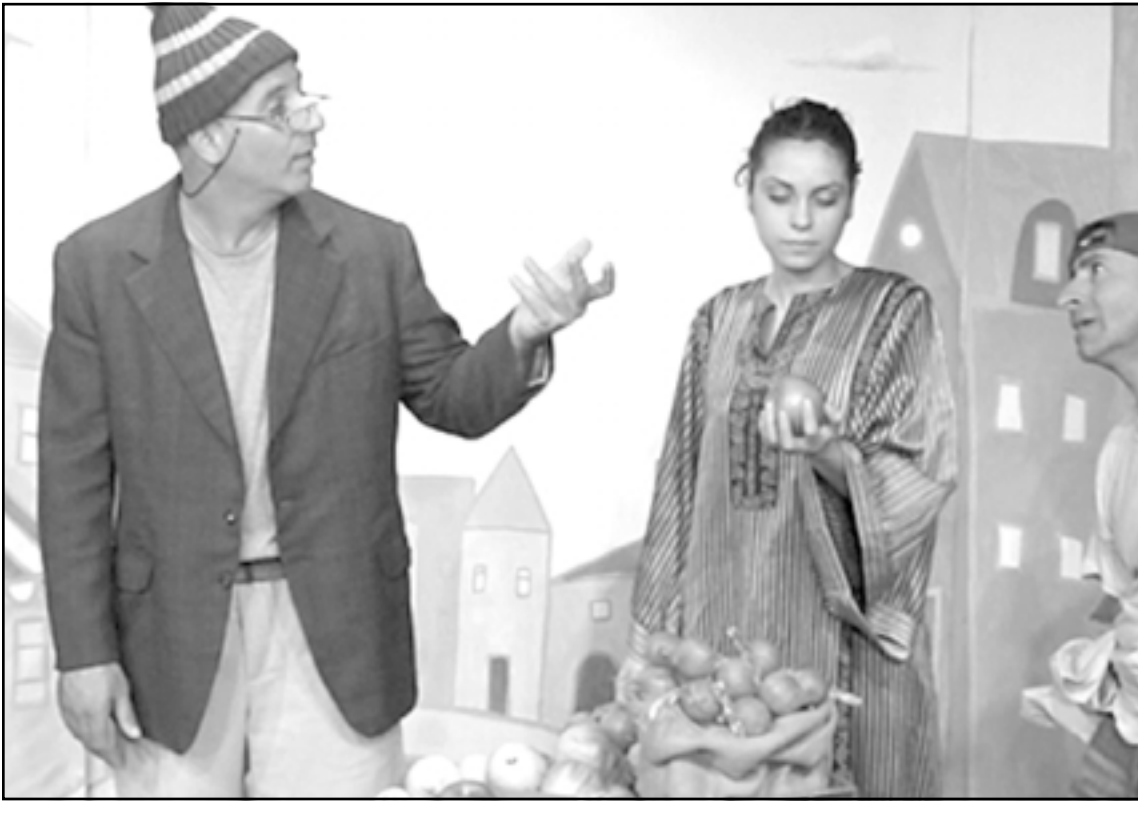
لقطة من مسرحية أشهب