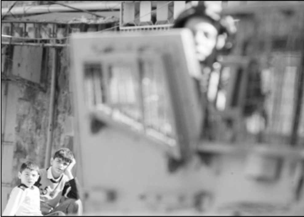
مفلان فلسطينيان يراقبان جنديا اسرائيليا مختبئا وراء باب مدعرة عسكرية في مدينة الخليل في الضفة الغربية

حق، فحول لفة ليبرالية ومنتفحة، وحرية القول وحرية التظاهر. كل هذا صحيح، ولكن في المقابل فان السيطرة على الطائفة المتديبة يابدي جماعة من المتعصبين وجماعة من الفوضويين «شبابو»، لا بد ان نزهيم من اين نشرب السمك الماء، ولكن، كما قيل، «يجب سكون قولاً مشتركاً لكلا الطرفين. ليتنا هابر رئيس ديوان راين سابقاً (يديعوت اخرونوت) 2006/11/9