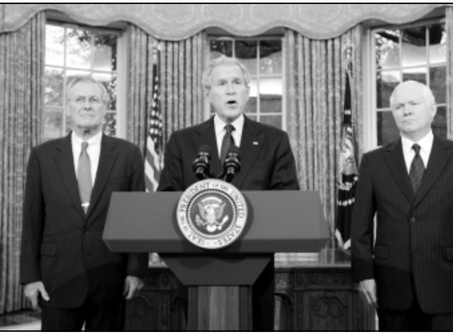
الرئيس الامريكي يعلن استعداده للعمل مع الديمقراطيين بعد اعلان النتائج النهائية للانتخابات