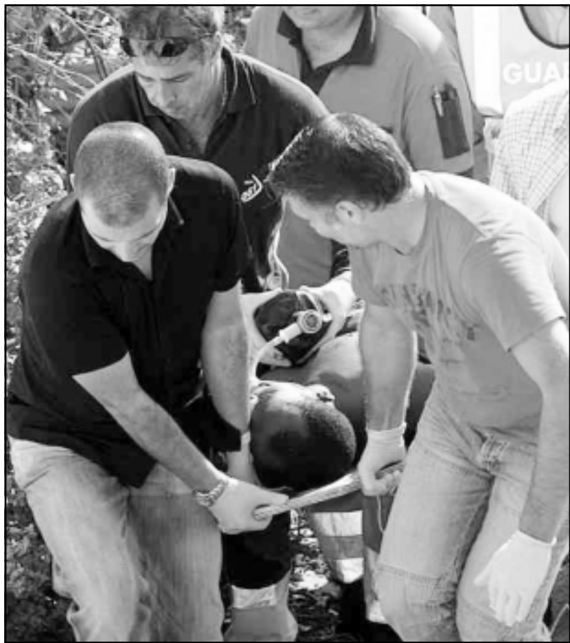
مهاجر غير شرعي في الطريق إلى المستشفى سببته بعد انقاذه من الغرق أمس الخميس

الاربعاء أن اسبانيا لم تفوت ليلته 20 مليون يورو الذي جرى الاتفاق بشأنها منذ شهر. وعلاقة بالمؤتمر وفي انتظار توصياته، فقد سادت حتى الآن نظريات مختلفة، بعض الأوروبيين يعتبرون أنه لم يحصل تقدم في مكافحة الهجرة السرية بحكم استمرار وصول المهاجرين إلى جزر الخالدات والجنوب الإيطالي، في حين تؤكد بعض الدول أن استراتيجيتها أعطت نتائج تذكر ومن ضمنها الجانب المغربي الذي أكد على تراجع كبير في أعداد المهاجرين السريين الذين كانوا ينطلقون من المغرب نحو الشواطئ الأوروبية.