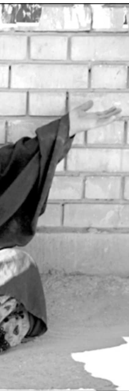
سيدة عراقية تبكي بجوار جثمانين لضحايا قصف في مدينة بعقوبة أمس (اف ب)

كانبره - يو بي آي: اعتبر رئيس الوزراء الأسترالي جون هوارد ان استقالة وزير الدفاع الأمريكي دونالد رامسفيلد لن تؤثر على الوضع في العراق. واعتبر هوارد انه «في ضوء نتائج انتخابات الكونغرس التي ليس من الواضح ان الرئيس (جورج بوش) قرر المباداة الى الاعتراف بعدم الرضا الذي يضر به البعض حيال مسار العملية في العراق». وكان هوارد يشير الى اعلان بوش يوم الأربعاء عن استقالة رامسفيلد وتعيين المدير الأسبق لوكالة المخابرات المركزية روبرت غايتس وزيراً للدفاع. واعتبر هوارد ان قرار بوش كان بمثابة «رد فعل على نتائج الانتخابات»، ولكنها لا ترقى الى مستوى التغيير الجوهري في التوجه.