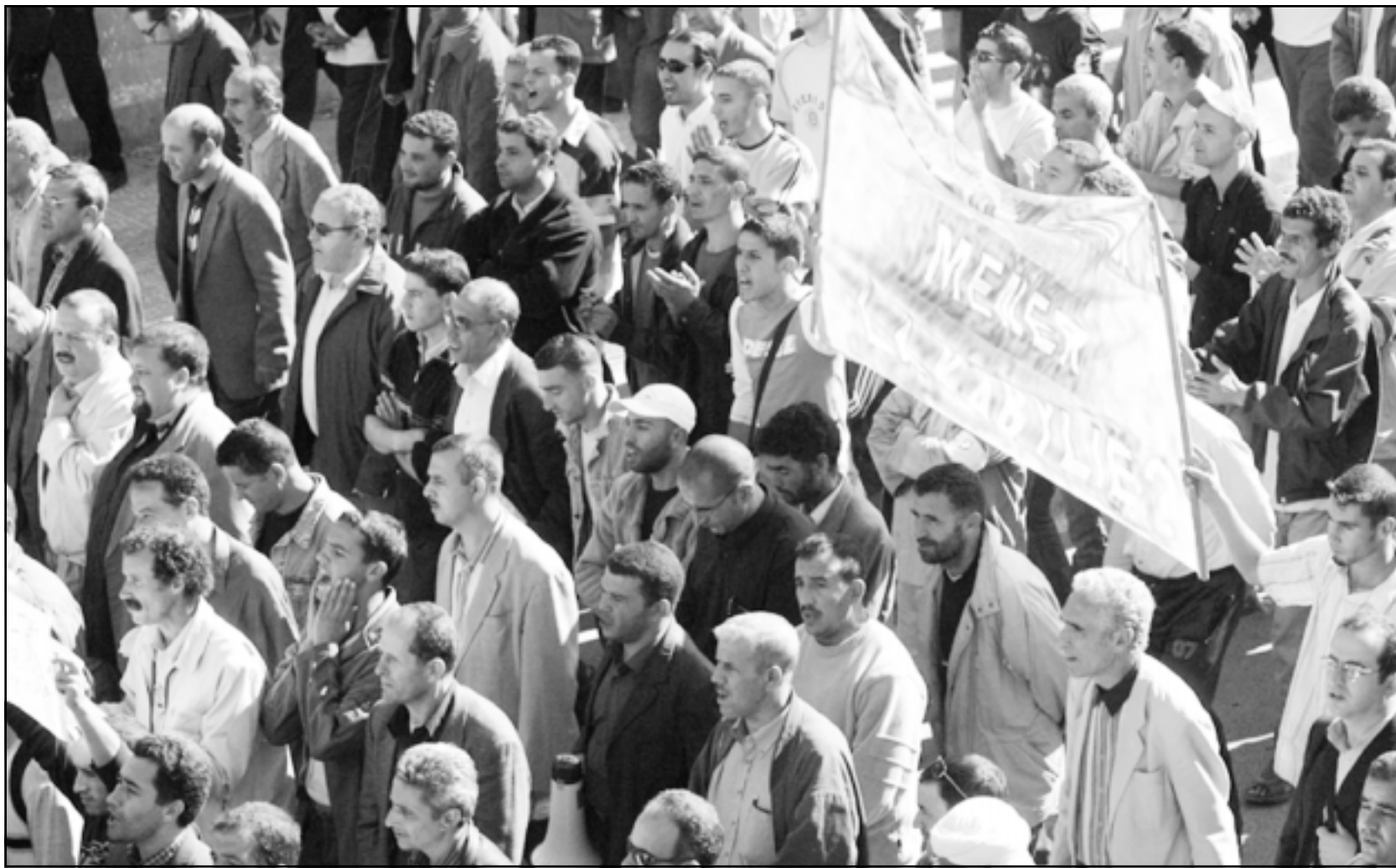
جانب من مسيرة احتجاجية سلمية نظمتها امس جبهة القوى الاشتراكية (معارضة) بمدينة تيزي وزو احتجاجا على «دوامة العنف والقتل» التي تشهدها الجزائر، ولإبراز «تمسك (الجبهة) بالقيم الديمقراطية والمساواة والتضامن».

في قصف مدفعي إسرائيلي فجر الأربعاء، وأشار إلى أن «اتفاقا حصل لعقد هذا الاجتماع في 12 تشرين الثاني/نوفمبر 2006 في القاهرة»، وكان موسى صرح الأربعاء أنه يجري مشاورات مع الوزراء العرب لبحث الاجراء الذي يمكن اتخاذه بعد «الجازر ضد الأطفال والنساء والمدنيين، وخاصة في بيت حانون شمال قطاع غزة حيث قتل 18 شخصا وقال عبد الخالق للصحافيين إن قرار عقد هذا الاجتماع اتخذ إثر مشاورات