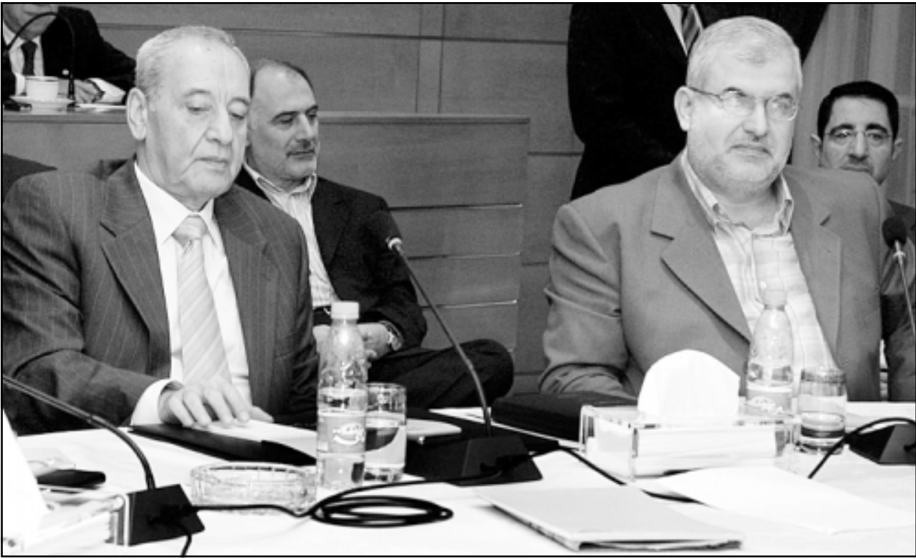
رئيس مجلس النواب اللبناني نبيه بري (يسار) والنائب محمد رعد عن حزب الله أثناء الجلسة التشاورية أمس

وفي الختام قال الحريري «تمّ كلام كثير في الهواجس والطروحات، لندرس الهواجس هناك وتشاور لكل فريق فلنؤجل الجلسة الى السبت... هنا أكد جوجع أنه لا يستطيع الحضور السبت لسبب قاهر، فحدد الرئيس بري الجلسة يوم السبت عند الساعة 11، وأعلن عن استنكار وإدانة المجازر في فلسطين، ولدى مغادرته، كشف النائب غسان تويني عن اقتراح إبلاغه للرئيس بري بإعداد عريضة نيابية تطالب بإسقاط الرئيس لحدود، لكنه أوضح أن رئيس المجلس أجابه أن هذا الموضوع ليس مدرجا على جدول الأعمال، أما رئيس الحكومة فؤاد السنيرة فوصف طبخة المر بأنها «شايطة»، ويلزمها ملح، وأوضح «أن الجلسات ستعقد عن أقدام ملاب بإسقاط الحكومة»، وردّ العماد عون «أذا كانت الطبخة شايطة أم لا فالجميع سيأكل منها لأن الكل جوعانين».