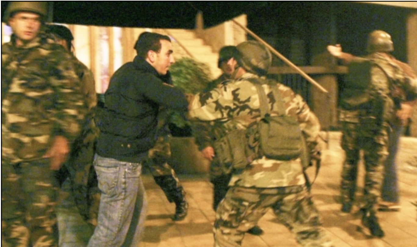
جنود يشتبكون مع مناصرين للقوات اللبنانية في حي الاشرفية في بيروت (رويترز)

البحر، الذين حاولوا اعادة رفع صور العماد ميشال عون واعلام التيار في الاشرفية مكان تلك التي احرقها ومزقتها مناصرو الكتائب والقوات اللبنانية بحجة الغضب من اغتيال الوزير بيار الجميل.