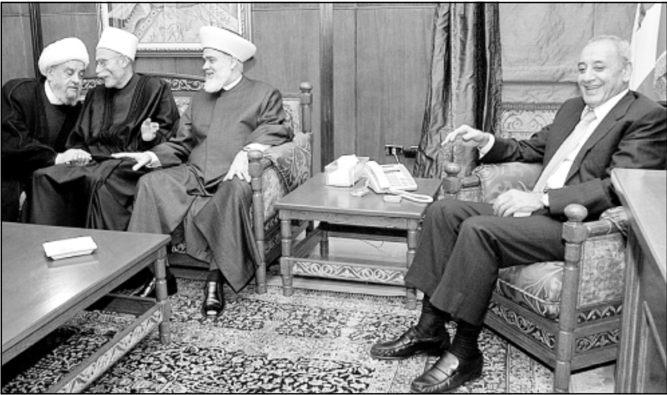
الرئيس بري لدى لقائه برؤساء المذاهب الإسلامية في بيروت امس

يدهم لكل الاطراف في عملية الصراع القائم، ولا سيما المسيحيين، ووضعوا أنفسهم بتصريف صاحب الغيطة تاريخه له المبادرة التي يعلنون مسبقاً موافقتهم عليها لرفع التشنج القائم في الاوساط المسيحية بصورة خاصة».