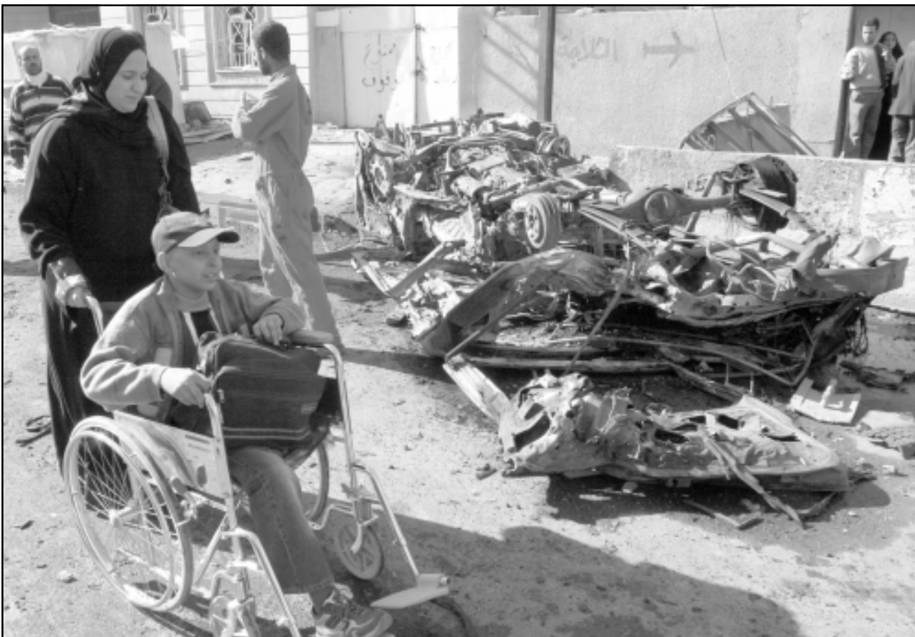
سيده عراقية مع ابنتها امام حطام سيارة في بغداد امس

■ بغداد - رويترز: تبحث القوات الامريكية عن جثة قائد مقاتلة اف 16 الامريكية عندما سقطت طائرتها في ليبيا في الوقت الحالي» مضيفاً انه ليس موجوداً معقل للمسلحين السنة التي التمسال الغربي من بغداد، واختفت جثة قائد الطائرة الذي لم يعلن بعد عن هويته من موقع الطائرة مباشرة على بعد نحو 30 كيلومتراً الى الشمال الغربي من بغداد في الفلوجة المضطربة التي تمثل محلي عقب وقوع الحادث ما بدأ بوضوح انه جثة مضرحة بالدماء لرجل في ملابس قتالية فيما يبدو يرتدي مجلة ويرقد في المكان الذي غطيته حطام الطائرة. ولكن الجيش قال ان فريق انقاذ لم يعثر على الجثة. وقال الكاتب تانان بروشير من القوات الجوية