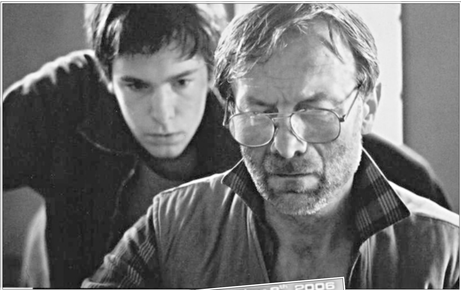
أحد افلام مهرجان القاهرة

لأهم الأفلام المتميزة مثل «بوسنة» للمخرج «فيليب عرقتجي»، «يوم مثالي» لخليل جورج وجوانا حاد جيتوماس، «زنا النار» لبهيج حجاج والفيلم الأخير عرض في الدورة الماضية للمرة الثانية على التوالي للعرض خارج المسابقة، وربما يأتي هذا التكرار لكونه الفيلم السياسي الوحيد بين نظرائه الذي يتعرض للحرب اللبنانية عام «85» حيث كان سيل التقابل الصهيونية يقصف بيروت ويحيل الحياة فيها إلى فوضى عارمة، ويتداخل أهم الخاص بالعام ويعيش الأبطال في تنازعات إنسانية تقطع أوصار العلاقات العاطفية والإنسانية بينهما، على خلفية الشنات التي أصاب الواقع اللبناني كله ويات عنواناً للشخص والأفراد، بيد أن ذلك الشنات تجاوز حدود بيروت ولبنان وصار سمة غالبية على كل الأقطار العربية، فيما يقبع العدو بمفرده في الظلام يمارس قسوة اليومية بالقتل والدمار مستغنياً نشوة القوة والبطش وتملذذاً براحة الغياب وطعم الدم؛ المشه أن هذا كله لم يثر حفيظة أعضاء لجنة المشاهدة تجاه ما يعرض من أفلام أخرى لدول لها ذات التوجه، بل على العكس يتم التعامل معها بوصفها كميّات منعزلة عن هذه الممارسات برغم علم هؤلاء الأعضاء بملوع هذه الدول وعلى رأسها أمريكا في كافة جرائم الحرب سواء ما يرتكب منها في العراق بايد