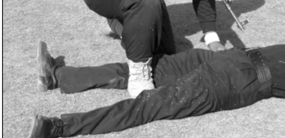
عنصر من الشرطة العراقية اثناء تدريبات في بغداد الجمعة

ويتحدث فيسك ساخرا عن نوري المالكي حيث قال ان ولاءه لبوش ينسب ولاء وزير الاعلام العراقي السابق محمد السامرائي لاسرائيليين سلاح الجو المصري بالكامل، وكذلك الرئيس الامريكي السابق جيمي كارتر الذي كان يتحدث ايران الشاه على انها واحة استقرار في المنطقة، وذلك قبل ايام من قيام الثورة الاسلامية، اما الرئيس الروسي ليونيد بريجنيف، فقد اعلن انتصار الاتحاد السوفييتي في افغانستان بينما كان اسامة بن لادن ومقاتلوه يحتلون قواعد القوات الروسية.