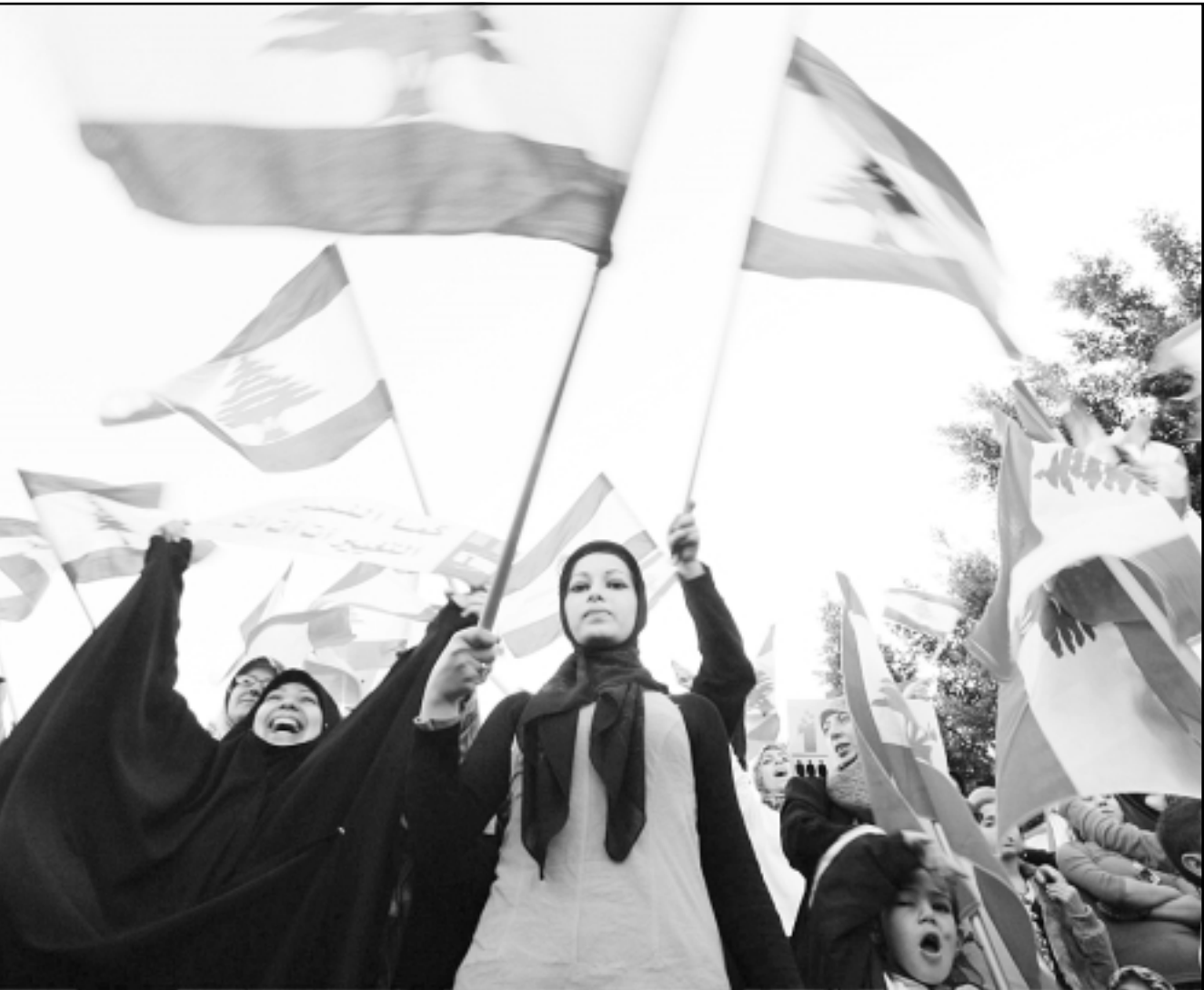
جانب من المظاهرة المعارضة اللبنانية في بيروت

يوسعه ان يؤيد للجمهور اللبناني بأن الحديث يدور عن مصلحة ضيقة، مؤيدة لسورية، وليس مطلبيا لصلاح جور سياسي. ولهذا الغرض، فإنه