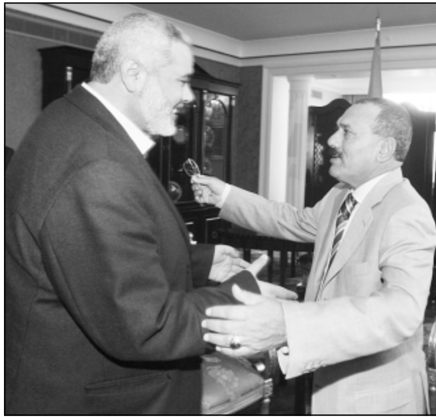
الرئيس اليمني علي عبد الله صالح لقاؤه رئيس الوزراء الفلسطيني إسماعيل هنية في الدوحة

الفلسطينية قد عقدت اجتماعا لها ظهر الجمعة بحضور الرئيس عباس استمر قرابة ثلاث ساعات ناقشت خلاله آخر التطورات فيما يتعلق بمشاورات تشكيل حكومة الوحدة الوطنية. وفي بيان لها عقب الاجتماع قالت اللجنة التنفيذية ان عباس قدم لأعضائها عرضا شاملا للتطورات الأخيرة ولللقاءات والاتصالات التي أجراها سواء على المستوى الوطني أو إقليمي ودوليا. وقالت اللجنة انها تقدر الجهود التي بذلت من أجل تشكيل الحكومة على الرغم من وصولها إلى طريق مسدود كونها عبرت عن التحني بروح التسوية الوطنية العالية والحرص على وحدة الصف الوطني، بعيدا عن التزمّت التنظيمي والفئوي. وأشارت اللجنة التنفيذية أن «الشروط التي تمسك بها مملو حركة حماس خلال المشاورات، تمنع قيام حكومة وحدة وطنية، لأنها تجعل الحكومة القادمة حكومة ذات لون واحد، يستأثر فيها طرف واحد بالمواقع الرئيسية، عدا عن كونها سوف تفضل في كسر الحصار السياسي والمالي، بسبب عدم الالتزام بالشرعية الفلسطينية ومبادرة السلام العربية والشرعية الدولية كمرجعية للحكومة».