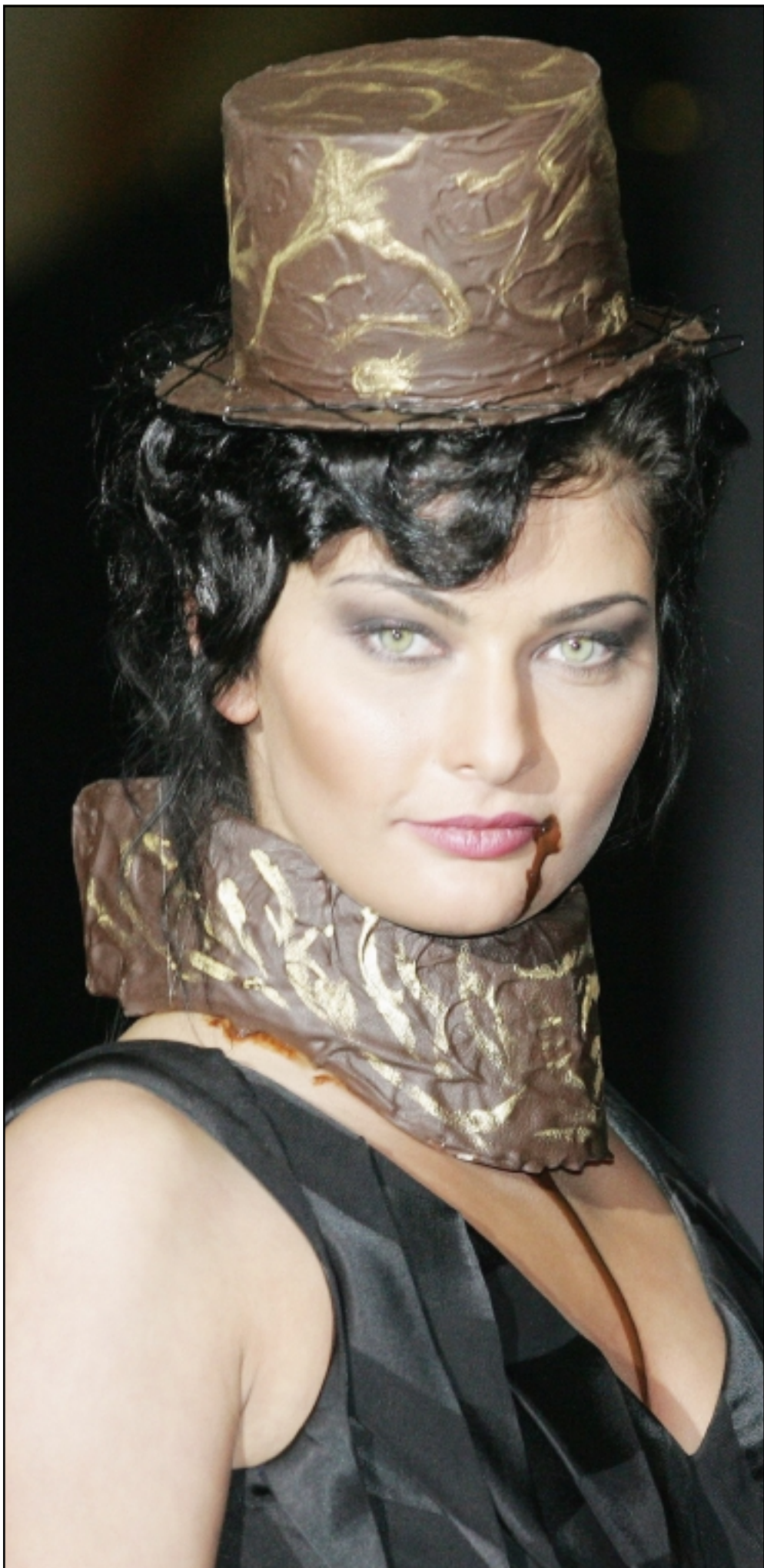
في أول معرض للشيكولاته يقام في العاصمة الروسية موسكو قامت هذه المعارضة بتقديم زلي يشكل بعض (الكافيه) من الشيكولاته!

● وزير الثقافة المصري فاروق حسني قرر تحويل قصر «الكسان باشا» بمحافظة اسيوط بصعيد مصر إلى متحف