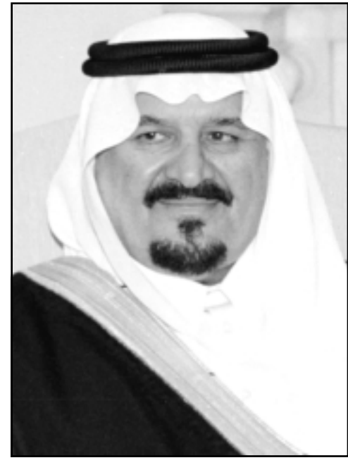
الامير سلطان بن عبدالعزيز