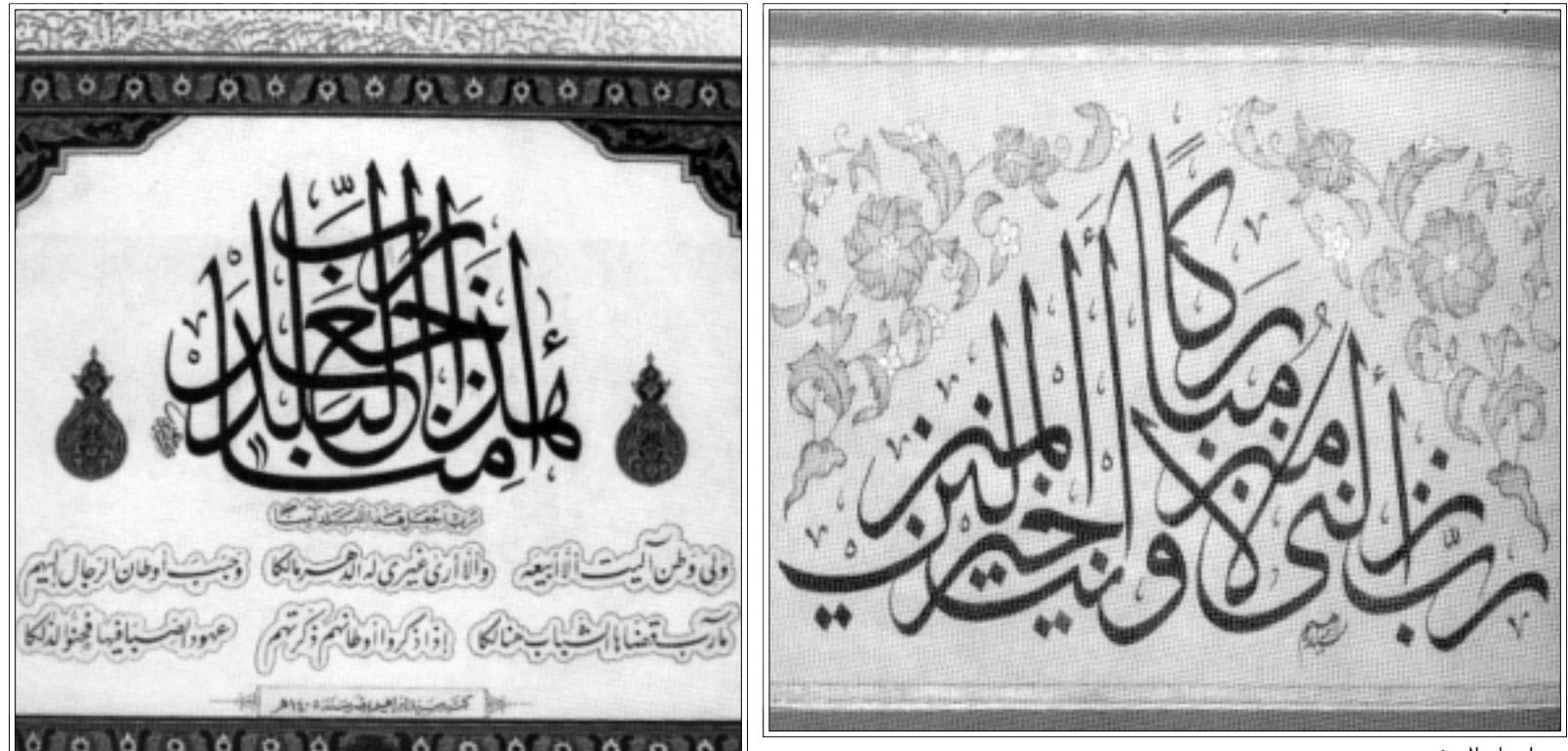
من لوحات المعرض