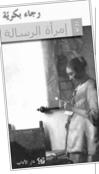
رغبتى بوصولها إلى جميع العواصم العربية، لكن يقلقني أن تعود أسباب المنع إلى خلفيات سياسية أكثر مما تستند إلى خلفيات اجتماعية أخلاقية وفق المعايير المتبسة لدى الرقابة والمراقبين.

لم يكن في نيي أن أتناول هذا الموضوع بالمكتبة لولا كلمات الغزاة المضحكة التي تلقيتها من بعض الأصحاب، وليس من هواجسي أن أرد على أحد لأن من حق كل إنسان أن يكتب ما يشاء، ولأن فسحة الوطن كالشمس والهواء تحاول وحدها الاستئثار بأقراص الشهد وخيرات الوطن، فهذا شأنها وعلتها وحدها. ومن نعم الجباري أن جنرال الفساد يقف لها بالرصاء، وهو بالتأكيد أقوى من جنرال الشتاء الروسي خلال الغزو البونابرتي والنازي.