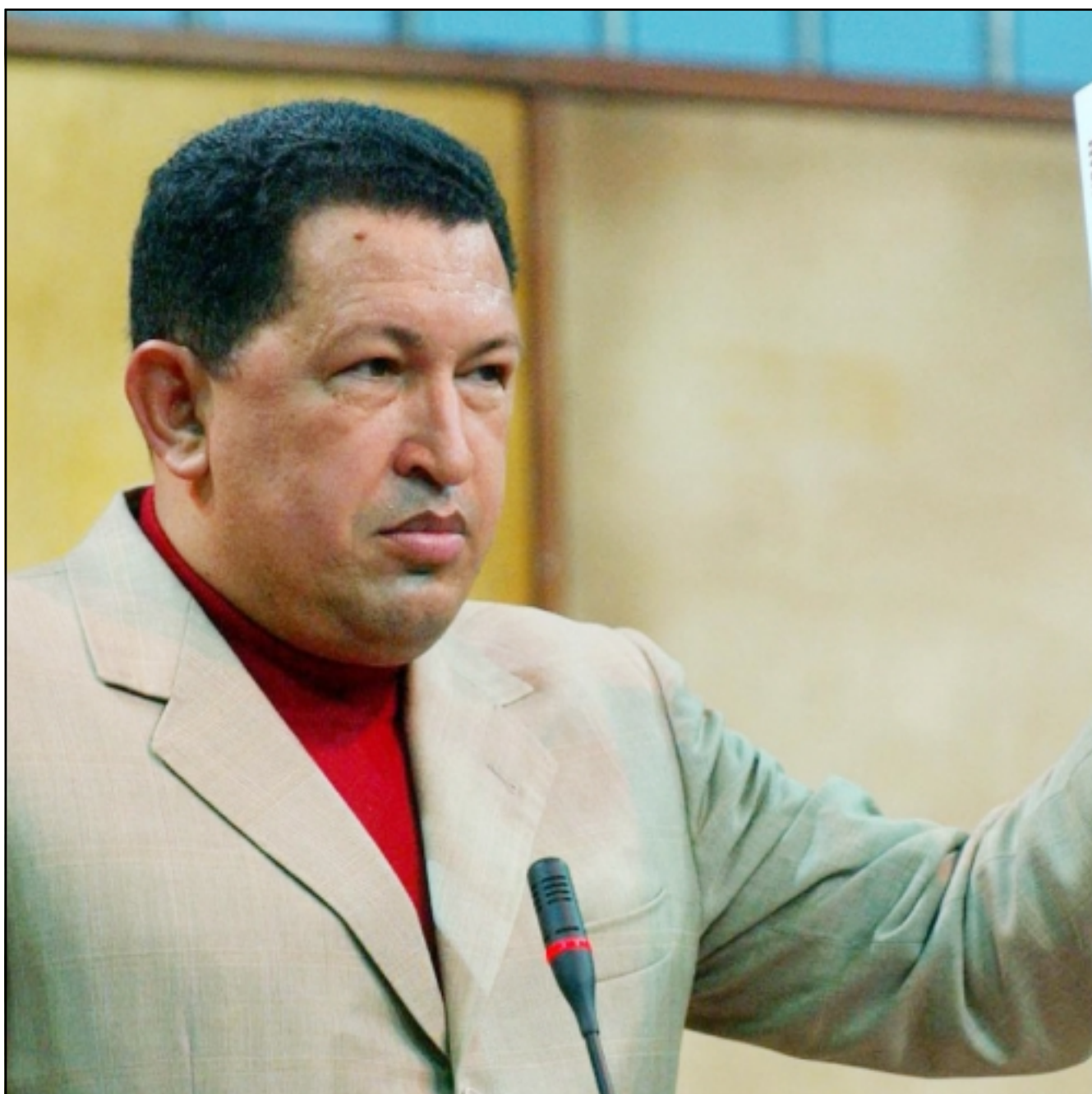
الرئيس الغزولي هوغو شافيز يحمل احد كتب المفكر الأمريكي نعوم تشومسكي وذلك اثناء حديثه عن ارهاب امريكا في اجتماع الجمعية العامة للأمم المتحدة

تلك البوصلة التي تفصل بين النضال المشروع والتاريخي للحركات الوطنية والإرهاب الأعمى. لم يكن هناك إذن من داع موضوعي وعقلاني، لهذا «التجسيس» من قبل وسائل الإعلام خاصة الرسمية منها وكذا بعض المثقفين، حتى وإن قامت بعض الأصوات، تدعو للتريث من أجل: (القبض الاجتماعية والسياسية وكذا الثقافية، دليل نفسه سنة 1993، أو اغتيال السادات مع بداية الثمانينات، وكذا قتل الأفغان الروس في أفغانستان أو الشيشان ...، أحداث لا ترتبط تأكيداً بالإفراق القيمي والمفهومي لما اصطلح عليه أخيرا بالعولة، وحده منطق القوة الذي يحكم التوجهات الخارجية الأمريكية، يمكنه تفسير ذلك.