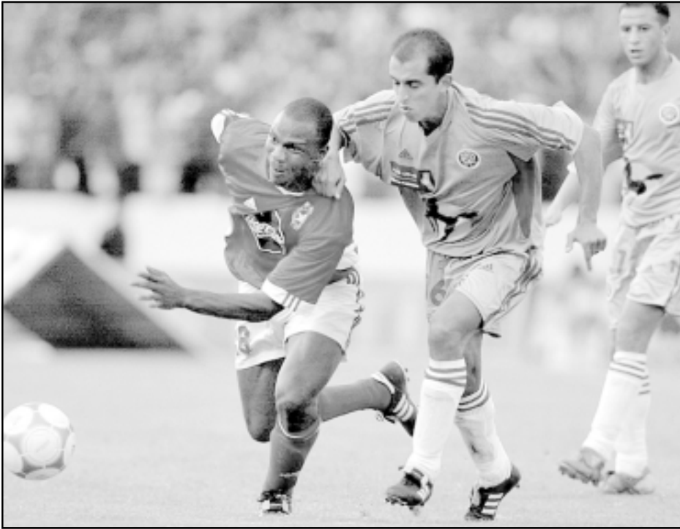
لقطة من احدى مباريات النجم الساحلي التونسي

■ نيقوسيا - أ ف ب: يبدو النجم الساحلي التونسي مرشحا فوق العادة لاحراز لقب بطال مسابقة كأس الاتحاد الافريقي لكرة القدم السبت عندما يستضيف الجيش الملكي المغربي حامل اللقب على الملعب الاولمبي في سوسة في اياب الدور النهائي.