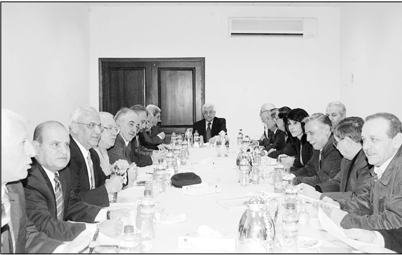
الرئيس الفلسطيني محمود عباس أثناء ترؤسه اجتماع اللجنة التنفيذية لمنظمة التحرير الفلسطينية

السياسية والتنظيمية المطلوبة، وفق ما ينص عليه القانون الأساسي للسلطة الوطنية. وأكدت اللجنة على أهمية تنفيذ هذه الخطوة قبل البدء بأي حوار حول الحكومة الجديدة في المستقبل. في ذلك فقد أكدت اللجنة التنفيذية على أهمية البدء بمشاورات جدية لتفعيل منظمة التحرير الفلسطينية، عقب انجاز الاتفاق على تشكيل حكومة جديدة، تحظى باقتناع وطني، حرصا على تكامل العمل بين مؤسسات السلطة ومؤسسات منظمة التحرير الفلسطينية. كما أكدت على أهمية بسوخ التهمة التي بدأت قبل اسبوع وضرورة قيام أجهزة الأمن الفلسطينية بواجبها لمنع أية خروقات حرصا على مصالح الشعب الفلسطيني. ومع استعادها التام «البدء» في مشاورات جادة مع الجانب الإسرائيلي، ولوقف أطراف اللجنة الرباعية، ومع الأشقاء العرب على أساس مبادرة السلام العربية، وخطه خارطة الطريق، وروية الرئيس بوش، وذلك بهدف إطلاق عملية سلام جادة، وخاصة بعد خطاب رئيس الوزراء الإسرائيلي، الذي احتوى على بعض العناصر الإيجابية، مع اعتراضها على عناصر أخرى وردت فيه».