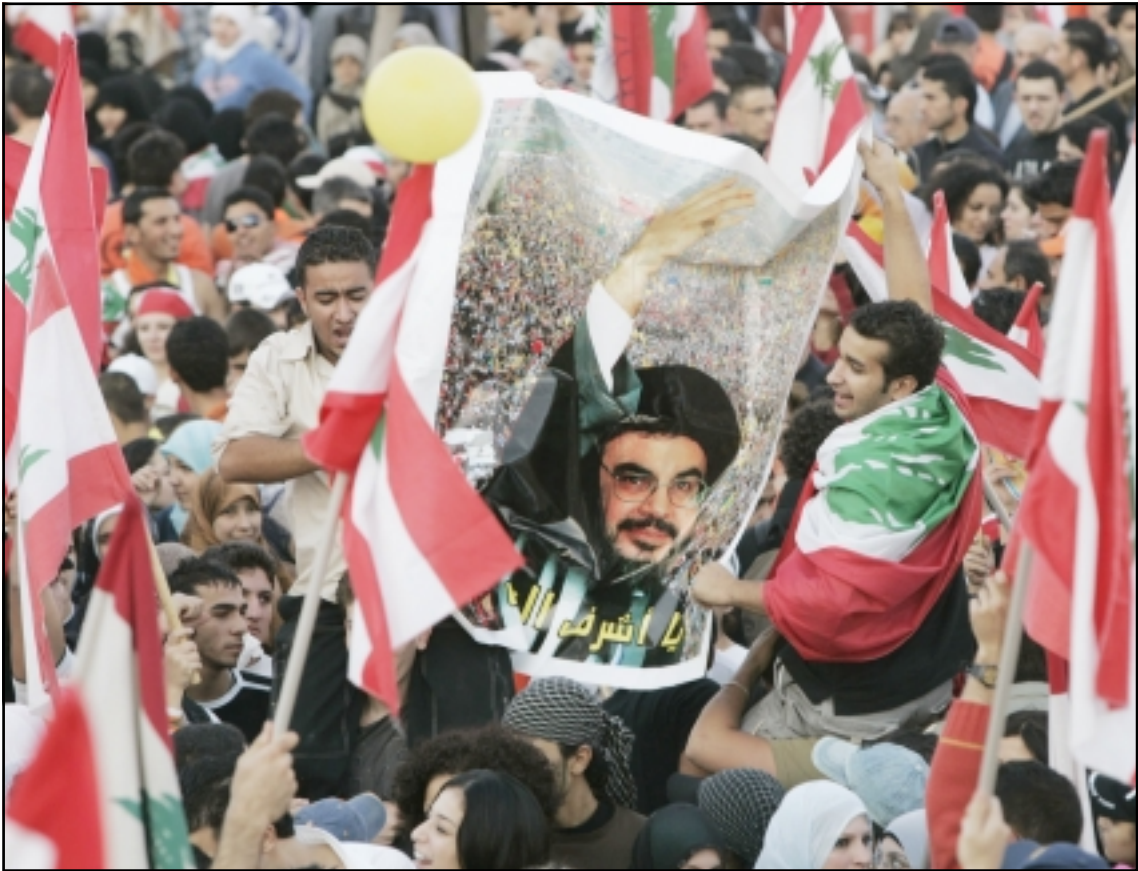
انصار حزب الله يرفعون صور زعيم الحزب حسن نصر الله واعلام الحزب والاعلام اللبنانية اثناء مشاركتهم بظاهرات الجمعة

من الجيش مدعومة بدبابات ومدعرات على مداخل وسط العاصمة وفي احياء عدة من بيروت، حيث تقوم بدوريات بشكل منتظم. في المقابل انطلق العشرات من انصار تيار المستقبل في مسيرات يتوافر ببروت تاييدا للحكومة. من جهته قال رئيس اللقاع الديمقراطي وليد جنبلاط إن فريق الرابع عشر من آذار سني او شيعي او مسيحي او درزي... وأصاف منتقدا تلك المحطات «يبب وعار عليكم». وخشي العديد من اللبنانيين من تحول هذه الاحتجاجات الضخمة الى اعمال عنف وصدامات دموية، خاصة مع تصاعد التوتر بين السنة والشيعية وكذلك بين المسيحيين الذين يؤيدون زعما متحالفين مع المعسكرين المتنافسين. (تفاصيل ص 6)