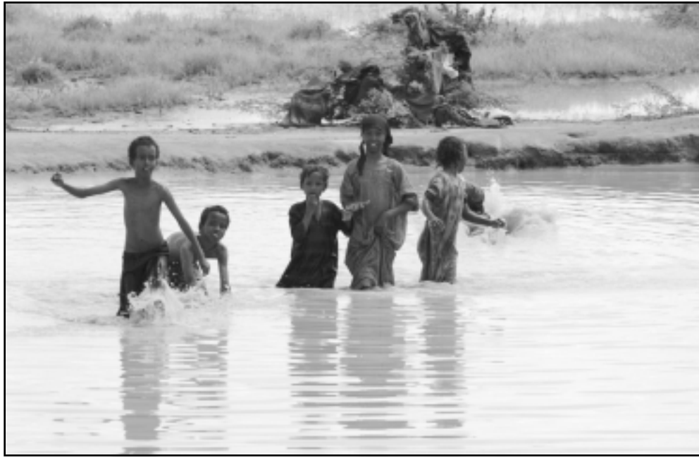
اطفال لاجئون من الصومال يلهون بمياه الفيضان في احد المخيمات على الحدود الكينية

السودان، وقال قول «اننا نحاول تقليل التوتر والجمع بين الجانبين لاستئناف الحوار... واذا حدث شيء مماثل (شن هجوم) فان هذه تصيح وسيلة لعلقة العملية». وقال سات بريندين الخبير في الشؤون الصومالية ان الانفجار من تنفيذ الرديكاليين اسلاميين فيما يبدو ربما من جناح الشباب التابع للحركة الاسلامية، وقال لرويترز «هذه مجرد درجة اخرى في التصعيد بين الجانبين». واضاف «اعتقد ان كل المؤشرات تشير الى ان الجانبين يستعدان لمواجهة وهي مسألة وقت فقط». ومن جهة اخرى يرى العديد من الدبلوماسيين الغربيين والاقليميين ان تدخل الولايات المتحدة للمرة الثالثة في الصومال قد يتسبب حربا مفرجة في مظلة القرن الافريقي. وقامت واشنطن التي تعرضت سياساتها في الصومال لانتكاسة كبيرة بدعمها لاراء الحرب الذين اطاح بهم الاسلاميون في وقت سابق هذا العام باعادة احياء خطة اعتها قبل عامين لارسال قوات حفظ سلام افريقية الى الصومال. لكن التجارب السابقة تثبت ان الجمع بين قوات حفظ السلام