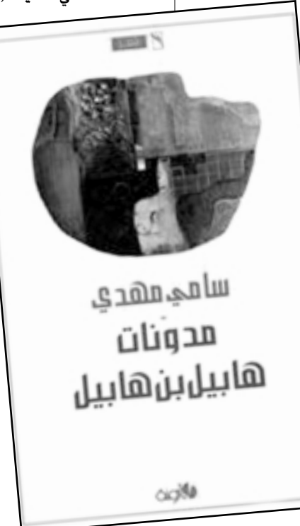
سامي مهدي مدونات هابيل بن هابيل

صدرت هابيل بن هابيل عن منشورات أزمنة في عمان نهاية عام 2006.