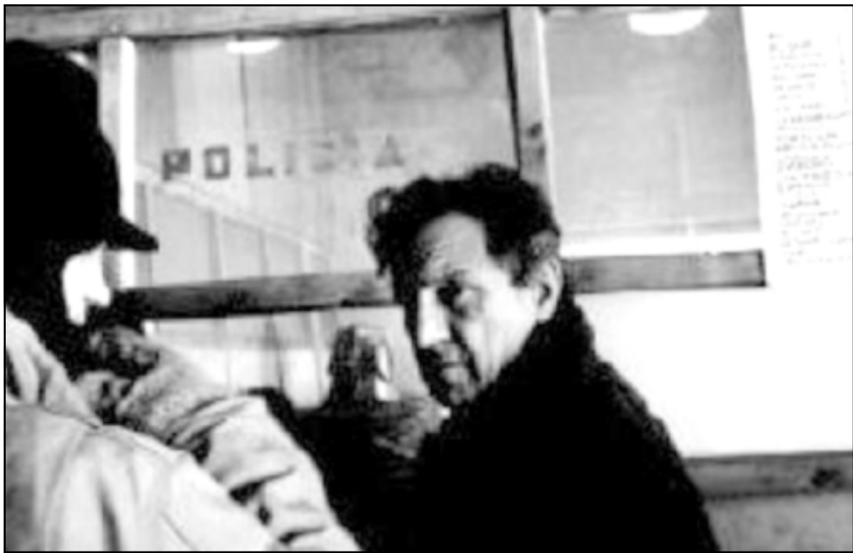
لقطة من فيلم «تحديقة عوليس»

يسرد فيلم «تحديقة عوليس»، أن، قصة مخرج سينمائي يوناني يعود إلى بلاده في ليلة مطر بعد أن قضى خمسا وثلاثين سنة في المنفى في الولايات المتحدة ليشهد في مدينته الأم العرض الافتتاحي لفيلمه الأخير. نحن لا نعلم شيئاً عن هذا الفيلم، لكننا نعلم أن دخول قصة فيلم في فيلم يأتي بمثابة الملاح أصعب استخدامه مروراً ببعض الشيء في السينما الطليعية والبدئية منذ سينما «الوجه الجديدة» فصاعداً، لكن ينبغي هنا أن نفضل لهذا الأمر أجسة سياقيته من حيث ارتباطه بالقيمة الأساس للفيلم التي تنفي فوراً تهمة اللجوء إلى «الكلاشيه» الطليعي. كما أننا، في سياق الفيلم الأكبر الذي نشاهد، نستطيع أن نحسد بضمون الفيلم الأصغر ذاك حتى ولو لم، ولن، نشاهده، وذلك عبر مشاهدة عشرات من العرايات البرعة، ومئات من رجال الشرطة ومكافحة الشغب مدججين بالسلاح والدروع العرض في شوارع المدينة التي يجري فيها عرض الفيلم الأصغر، ومن خلال معرفتنا -التي