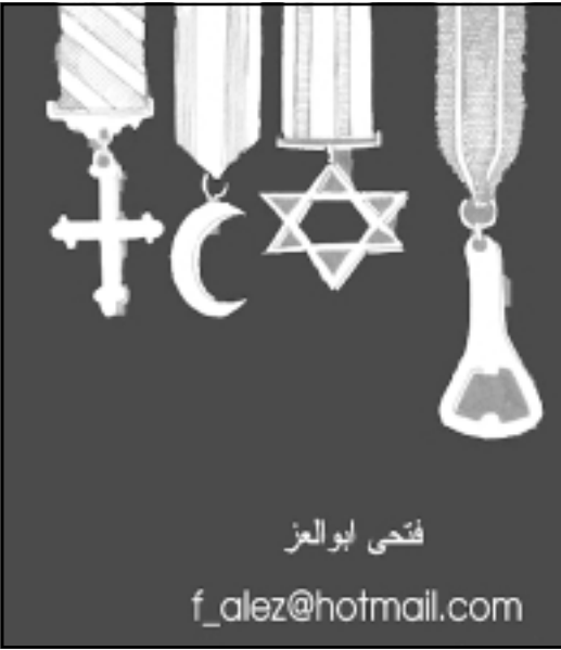
فتحي ابو الزمر