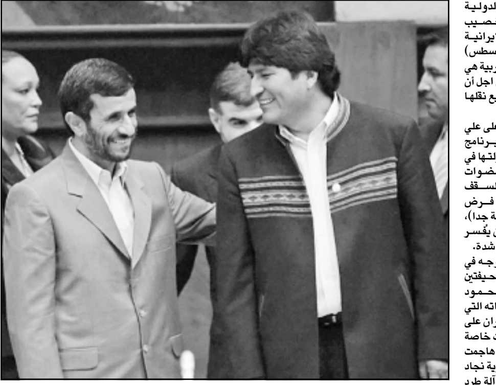
الرئيس الإيراني محمود احمدي نجاد يتحدث مع الرئيس البوليفي ايفو موراليس بعد انتهاء مراسم تنصيب الرئيس الاكادوري الجديد رفاثيل كوريرا، في المجلس الوطني في العاصمة كويتو

الحصول على تكنولوجيا ذرية. ان الجدل الذي يدور على صفحات الصحف والى أروقة السلطة هو في الطريقة في الاساس: كيف يمكن الحصول على قوة ذرية من غير اغضاب العالم كثيرا؟