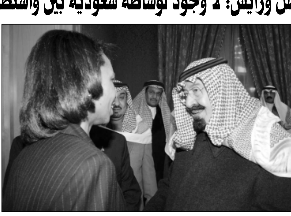
العاهل السعودي الملك عبدالله بن عبدالعزيز لدى استقباله وزيرة الخارجية الامريكية كونداليزا رايس

وقال مسؤولون في جهازه أعلنت وزارة الخارجية الفرنسية امس الثلاثاء ان فرسانا تفق في ارسال مسوحات خاص الى ايران للبحث في «السائل الالقيمية»، لا سيما في الوضع في لبنان واسرائيل. وجاء تصريح وزير الخارجية في تعليق على مقالة نشرته صحيفة «لوموند» امس الثلاثاء تقول فيه ان الرئيس جاك شيواك «ساور الانفتاح دبلوماسيا على ايران» وارسال مسوحات رفيع المستوى الى طهران مناقشة الوضع في لبنان».