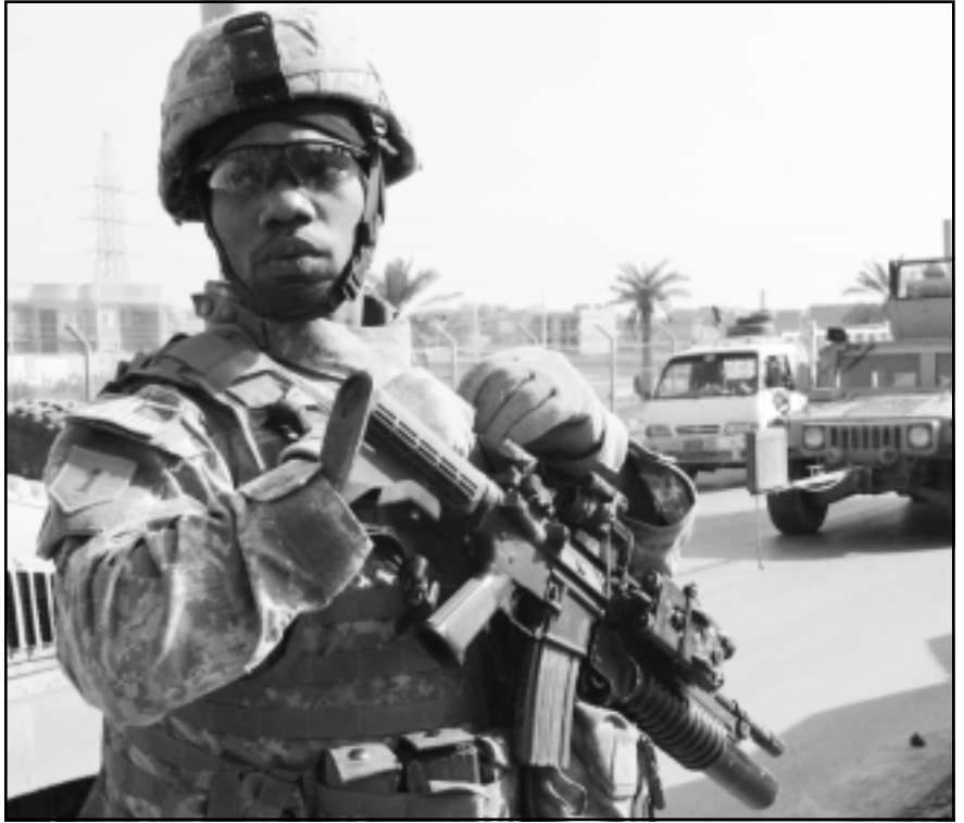
الامريكيون في العراق منذ 2003