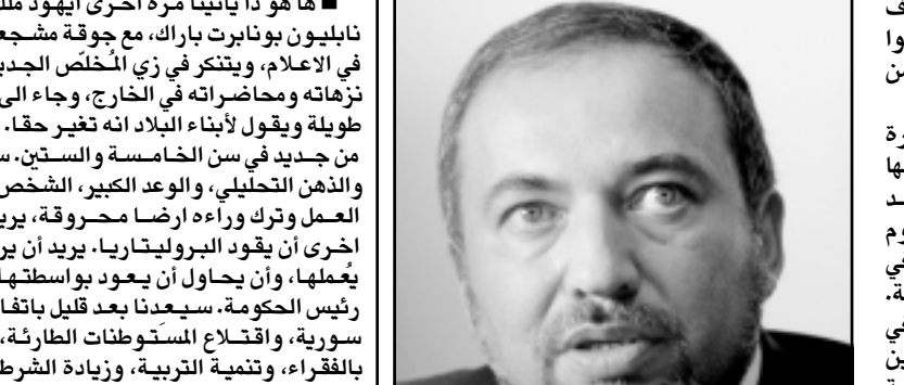
امير عشل وزير العلوم والثقافة والرياضة

■ يوجد الكثير ما يقال في الاعتراض على تعين غالب مجادلة وزيرا، وذلك في الاساس بسبب السخرية التي تنتج من ان الرجل الذي ثار منذ وقت قريب ثورة شديدة على دخول فيغدور ليرمان الحكومة - غدا متحمسا الآن الى ان يتولى عملا في الحكومة بجانب موضوع احتجائه الشديد، وفي الكرسي الذي خلا بعد ان استقال أوفير بينيس بسبب معارضته الجلس المشترك مع ليرمان، لكن عندما يزعمون ان ثقافة مجادلة - والثقافة فقط - تجعله مرفوقا للمنصب وزير العلوم والثقافة والرياضة، فان المطلوب ان تعرض عدة اسئلة.