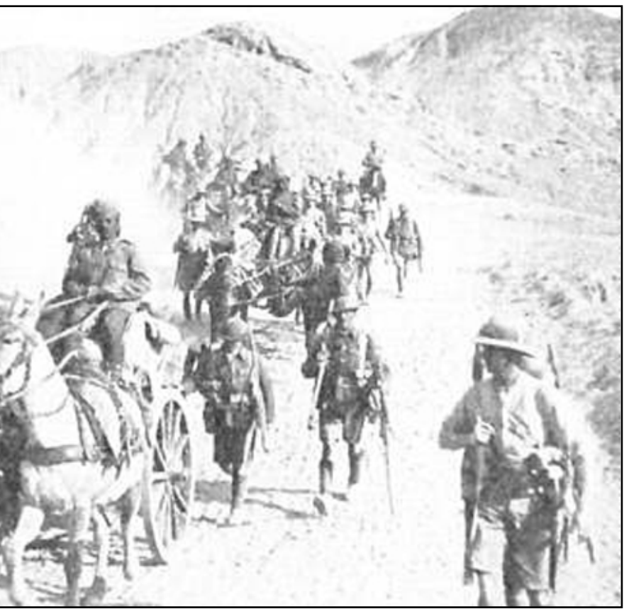
البريطانيون في العراق في العشرينيات من القرن الماضي

السياسة البريطانية وتتطوي عند قراءتها الآن على مغزى حديث، كتب يقول: «إن حكومتنا هي أسوأ من النظام التركي، فهو جند أربعة عشر ألفاً من الرجال الحليين جمعوا وقتلوا ما عدله سنويا مئتي عربي وذلك لحفظ السلام، أما نحن فقد خسرتنا تسعين ألف رجل مع طائرات وسيارات مصفحة وزوارق حربية وقطارات مدرعة، وقد قتلنا نحو عشرة آلاف عربي في هذه الثورة هذا الصيف، ولا يمكننا أن نأمل الحفاظ على هذا المعدل». لم تؤثر الإصابات العراقية بالانكيز فلم يتحركوا، ولكن حين أضاف لورنس كلمة عن التكاليف المالية التي يتحملها دافع الضرائب الانكيزي أصاب ذلك الهدف، أضاف لورنس في رسالته يقول: «إلى متى سنسمح بتضحية ملايين الباونادات، وآلاف الجنود من قواتنا، وعشرات الآلاف من العرب باسم حكومة استعمارية... وجاء الجواب سريعاً، فتمت قيادة ونستون