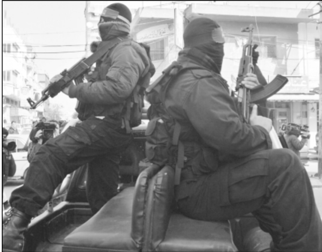
مسلمون من كتائب عز الدين القسام العسكري لحركة حماس يجولون في شوارع غزة أمس

النقطة الأساسية التي يجب أن يركز عليها كل الحديث... وأضاف «إذا تم الاتفاق على هذه القضية اعتقد أن القضايا الأخرى من الممكن التوافق عليها بدون شروط أو ضغوط خارجية». وحمل البرديول مسؤولية تأخر تشكيل حكومة الوحدة إلى ضغوط خارجية مورست على بعض الأطراف قائلًا «إن الفصائل الوطنية كادت أن تتفق على تشكيل حكومة الوحدة في بداية الحوارات، لكن الضغط الخارجي لمنع تشكيل الحكومة أفضل الحوارات»، مشددًا على أن زيارة كوندوليزا رايس وزيرة الخارجية الأمريكية جاءت هذه المرة للضغط لعدم تشكيل حكومة وطنية.