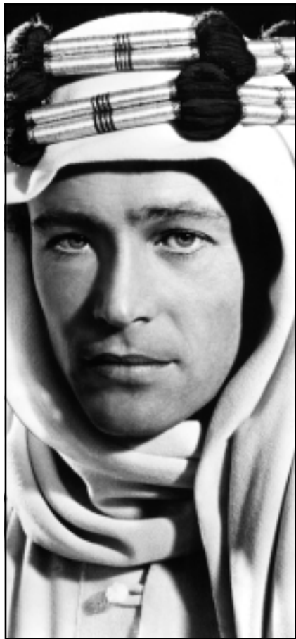
لورنس العرب كما ظهر في الغيلم الشهير عنه