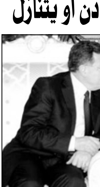
الشيخ خليفة بن زايد آل نهيان رئيس دولة الامارات مستقبلا امس فؤاد السنيرة رئيس الوزراء اللبناني

الحكمة في مكانها والحرص في مكانه ايضا وانه لن يهادن او يتنازل. وتناول رئيس الوزراء اللبناني الوضع الراهن على الساحة اللبنانية وسبل العمل من أجل عدم تفاقم الوضع وخروجه عن السيطرة مشيراً الى ان الحكومة اللبنانية الحالية تتمتع بشريعية دستورية وشعبية والتي تحاول تعزيز لبنان عن ثلاثين عاما من الضياع والحروب والدمار والخلافات غير الجدية إضافة الى الاجتياحات الاسرائيلية واحتلاله لجزر شعبا.