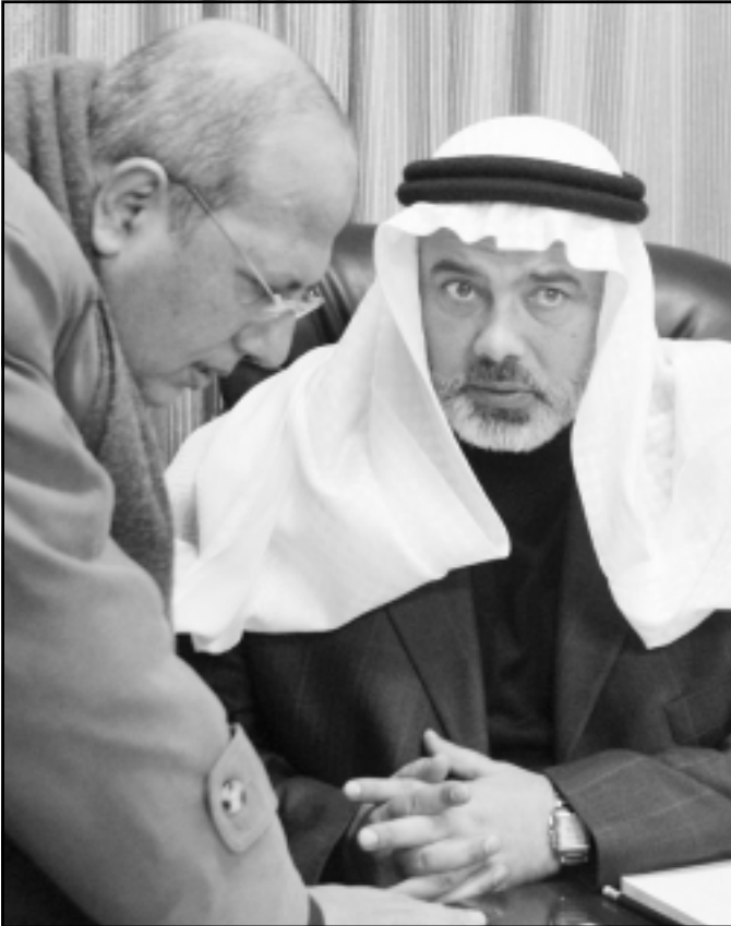
رئيس الوزراء الفلسطيني إسماعيل هنية ووزير الاتصالات جمال الخضرى