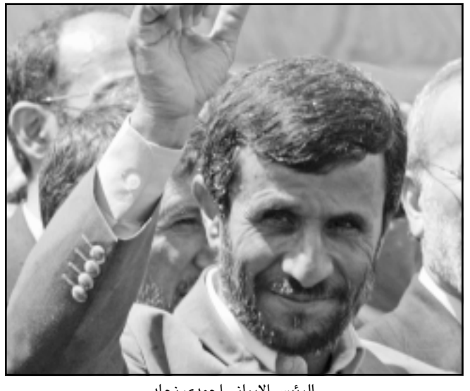
الرئيس الايراني احمدي نجاد

كما طلب النواب من الحكومة وضع «تقرير حول البطالة والتضخم والدين على المدى القصير والطويل والنمو الاقتصادي». وفي الأشهر الأخيرة، ارتفعت العديد من الأصوات منددة بالتضخم «الخارج عن إطار السيطرة» والبطالة المتزايدة وتراجع النمو. وإلى جانب الملف الاقتصادي، تعالت الأصوات في وسائل الإعلام والصحافة الثلاثاء لانتقاد توقيت جولة الرئيس أحمدى نجاد في أميركا اللاتينية. وقال النائب المحافظ محمد جهره ان «البرلمان سيطلب الرئيس لدى عودته بتبرير توقيت الجولة والبلدان التي شملتها وضرورة القيام بها في الوضع الراهن».