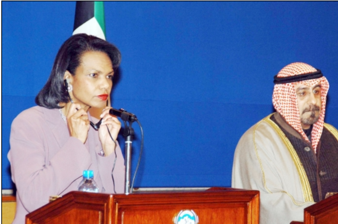
وزيرة الخارجية الامريكية كوندوليزا رايس أثناء مؤتمرها الصحفي مع وزير الخارجية الكويتي الشيخ محمد الصباح في الكويت امس

الامير سعود الفيصل على ان يفي بشروط تقرير حول قيام الرياض بسواطة في طهران وانشاء مكتب صدرت بعد ان سبق على ايرجاني رايس الى الرياض للقاء العمال السعوديين عملياً هناك وساطة في ما يبدو، وبدوورها استنكرت رايس فكرة الوساطة السعودية اصلاً، مشيرة الى انه لا توجد حاجة الى وساطة مع