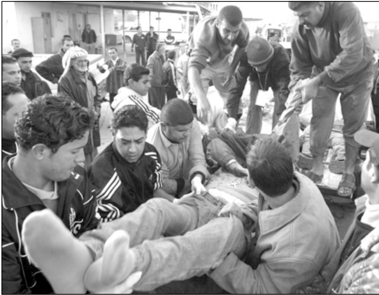
احد ضحايا الانفجارات التي استهدفت جامعة المستنصرية في بغداد امس (أ ف ب)

وفي الرياض، اشارت رايس الى انها اثارت مع محادثتها السعوديين امكانية تشكيل مجموعة دعم دولية للعراق شبيهة بالمؤتمر الدولي الذي بحث في