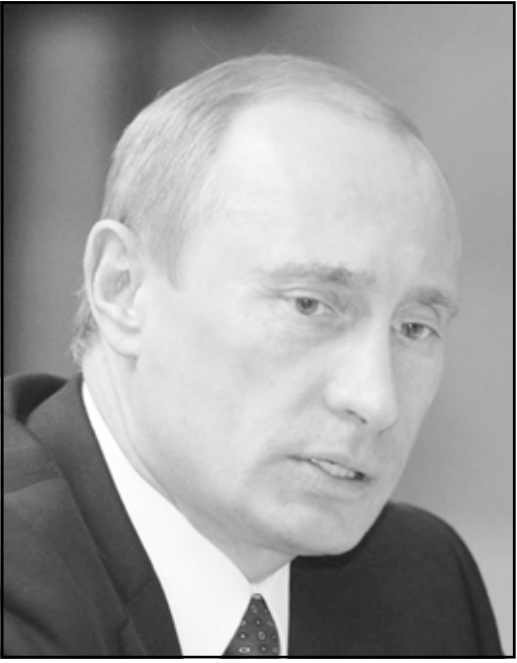
الرئيس الروسي فلاديمير بوتين

من الاسلحة النووية قادرة على محو الحياة المدنية عن الكرة الارضية. ومرة أخرى، ومثل المرات العديدة الاخرى السابقة، فان المعنى الحقيقي لهجوم بوتين صرخة جديدة للاحترام الدولي المفقود الذي يشتهي اليه الكرملين.