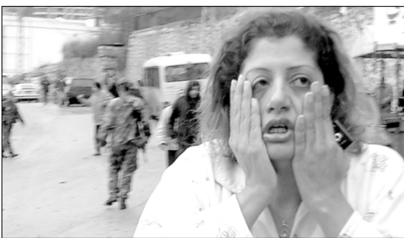
لبنانية في حالة صدمة بعد مشاهدتها التفجيرات في المتن الشمالي شرق بيروت امس