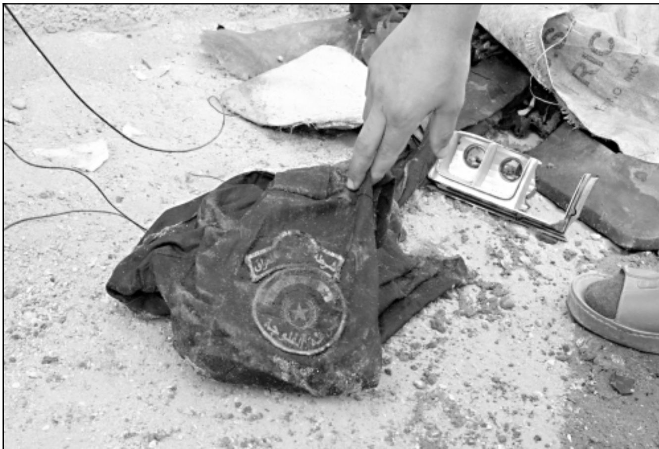
بغايا شيايب شرطي عراقي قتل بانجناجر استهدفت مركزا للشرطة في الفلوجة امس

واضاف الشهود: ان القوات الامريكية عززت من تواجدها بمنطقة العارمية، بشكل كبير، وسط تحريك الطائرات، دون انقطاع.