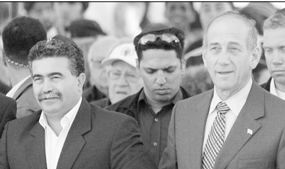
صورة من الارشيف تجتمع بين ايهود اولمرت وعمير بيرتس

■ منظومة العلاقات العكرة بين رئيس الوزراء ووزير الدفاع المتواصلة منذ أشهر تشير الفجور في اوساط الجمهور الذي يفقد ما تبقى لديه من ثقة بهذه الحكومة. ليس هناك شيء تقريبا يتم من قبل هذين الاثنین من خلال التنسيق والتفاهم، رئيس الوزراء يقلل من اشراك بيرتس في تحركاته السياسية، وهو قد عبر عن رايه هذا في دأثرته القريبة وقال ان بيرتس ليس ملائماً لمنصب وزير الدفاع، اما عمير بيرتس فيسعى الى ما يبدو للبرهان وليرتس ان مستقل في تحركاته وخطواته وعينه منصبه على الانتخابات التمهيدية القريبة في حزبه مبادراً الى سلسلة خطوات متخذة لحقق رئيس الوزراء. بهذه الطريقة كان اختياره لوزير عربي عن حزبه ونشره «لخطة السياسية» ويأبانه حول عزمه ازالة بعض البؤر الاستيطانية عما قريب.