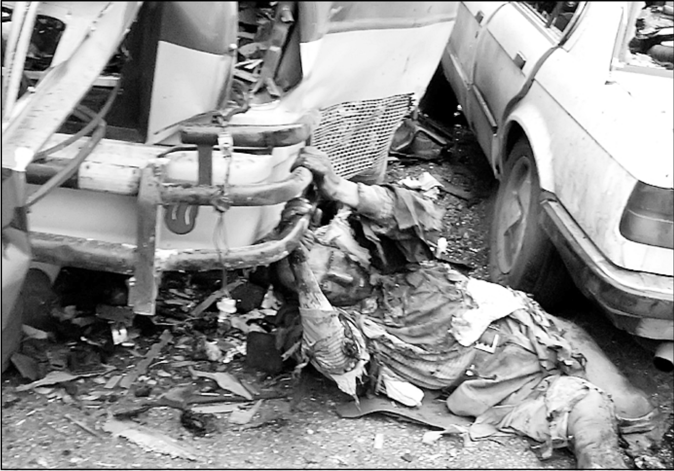
أحد المصابين جرحاً الانجليزيين ينظر رجال الاسعاف في قرية عين علق شمال بيروت امس