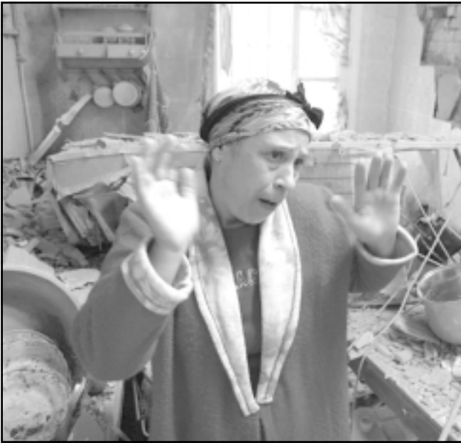
جزائرية تتحدث للصحافيين حول التفجيرات في منفعتها

اعلان معظم المجموعات الاخرى التوبة مستفيدة من ميثاق السلم والمصالحة الوطنية الذي عفا عنهم مقابل تسليم اسلحتهم. وقال شهود ان القنابل والسيارات المفخخة انفجرت في وقت واحد تقريبا لتذكر بالانفجارات التي استهدفت في نهاية تشرين الاول (اكتوبر) درغانة ورغاية بالقرب من العاصمة، واوقعت ثلاثة قتلى ونحو عشرين جرحيا. واعقب تلك الاعتداءات في بداية كانون الاول (ديسمبر) اعتداء استهدف سيارة تنقل موظفي شركة امريكية اسفر عن مقتل شخص على الاقل في