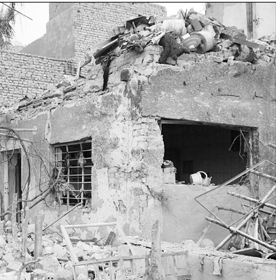
مزل دمره انفجار سيارة في بغداد امس

«نحن خرجنا باعتصامنا لايصال رسالة سلمية لكل العالم عموما وللمالكي خصوصا بالا يقدم امي قرار يسهم في تقسيم العراق وتفكيكه الا هو المصادقة على ترحيل العرب» من كركوك. و اضاف «طالب باعتصامنا هذا كل الساسة العراقيين بالتوحد ونبذ الطائفية والوقوف معنا لدعم عراقية كركوك». وقال «اننا عراقيون وكل عراقي له الحق في القامة في اي مدينة في بلده»، وتابع «على المالكي الا يصالح خطا صدام بخطا اكبر» في اشارة الى قرار اخذته العام 1986 مجلس قيادة الثورة العراقية، اهم سلطة في النظام السابق، بنقل عشائر من العرب الشيعية في الفرات الاوسط والجنوب الى كركوك ضمن سياسات الترحيل التي كان ينتهجها بغية تغيير تركيبتها