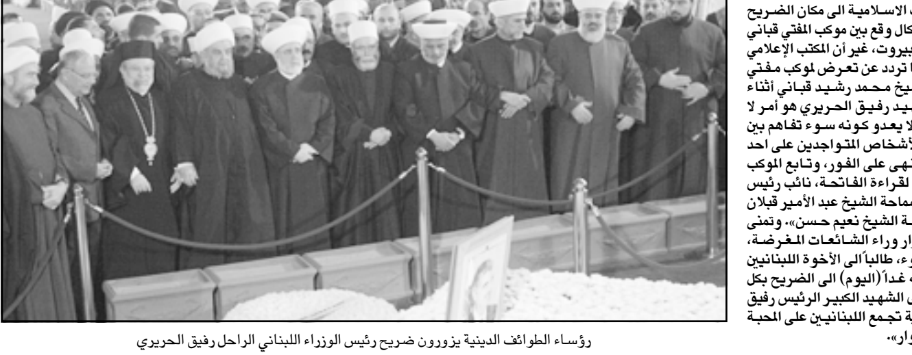
رؤساء الطوائف الدينية يزورون ضريح رئيس الوزراء اللبناني الراحل رفيق الحريري