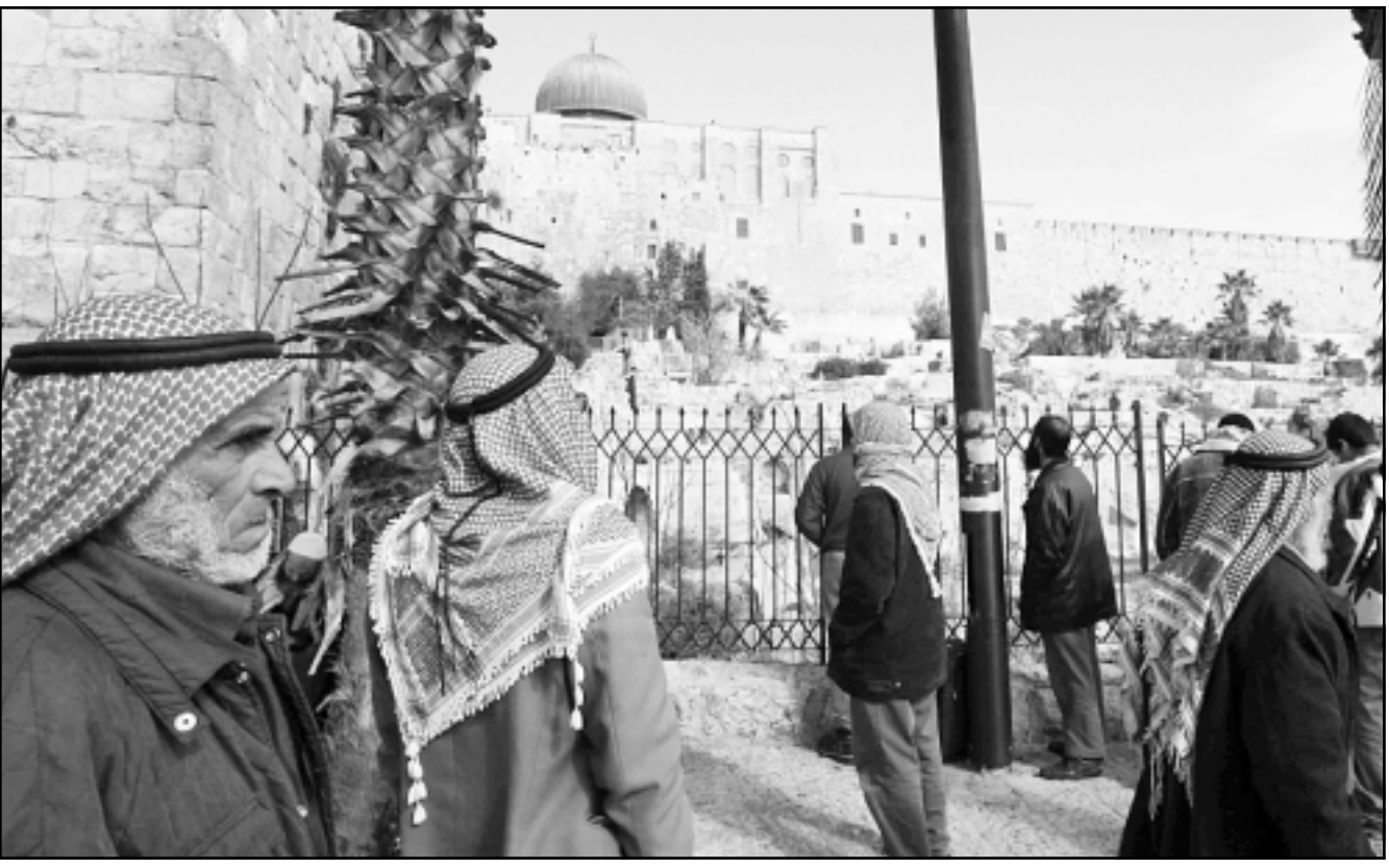
فلسطينيون يحتجون في القدس على منعهم من الوصول الى مسجد الاقصى

لا اعتراف، هي معروفة بدرجة كافية كاحدى اعاجيب العالم لجرد وجودها حيث حاولت سبع دول عربية القضاء عليها بالقوة، وبما حققته خلال 59 عاماً من وجودها اسرائيل هي حقيقة سياسية وجغرافية، يسير اسمها امامنا، هي ليست بحاجة للاعتراف وانما الفلسطينيين هم الذين يحتاجون اعترافاً - عندما يتصرفون امرهم ويتبنون قرار الامم المتحدة الذي صدر قبل 60 عاماً لاقامة دولتهم الخاصة اخيراً.