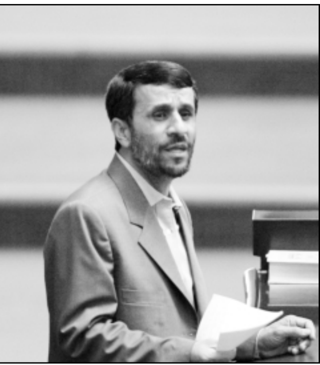
الرئيس الإيراني يلقي كلمة في طهران أمس

الرياض - واشنطن - الرياض - أف ب - يوي أي: أعلنت منظمة المخابرات الأمريكية في بيانها الصادر في 13 كانون الأول (ديسمبر) 2003، أن إيران تمتلك أسلحة نووية كافية لإنتاج أسلحة نووية، وهو ما رفضه المسؤولون الإيرانيون قاطعاً حتى الآن. ومن جهتها أعلنت الولايات المتحدة الاثنين أن قرار الوكالة الدولية للطاقة الذرية خفض مساعدتها الفنية لإيران يتجاوب مع ضرورة اعتماد اجراءات مستندة حيال إيران لاحتواء طموحاتها النووية. وقال السفير الأمريكي لدى وكالة الطاقة الذرية لوكالة فرانس برس الاثنين أن قرار الوكالة تعليق نصف مساعداتها الفنية للبرنامج النووي الإيراني يتجاوب مع قرار مجلس الأمن الدولي بغرض عقوبات على إيران. وقال غريغوري شولت من تحليلنا الأولي هو أن مقاربة الوكالة الدولية للطاقة الذرية تستجيب لمضمون قرار مجلس الأمن رقم 1737، الصادر في 23 كانون الأول (ديسمبر). وأضاف «إننا ندرس تقرير الوكالة بعناية». وهذا أول رد فعل أمريكي يصدر منذ إعلان وكالة الطاقة الذرية تجميد حوالي نصف برامج المساعدة لإيران تجاوب مع العقوبات الدولية المفروضة عليها. وكانت الولايات المتحدة تطالب بعقوبات أشد.