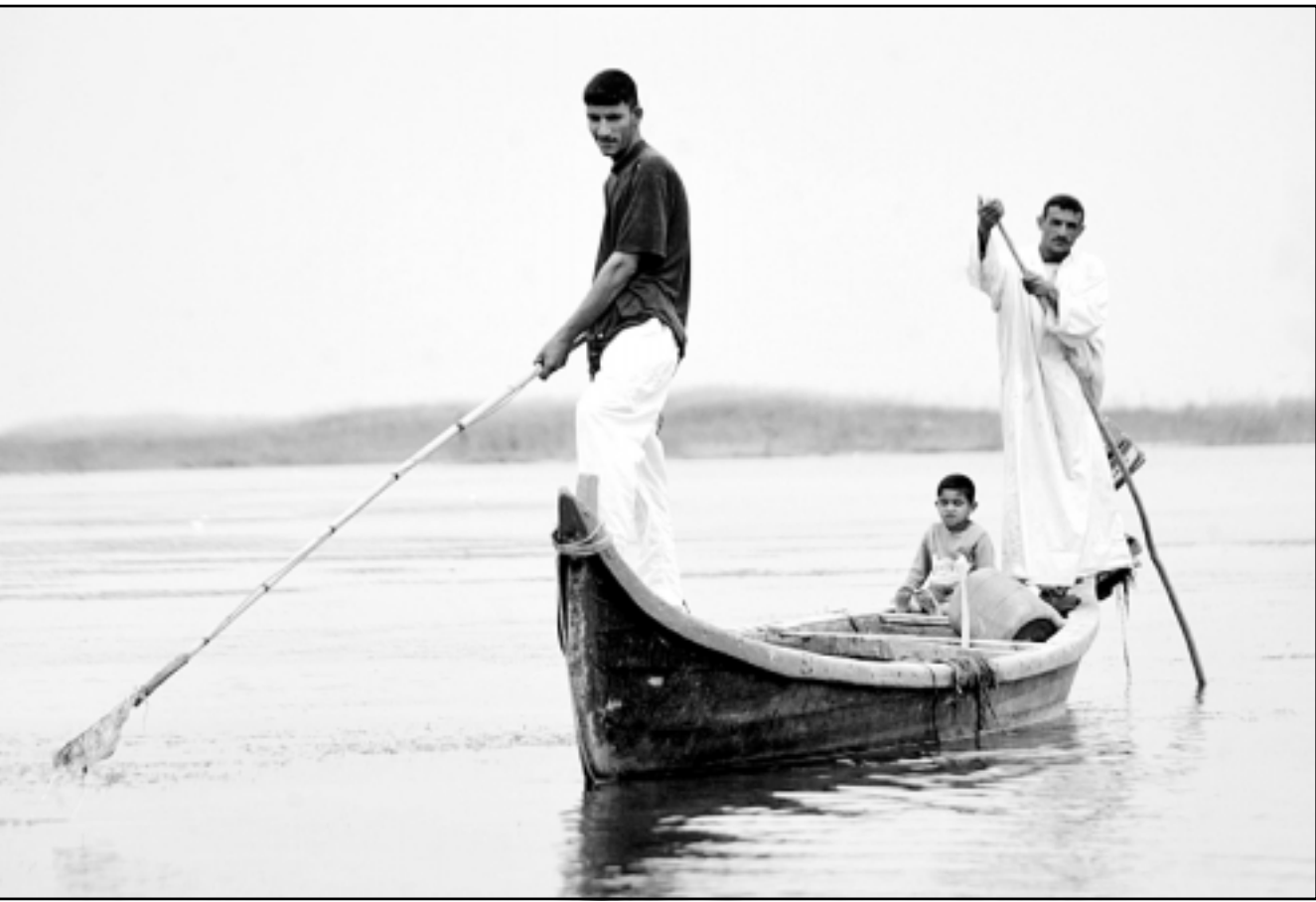
عراقيان وطفل احدهما في قارب تقليدي في الاهوار

لكنه تدارك «لا يعتبر إعادة 60 في المئة من المسطحات المائية الى سابق عهدها امرا فعليا». وقال علوش الذي يترأس جمعية «تأثير ايرك» غير الحكومية لوكالة فرانس برس في اتصال هاتفي من عمان «بإمكاننا القول ان نحو 45 في المئة فقط من الاهوار اظهرت علامات استرداد العافية بالكامل». واوضح ان فريقه من الخبراء استنتج ان العامل الرئيسي الذي يمنع التعافي الكلي هو «السدود القائمة عكس اتجاه التيار». وقال علوش «قبل انشاء السدود، اعتاد العراق الحصول على نحو مئة مليار متر مكعب من المياه سنويا، يشكل ذوبان الثلوج 60 في المئة منها». واضاف «يأتي الماء الى الارض المستوية في جنوب العراق فيجمرها، ما يؤدي الى تشكل الاهوار». وتابع ان «الاهوار تحتاج الى هذه الدفعة من المياه خلال الربيع، بعد ان ينهي القصب مسباته الشتوي، ويبدأ السمك بوضع البيض، وتشرع الطيور في الهجرة». ويريد علوش تركيب نظام يتولى «فعل الطوفان الميكانيكي، لتعويض الاندفاع المعتاد للمياه المنحدرة من الجبال. لكن المهمة غير مشجعة بسبب خطورة العمل في المناطق الخارجة عن القانون ونقص الموارد». واكد ان «الاهوار مستوطنة في طائر قصب المسمى الدخلة والطنان العراقي والهيوكوليبوس». واضاف «واجبه طائر الدخلة خطر الانقراض، لكن المسح اظهر كميات كبيرة منه، لم تكن نظن انه موجود بهذا القدر». ورغم ذلك، فإن مبدى استعادة الاهوار تعتبر متفردة.