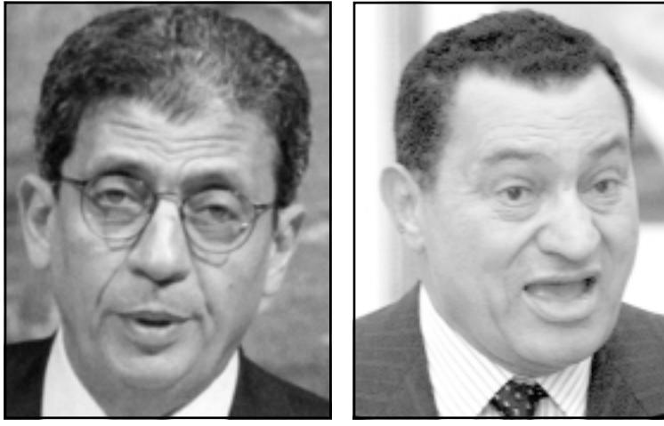
الرئيس حسني مبارك

اللبثاني ساهمت بدورها في تغيير جزء بسبير من استراتيجيتها بمدفق تجاه ملف حزب الله، لكن الرئيس بشار براي السعوديين يتبع خطا طبيعية الموقف السعودي المتشنج ليس من الدول العربية ووضع الميلاز السورية فقط في السلة الإيرانية.