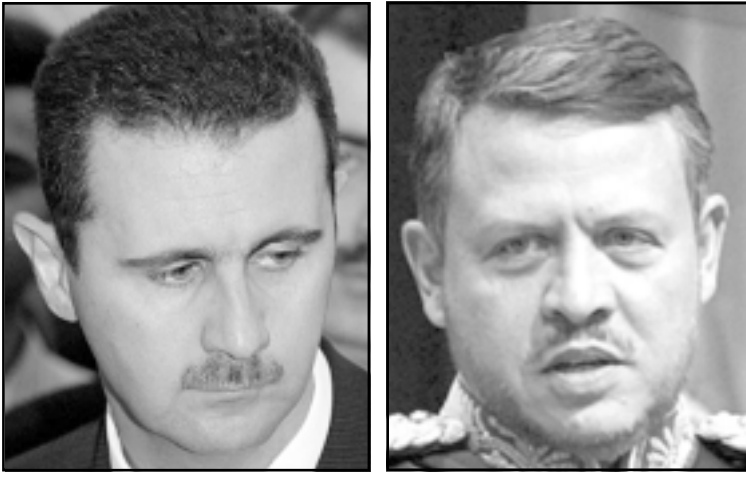
الملك عبدالله الثاني

في رأيي نذي يده أقول لكم ولدكم يسير على دركهم ويتنقح فيركهم- ارفعوا ايديكم عن الأزهر الشريف وشيخه وعلماؤه، وقلوا لاقاكم الماجرة والجمعة المسلمومة عن الرجعية الدينية لاجتمع المسلمين في أنحاء العالم، فمن