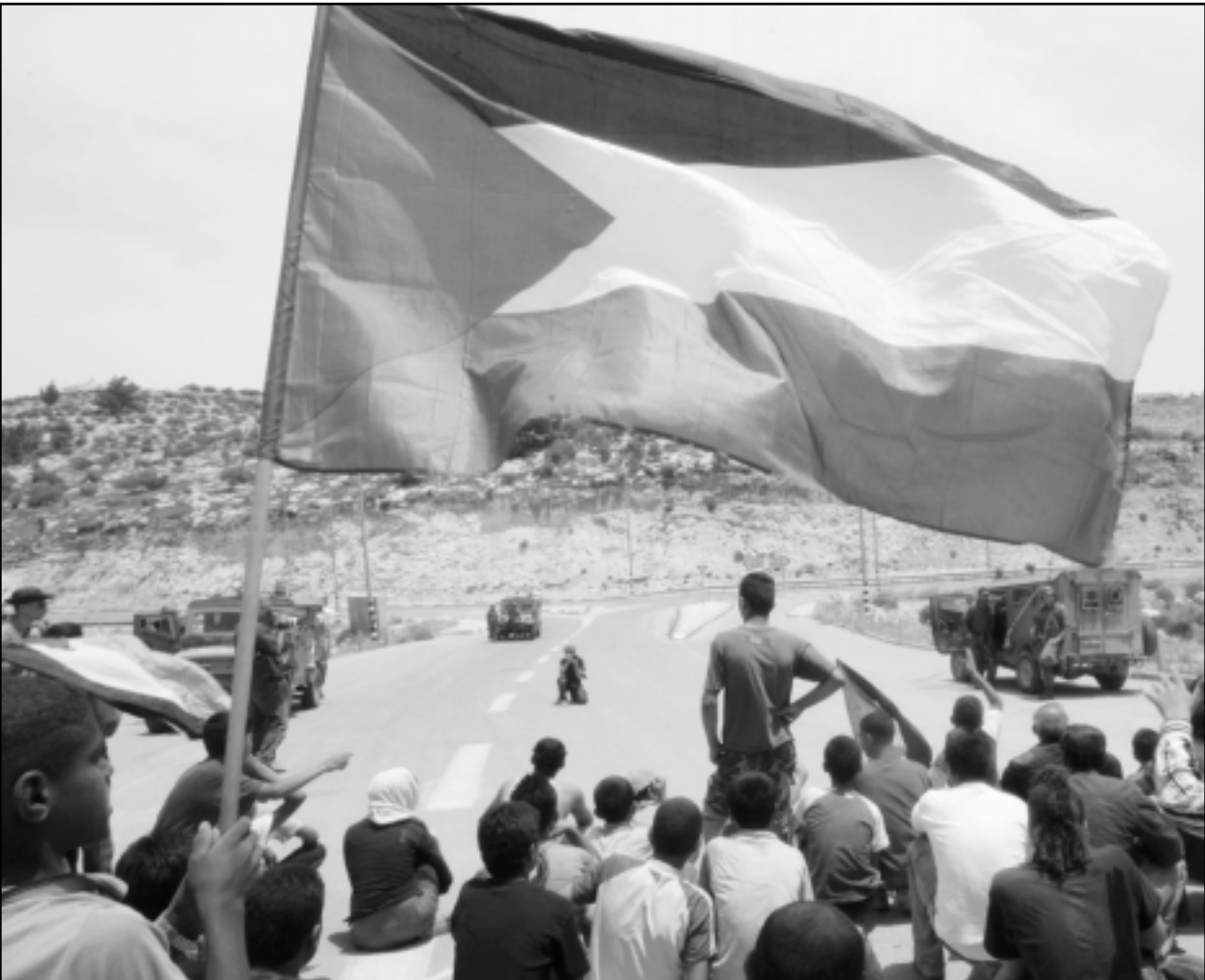
فلسطينيون يتظاهرون ضد اغلاق شارع رئيسي في مدينة الخليل