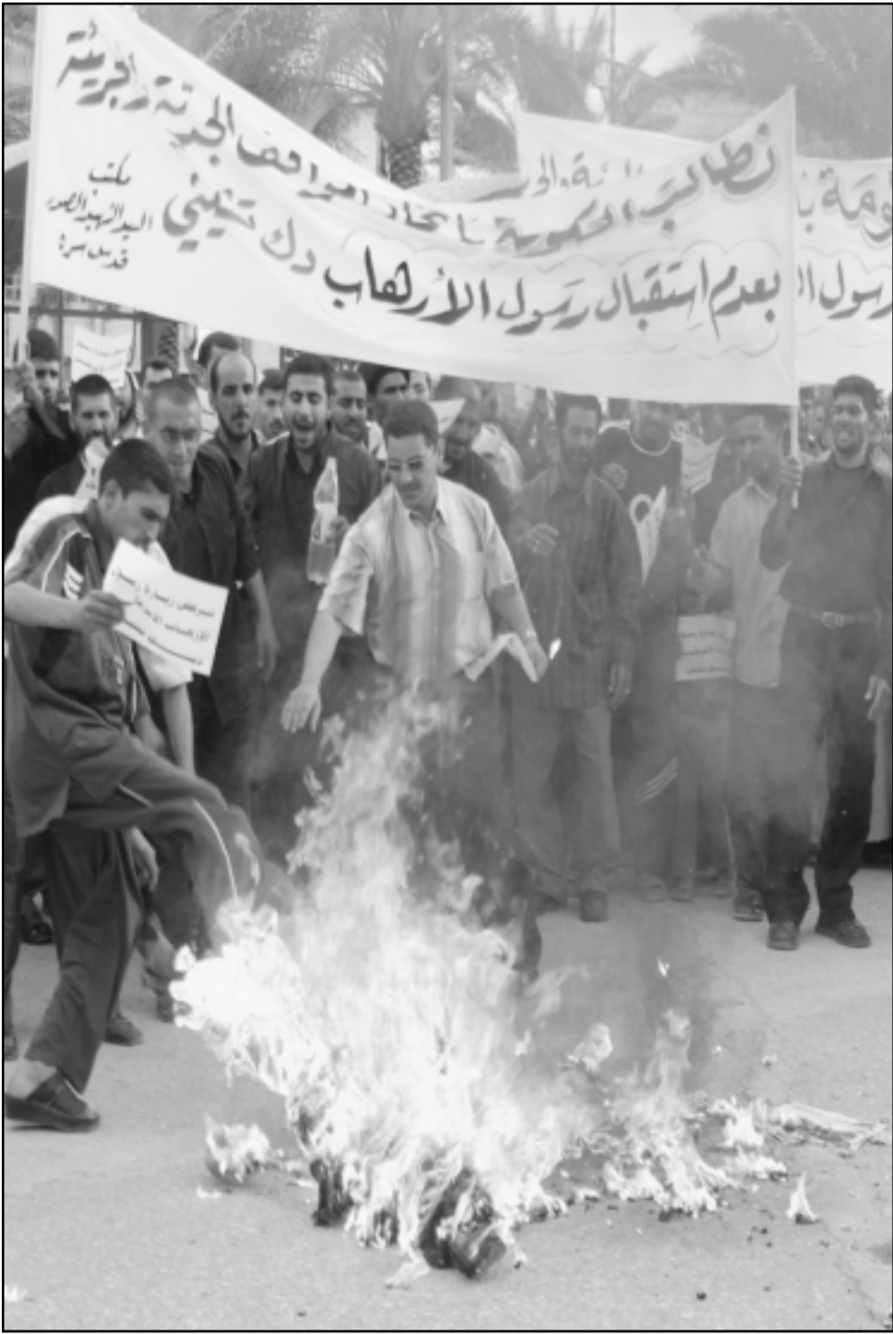
عراقيون يحرقون العلم الامريكى اثناء مظاهرة احتجاج على زيارة تشيبي في كربلاء امس

وكشفت الصحفية ان احد العميلين هو البرندي ويعدى الدكتور راين بيتر. ونقلت الصحفية عن التحقيقات ان