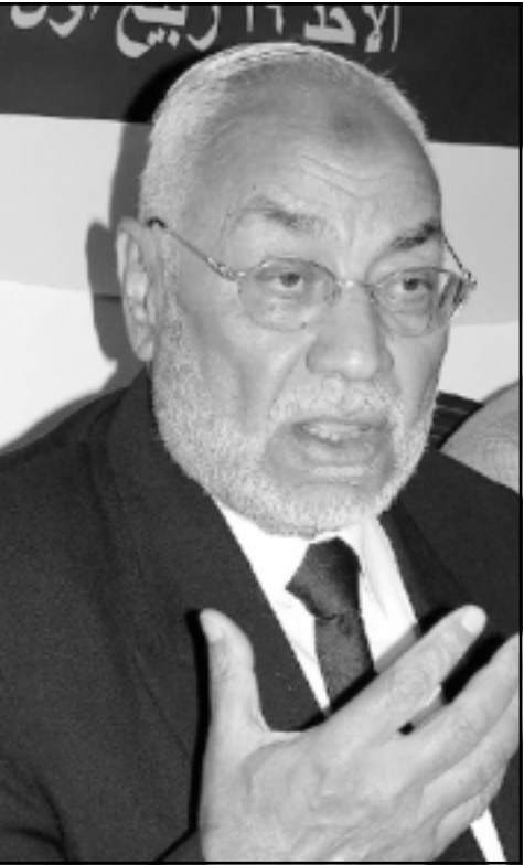
محمد مهدي عاكف مرشد الجماعة

واجهها الوطني في انتخابات مجلس الشعب حيث واجه خسائر مادية ضد عاصته الذين تخلى عنهم فقاعوا بالترشح كمتسقين وتمكنوا من الفوز. ويتفق رموز الوطني في أن المنافسة لن تكون متشعبة وذلك بسبب نجاح قوى الأمن في محاصرة الإخوان وتوجيه العدوى من الضربات اليهم خلال المرحلة الماضية، وبالرغم من اقتراب موعد الانتخابات إلا أن الجماعة لم تقم حتى الآن بالكشف عن أسماء مرشحيها وذلك خشية أن تقوم الحكومة باعتقالهم. وأكد محمد مهدي عاكف مرشد الجماعة في تصريحات لـ«القدس العربي» أن الإخوان يواجهون ظروفًا أكثر قسوة خلال المرحلة الراهنة.