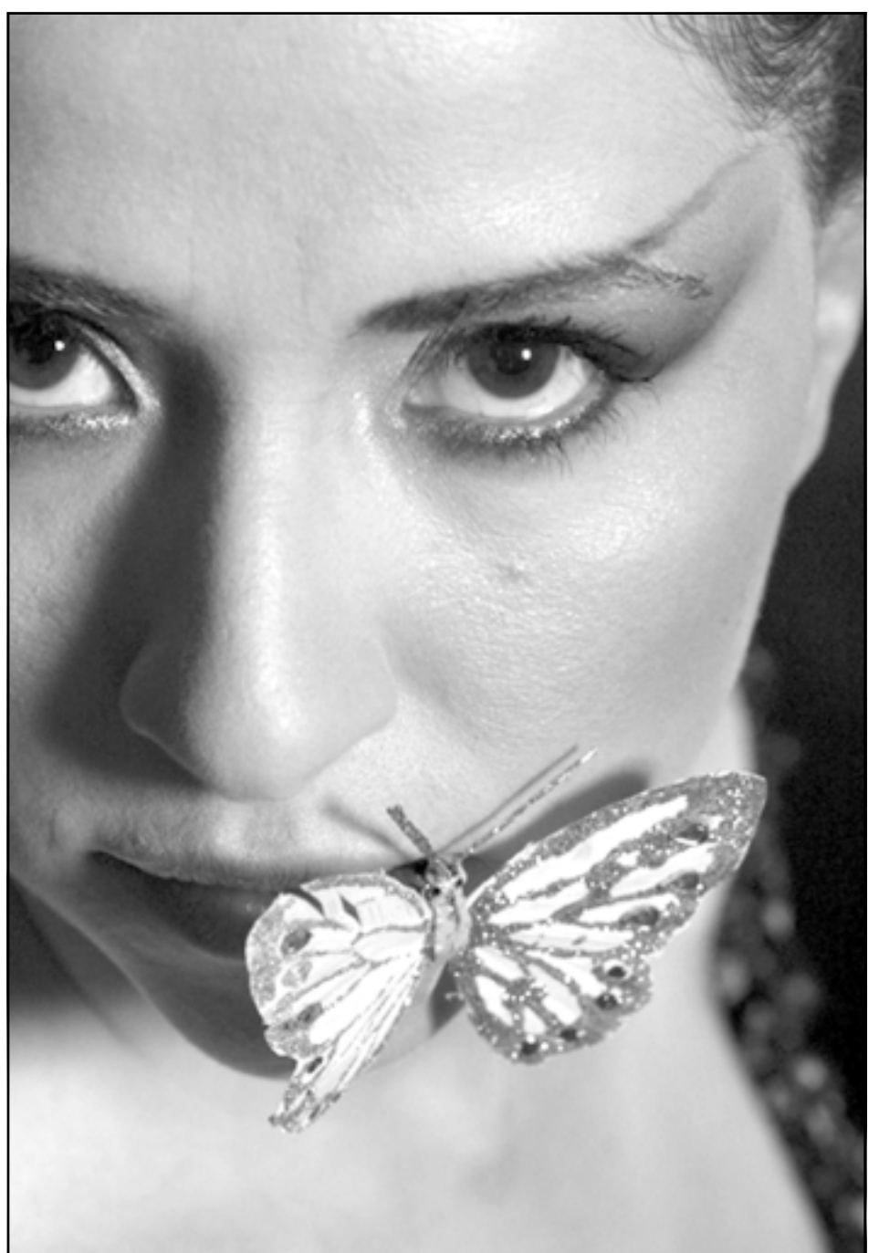
عنات حديد (القدس العربي)