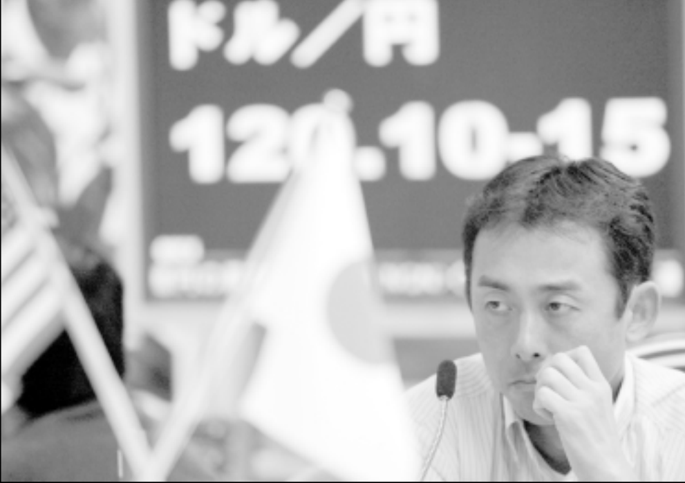
متعامل في سوق العملات في طوكيو امس حيث استقر سعر العملة الامريكية مقابل اليابانية حول 120 ينا للدولار

وجاء قرار لجنة السوق المفتوحة الاقتصادية صانعة القرار في البنك المركزي الامريكي الذي كان يتوقعه التحليليون ليقيس سعر فائدة الاموال الاتحادية لمدة ليلة عند المستوى الذي سجله في حزيران (يونيو) 2006 بعد زيادة متسالية كل منها ربع نقطة مئوية. وفي بيان تشرح فيه قرارها اشارت اللجنة التي تتباوئ النمو الاقتصادي لكنها تمسكت برأيها الذي يذهب الى ان الاقتصاد على الارجح سيستمر بطئ معتدلة في الازعاج المقبلة، واضاف البيان «التضخم الاساسي مازال الى حد ما قويا»، وتابع «الشغل المهيمن للجنة مازال هو احتمال ان يتخسر التضخم مثلما هو متوقع». من ناحيته، ابقى البنك المركزي الاوروبي اسعار الفائدة دون تغيير امس الخميس مقلما كان متوقعا وذلك قبل زيادة مرجحة في الشهر المقبل.