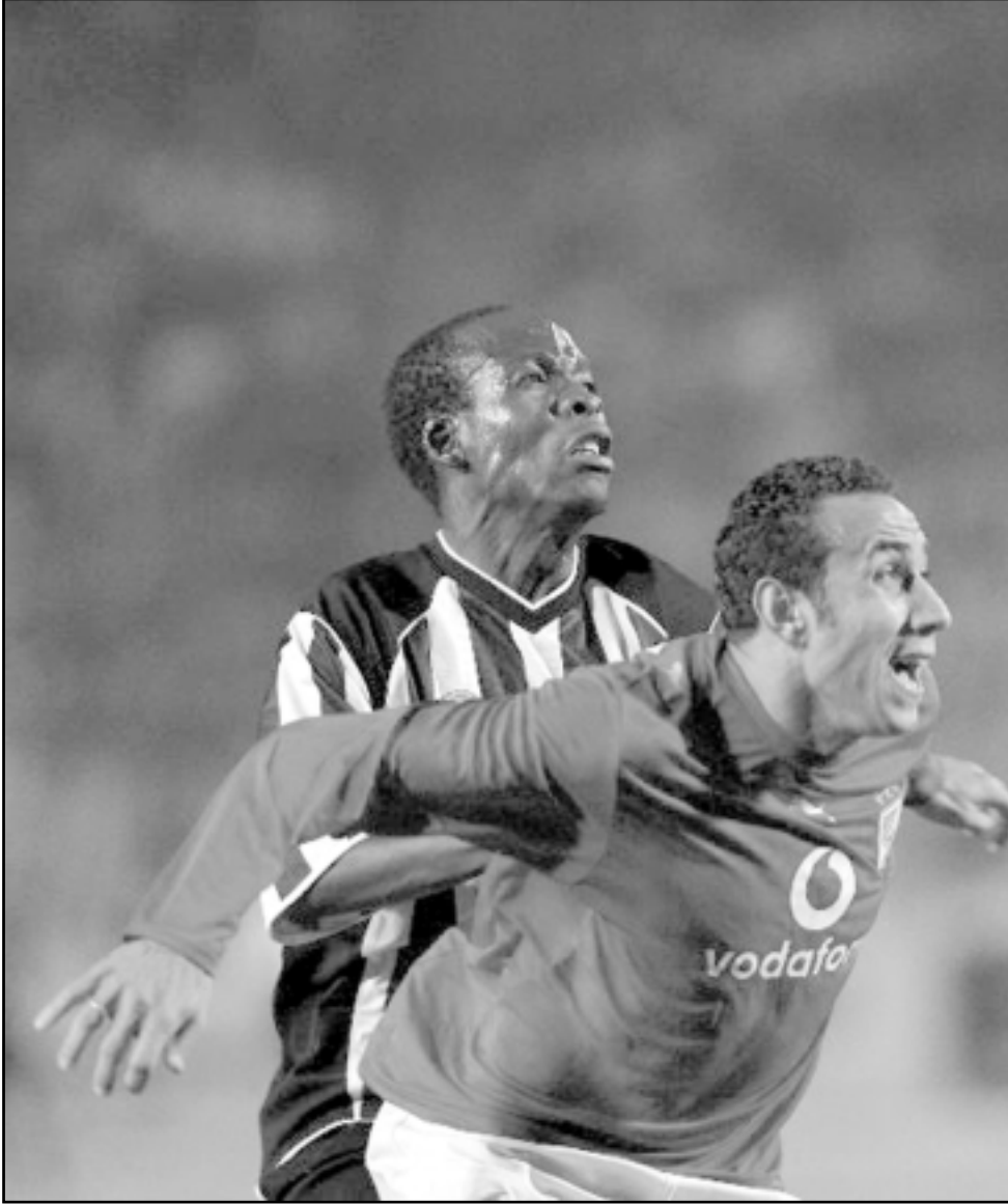
الأهلي في إحدى مبارياته

ويعد أن هدات الأمور قليلا داخل الملاعب عقب الإقصاء من دوري أبطال العرب، بدأ الجهاز الفني يتطلع إلى اقتناص بطولة الكأس لتكون أقل تعويضا للجماهير بعد الخروج المخيب للأمال من بطولتي دوري أبطال أفريقيا