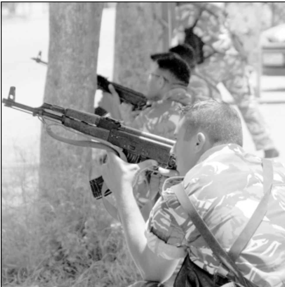
الجيش اللبناني في حالة تاهب على مداخل نهر البارد