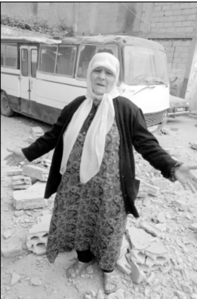
وسيدة فلسطينية تغف بجوار حطام منزلها