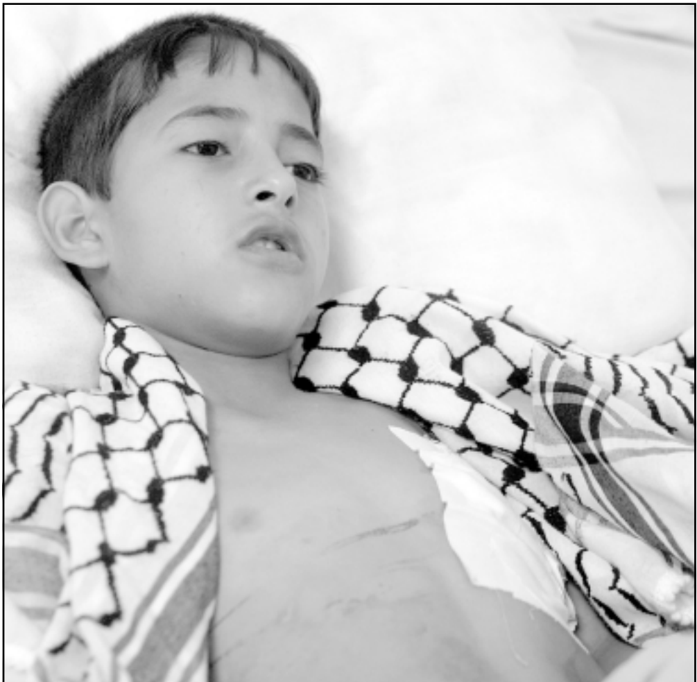
وظفل فلسطيني من مخيم نهر البارد يردد في أحد المستشفيات للعلاج عقب إصابته في الاشتباكات