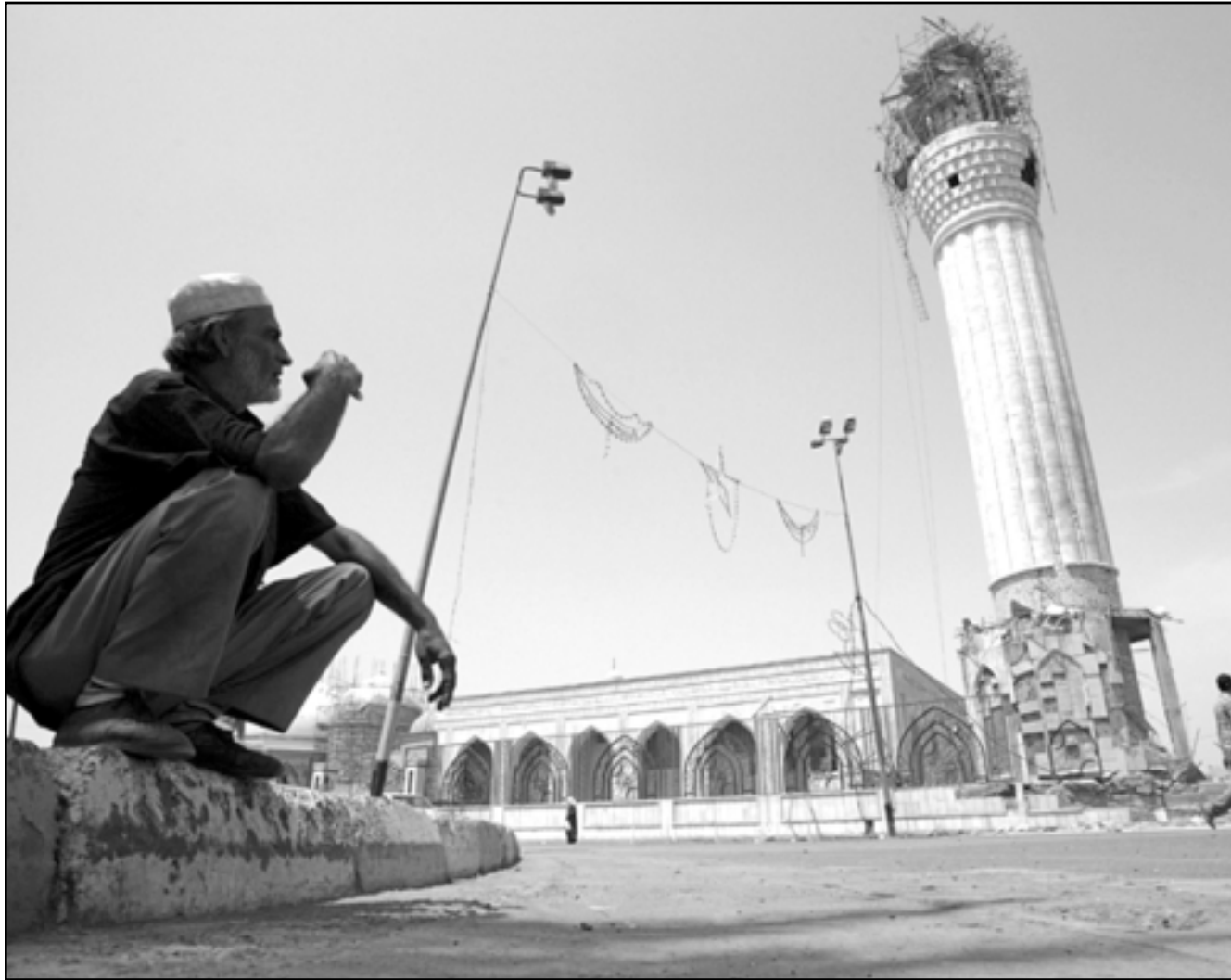
عراقي ينظر الى مسجد عبد القادر الكيلاني الذي تعرض لهجوم امس الاول