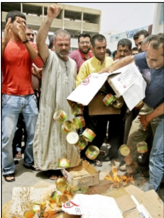
بيروت - «القدس العربي»