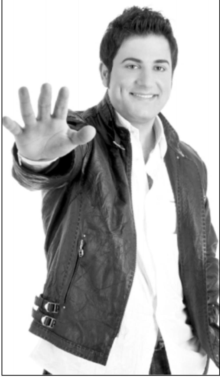
ملحم زين (القدس العربي)

اجتهد في إبعاد آثار الشهرة عن نفسي. اتعامل مع الحياة بشكل طبيعي جداً. وأعيش حياتي كشباب عادي. ما زال موضوع الخلافات يتردد في أذهانكم؟ هذا ما يبدو. ولا حق له بكل ما صدر منه.