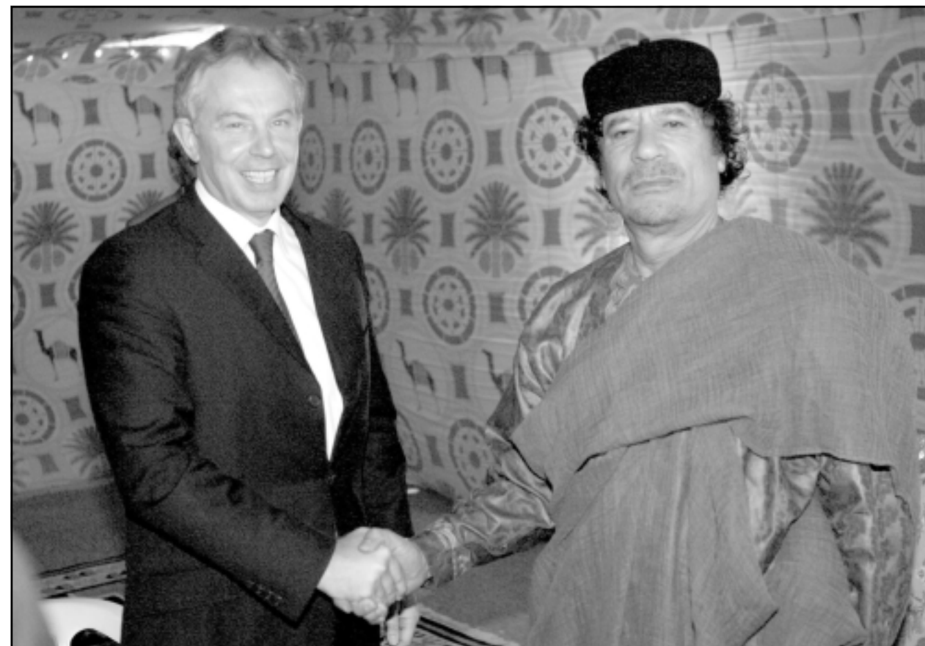
القذافي مستقبلا توني بلير في ليبيا امس

وجاء ذلك في كلمة لجابر في هامش جلسة مباحثات للتعاون المشترك بين «الشعب المسلح» (القوات المسلحة الليبية) والجيش الوطني الجزائري بحضور رئيس اركان الفريق احمد قايد صالح. واعتبر جابر ان الجيش الجزائري تمكن من حماية الجزائر والحفاظ على وحدتها وعلى مسيرة الثورة الجزائرية. ولفت الى ان هذه المؤسسة استطاعت ان تنتصر ولم تعط