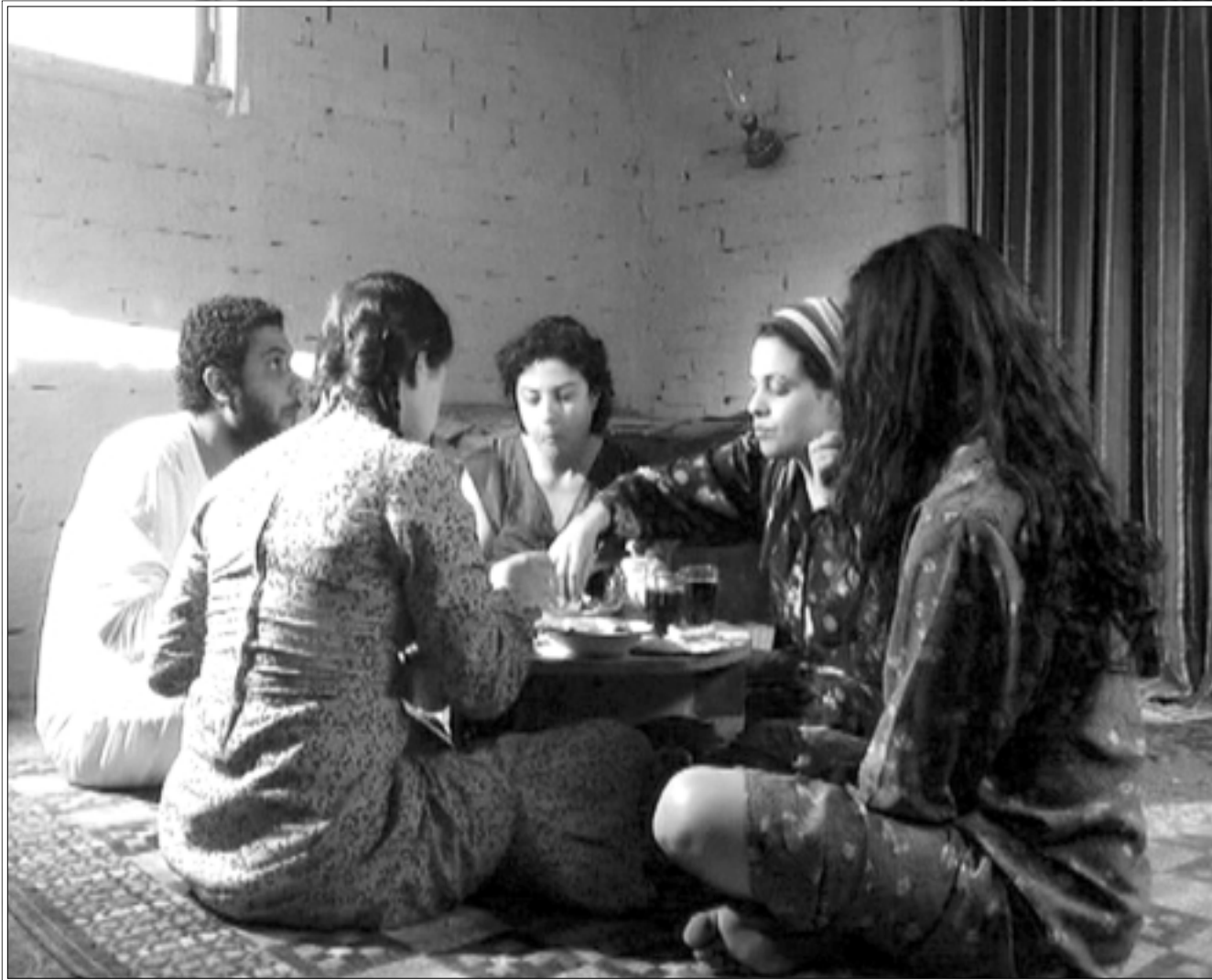
من فيلم «بيت من لحم»

تقوم هذه القصة بمجملها على ثنائية الصمت المطبق والتواطؤ السري، وربما يشغل الصمت مفردة مهممة على سياق القصة بمجملها، أو الفيلم برمته. فقرأ «البيت من لحم» في مسهل القصة «الأرملة وبناها الثلاث، وبنايت حجرة، والبدائية صمت»، وحينما تتطور القصة درامياً نشعر بالتواطؤ عبر لوماستنا