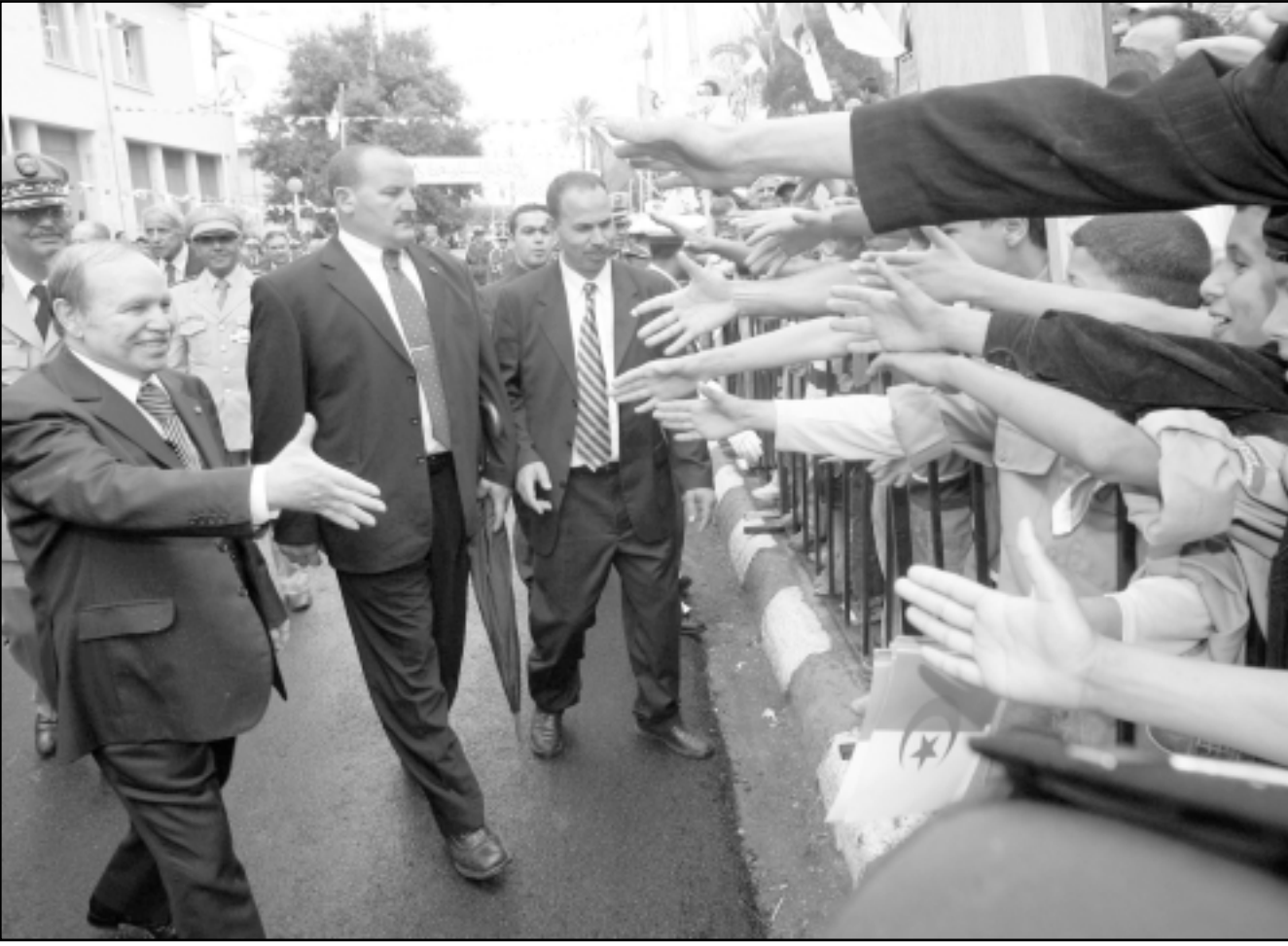
بو تظليقة يصافح بعض مواطنيه خلال زيارته الى البلدية يوم الاثنين

واسفرت تلك المواجهات عن مقتل طالبين وجرح واعتقال العشرات من بينهم 29 طالبا صحراويا وحكم على ستة طلبة بجامعة قاضي عياد بمراكش الاسبوع الماضي بعقوبات سنة سجنا فاذا كما حكم على طلبة اخرى بثمانية اشهر سجنا نافذا.