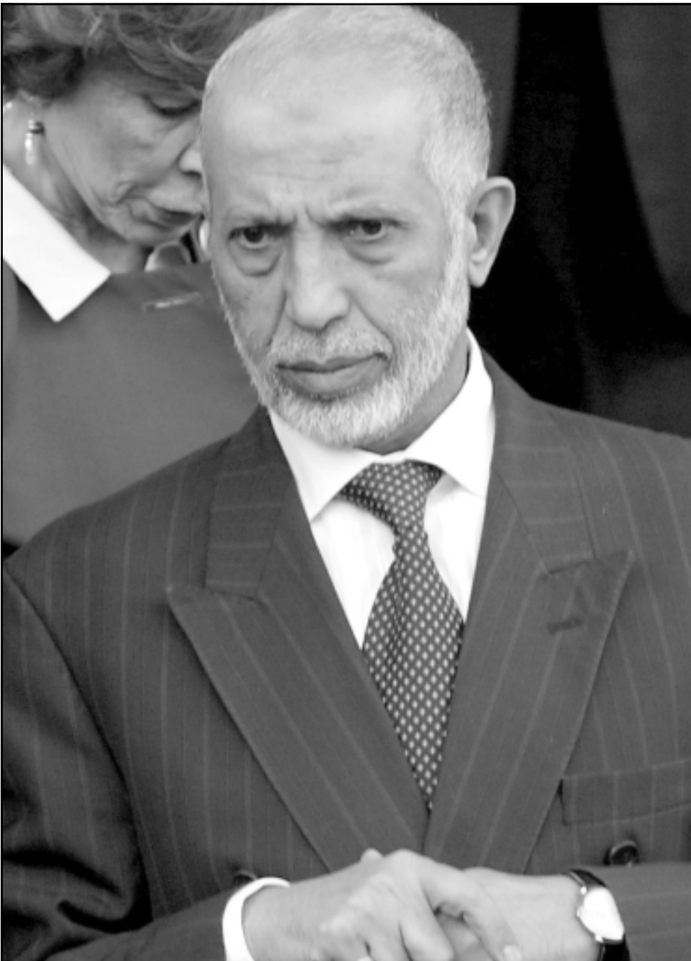
رئيس الوزراء الجزائري عبد العزيز بلخادم