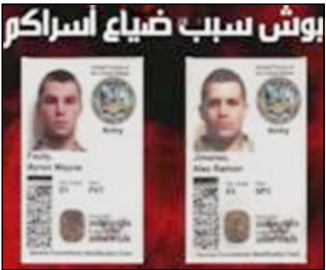
صورتان لجنديين امريكيين قالت «القاعدة» انها قتلتهما