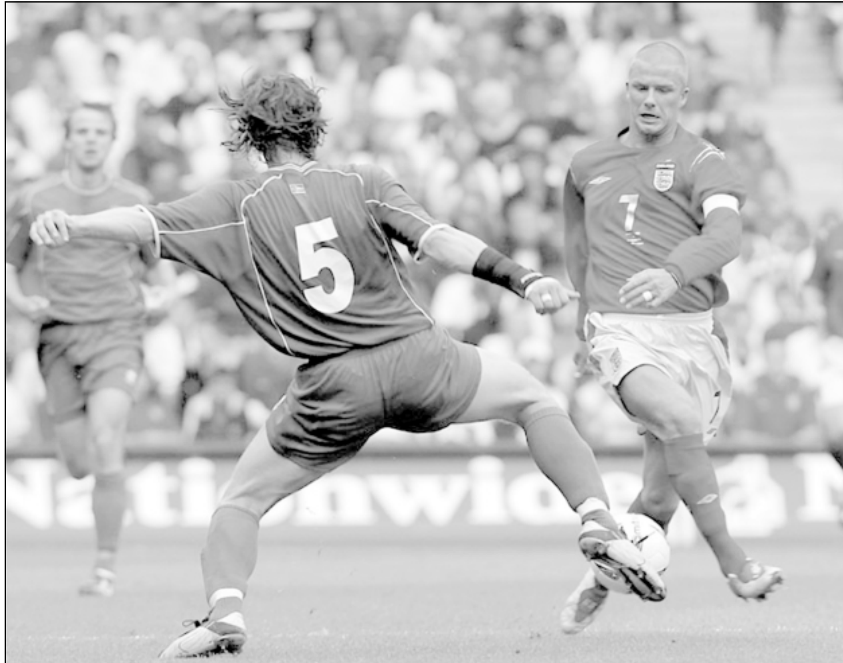
منتخب انكلترا في احدى مبارياته

وكان المنتخب الإيطالي استهل التصفيات بسقوطه في فخ التعادل مع ليتوانيا 1-1 ثم سقط أمام فرنسا 3-1. ومن المتوقع ان يستدعي دونالدوي مجددا الى صفوف المنتخب المدافع جانلوكا زامبروتو بعد غيابه عن مباراة جزر فارو بداعي إصابة خطيرة، في حين يتوقع استمرار القاص فليبيو انترأغي في خط الهجوم. في المقابل، تبدو فرنسا مرشحة لحصد النقاط الثلاث في مباراتها ضد جوجيا. وكانت فرنسا تغلبت على جورجيا في تصفيات أوروبية. وتعد فرنسا منافسا قويا في تصفيات أوروبا، حيث تتصدرها في المركز الثاني. وتعد فرنسا منافسا قويا في تصفيات أوروبا، حيث تتصدرها في المركز الثاني. وتعد فرنسا منافسا قويا في تصفيات أوروبا، حيث تتصدرها في المركز الثاني.