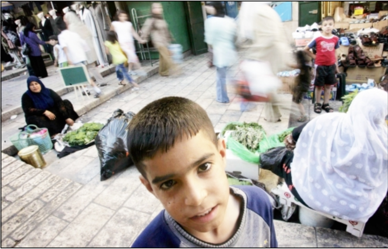
اجواء الكآبة تخيم على مدينة القدس القديمة في الذكرى الاربعين لاحتلالها

ونقلت صحيفة «يديعوت اخرونوت» أمس الاول عن موفاز قوله ان محادثات غير مباشرة مع السوريين يجب أن تتمحور حول المقابل الذي ستحصل عليه اسرائيل لقاء انسحابها من كل هضبة الجولان. وراى موفاز أن مبادرة سياسية مع السوريين ستساعد على إزالة التوتر المتصاعد على الحدود الشمالية بين اسرائيل وسورية. في سياق ذي صلة، من المقرر ان يناقش المجلس الوزاري السياسي الامني، اليوم الاربعاء، الاتراتيجية الاسرائيلية الجديدة تجاه سورية.