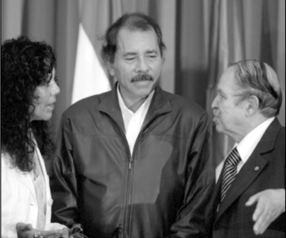
الرئيس بوتفليقة مرحبا بالرئيس النيكاراغي انانيل اورتيغا وزوجته