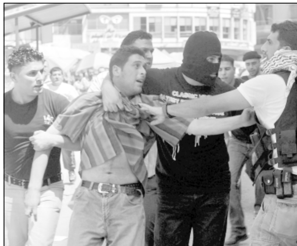
مسلمون من كتائب الاقصى الموالية لفتح يعتقلون احد مناصري حماس في نابلس امس