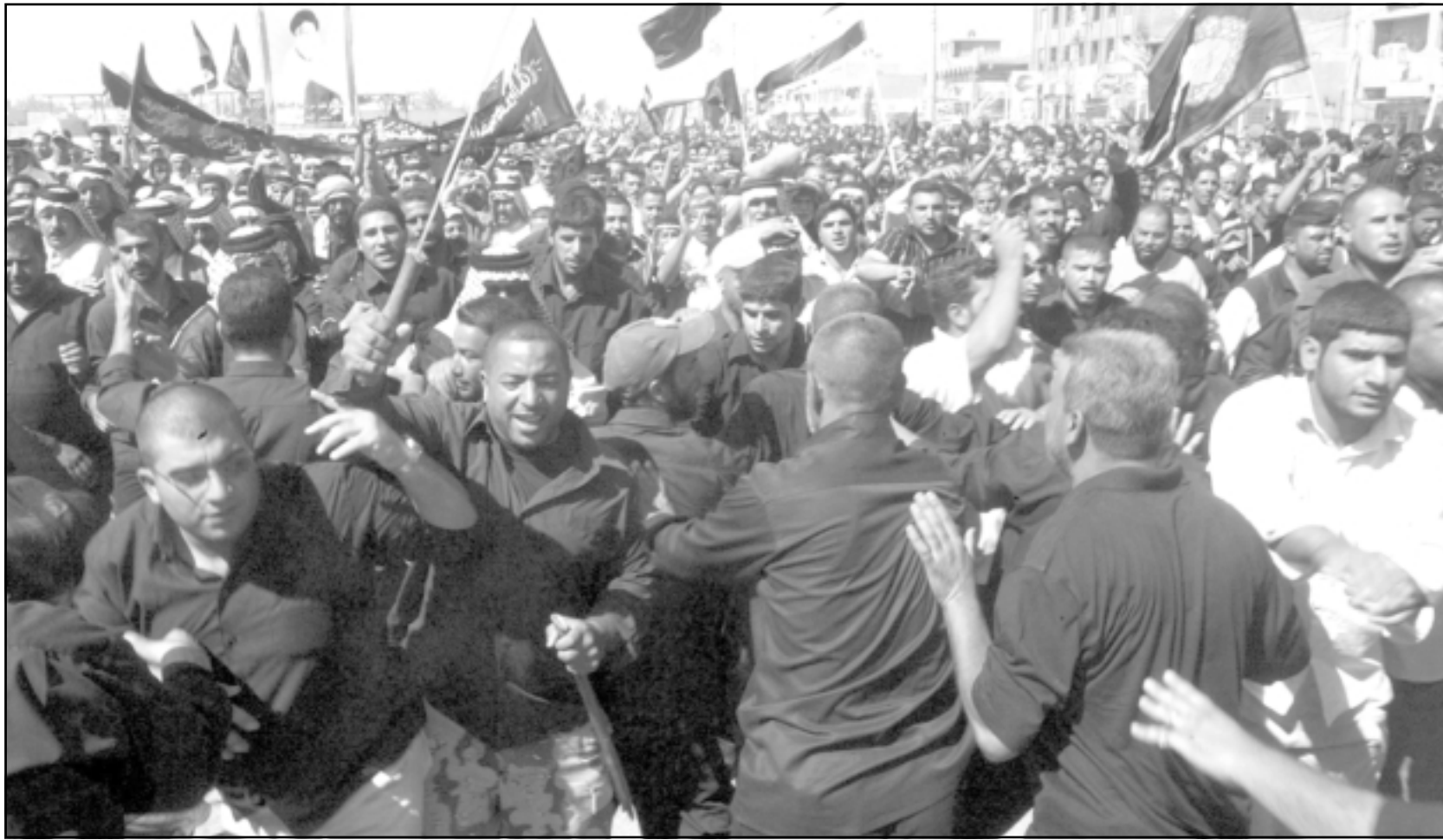
مظاهرات في سامراء ضد تفجير الأماكن المقدسة ومنمدة بالوجود العسكري الامريكى في العراق