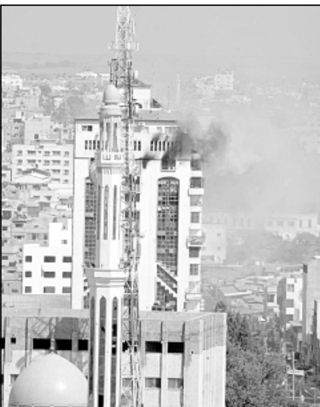
الدخان يتصاعد برج سكني في غزة خلال الاشتباكات بين فتح وحماس