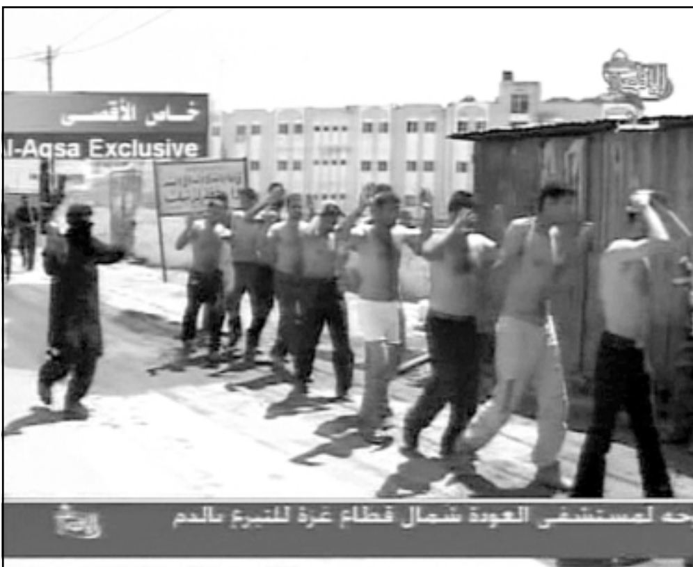
قوات من الامن الوطني الفلسطيني عقب استسلامهم لقوات حماس