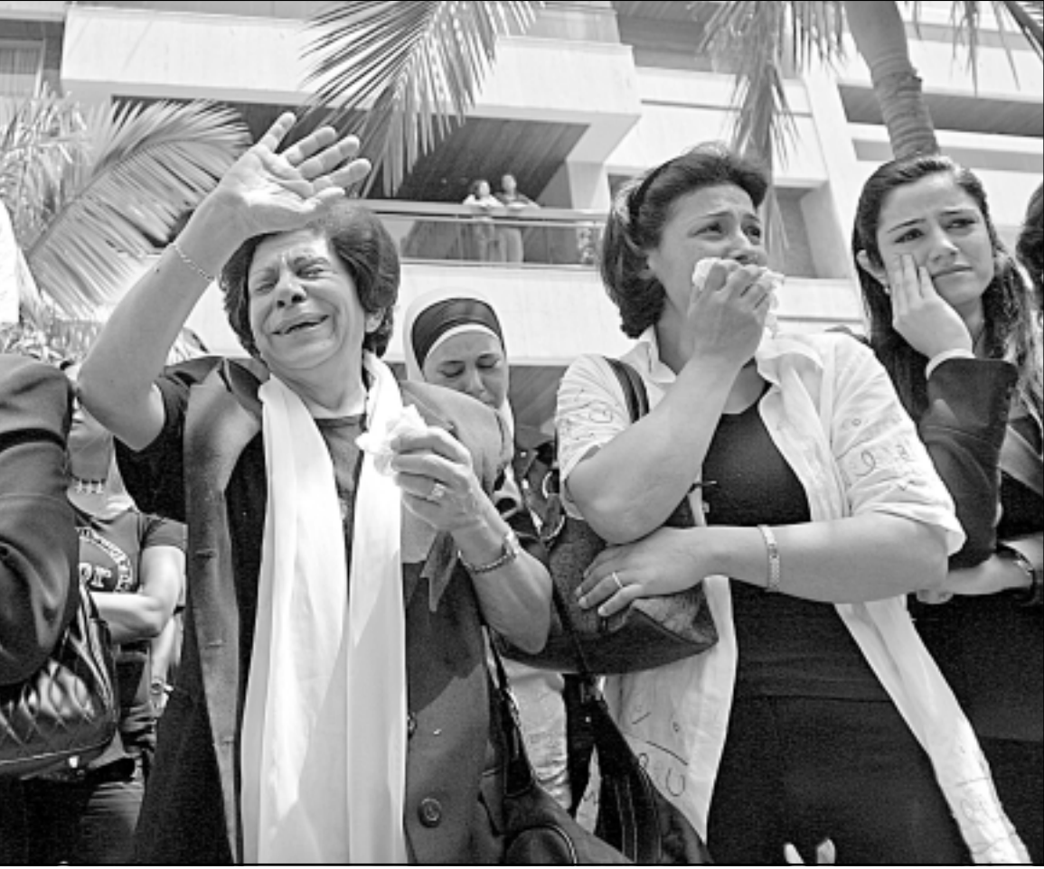
لبنانيات يبكين خلال جنازة النائب عيدو ونجلاه أمس