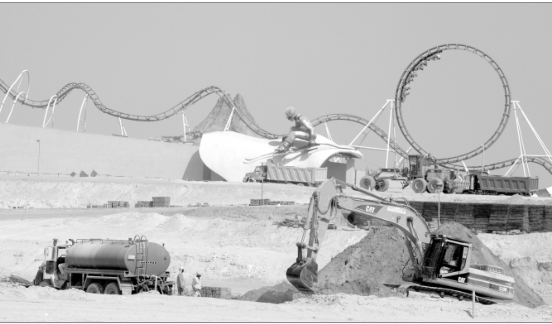
عمال يعددون جانباً من خط سكة حديد لقطار ملاهي في دبي

الذي سفتفتح المرحلة الاولى منه في 2009، وستصل المساحة القابلة للتأجير فيه الى اربعة ملايين قدم مربع. ويتوقع ان يكون هذا المركز أكبر مركز للتسوق في العالم (929 ألف متر مربع) عندما يتم انجاز اعمال البناء.