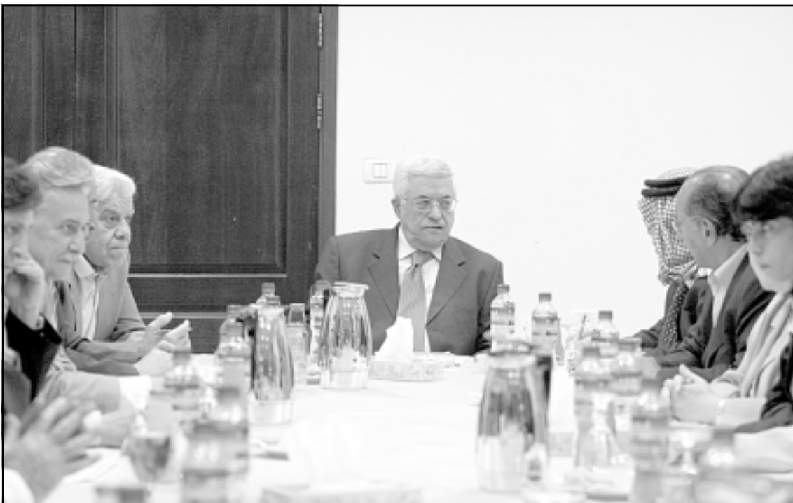
الرئيس الفلسطيني محمود عباس متروسا اجتماع اللجنة التنفيذية لمنظمة التحرير في رام الله امس

مسيقة لوقف اطلاق النار مع فتح في قطاع غزة. وسلمت حركة حماس للوفد الأمني المصري الليبية قبل الماضية ورقة تتضمن البنود الثمانية وطلبت منه تسليمها لحركة فتح الفلسطينية كان مصيره الفشل والخروج من المعادلة. وقال عمرو في مؤتمر صحفي امس: ان الجهات المسلحة التي تتجاهل مقرر السلطة اذ تعلن مناطق سكانية فلسطينية كمناطق مغلقة يشبه ما يفعله الاسرائيليون بشعبنا. وأضاف: اذا كانت هناك نزوات قوة لدى البعض قد تعني له انه يمكن ان يحرق المستحيل فنحن نقول لهم ليفهموا ان لذلك ثمنا باهظ سيدفعه المغامر العايب، فغزة لن تسد حسابات واجندات اقليمية نيابة عن احد، وغزة اول الوطن واول الدولة والحريات امام الرئيس مفتوحة. واكد عمرو ان عباس سيستخذ قرارات حاسمة بشأن حكومة الوحدة الوطنية، وموضوع الشراكة مع حركة حماس، وقال: لقد تم دراسة كل القرارات التي تساعدنا على الخروج من هذا المأزق، وفتح امامنا بناء منظمة الحركه السياسية. وعلى صعيد الاتصالات التي يجريها عباس، قال عمرو «الرئيس اتصل ياسماعيل هنية وبخالد مشعل وأنه لم يلق سوى الاجابات الضعيفة التي تدل إما على انها غير قادرين على التجاوب أو انها غير راغبين في ذلك». هذا واكد عمر رفض القيادة الفلسطينية برئاسة عباس قائلة من 8 مطالب تقدمت بها حماس بواسطة الوفد الأمني المصري كشرط