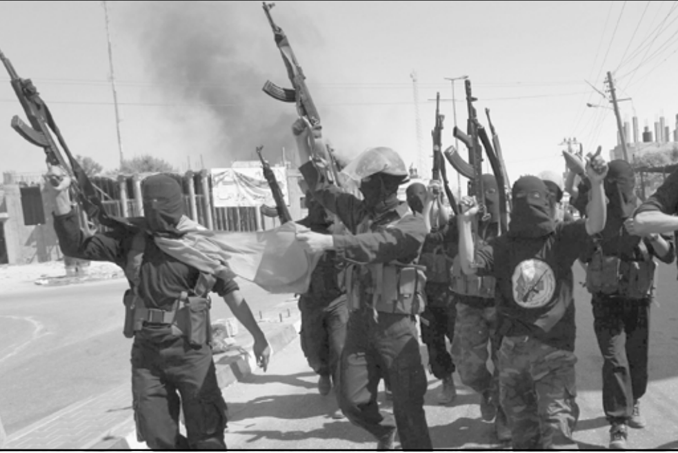
مسلحون من حركة حماس يقتشون أحد مكاتب قوى الامن الوطني.. ويحتفلون عقب دخولهم المجمع الرئاسي بغزة امس