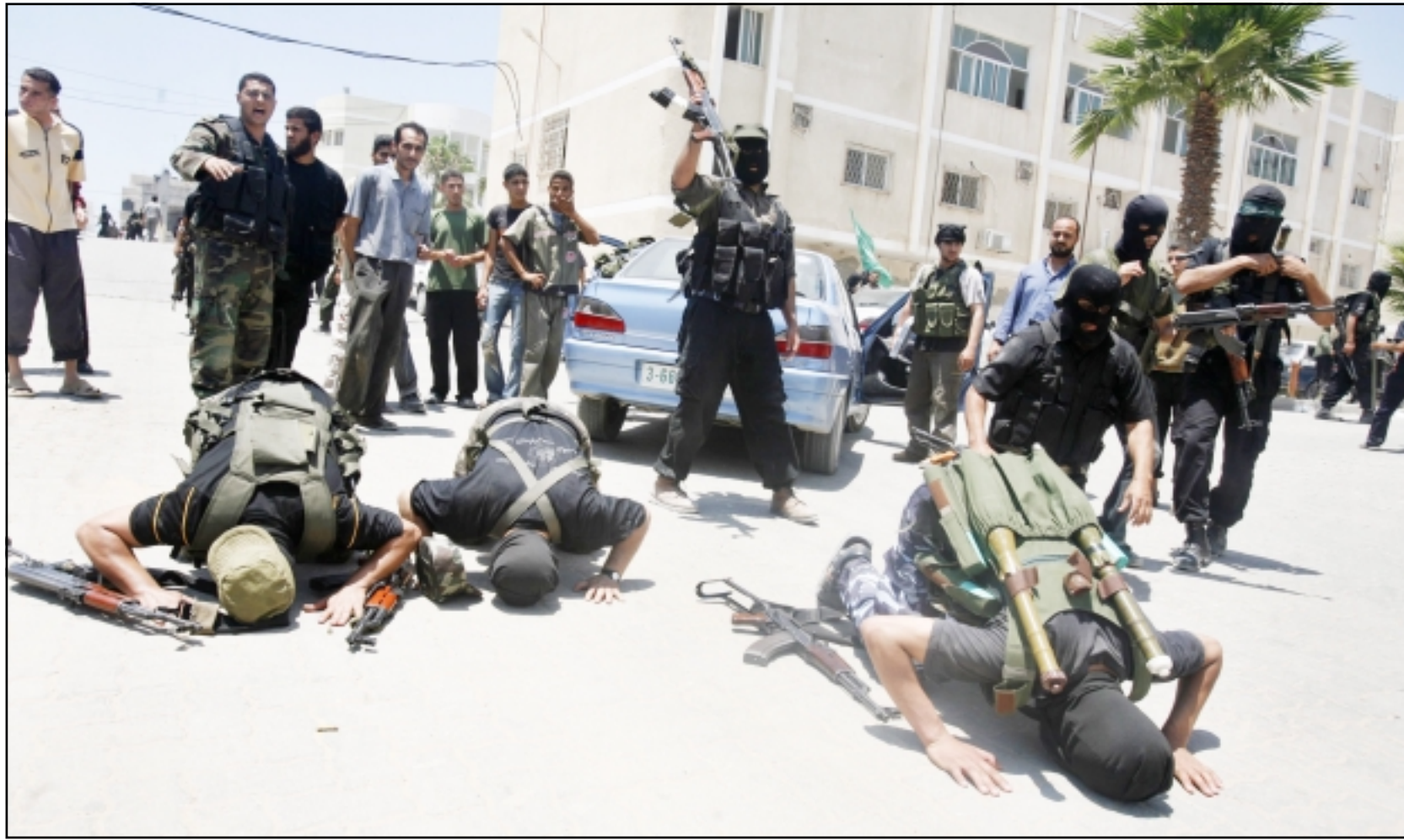
مقاتلو حركة حماس يسجدون لشكر الله امس بعد ان رفعوا الاعلام الخضراء فوق مقر الاجهزة الامنية في مدينة غزة امس

● واشنطن - اف ب: دعت وزارة الخارجية الامريكية رعايا الامريكى اسس الخميس الى تأجيل سفرهم الى لبنان بسبب العنف الدائر هناك وتهديدات المتطرفين ضد مصالح الغرب والحكومة اللبنانية. وقالت الوزارة انها لا تزال تخطى على سلامة المواطنين الامريكىين وسط العنف الدائر في مخيم نهر البارد شمال لبنان بين الجيش اللبناني وجماعة (فتح الاسلام) القريبة ايدولوجيا من تنظيم القاعدة.