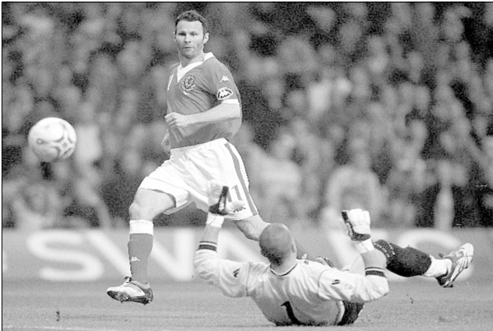
لقطة احدى مباريات مانشستر يونايتد

■ لندن-رويترز: سيبدأ مانشستر يونايتد رحلة الدفاع عن لقب الدوري الممتاز الانكليزي لكرة القدم بمباراة ستقام على ارضه امام ريدينج قبل ان يرحل بعد ذلك باسبوع لمواجهة مانشستر سيتي وفقا لجدول مباريات الموسم المقبل الذي اعلن اليوم الخميس.