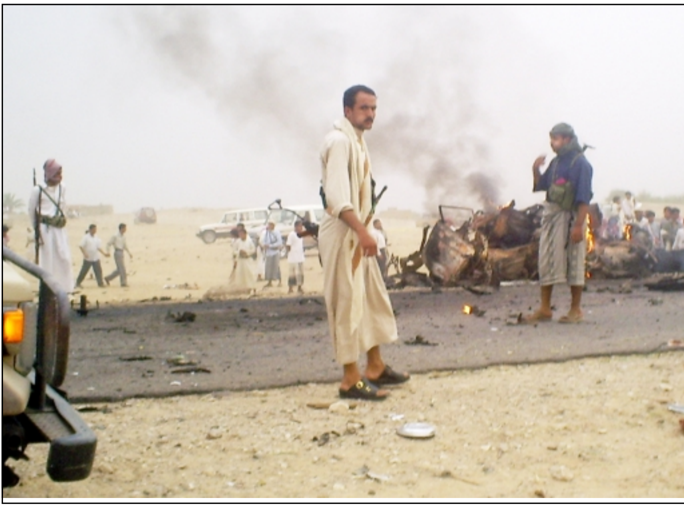
قوات امن يمنية تتفقد المنطقة التي وقع فيها الانفجار في مارب امس

وفي اول كانون الثاني (يناير) 2006، خطف خمسة سباحين ايطاليين هم ثلاث نساء ورجلان قرب مارب قبل ان تفرج عنهم القوى الامنية بعد خمسة ايام. ويبلغ عدد سكان اليمن نحو عشرين مليون نسمة ويعتبر من الدول الاشد فقرا في العالم.