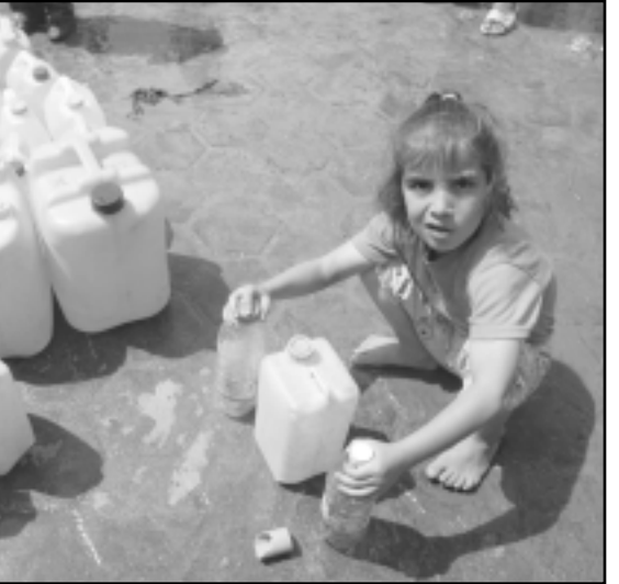
طفلة صغيرة تأخذ حصتها من المياه في قطاع غزة

فلسطين. أنتد لا تحافظون على القيم الديمقراطية وقد تقدّم انقلاباً دولياً واحتلتم الحكم في غزة من خلال القتل والارهاب. حاولتم قتل أبو مازن وقادتم يرسلون الفتيان لتنفيذ عمليات انتحارية، ولتكمهم لا يرسلون أبناءهم هم (هذا اتهام وجهه توفيق الطيراوي، رئيس المخابرات العامة في الضفة، لأحد قادة حماس وزهدة، والمقصود هو عبد العزيز الرنتيسي على ما يبدو إذ قام بمنع ابنه من تنفيذ عملية انتحارية). في قيادة حماس تسود خلافات، ومن الممكن التمييز بين المتطرفين والأقل تطرفاً بينهم - إلا أن قيادة فتح في المقابل هي كومة من الأناض المدمرة. مجموعة كبيرة من قادة فتح في غزة تُجرى حواراً ودياً مع حماس، وهناك من بينهم حتى من يتعاون معها بصورة علنية. في قيادة فتح في الضفة توجد مظاهير متعاورة مع حماس، وفي نهاية الأسبوع الماضي صرح نبيل عمرو، مستشار أبو مازن الحزب، بأن عضو اللجنة المركزية لفتح، هاني الحسن، قد دشور إلى الحضيض في تعاونه مع حماس (بسبب مقابلة أجريت معه في قناة «الجزيرة»). الرياك والبلبلة في قيادة فتح ينبعان قبل كل شيء من الانطباع الواضح بأن الشارع الفلسطيني انما يتعاطف مع حماس. على هذه الخلفية تبلور وضع أصبح فيه نشاطاً فتح في الضفة الغربية بانتظار قيام إسرائيل والجيش الإسرائيلي بتنفيذ المهمة المقررة بدلا عنهم. أي قمه وتصفيية حماس في غزة. دولة إسرائيل تعاقب غزة من خلال فرض الحصار وتحديد كمية الكهرباء والأمن، وكذلك الغداء بدرجة معينة. الجيش الإسرائيلي يقصف ويقتل من بيت حانون حتى رفح. الدول العربية