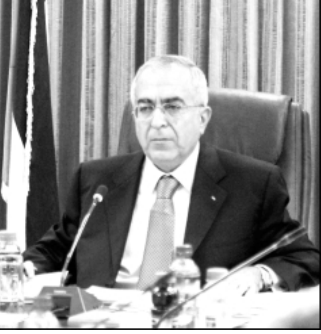
د. سلام فياض