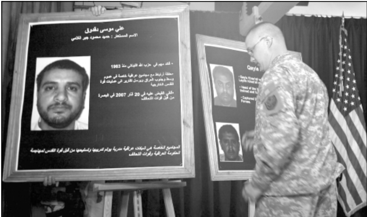
جندي امريكي يشير بصورة المسؤول في حزب الله علي موسى ددوق

بغداد - واشنطن - وريترز - يو بي آي: قال الجيش الامريكي امس الاثنى عشر ان زعماء ايرانيين كبارا على دراية بعمليات قوة القدس التي توجع العنف في العراق. في بعض من أكثر الاتهامات المباشرة حتى الآن ضد طهران فيما يتعلق بالفوضى في العراق. ويتهم الجيش الامريكي منذ فترة قوة القدس بتسلح وتدريب المتشددين الشيعة العراقيين الذين يهاجمون الجنود الامريكيين والعراقيين، ونفت ايران مرارا التورط في تلقي في العراق وتلقي باللوم على الغزو بقيادة الولايات المتحدة للبلاد عام 2003 في اراكة الدماء، وقال الريغادير جنرال كيفن بيرغر المتحدث باسم الجيش الامريكي في مؤتمر صحفي في بغداد «توضح استخباراتنا ان قيادات كبيرة في ايران على دراية بهذا النشاط. نعتقد ايضا ان زعماء عراقيين بارزين اعربوا عن قلقهم للحكومة الايرانية تجاه هذه الانشطة».