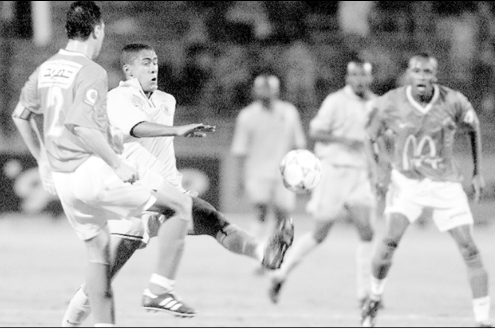
فريق الاهلي المصري

القارية وذلك سيكون إنجازا غير مسبق أيضا. من جهة أخرى سيلتقي الأهلي مع الزمالك في بطولة السوبر المصري يوم 7 آب (أغسطس) قبل سبعة أيام من إنطلاق بطولة الدوري العام للموسم الجديد، وهذه الواجهة ستكون الثالثة التي تجمع الفريقين الكبيرين في أقل من ثلاثة شهور بعد مواجهة الدور الثاني في الدوري ونهائي الكأس. وننتقل إلى الزمالك الذي حصل لاعبه على راحة سلبية لمدة عشرة أيام فور إنتهاء الموسم الكروي وذلك بقرار من الفرنسي هنري ميشيل المدير الفني للفريق الذي يرغب في منح لاعبيه الراحة الكافية بعد موسم طويل قبل أن ينفرط اللاعبين في فترة الإعداد التي ستبدأ بفرنسا يوم 15 تموز (يوليو) الجاري في ضاحية سان روييه قرب العاصمة باريس. من جهة أخرى تفجرت أزمة داخل اتحاد الكرة بسبب مباراة منتخب مصر الوطني وتظهره الإفوارى المزمع إقامتها في لندن يوم 21 آب (أغسطس) القادم وذلك بسبب تعارض موعد المباراة مع ارتباطات لاعبي الأهلي والإسماعيلي في بطولتي أفريقيا للأندية رابطة الأبطال وكأس الكونفيدرالية حيث سيخوض الفريقان مباراتين في نفس التوقيت وهو ما يعني حرمان المنتخب من جهود لاعبي الأهلي والإسماعيلي، الذين يعدون الركيزة الأساسية للفريق، لكن أحدا لم يتحرك من مسؤولي الاتحاد لأن الوقت لا يزال مبكرا على المباراة من وجهة نظرهم!