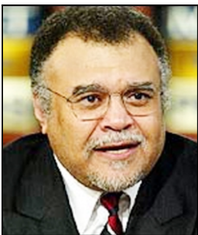
الامير بندر بن سلطان

لندن- يو بي أي: لا يزال منزل الأمير السعودي بندر بن سلطان بن عبد العزيز في مدينة أسبن بولاية كولورادو مطروحا للبيع بعدما حمل صفقة بيع منزل للبيع في تاريخ الولايات المتحدة الأمريكية.