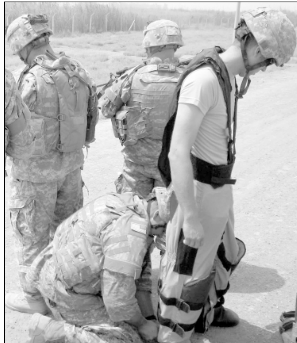
جندي امريكي يرتدي سترة واقية استعدادا للفحص شاحنة في شمال العراق امس