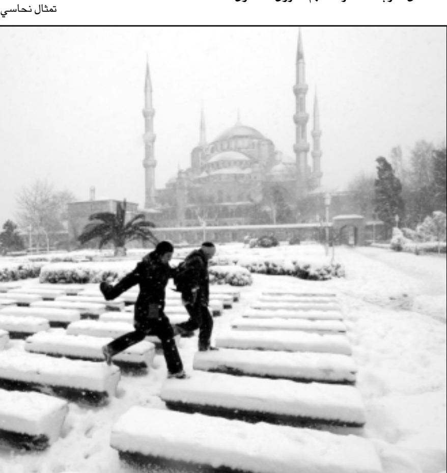
جامع السلطان احمد (الجامع الازرق)

تلك القصور والمساجد الرائعة والتي اراد بها ان يظهر عز السلطنة مقابل القصور الفرنسية في باريس وفرساي ومارني، والسلطان سليم الثالث في مطلع القرن التاسع عشر بدأ في بناء قوة عسكرية نظامية حديثة التسليح على نمط جيوش الممالك الاوروبية، فالانقلاب الذي احده اتاتورك بالاسلام بها ليحدث كما اسلفنا انقلاباً على الهوية، اراد تسخير القومية التركية لتكون رأس حربة ضد الارث الثقافي والديني والروحي الذي يربط تركيا بالاسلام وبالتالي بالعرب، ومن اجل ان تكون دافعاً للانتماء الى عمانية غربية تلتحق تركيا بالحيط الاوروبي، وفي السياق، وضمن التعبئة والتحميد للقومية التركية اطلق موجة هائلة من التعصب للتركيز وارسى اطروحة نظر لها مفكرون ترك ان العنصر التركي هو المصدر الاصلي لكل حضارات العالم، وخرج بنظرية الشمس ذات الاشعة الستة التي يشير