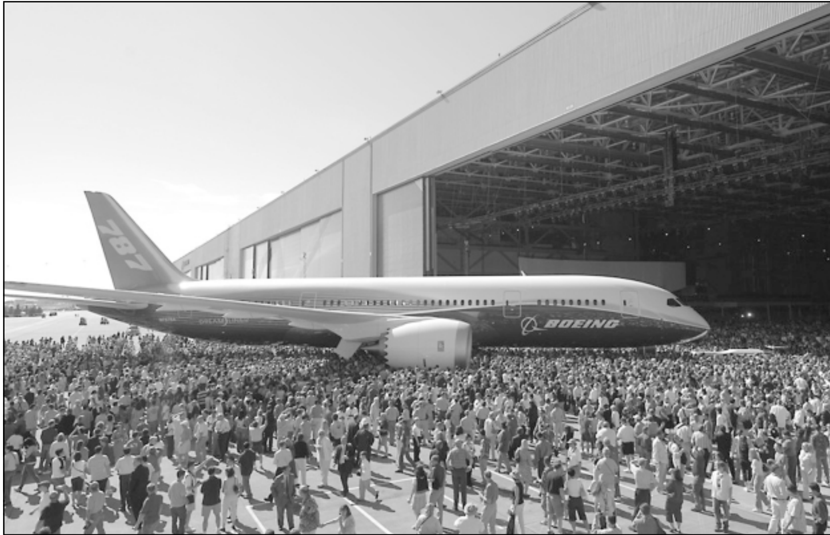
الطائرة الجديدة 787 دريملاينر خلال الاحتفال الذي شهده أكثر من خمسة عشر الفا من عامليها

النفط ارتفعت أسعار النفط الى أعلى مستوياتها في 11 شهرا فوق 76 دولارا للبرميل امس الاثنين مع تخاف الخوف بشأن المعروض جراء أعمال صيانة في حقول بحر الشمال وارتفاع الطلب العالمي على الخام. وصعد خام برنت الذي يعتبر الان مؤشرا افضل للسوق العالمية الى 76.24 دولار للبرميل وهو أعلى مستوى منذ منتصف آب (أغسطس) 2006.