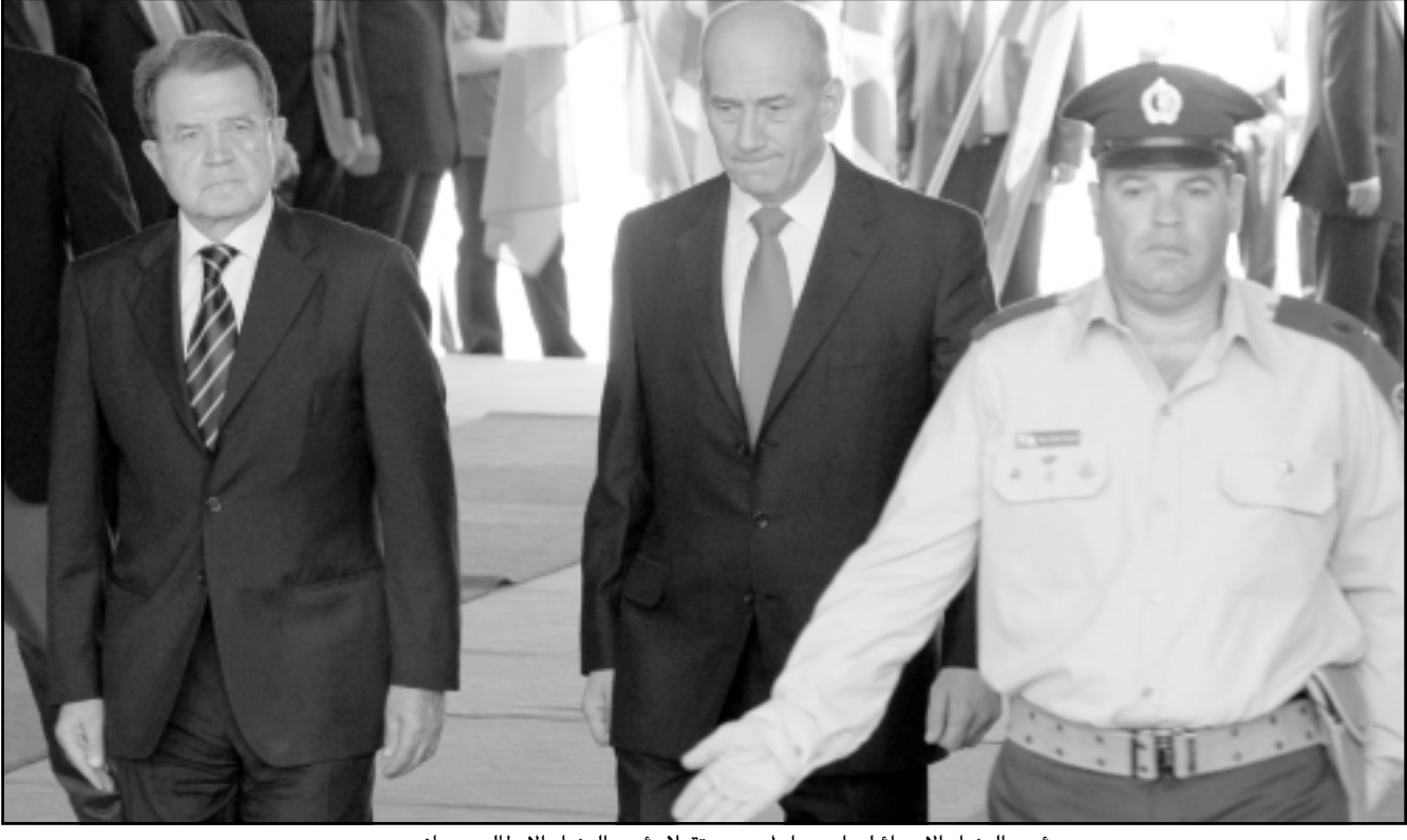
رئيس الوزراء الإسرائيلي ايهور اولمرت مستقبلاً رئيس الوزراء الإيطالي رومانو برودي

وتحرق برودي الى العقوبات الدولية المفروضة على إيران لدفعها للحدول عن تنفيذ برنامجها النووي وقال إن «إيطاليا تدفع ثمناً اقتصادياً غالياً جداً جراء العقوبات التي تم فرضها على إيران، ورغم ذلك واضح لنا انه يحظر على إيران امتلاك سلاح نووي، وقد أصرنا وسنواصل إصرارنا على فرض هذه العقوبات». وقال برودي «شمة اهمية كبيرة لهذه العقوبات ونحن نؤيد دون تحفظ انه ممنوع ان تمتلك إيران سلاحاً نووياً، خصوصاً لأن إيران كانت دولة اقليمية عظمى ولها الآن اهمية كبيرة في منطقتنا فإني اعتقد ان نشاطها يجب ان يتم انطلاقاً من إدراكها لمخاطتها». وأضاف ان «على طهران الانتظار عن نوابها العسكرية والإذعان لشروط مجلس الأمن الدولي وإلا فإنها قد تجد نفسها في طريق لا أحد يريد، أي زيادة قوة العقوبات»، واعتبر ان «إيران ليست بحاجة الى سلاح نووي من أجل أداء دورها في المنطقة». وقال اولمرت في الموضوع ذاته انه «لا يمكننا أبداً التسليم بإيران نووية، إذ أنه من خلال تزويج محمود أمدي نجاد يدعو الإيرانيون يوماً تقيماً الى تدمير إسرائيل ولن نسلم بوضع كهذا». وأضاف اولمرت «اعتقد انه مضطرب دولي مشترك، من جانب دول اوروبا وبينها إيطاليا وأيضاً من جانب دول عربية ومن جانب روسيا وبقية دول العالم، سيتم تحقيق ذلك». وقال اولمرت، الذي التقى برودي مرتين أمس وامس الاول، بعد تباحثنا في موضوع العلاقات مع الفلسطينيين، ويتوجب بذل جهد خاص لتحسين