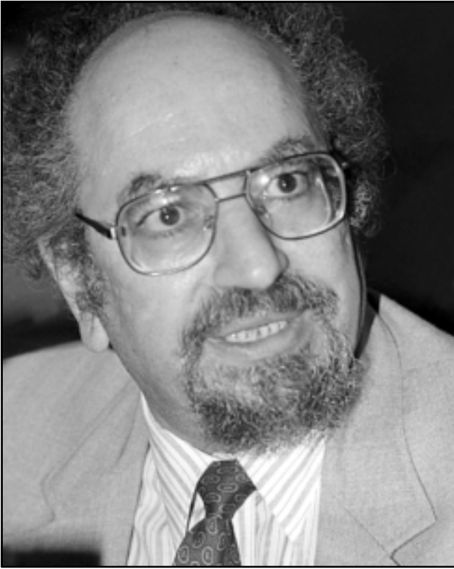
سعد الدين ابراهيم

كانت تستخدم كعينة في حملات توعية قبل ان تبره الحكمة. والبرلمانية والتي شهد مراقبوه انها اتسمت بانتهاكات واسعة.