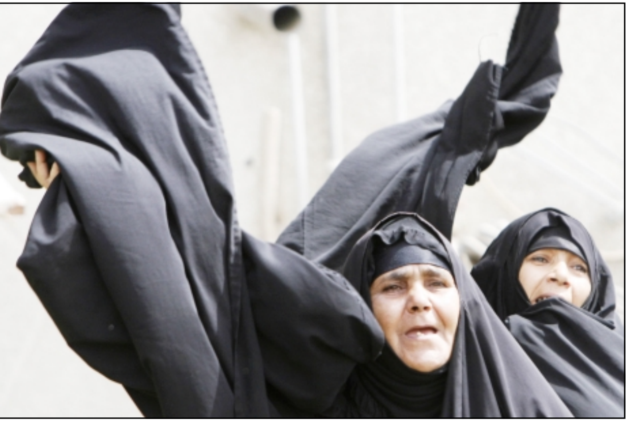
سيدات عراقيتان من اقارب الشيخ ناصر السعدي تشاركان في مظاهرة للمطالبة باطلاق سراحه في بغداد امس