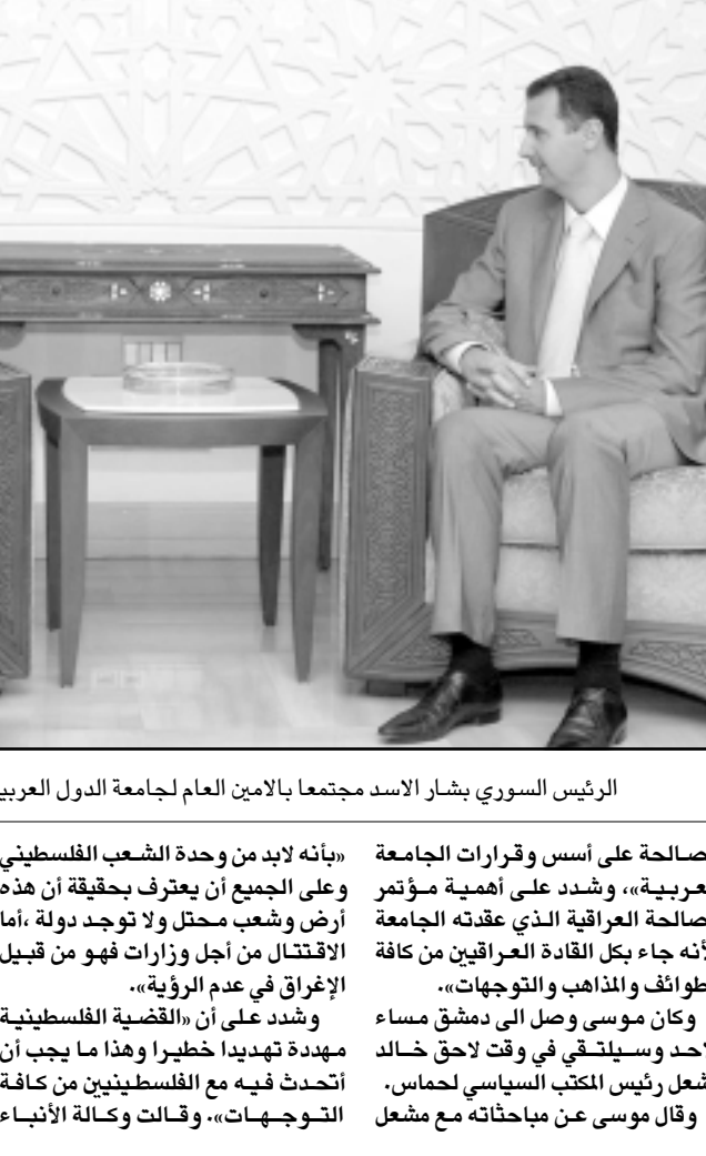
الرئيس السوري بشار الاسد مجتمعاً بالامين العام لجامعة الدول العربية عمرو موسى في دمشق امس

دمشق - يوب آي: قال أمين عام الجامعة العربية عمرو موسى إنه إذا فشلت في لبنان فسأحاول مرة أخرى مضيافاً الى الجامعة لا تنحاز الى طرف لبناني لحساب آخر. وقال موسى في مؤتمر صحافي عقده عقب محادثاته في دمشق امس الاثنين إنه «لا يخشى من مسألة الفشل وهو يقوم بواجبه فقط». إذا فشلت فسأحاول مرة أخرى لاني عنيد في هذه المسألة». وشدد على «ضرورة سعي الجميع لحل الأزمة اللبنانية»، مؤكداً ان «الجامعة لا تنحاز لطرف لبناني على حساب طرف آخر»، مضيفاً ان «كثير من محاضرات الصحافة اللبنانية التي جاء فيها هذا القول تعبر عن كلام غير دقيق». وأشار موسى الى أنه «ليس ساعي بريد». اتخذت موقفاً محدداً تجاه جانب على حساب الجانب الآخر وهنا يمكن ان تحدث فرصة للصيد بالماء العكر». واعتبر موسى أنه «ربما يكون المطلوب الا تتدخل الجامعة العربية الا ان الجامعة ستتدخل وتستمر في عملها في محاولة لمساعدة اللبنانيين والمهمة لم تنته والبعس فالفرص تقدم نفسها وسيحدث تقدم انتشائي الله»، وقال «هناك أمور كثيرة لم نتحقق أو نحل وهناك توافق عربي في الرأي يصعد نحو الاتفاق على التوافق على اوضاع تقدم والتحرك باتجاه الحل في لبنان». واعتبر ان «جملة من العوامل العربية والإقليمية اللبنانية مهمة في الأزمة اللبنانية»، أهمية العامل