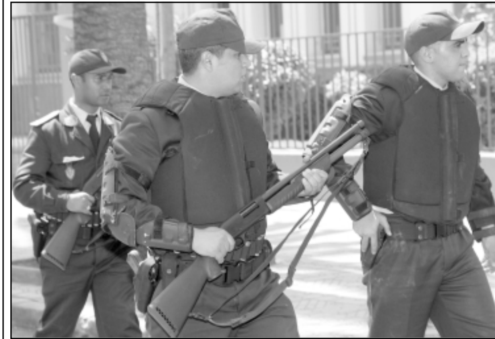
حالة التأهب الأمني بشوارع الدار البيضاء المغربية اثر تقارير يوم الاحد

صحيفة: أوروبا واسرائيل حذرتا المغرب من هجمات ارهابية