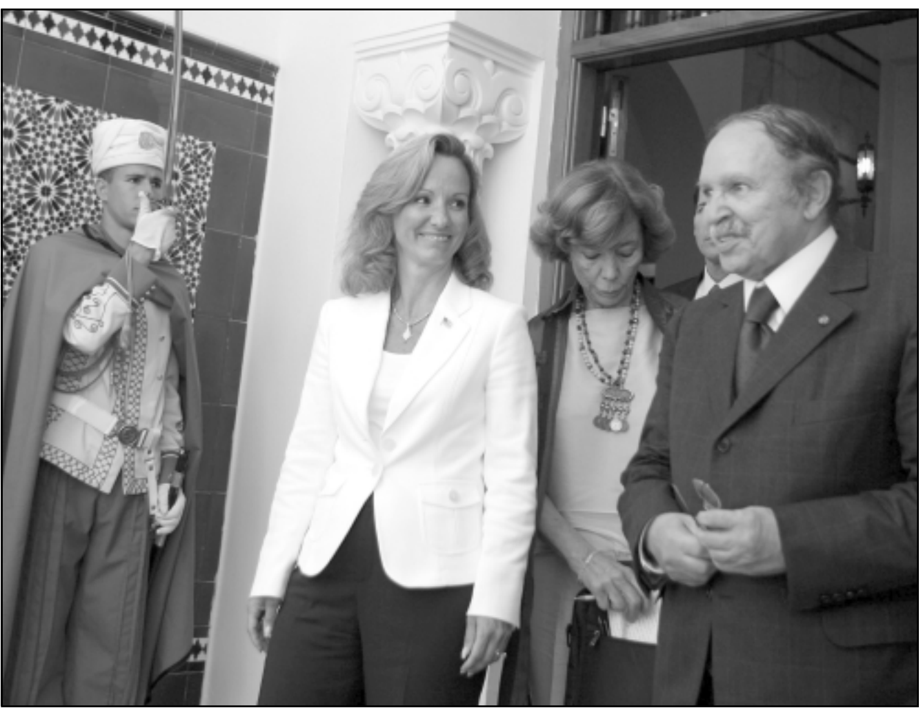
المستشارة فرنسيس فراغو تاونسند برفقة بوتفليقة عقب لقاءهما الثاني امس

بلاده ابواء أي قواعد أو تواجد عسكري فوق أراضيها. وقال أخيرا «بالنسبة للبنا نحن لا نرى أنفسنا معينين بالمشروع الأمريكي العزيز بلخادم، في هذا الصدد، ورفض