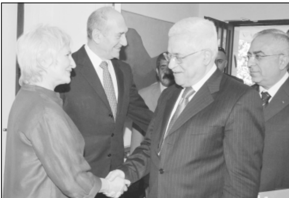
الرئيس الفلسطيني محمود عباس خلال لقائه رئيس ورئيس الوزراء الاسرائيلي يهود اولمرت

الاسرائيلي من إجمالي 600 حاجزا متوزعة بالأراضي الفلسطينية. وأوضح أن عباس أعرب عن رفضه للأحداث التي تردت عن معاقبة قطاع غزة بقطع الماء والكهرباء وحصل على تعهد من أولمرت بعدم المس بيهذه المسائل الإنسانية إضافة لمناقشة موضوع خروج الحجاج لأداء الفريضة وسيتم إيجاد سبيل لهم للخروج والعودة. من جهته طالب رئيس الوزراء الفلسطيني سلام فياض خلال الاجتماع بحضور وجود تعاون امني بين الطرفين حيث وعدت اسرائيل بدراسة الموضوع، إضافة الى ان فياض أعلن أنه سوف يتسلم خارطة ازالة الحواجز الاسرائيلية في الضفة الغربية من وزير الدفاع الاسرائيلي يهود باراك خلال اسبوع.