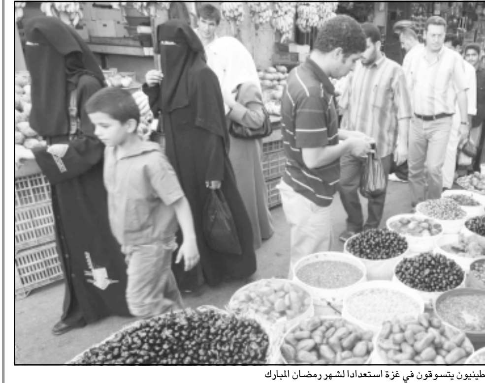
فلسطينيون يتسوقون في غزة استعدادا لشهر رمضان المبارك

فياض التي تسيطر على الضفة الغربية وكل واحدة تشكل في شرعية الاخرى ومدى دستوريتهما. وكانت حماس سيطرت على قطاع غزة منتصف حزيران (يونيو) الماضي بقوة السلاح بعد 6 ايام من القتال العنيف مع حركة فتح وعناصر الاجهزة الامنية التي سقطت معظم مقراتها في ايدي مقاتلي حماس. وكان رد الرئيس الفلسطيني محمود عباس على ذلك التطور اقالة حكومة الوحدة الوطنية التي يرأسها اسماعيل هنية أحد قادة حركة حماس البارزين، واعلان حالة الطوارئ وكلف الدكتور سلام فياض بتشكيل حكومة طوارئ تحولت بعد شهر الى حكومة تسيير اعمال بعد ان فشل المجلس التشريعي من الاعقاد لمنح حكومة فياض الثقة او رفضها.