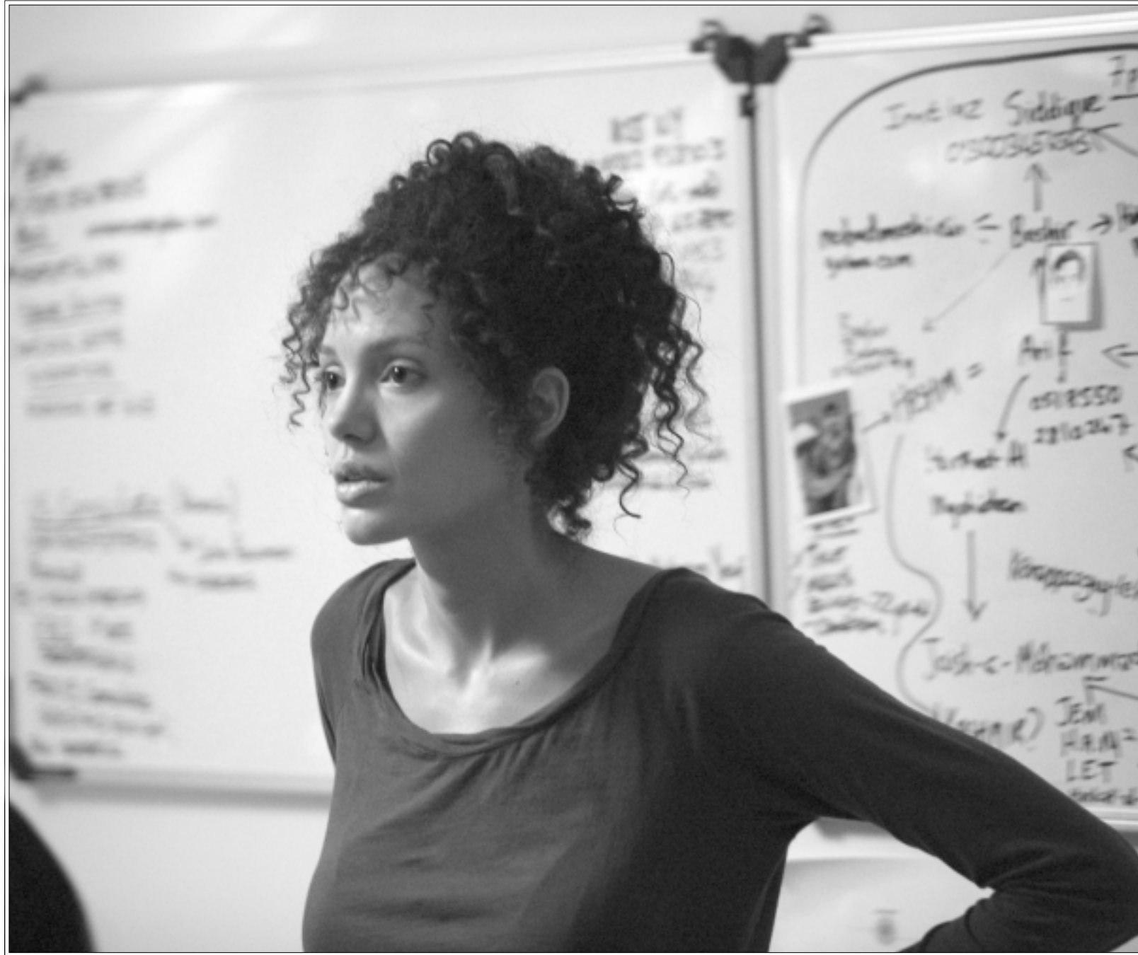
أنجيلينا جولي في لقطة من فيلم «قلب قوي»

المثلة الأمريكية أنجيلينا جولي تكبر مع أنوارها، وفاجأت في هذا الفيلم بأداء مميز رفيع في دور ماريان. هذا العام للقب الجعجة الذهبية هي من الترويج، السويد، أيسلندا، فرنسا، انكلترا، ألمانيا، إسبانيا، بلجيكا وصربيا.