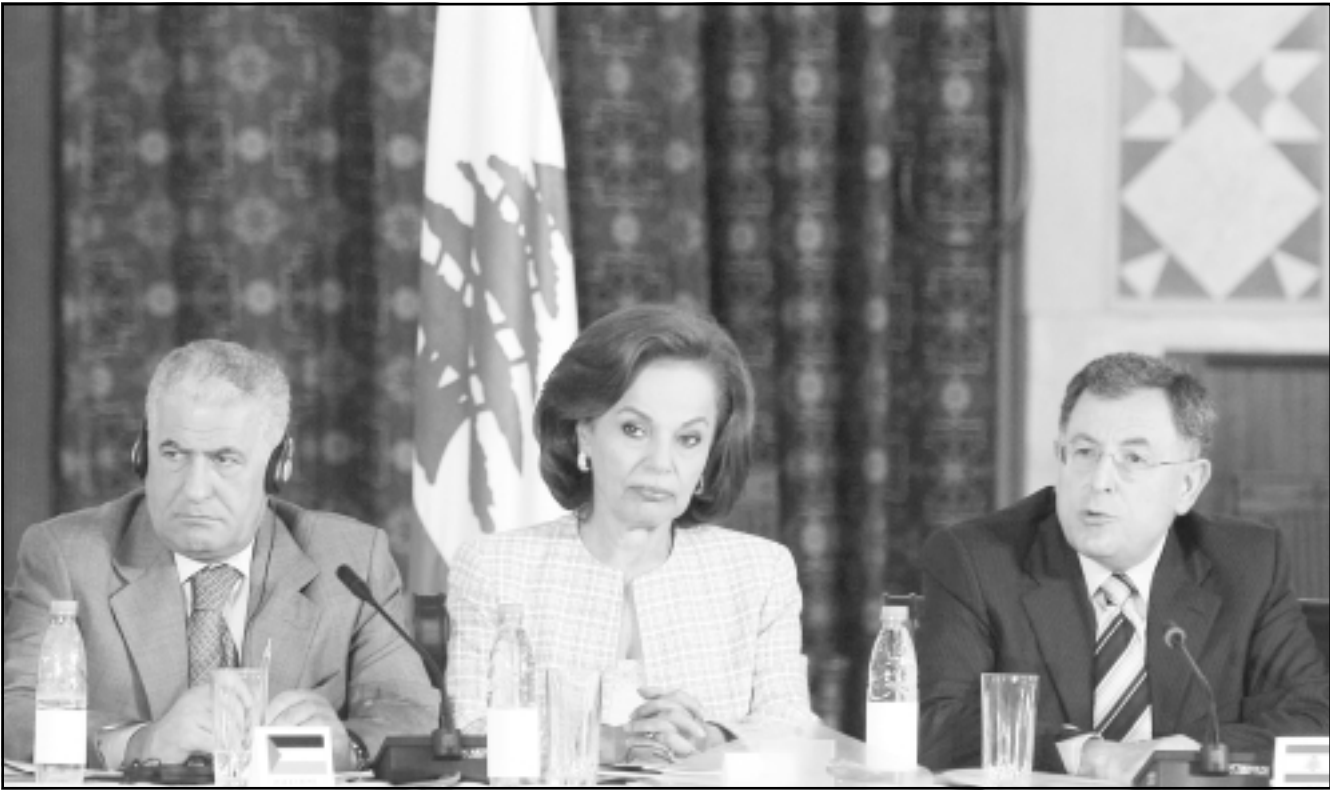
رئيس الوزراء اللبناني فؤاد السنيورة يمين ووزيرة الشؤون الاجتماعية نائلة معوض وممثل حركة فتح في لبنان عباس زكي

يضاف الى ذلك انه بتاريخ يوم السبت 2007/9/8 ألقى القبض على المواطن اليمني ناصر محمد يحيى شقيقه من مواليد 1983 في منطقة المنية - شمال لبنان وادلى بأنه غادر مخيم نهر البارد الساعة 23:00 من مساء السبت 2007/9/1 مع شاكر العبيسي وكل من (ابو علي وابو الشهيد وابو أحمد) وان شاكر العبيسي كان بحالة جيدة ويرتدي حزاماً ناسفاً ويحمل بندقيّة حربية نوع كلاشينكوف وجعبة ماشط وقنابل يدوية.