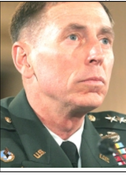
الجنرال ديفيد بترايوس يدلي بشهادته امام الكونغرس امس

العاصمة بغداد. وأوضح بيان الجيش ان «سبعة جنود امريكيين قتلوا واصيب 11 اخرون اثر حادث سير في غرب بغداد» الاثنين. وأوضح البيان ان «الهجوم وقع الاحد واصيب فيه جندي اخر بجروح». ويقتل هؤلاء الجنود يرتفع الى 3760 عند الجنود الامريكيين الذين قتلوا منذ اجتياح العراق. وشدد الرئيس الامريكي جورج بوش خلال اتصال مع رئيس الوزراء العراقي نوري المالكي الاثنين على ضرورة حصول تقدم سياسي في وقت يستمع فيه الكونغرس لافادات قد يكون لها اثر كبير على الاستراتيجية الامريكية في العراق. واجرى بوش محادثات مع المالكي عبر الدائرة التلفزيونية المغلقة قبل ان يبدأ الجنرال ديفيد بترايوس والسفير الامريكي في العراق ريان كروكر الادلاء بافادتهما حول تقويمهما للوضع في العراق على ما افاد الناطق باسم البيت الابيض توني سنو.