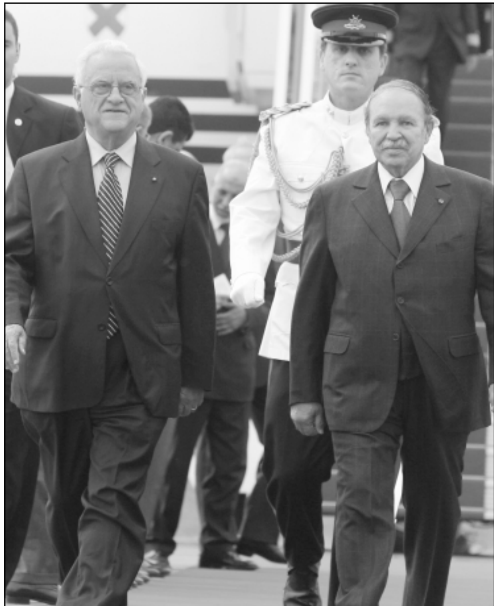
بو تلفيةة مستقبلا نظيره المالطي ادوارد فينيش ادمي امس بمطار الجزائر الدولي

الجزائر - ا ف ب: افساد مراسل وكالة «فرانس برس» ان رئيس مالطا ادوارد فينيش ادمي وصل امس الاثنين الى الجزائر في زيارة رسمية تستغرق يومين. وكان في استقبال رئيس مالطا لدى وصوله الى مطار الجزائر نظيره الجزائري عبد العزيز