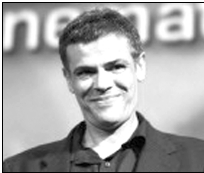
عبد اللطيف كشيش

يسقط بينما حلمه الذي سعى إليه طوال حياته يكاد ينهار. وسبق لعبد اللطيف كشيش أن حاز جائزة السيزار ارفع الجوائز التي تكافئ السينما الفرنسية عن فيلمه الثاني «الراوغ» الذي انتزع أيضاً عام 2004 جوائز أفضل إخراج وأفضل سيناريو وأفضل وجه نسائي جديد. وكان هذا الفيلم أنتج بامكانيات متواضعة وبكاميرا رقيقة وميزانية لم تتجاوز الـ 500 ألف يورو وشبان الضاحية كما لم يصورهم أحد من قبل وحقق هذا الفيلم 300 ألف بطاقة مبيعة ما دفع المنتج الفرنسي الكبير كلود بري الى الاهتمام بالخروج وتحويل عمله الى