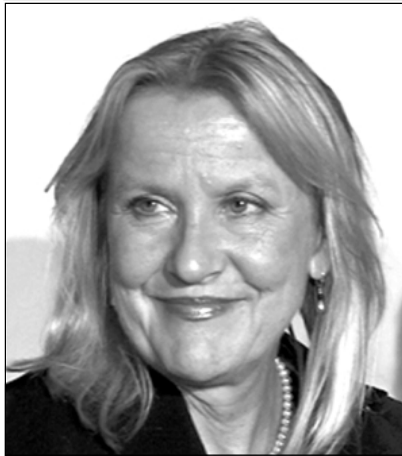
مديرة مهرجان كوبنهاغن فينه ياتز

أسماء المخرجين ليست معروفة على نطاق واسع، فالكبار (كما هو معلوم) يسعون إلى إرسال أفلامهم إلى مهرجانات أهم مثل كان، البندقية وبرلين، رغم أن مهرجان كوبنهاغن لا يمانع في إدراج أفلام سبق عرضها في مهرجانات أخرى على قائمة التنافس.