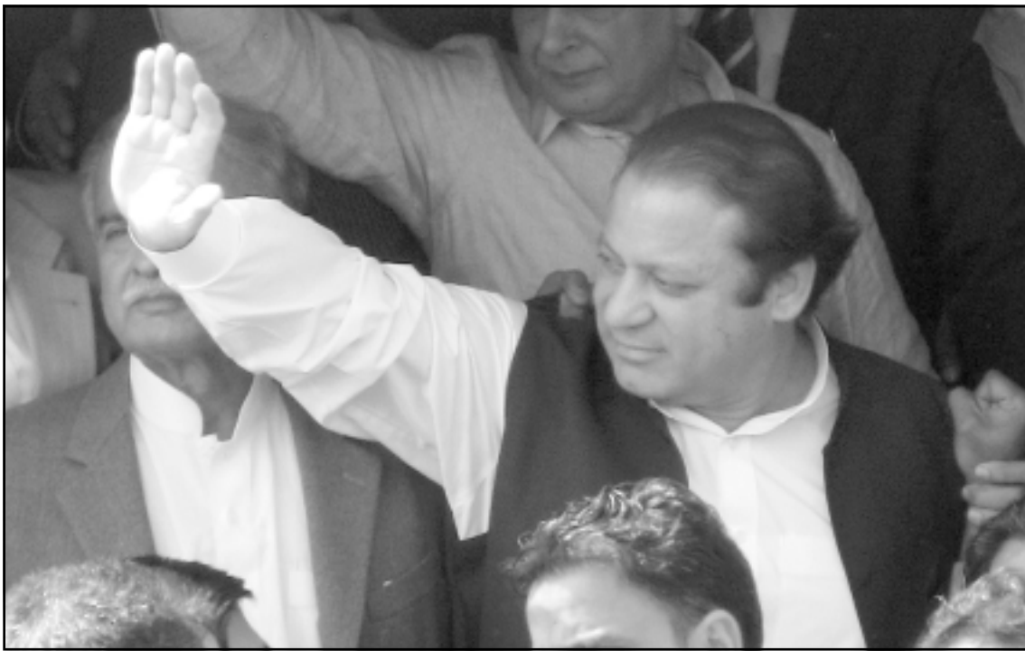
رئيس الوزراء الباكستاني السابق نواز شريف لدى وصوله الى اسلام اباد قبل ترحيله من جديد

وزراء باكستان السابقة بينظير بوتو امس الاثنين انها ستعود الى الرجوع الى البلاد من المنفى في تشرين الاول (أكتوبر) على أمل القضاء فيها اقتراح محمد ثنودري في