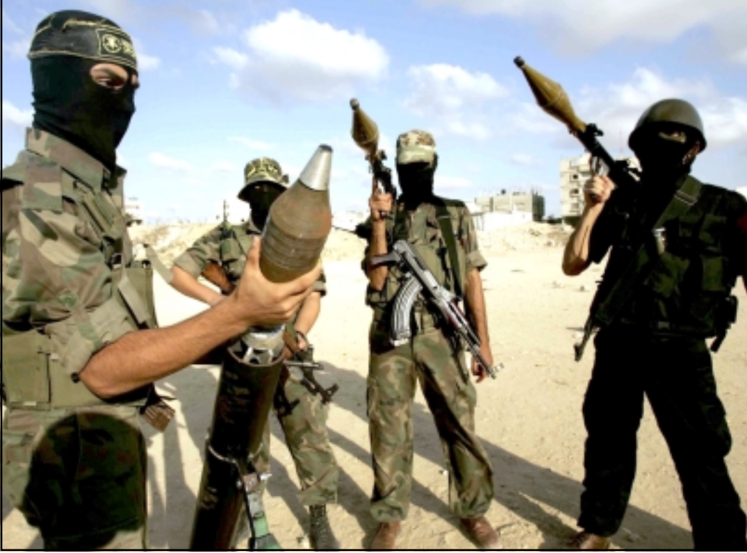
نشطاء من حركة الجهاد الاسلامي يتدربون امس في جنوب قطاع غزة على مواجهة اي اجتياح اسرائيلي

الضغوط على السكان لتخليهم على سلطة حماس. وكشف النقب عن خطة أعدتها وزارة الخارجية قبل عدة أسابيع وتشمل عدة خطوات مقترحة لزيادة الضغط الاقتصادي على قطاع غزة، وتشمل الخطة تشديد الخناق على المعابر والتقليل من كميات البضائع التي تدخل إلى قطاع غزة عبر معبر صوفا وكرم أبو سالم إلى أننى حد ممتن، والتضييق على نقل الأموال إلى قطاع غزة إلى جانب خطوات أخرى تمس