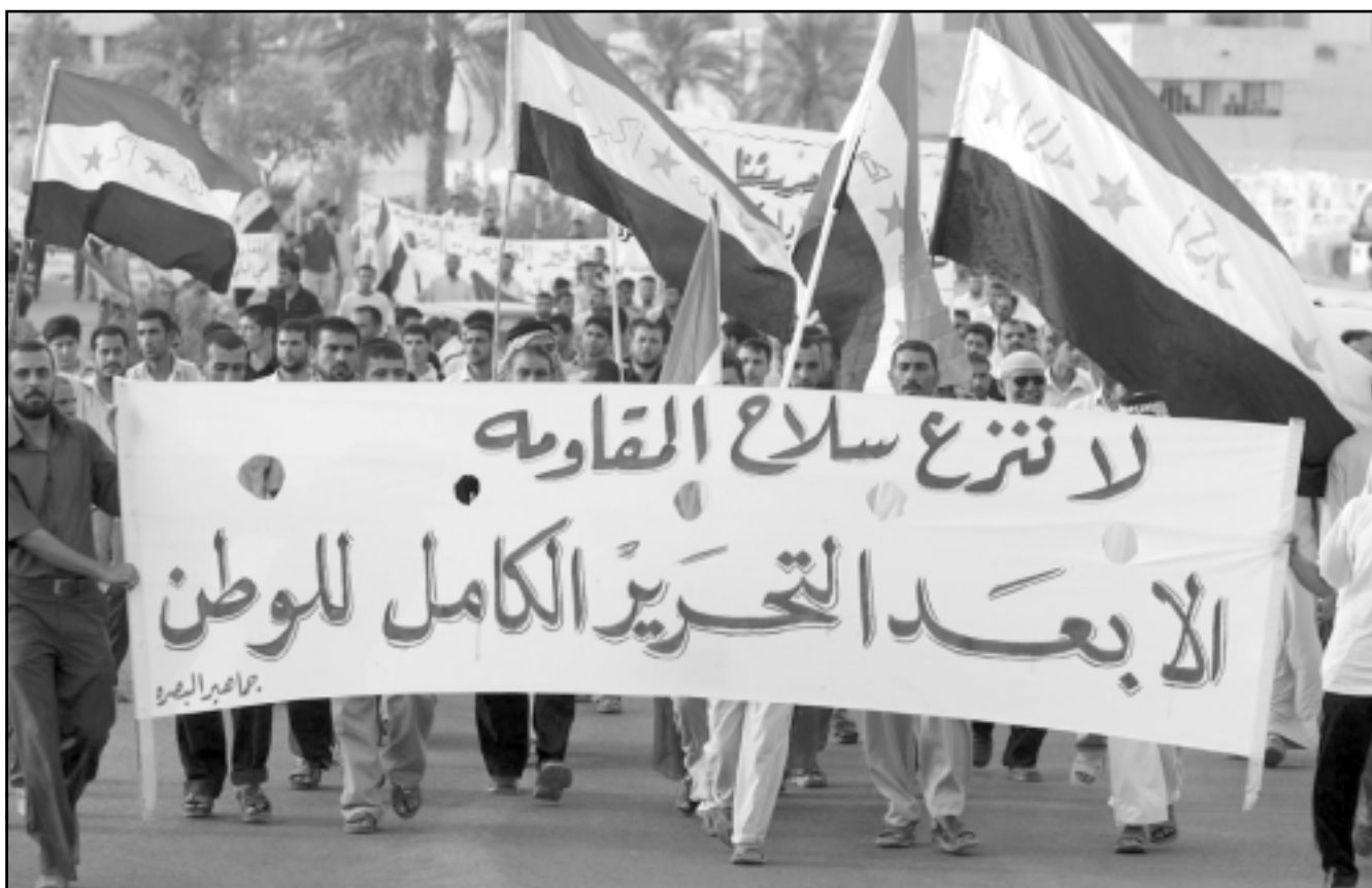
مظاهرون في البصرة يطالبون بالحفاظ على سلاح المقاومة