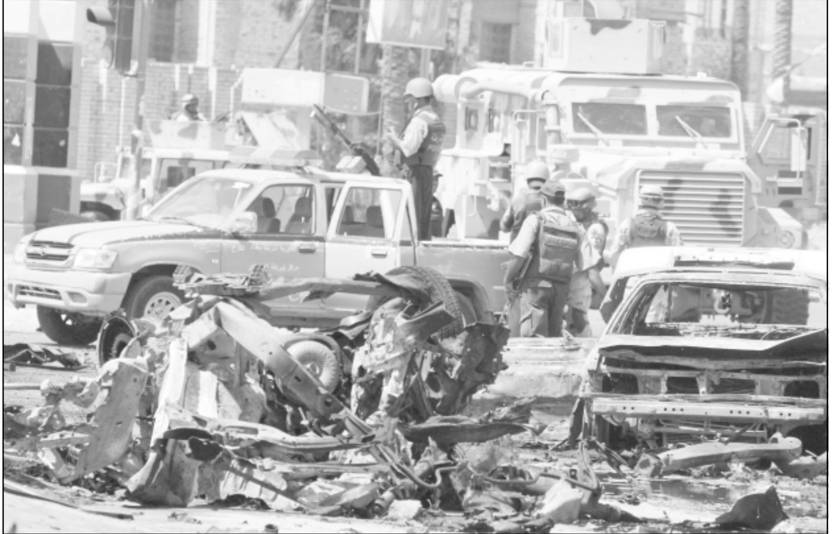
موقع انفجار سيارتين في وسط بغداد امس

وقد عبر د. عبد المعطي بيومي رئيس لجنة العقيدة بجمع البحوث الاسلامية عن رفضه لما ذهب اليه مجلس القضاء السعودي وذلك لانه يناقش للشعر، وقال في تصريحات خاصة لهالقدس العربي، ان دعوة الجلس المسلمين في مصر جميع أنحاء العالم لاجتماع السعودية في الصوم والافطار لا يمكن الأخذ بها وذلك لان الشرع أباح لكل مسلم ان يصوم ويفطر وفقا لوجهة نظر بلاده. وأضاف بأنه لا ينبغي الأخذ بالرأي السعودي وذلك لان الرؤية الشرعية تأخذ في حساباتها الرؤية العلمية والقائمة على الأخذ بوجهو العلم. وأشار الى ان اقتصار السعودية على الرؤية المصرية لا يمكن الأخذ به. وفي ذات السياق دعا المفكر جمال البنا للأخذ برأي العلم مع الاسلوب التقليدي في آن واحد موافقا بذلك على رأي بيومي الداعي السعودية لان تنزل عند رأي العلماء الذين يطالبون بأن يكون للعلماء الفلكيين في هذا الشأن الكلمة العليا. وطلب البنا عدم استخدام هلال رمضان في اي صراع سياسي او خلاف حول اي من القضايا الدينية. وعبر العديد من المراقبين عن شكهم في ان تستخدم السعودية نفس القضية