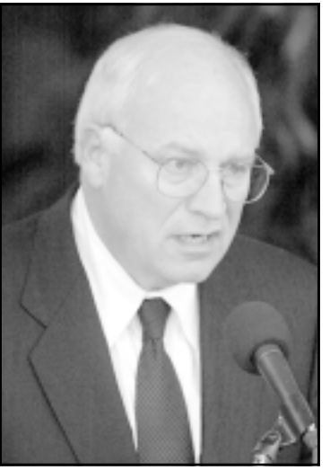
نائب الرئيس الأمريكي ديك شيني

المالية ونائب رئيس الوزراء زياد فريز. وقتها قالت الحكومة علنا للمواطنين ان الأسعار قد ترتفع مطلع العام المقبل 2007 مما يعني تأجيل الإستحقاق الأصعب على امل ان يحصل على ما، إما على صعيد هبوط