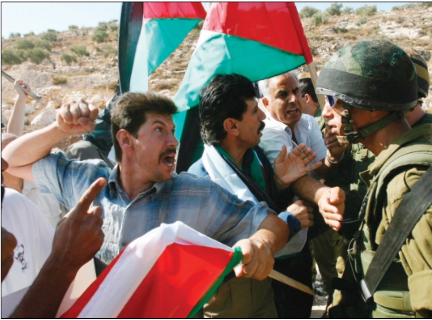
فلسطيني يصرخ ويرفع قبضته بوجه جندي اسراييلي اثناء مظاهرة احتجاجا على مصادرة اراض فلسطينية لفتح طرق تربط المستوطنات

يكون كل الاسرائيليين في ثقة بان امريكا تدعمهم بشكل تام، واننا ملتزمون تماما بانهم ولذلك فان باعناهم ان يتخذوا خطوات جريئة في مساعدهم للسلام».