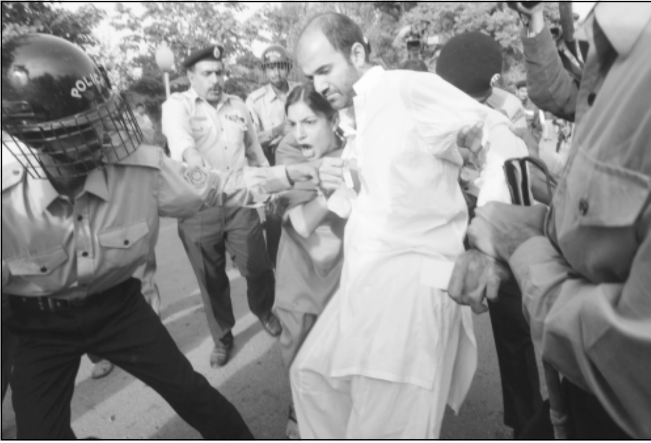
الاحتجاجات وحملات الاعتقال تعم باكستان بعد اعلان حالة الطوارئ

الجندو الي العسكري في وزيرستان الجنوبية، في اشارة الى المنطقة القبلية القريبة من حدود افغانستان حيث احتجز قائد طالبان الباكستانية بيت الله محسود الجنود يوم 30 اب (اغسطس).