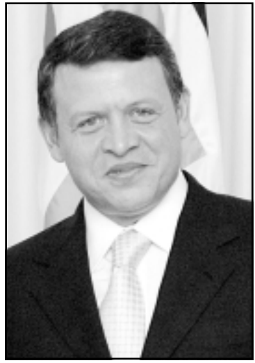
الملك عبدالله الثاني

ويوض دهاة السياسيين يقولون إلى التذكير بان الرئيس البخيت «أقلت» قبل أشهر فقط من قرار قطعي بتغيير الحكومة بعد ان خدمته الظروف وطالب التيارات الإسلامية بإقصائه فطال عمر وزارته، وهؤلاء يعتقدون ان البخيت أظهر خبرة واسعة وذكاء وحدا وقدرة على تدوير الظروف لصالح بقاء وزارته لأطول فترة ممكنة.