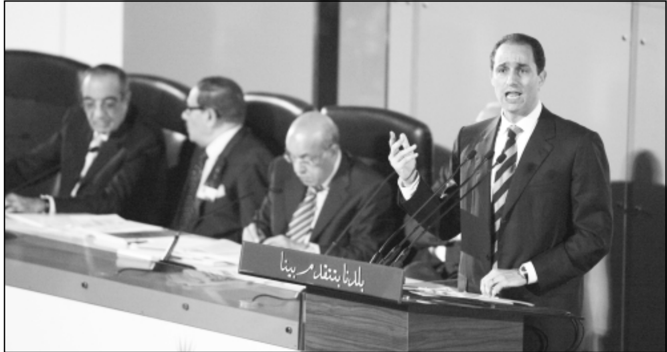
جمال مبارك يتحدث أمام المؤتمر العام للحزب الوطني بالقاهرة أمس

ونفى مبارك، الذي سيلعب الثماني من عمره في ايار (مايو) المقبل، دوما رغبته في توريث الحكم على عمر غرا