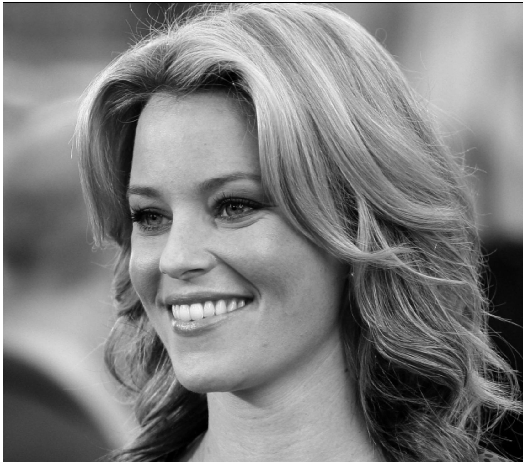
النجبة السينمائية اليزابيث بانكس حضرت حفل العرض الاول لفيلمها «فريد كلاوس» في هوليوود (كاليفورنيا)

بكين - يو بي أي: لم تشأ امرأة صينية بلغت عاهاها الثاني بعد الثمانين أن تبقى متخلفة عن التطورات العلمية التي يشهدها العصر الحديث، فتعلمت مؤخرا كيفية التعامل مع جهاز الكمبيوتر والتحدث مع أولادها عبر الإنترنت، ونشرت صحيفة «تشانينا دايلي» أن كسو لوبيينغ - 82 عاما - المقيمة في مدينة كسيان عاصمة مقاطعة شانكسي، لديها خمسة أولاد يعملون في هاربين عاصمة مقاطعة هيلونغ جيانغ وفي العاصمة الصينية بكين كما لديها حفيد يتابع دراسته في مدينة سيدني الأسترالية. وقالت كسو «كنت أتواصل معهم من خلال البريد والاتصالات الهاتفية الأمر الذي لم يكن مناسباً إطلاقاً»، وأضافت «لقد تعلمت مؤخرا كيفية التصفح عبر الإنترنت واستخدام برنامج التواصل المباشر، استطيع الآن سماع أصواتهم كما يمكنني رؤية وجههم».