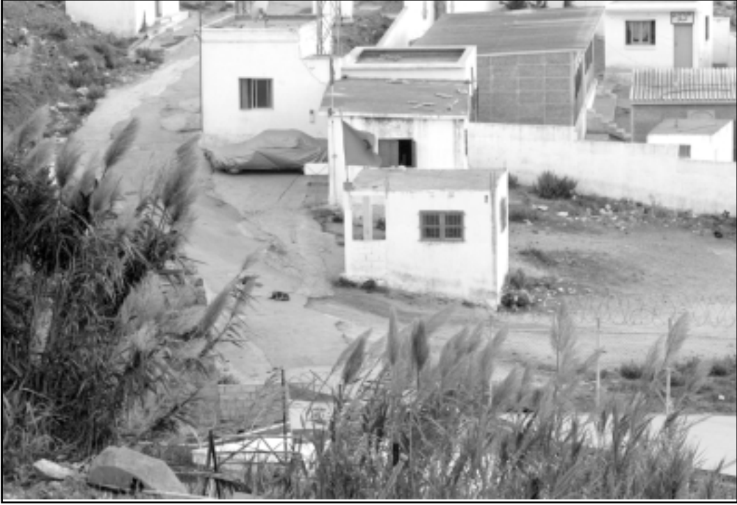
صورة من الأرشيف تظهر الحدود بين المغرب ومدينة سبتة