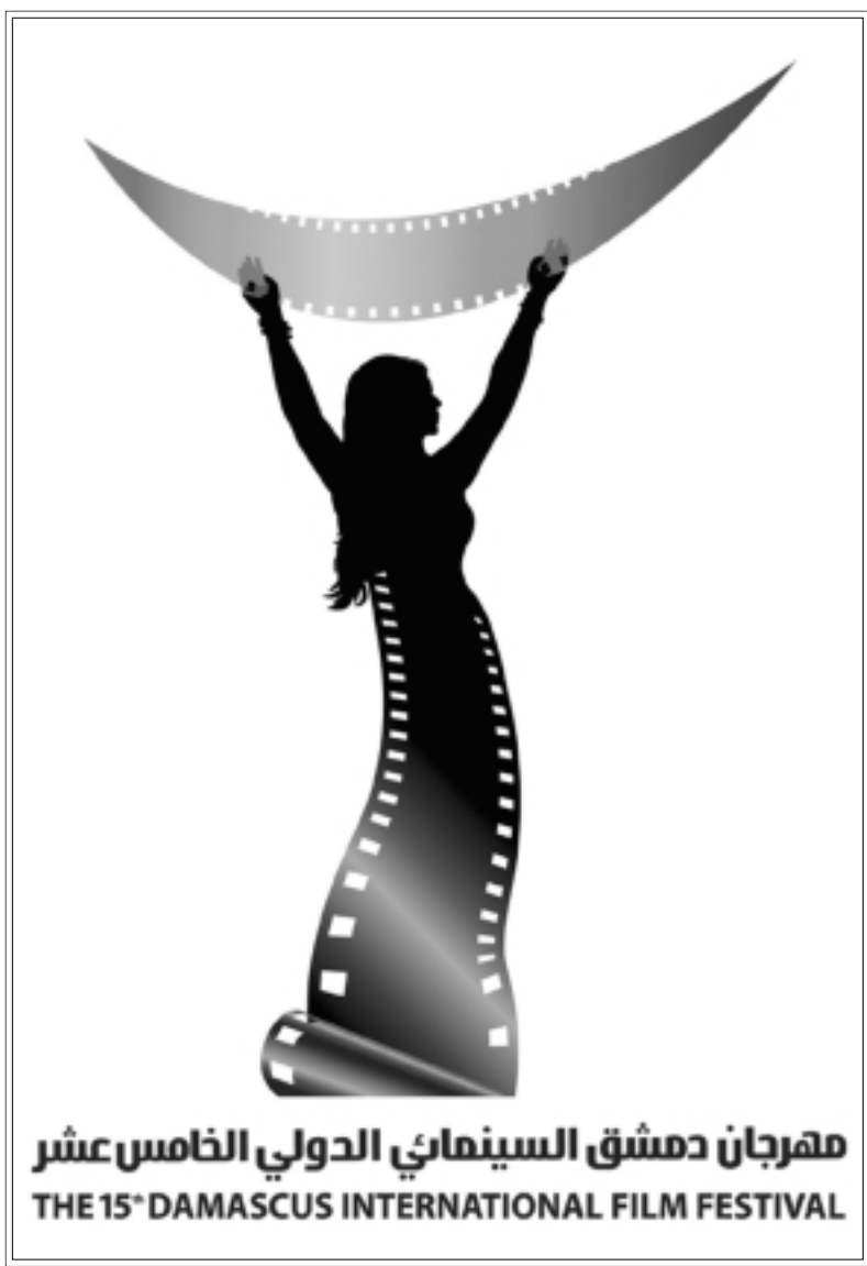
مهرجان دمشق السينمائي الدولي الخامس عشر THE 15 th DAMASCUS INTERNATIONAL FILM FESTIVAL

وقد أشار الأستاذ محمد الأحمد إلى أن هذا الفيلم وكذلك الفيلم الصيني الذي سيعرض في حفل الختام، وقد سبق له وفاز بذهبية مهرجان برلين السينمائي، سبنابعهما جمهور مهرجان دمشق السينمائي في أول عرض لهما في المنطقة العربية.