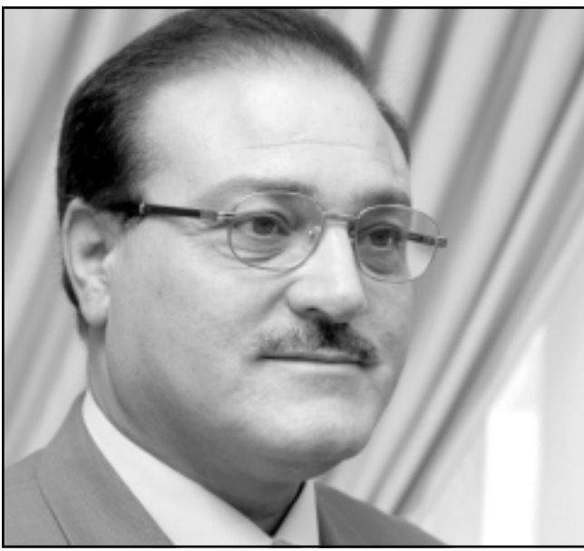
عادل الطويسي (القدس العربي)

هنا قائمة بالكتب وأسماء مؤلفيها والتي تم اعتمادها للنشر ضمن «مكتبة الأسرة الأردنية» وصدر عنها غير دقيقة أو غير كافية ولا رقابة