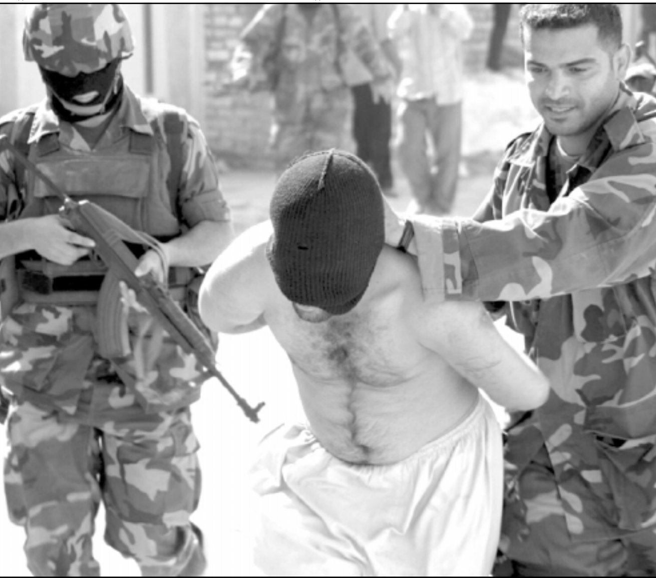
قوات امن عراقية يقودون مشتبهها به القوا القبض عليه في الديوانية أمس (1 آب)

وقدم الخطة أمس السبت وزير الخارجية الايراني منوشهر متكي في اجتماع جيران العراق في استنبول لكنها لم تحظ باهتمام كبير وسط الدبلوماسية الحمومة لتجنب توغل تركي في شمال العراق لتعقب متحمدين اكراد اتراك انضغابيين. وقالت وكالة انباء الجمهورية الاسلامية الايرانية ان متكي اقترح اجراء الاستفتاء المقرر اجراؤه بحلول 31 كانون الاول (ديسمبر) لمدة عامين. وسيقرر الاستفتاء ما اذا كانت المدينة ستدمج في منطقة كردستان العراق التي تتمتع بحكم شبه ذاتي. وقال مسؤول ايراني على دراية بالخطة ان طهران تعتقد ان بغداد تواجه بالفعل