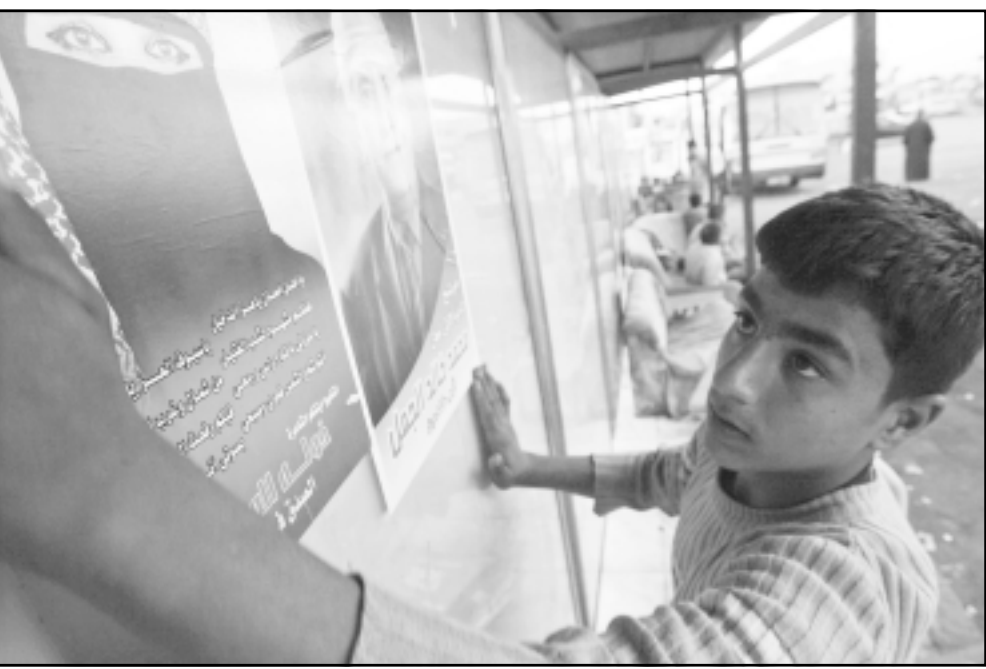
طفل اردني امام ملصق لاحدى المرشحات في الانتخابات الاردنية

الحمارنة وهو ليربالي شهير نجح فيما يبدو في نقل الاوضاع السياسية والاعلامية من دائرة الحيثان في العاصمة عمان الى مدينته الوادعة مادبا والتي كانت الانتخابات فيها ذات طبيعة عشائرية وتقليدية، لكن الحمارنة يبدد الصمت في هذه المدينة و يصر على تبني شعار يرفض ذهنية «القطيع» كما يقول وهو يؤشر على الانحياز القبلي مطالبا بالاصوات والتأييد كمرشح يمثل ليس فقط الوحدة الوطنية ولكن المواطنين جميعا وبصرف النظر عن الاصل والنسب ومكان السكن والدين.