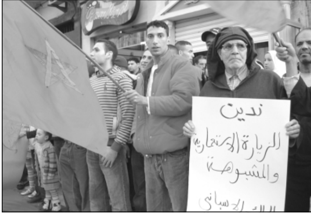
المئات يتظاهرون امام القنصلية الاسبانية في تطوان (القدس العربي)

الرباط - «القدس العربي» - من محمود معروف: