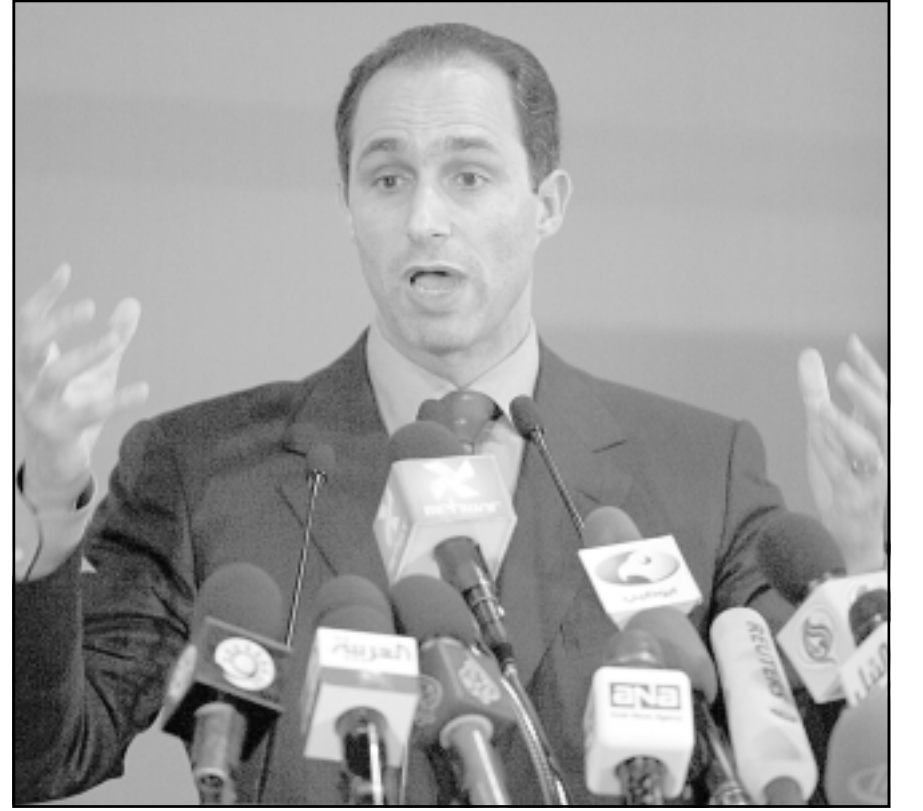
جمال مبارك في مؤتمر صحفي

القاهرة - رويترز: احتفظ الحزب الوطني الديمقراطي الحاكم في مصر بالسياسي صفوت الشريف في منصب الامين العام مغلقة الباب امام شائعات بان جمال مبارك العضو القيادي في الحزب وابن الرئيس حسني مبارك قد يشغل المنصب، وظل صفوت الشريف (73 عاما) قريبا من قمة الحزب منذ تاسيسه عام 1977 وهو يشغل منصب الامين العام منذ سنة 2002، ويرأس الشريف مجلس الشورى والجلس الاعلى للصحافة وكان وزيرا للاعلام وهو