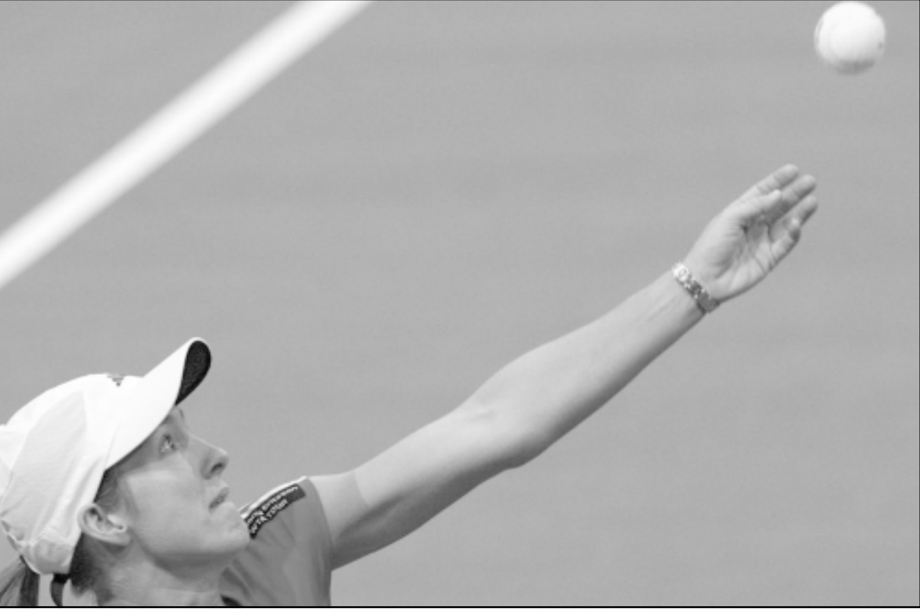
البلجيكية جوستين هيتمان تحتل المركز الاول

نجاح الفريق في تحطى عقبة غزل لحظة الاسبوع الماضي والفوز 3-1 من رفع رصيد الفريق إلى 16 نقطة محتلا المركز الرابع في جدول المسابقة خلف طلائع الجيش وبتروجيت والاهلي على الترتيب. أما حرس الحدود فيعاني من تواضع نتاجه هذا الموسم حيث يحتل الفريق المركز التاسع برصيد عشر نقاط حيث فاز في مباراتين فقط وتعادل في أربع وخسر ثلاث مباريات، ويسعى الفريق تحت قيادة مدربه طارق العشري لتحسين وضعه في جدول المسابقة بتحقيق نتيجة ايجابية امام الزمالك سواء بتحقيق الفوز أو التعادل على اقل تقدير لضمان عدم تراجع للخلف في جدول المسابقة.