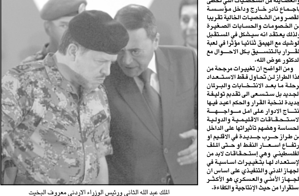
الملك عبد الله الثاني ورئيس الوزراء الاردني معروف البخيت

والتعديلات الجديدة تتعلق بتحديد ادوار الابعين الاساسيين وبعض هؤلاء في المرحلة المقبلة. وطوال ايام انشغلت اوساط سياسية واعلامية بتقييم او اجراء دراسات توقع لاتصالات تنشعبت مع او على جبهة بعض الشخصيات المهمة مثل الرئيس الاسبق للوزراء طاهر المصري والمستشار رئيس الديوان الملكي الاسبق والعضو الاردني العربي في محكمة لاهاي الدولية والمفاوض العنيد والخبير الدكتور عون الفناونه، ويبدو ان جزءاً من مشاورات التقييم وانعكاساتها في الوسط السياسي طال ايضاً شخصية من طراز رئيس الوزراء الاسبق فيصل الفايز عملاً بان المرحلة المقبلة بعد تشكيل مجلس النواب قد تشهد تغيراً جذرياً في تركيبة مجلس الاعيان مع بروز لاعبين جدد مثل المصري ومحمد الحلايقة وعبد الكريم الكباريتي لدور اضافي واكثر اهمية الذين يمكن ان يلعبوا دوراً قد ينتظم من حصة المخرم زيد الرفاعي، ويحلو لبعض الاوساط حشر اسم