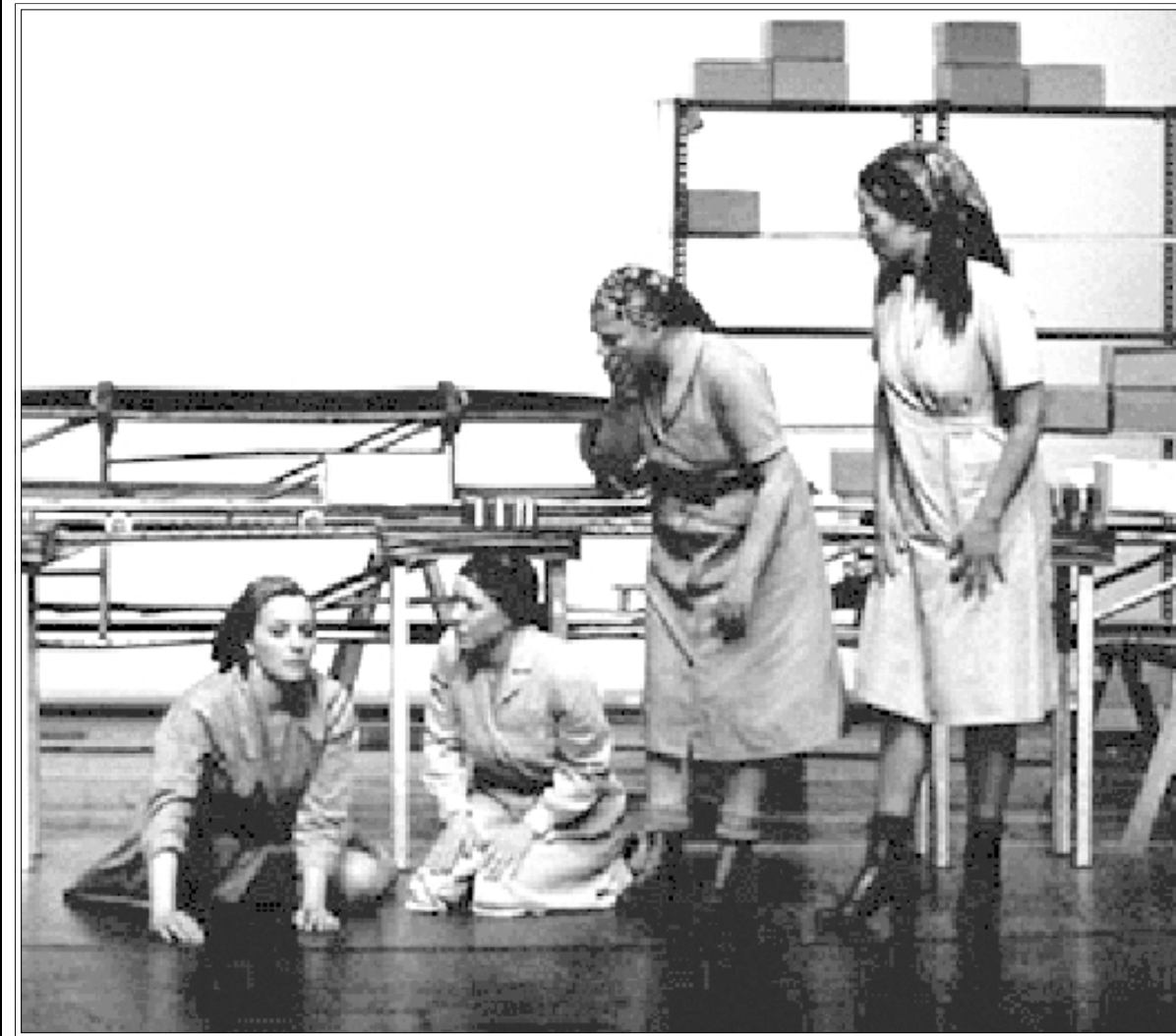
لقناتان من الفيلم

لجورج أنه كان مديناً بحريته للمخبر جرد رغم أنها لم يلتقيا ولن يلتقيا وكانت أفضل طريقة لخطره بباله ليبتكره وليعترف له بالجميل هو أن يهديه أحد أعماله الإبداعية، وقد عرف المخبر بذلك من طريق الصدفة فقط في المشهد الأخير من الفيلم.