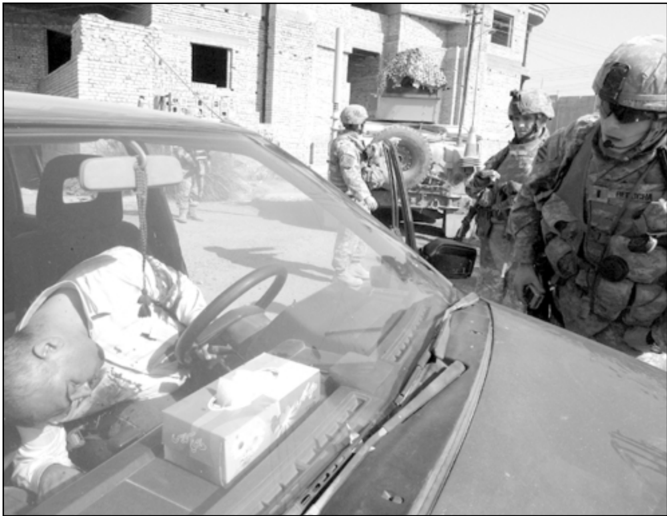
جنود امريكيون امام جثمان عراقي قتل في بغداد امس