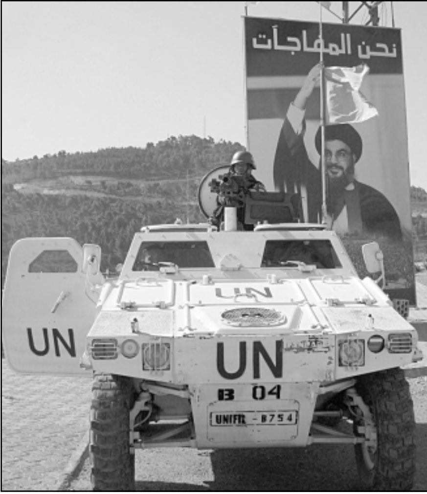
سيارة تابعة لقوات حفظ السلام في جنوب لبنان تقف امام صورة لحسن نصر الله

الاتفاق». من جهته، استغرب رئيس الحكومة فؤاد السنيورة عدم استخلاص إسرائيل العبر بعد حروبها، وقال عن مناورات «حزب الله»: «استغلنا المعلومات من قيادة الجيش وقوى الأمن الداخلي وقيادة قوات الطوارئ، حيث لم تجري مناورات على الأرض ولا أي حركة غربية أو غير معتادة لعناصر مدنية كانت أم عسكرية. حسب ما حصلنا عليه فإن ما جرى كان محاكاة على الورق داخل غرف، وهذه عمليات تحصل عادة في أي بلد في العالم، ونحن لم نلتق أي بيان من «حزب الله»، ولم يصدر أي بيان منه أصلاً بهذا الشأن. وأكد السنيورة أنه «يجب أن يكون واضحاً لدينا أن الجيش اللبناني هو المكلف بالحماية والتصدي». أما رئيس الجمهورية أميل لحود فنقل عنه قوله «إن المناورات الإسرائيلية تهدف إلى أحداث إرباكات تؤثر لصلحة خيارات معينة تسمى دول كبرى إلى الترويج لها لخلق امر واقع جديد في المنطقة».