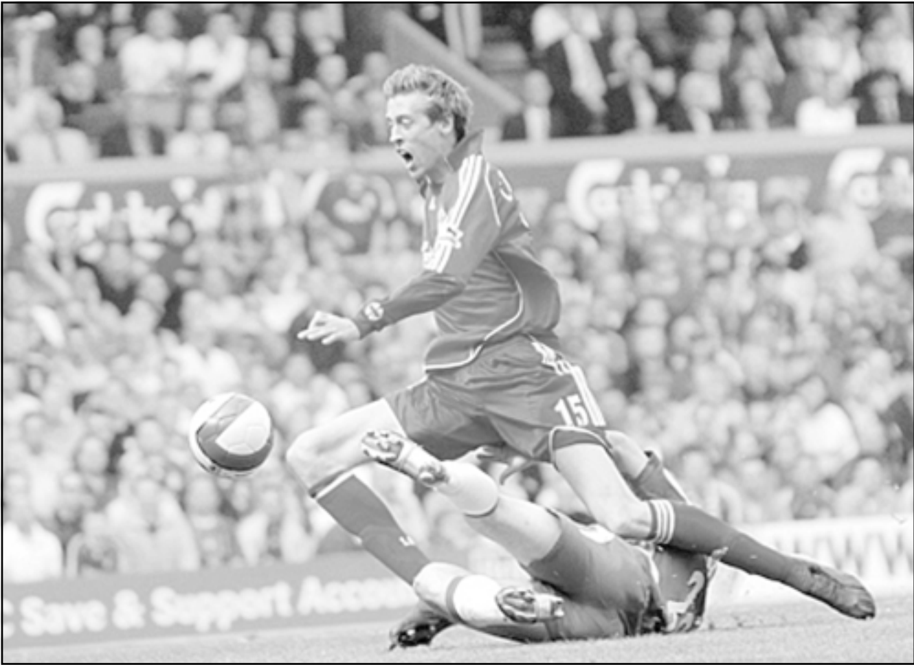
ليفربول في إحدى مبارياته

وفي المجموعة الثالثة، سيشق ريال مدريد الاسباني طريقه الى الدور المقبل في حال عاد بفوز من ميدان مضيفة اولمبياكوس اليوناني. ويتصدر ريال مدريد المجموعة بسبع نقاط امام اولمبياكوس وله 4 نقاط، وفيردر بريمن الالمني (3 نقاط) ولاتسيو الايطالي (نقطتان). وكان ريال قد فاز على اولمبياكوس 4-2 في الجولة الماضية، وهو لن يكون بعيدا عن تكرار الامر رغم ستواه الخيب في مبارياته الاخيرة حيث لقي خسارته الثانية هذا الموسم على يد اشبيلية (صفر-2)، في لقاء غاب عنه مجددا لاعب وسطه الغد الهولندي ويسلي سنايدر الذي بدأ تأثره جليا على اداء الفريق بشكل عام.