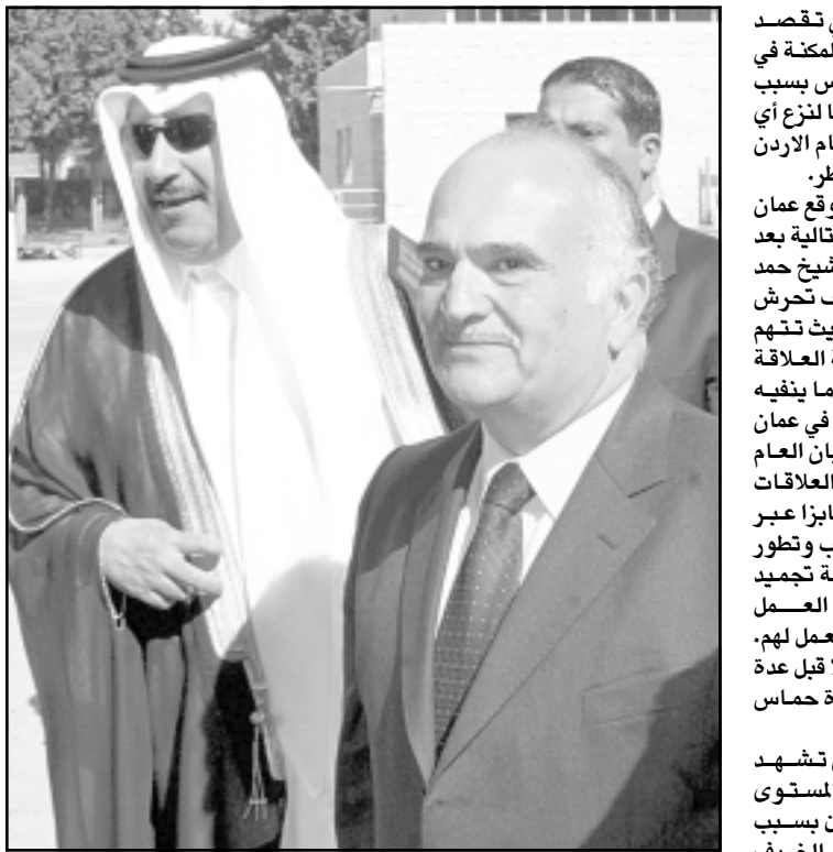
الامير الحسن مستقبلا وزير الخارجية القطري الشيخ حمد بن جاسم الثاني

القياس الاردني تعرف اهمية الدور الذي يمكن ان تلعبه عمان بعد لقاء السلام الدولي مما يرجح حسب اوساط دبلوماسية في الدوحة و عمان وجود قوى دافعة على الاغلب ضغطت على العاصمتين لاجتناب القطيعة السياسية والاعلامية والدبلوماسية عمليا الى حد كبير. والاوضح ان عمان تصعدت المبالغة في اظهار الاحرام والتقدير لابرز لاعب في الساحة القطرية، فقد حظي الرجل بمقابلة سريعة مع الملك عبد الله الثاني ووصف من قبل الناطق الرسمي باسم الحكومة الاردنية ناصر جودة بأنه ضيف عزيز رغم ان جميع الاوساط المحلية كانت تستمتع للمسؤولين الاردنيين وهم يتهمون الشيخ بن جاسم بتوتير العلاقة اذوية. وزيارة الشيخ القطري جاءت مفاجئة، فقد حظي الرجل ببيانات رسمية تحتفل به وقيادة استمع الرأي العام الاردني لتصريحات كلاسيكية تتحدث عن علاقة اذوية وتاريخية وعريقة بين عمان والدوحة، كما اعتبر الناطق جودة ان الخلافات بين البلدين مرحلة مرت وتجاوزتها مكثرنا من اطلاق التصريحات الدبلوماسية في مثل هذه الحالات. ويبلغ سياسي اردني مطلع «القدس