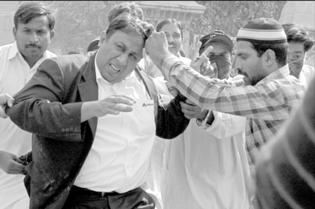
الشرطة الباكستانية تعتدي بالضرب على محام خلال تظاهرة للمحامين في اسلام اباد

ومع تكاثر الدعوات للعودة الى المسار الديمقراطي في البلاد قال نائب وزير الاعلام طارق عظيم لوكالة فرانس برس ان الرئيس مشرف وعبد الحكمة العليا بانه سيخلى عن منصبه العسكري قبل ان يؤدي اليمين الدستورية لكن الان سيبسب فرض حال الطوارئ، هذه المسألة لم تعد قائمة». واعلن مشرف في ايلول (سبتمبر) انه سيخلى عن منصبه العسكري قبل ان يؤدي اليمين الدستورية لولاية ثانية اثر فوزه في الانتخابات الرئاسية التي جرت في 6 تشرين الاول (أكتوبر). وتعددت رئيسة الوزراء الباكستانية السابقة بنازير بوتو التي كانت تتفاوض على تقاسم السلطة مع مشرف بد الانقلاب الثاني الذي قام به مشرف بعد الانقلاب الابيض الذي تسلم اذرة السلطة في تشرين الاول (أكتوبر) 1999. لكنها لم تستبعد التوصل الى اتفاق معه اذا «عاد العمل بالدستور ونظم انتخابات حرة ونزيهة وعادلة».