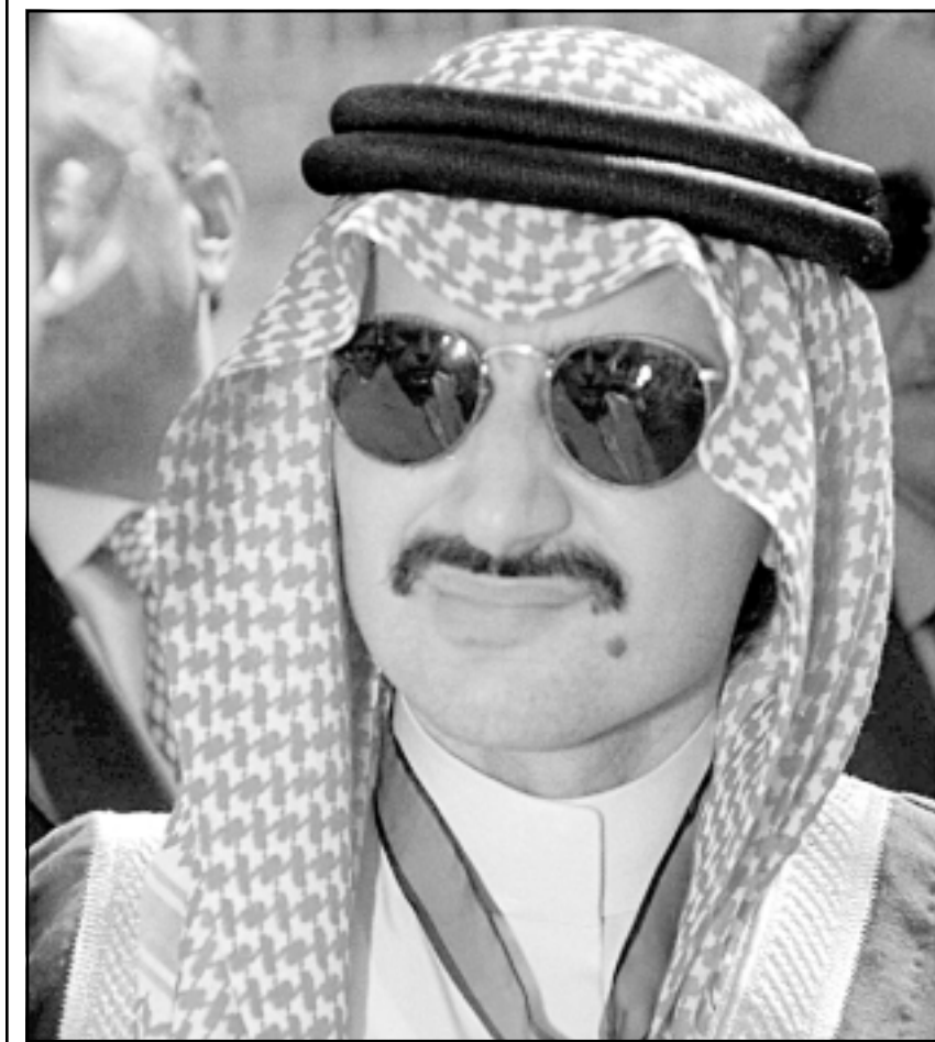
الامير الوليد بن طلال

سحب تأييده له يوم الخميس الماضي بعدما أصبح من الواضح ان المجموعة ستلجأ إلى شطب مبلغ ضخم من قيمة أصولها. ورفضت فلاني التعليق على تقرير سي.ان.بي.سي. ان ويل الذي جعل من سيتي غروب أكبر البنوك الامريكية ليس مهمتا بالعودة إلى المجموعة لكنه مستعد لتقديم المساعدة.