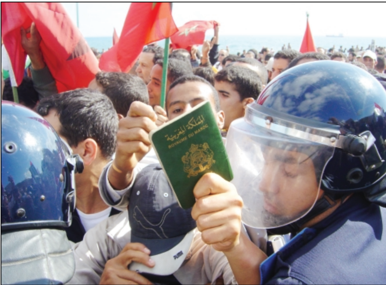
مغاربة يحاولون اقتحام النقطة الحدودية قبالة مدينة سبته «القدس العربي»